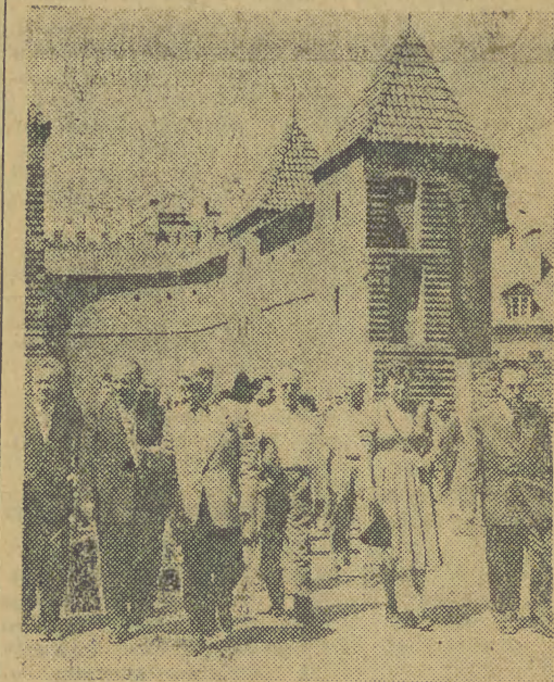
Dnia 31 maja 1956 r. przybyła do Warszawy kilkunastoosobowa delegacja Frontu Narodowego Niemiec na rozpoczęcie Tydzień Przyjaźni z Demokratycznymi Niemcami. Po przyjeździe członkowie delegacji zwiedzili miasto. Na zdjęciu: członkowie delegacji koło Barbakanu na Starym Mieście.

■ PARYŻ. Tysiące Paryżan zgromadziło się wczoraj na Polach Elizejskich, aby być świadkami wprowadzenia nowego systemu oświetlenia ulicznego. 200 wysokich kandelabrow zastąpi funkcjonujące dotychczas na Polach Elizejskich przez 100 lat latarnie gazowe.