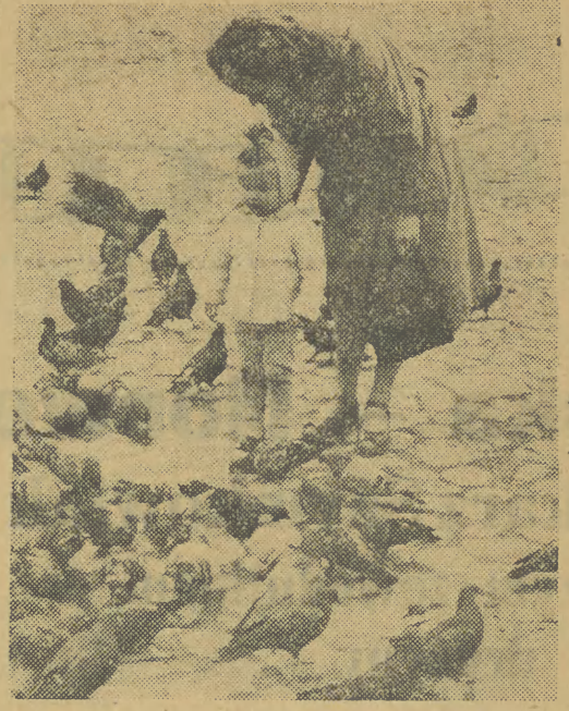
Podobnie jak w większości dzieci w naszym mieście i ta mała krakowianka wybierając się ze stąd opiekunką na spacer, nie zapomni o... gołębiach.

W związku z Międzynarodowym Dniem Dziecka — Redakcja „Echa Krakowa” organizuje błyskawiczny konkurs pt. „Poznaj Twoje Dziecko”. W ciągu sześciu dni ukazywać się będzie na łamach naszego pisma zdjęcie dziecka, które uchwycił przypadkowo obiektyw naszego fotoreportera. Kto pozna, że „uchwycona” została właśnie jego pociecha — proszony jest o zgłoszenie się do naszej Redakcji, ul. Wiślna 2, III p. (dział miejski) wraz z przekonującym dowodem... dzieckiem. Czeka tu miła niespodzianka!