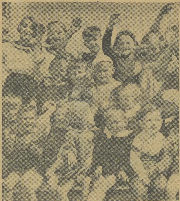
Wszystkim młodym obywatelom naszego miasta życzymy w dniu ich Święta wiele, wiele radości. Redakcja „ECHA KRAKOWA“