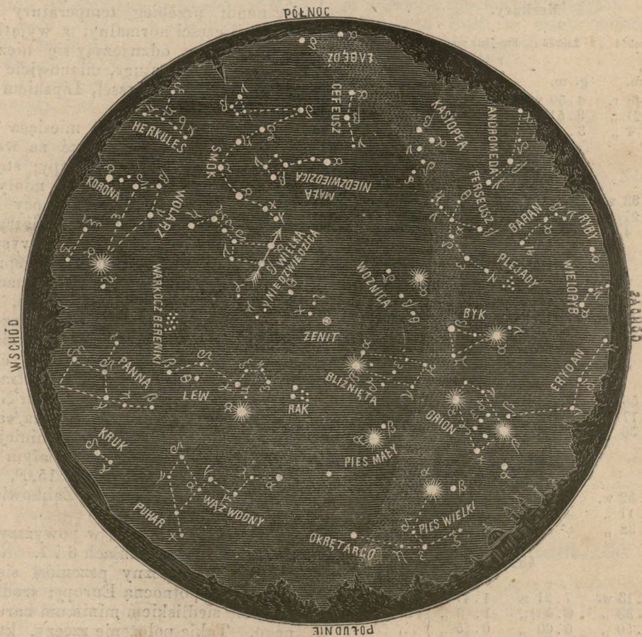
Karta nieba na miesiąc Marzec.

TYGODNIK POPULARNY, POŚWIĘCONY NAUKOM PRZYRODNICZYM.