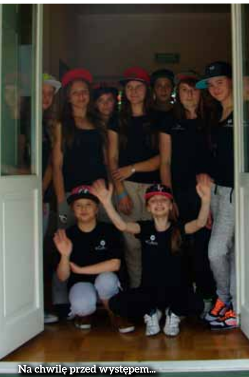
Na chwilę przed występem...