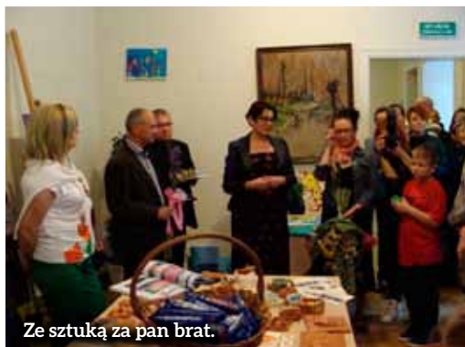
Ze sztuką za pan brat.