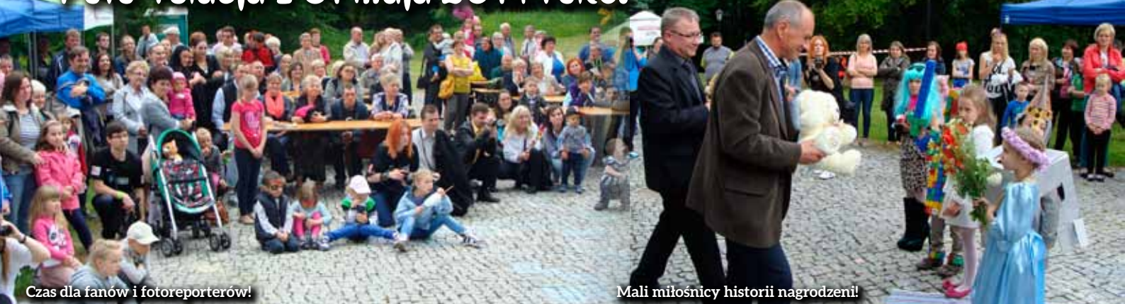
Czas dla fanów i fotoreporterów!