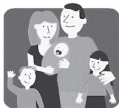
KARTA DUŻEJ RODZINY