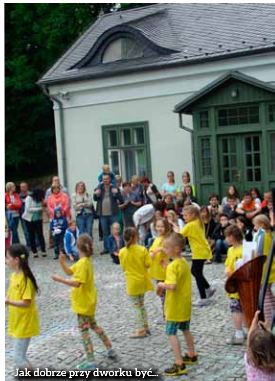
Jak dobrze przy dworku być...