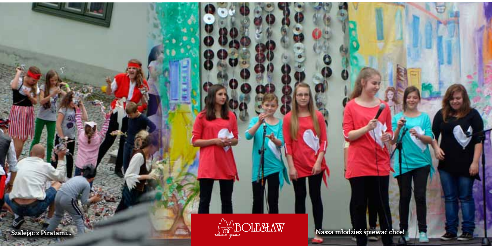
Szalejąc z Piratami...