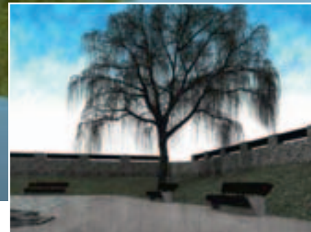
Źródło w Ryczówku – stan przed zagospodarowaniem i wizualizacja projektowa

W Ryczówku rozpoczęło się zagospodarowanie zbiornika wodnego „Źródło Stok”. Ujęcie źródła będzie wyremontowane, a w jego otoczeniu znajdą się chodniki, mała architektura i nasadzona zieleń.