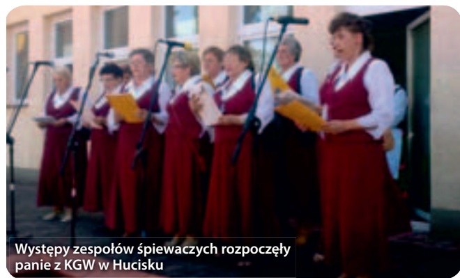
Występy zespołów śpiewaczych rozpoczęły panie z KGW w Hucisku