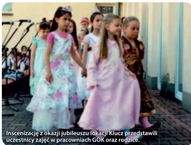
Inszenizację z okazji jubileuszu lokacji Klucz przedstawili uczestnicy zajęć w pracowniach GOK oraz rodzice.