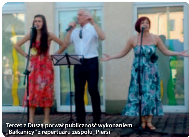
Tercet z Duszą porwał publiczność wykonaniem „Bałkanicy” z repertuaru zespołu „Piersi”