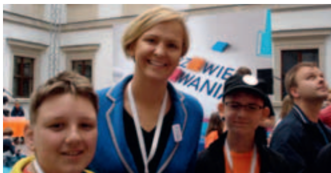
W Warszawie uczniowie spotkali Otylię Jędrzejczak