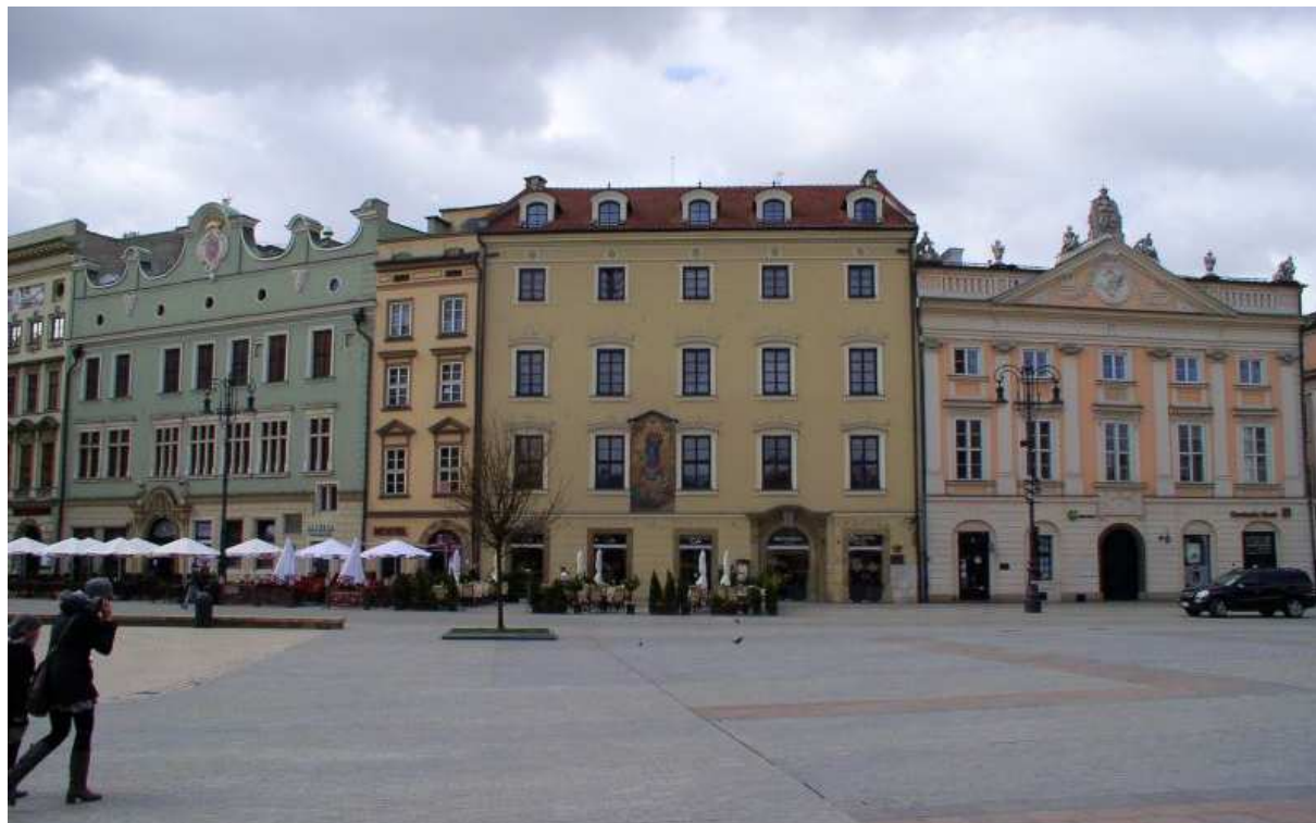
Fot. nr 94 (94-95). Odnowiony fragment południowej pierzei Rynku, o numerach: 17-20, w pobliżu ulicy Brackiej. 09.04.11