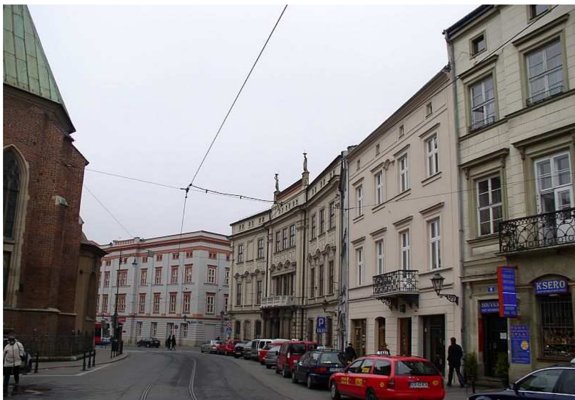
Fot. nr 107. Przedlokacyjna krzywizna ulicy Franciszkańskiej – widok z Placu Wszystkich Świętych. 04.12.09