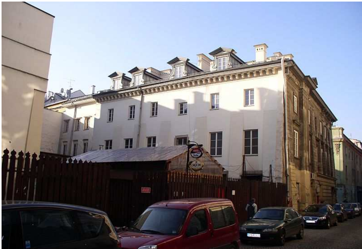
Fot. nr 157. Odnowiona już, tylna część pałacu – widok z ulicy św. Marka. 27.11.09