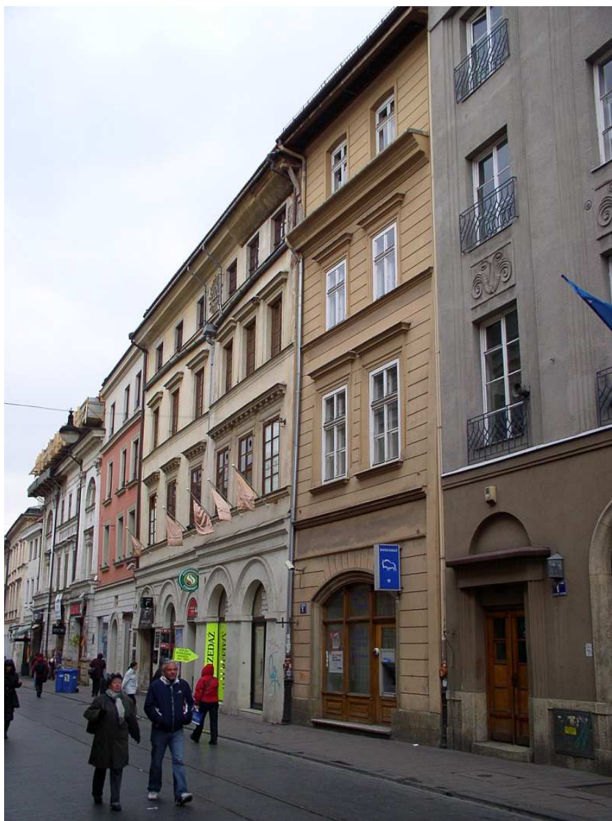
Fot. nr 143. Zabudowa ulicy Szewskiej pnie się go góry. Właśnie nadbudowano III piętra kamienic pod nr: 3 i 7. 26.11.10