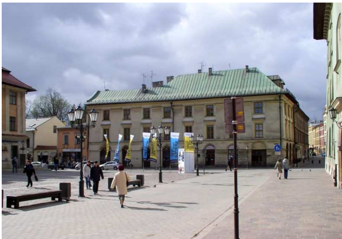
Fot. nr 211 (211-212). Południowe zamknięcie Rynku ulicą Sienną, z klasycystyczną kamienicą Domu Psalterzystów NMP pod nr 7 i ulicą Stolarską w tle. 09.04.11