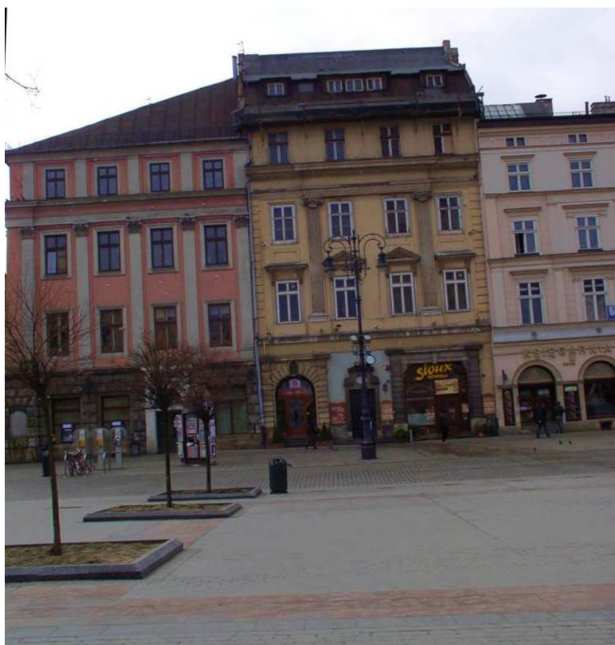
Fot. nr 89. Kamienice o numerach: 21-22. 05.02.11