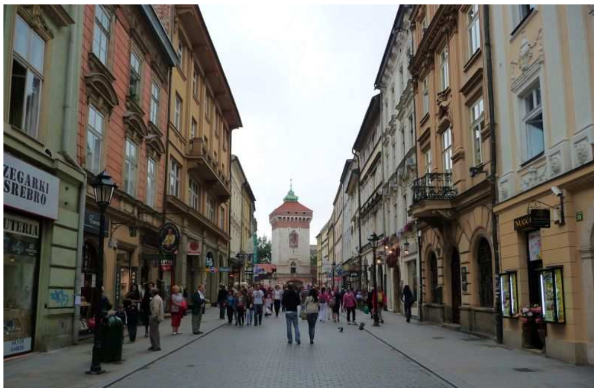
Fot. nr 35 (35-36). Ujęcia z okolic ulicy św. Tomasza. 26.07.11