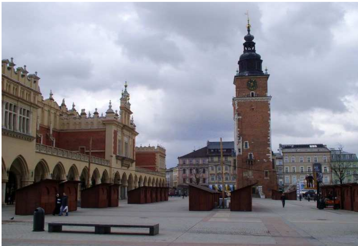
Fot. nr 76. Wieża ratuszowa na tle fragmentu południowej pierzei Rynku. 09.04.11