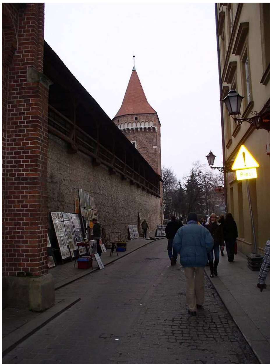
Fot. nr 28. Wzdłuż ulicy Pijarskiej. 04.12.09