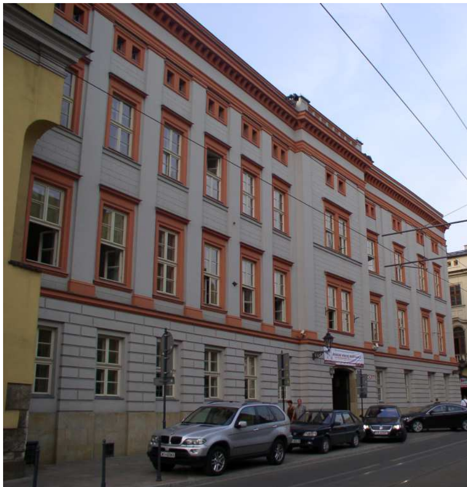
Fot. nr 109. Klasycystyczna kamienica z naroża z ulicą Bracką. 08.06.11