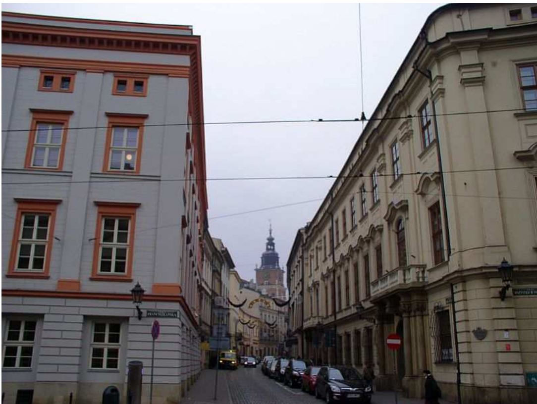
Fot. nr 116. Przedlokacyjna krzywizna ulicy. 04.12.09