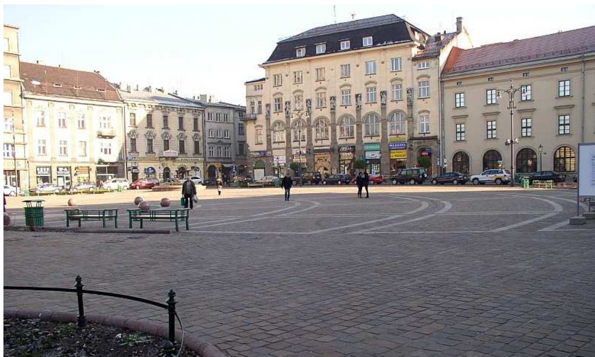
Fot. nr 147. W stronę narożnika z ulicą św. Tomasza. 26.11.10