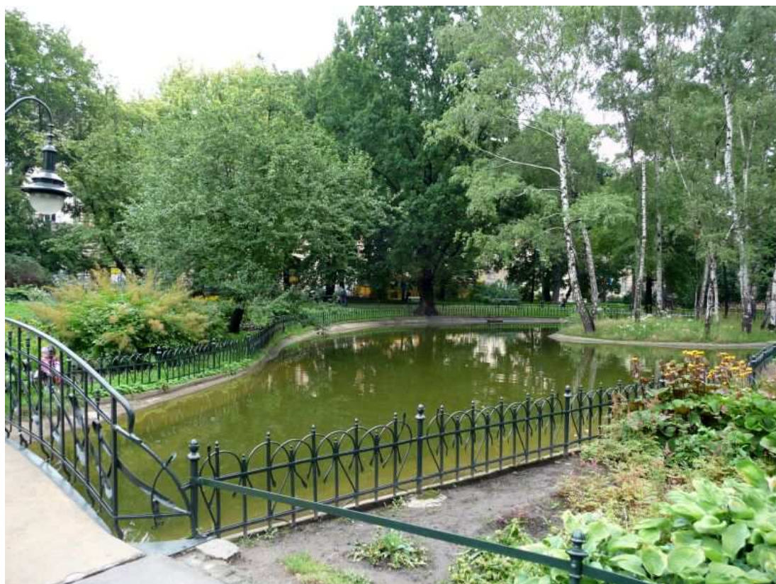
Fot. nr 5. Fragment sadzawki w małą wyspą, na której dawniej bytowały łabędzie. 26.07.11