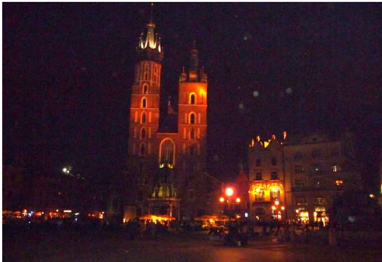
Fot. nr 52. Nocny widok z przejścia pod Sukiennicami. 28.07.11