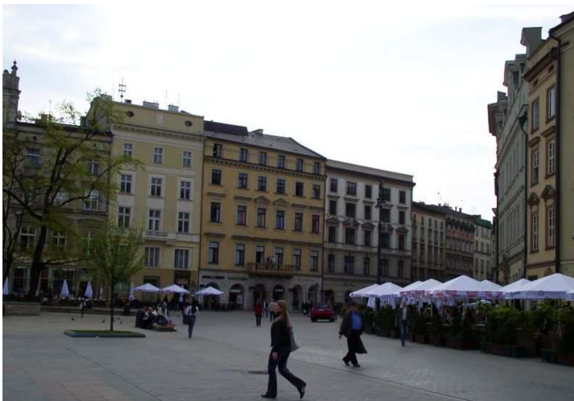
Fot. nr 101. Krańcowy fragment wschodniej pierzei Rynku (nr: 10-13). 17.04.09