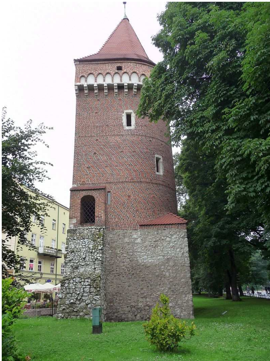
Fot. nr 23. Efektowna architektonicznie Baszta Pasamoników. 26.07.11