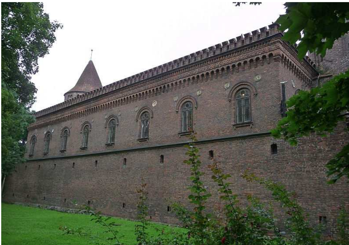
Fot. nr 9. Arsenał miejski w swej eklektycznej szacie. 26.07.11