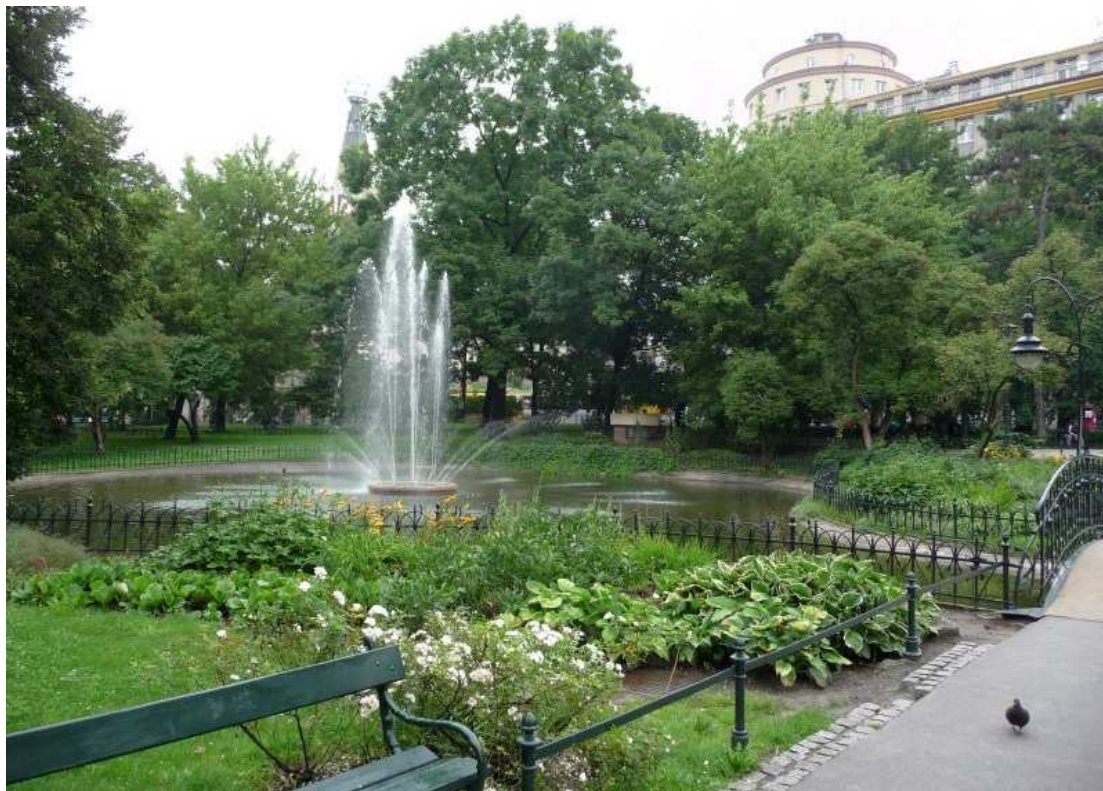
Fot. nr 4. Odtworzony wodotrysk w sąsiedztwie budynku LOT-u, który jednak nie barwi już fontanny kolorami tęczy, jak to miało miejsce pół wieku temu. 26.07.11