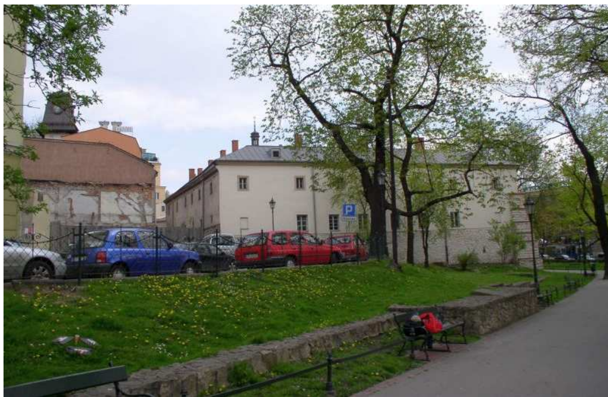
Fot. nr 190 (190-191). Gródek – widoki z ulicy Siennej. 17.04.09