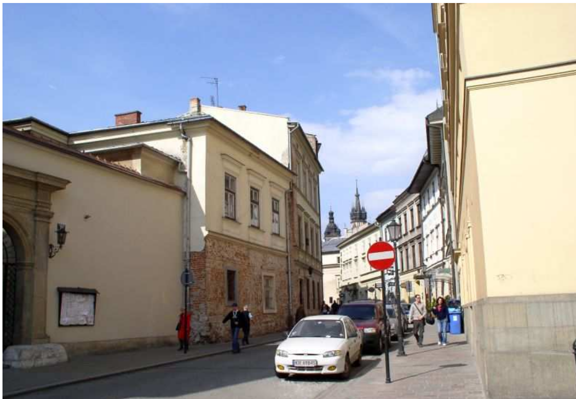
Fot. nr 180 (180-181). Przedkolacyjna krzywizna ulicy w stronę Rynku Głównego. 17.04.09