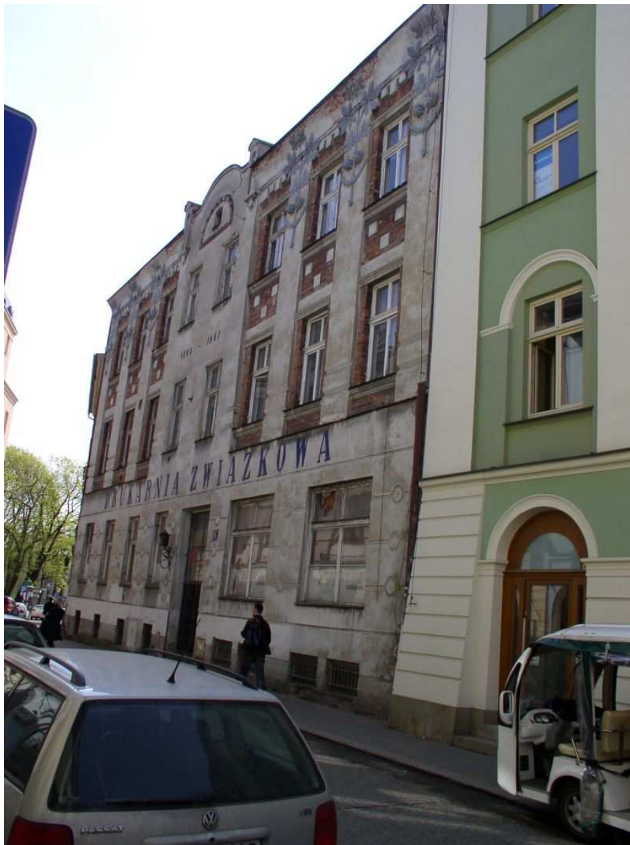
Fot. nr 182. Secesyjna Drukarnia Związkowa – stan przed remontem. 17.04.09