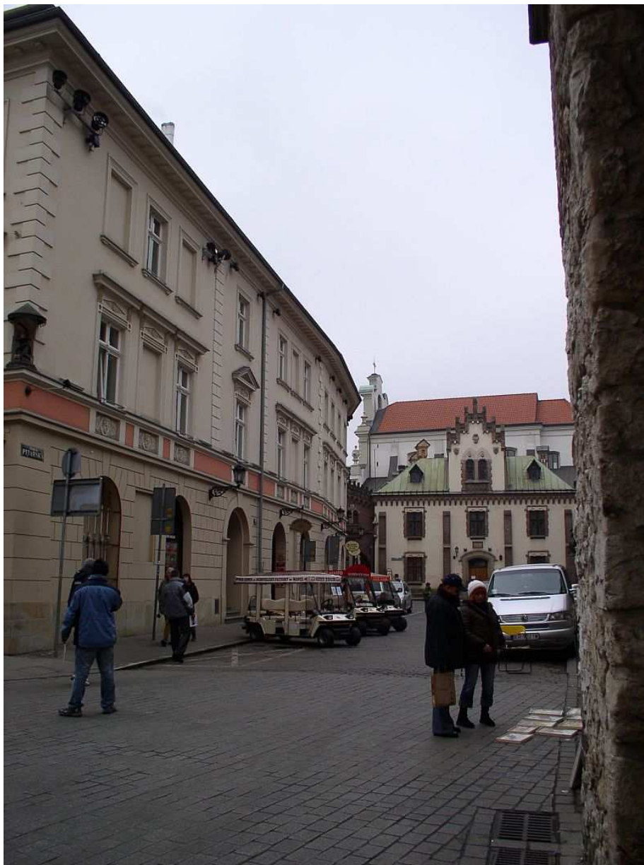
Fot. nr 30. Tzw. Klasztor, kiedyś własność zakonu Piarów, gdzie dziś część zbiorów eksponuje Muzeum Czartoryskich 04.12.09