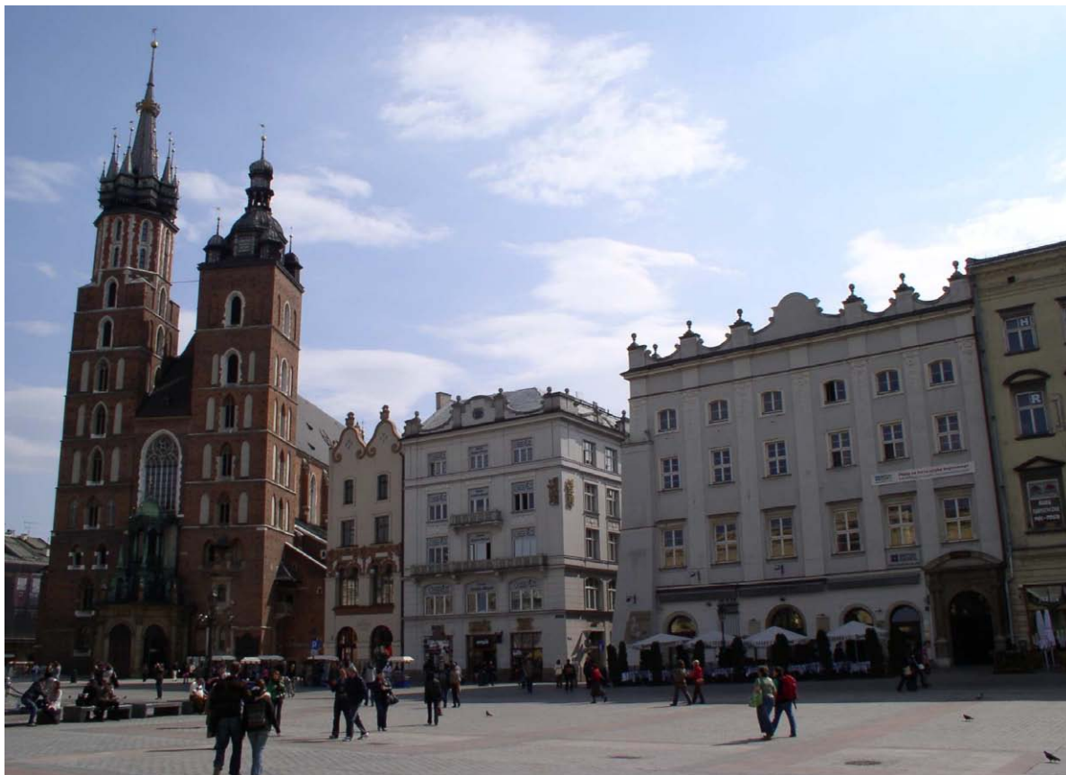
Fot. nr 64 (64-65). Fragment wschodniej pierzei Rynku. 17.04.09