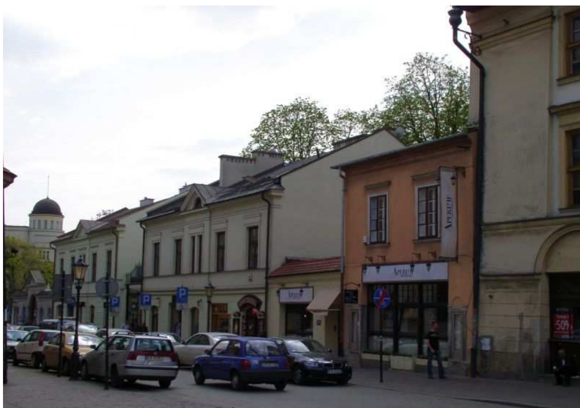
Fot. nr 200. Końcowy fragment zabudowy ulicy Siennej (nr: 9-17). 17.04.09