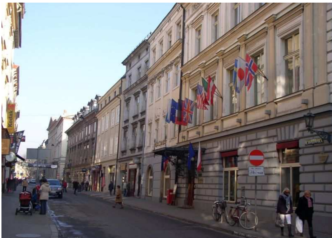
Fot. nr 158. Wschodnia pierzeja ulicy o numerach: 7-15. 27.11.09