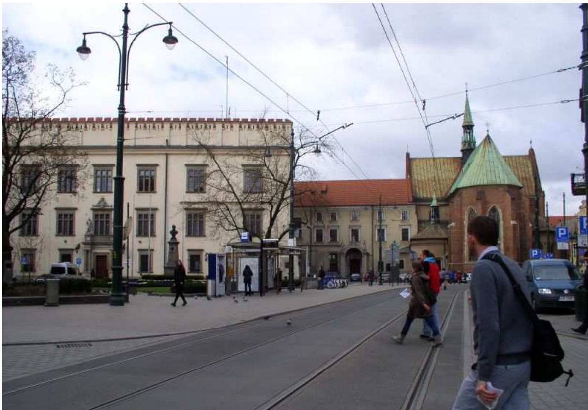
Fot. nr 104. Główne budowle placu: Pałac Wielopolskich i kościół Franciszkanów. 09.04.11