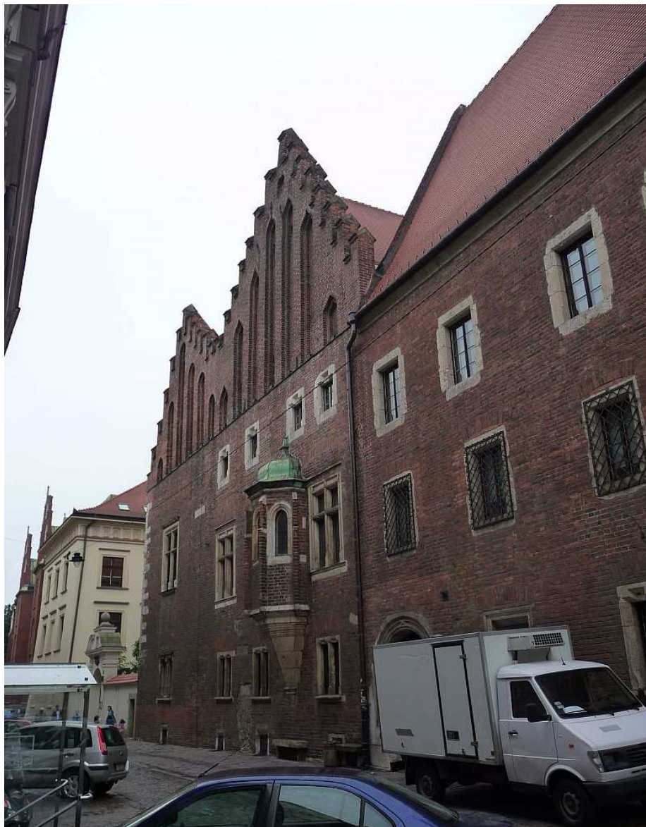
Fot. nr 128. Izba Wspólna i Libreria. 25.07.11