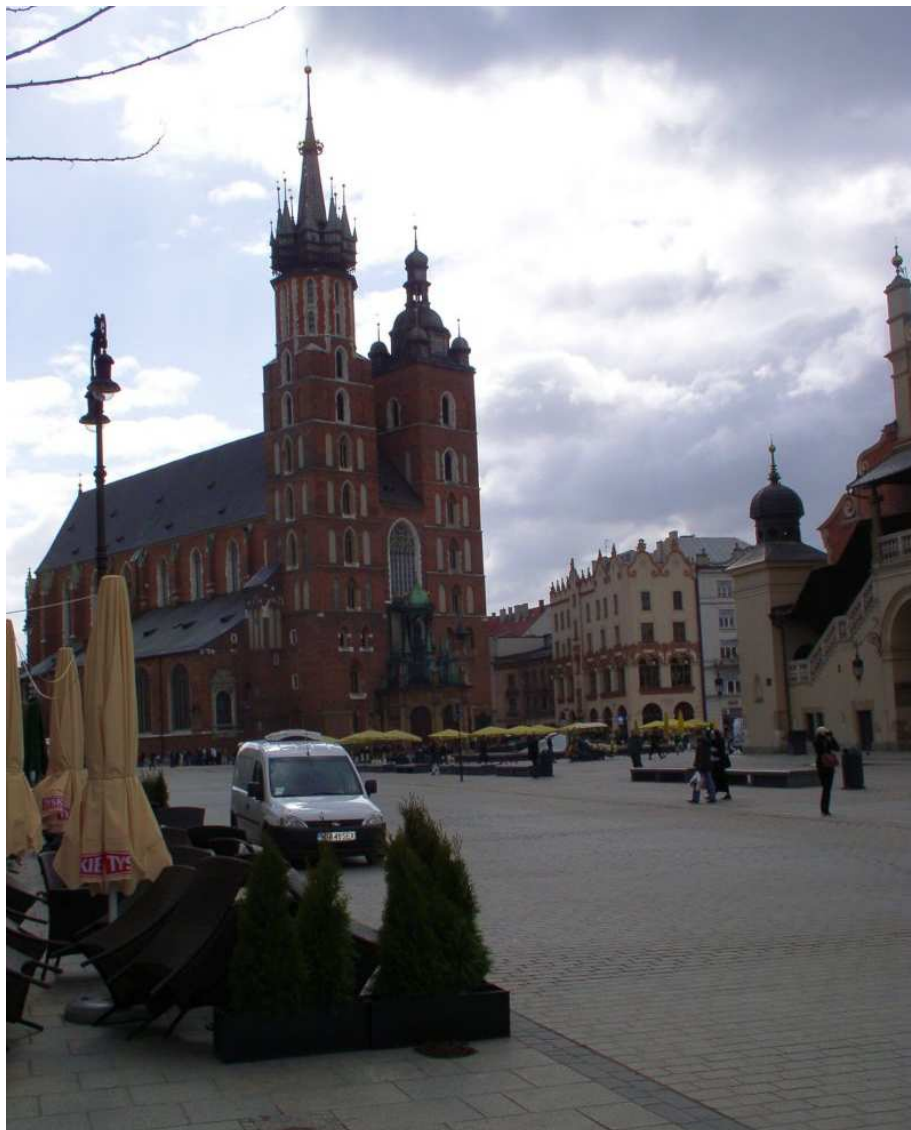
Fot. nr 51. Widok z linii A-B Rynku. 09.04.11