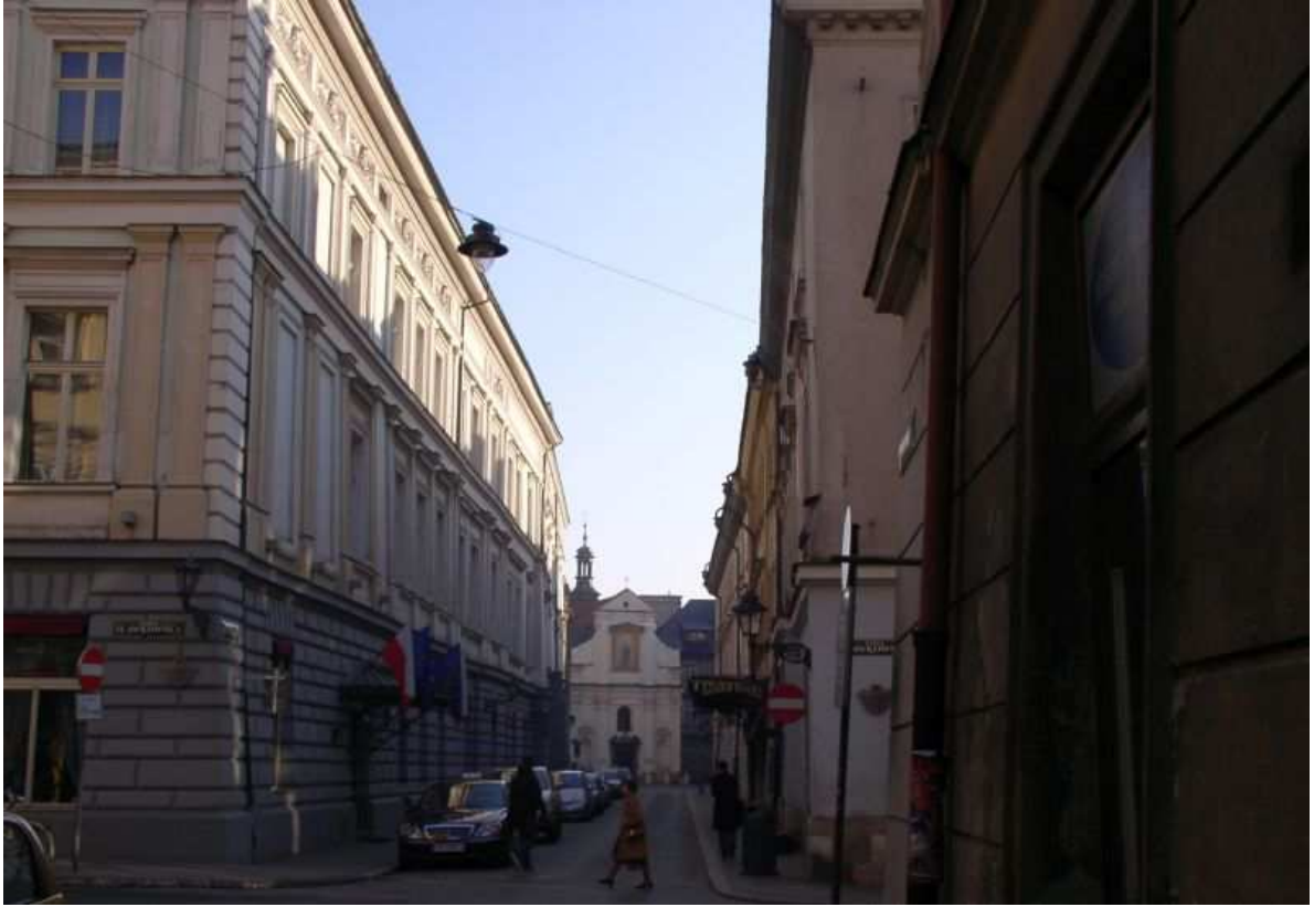
Fot. nr 162. Kościół św. Jana – widok z ulicy Sławkowskiej wzdłuż ulicy św. Tomasza. 27.11.09