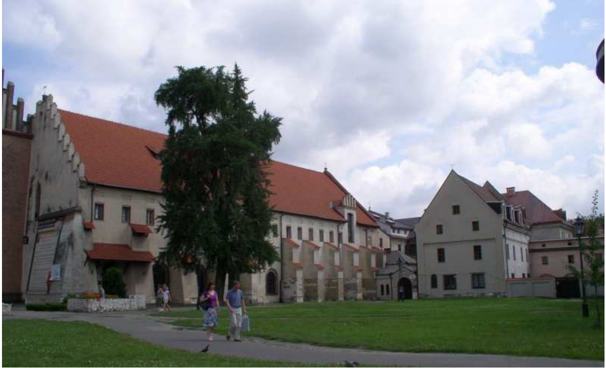
Fot. nr 114. Zespół klasztorny Franciszkanów. 06.08.09