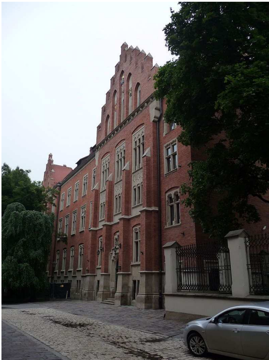
Fot. nr 138. Widok z ulicy Gołębiej. 25.07.11