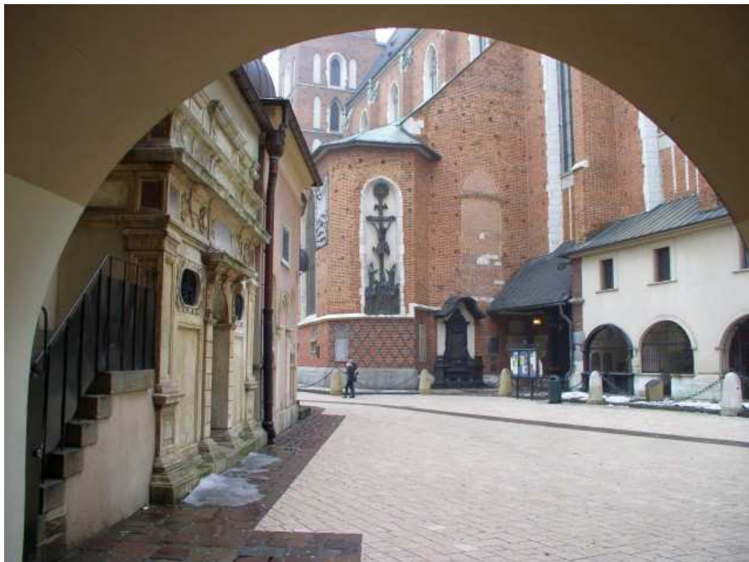
Fot. nr 224. Fragment Kościoła Mariackiego – widok z przełączki łączącej Plac Mariacki z Małym Rynkiem. 11.01.11