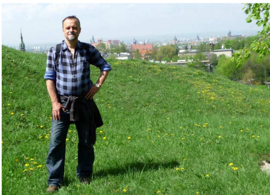
Fot. nr 1. Pod Kopcem Krakusem, z zabytkowym Śródmieściem w tle