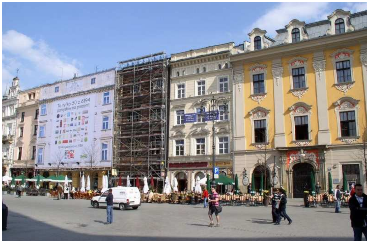
Fot. nt 58 (58-62). Fragment linii A-B Rynku Głównego pomiędzy ulicami: św. Jana i Floriańską – widoki spod Kościoła mariackiego. 17.04.09