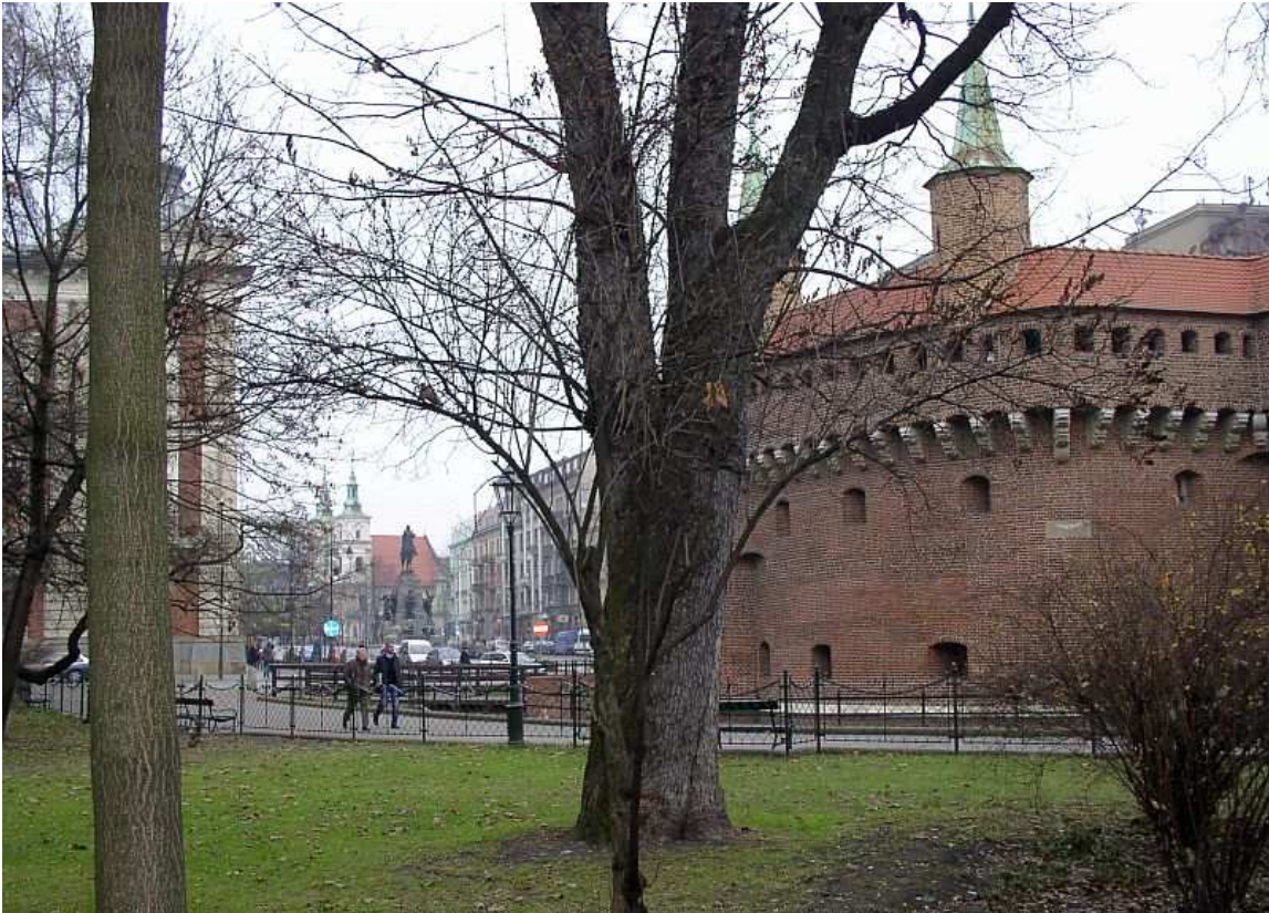
Fot. nr 13. Z Placem Matejki w tle. 04.12.09