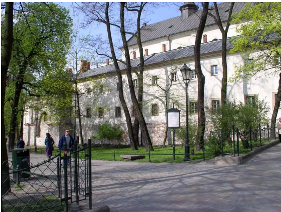
Fot. nr 186. Zabudowania klasztorne zakonu Dominikanek, których zewnętrzna strona stanowiła kiedyś mur miejski. 17.04.09