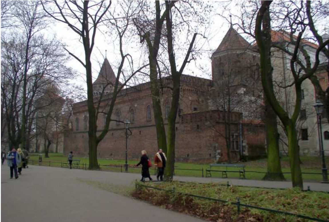
Fot. nr 8. Szczęśliwie ocalały fragment dawnych murów obronnych Krakowa. 04.12.09