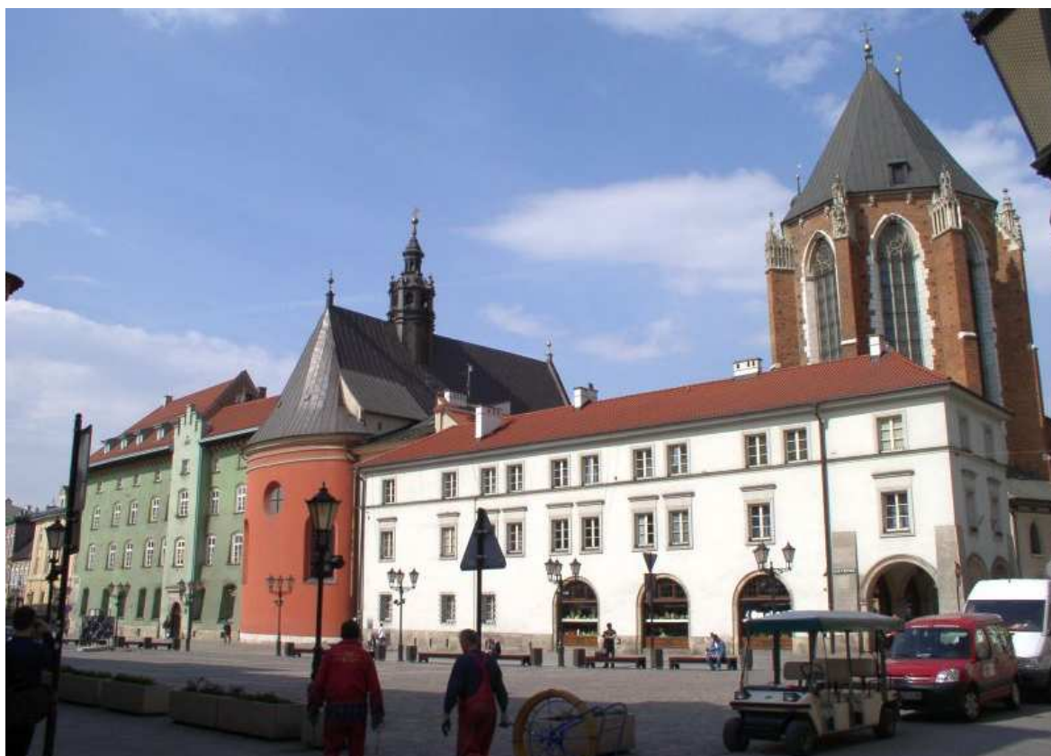
Fot. 208 (208-210). Zachodnia pierzeja – widok z ulicy Mikołajskiej. 17.04.09