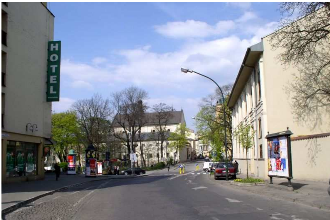
Fot. nr 178. W stronę Gródka i ulicy Mikołajskiej – widok z ulicy Kopernika. 17.04.09