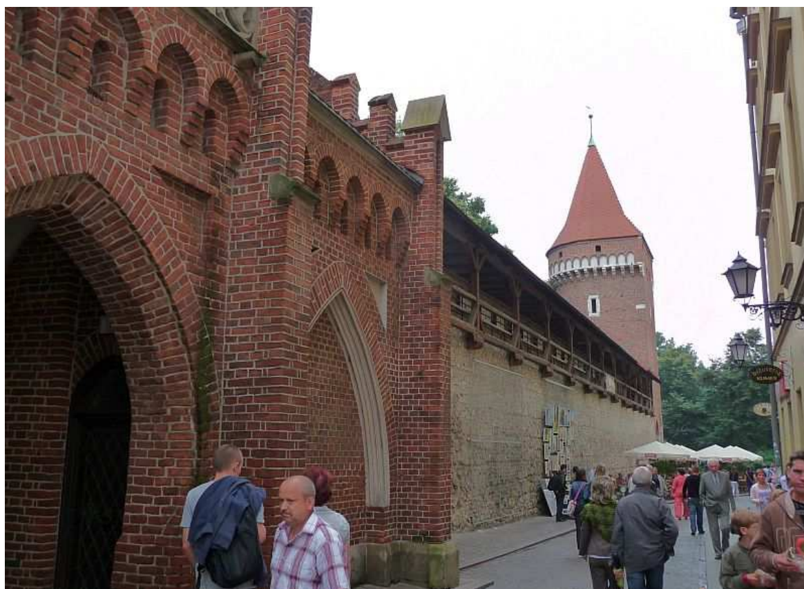
Fot. nr 27. Widok w stronę ulicy Szpitalnej, z Basztą Pasamoników w tle. 26.07.11