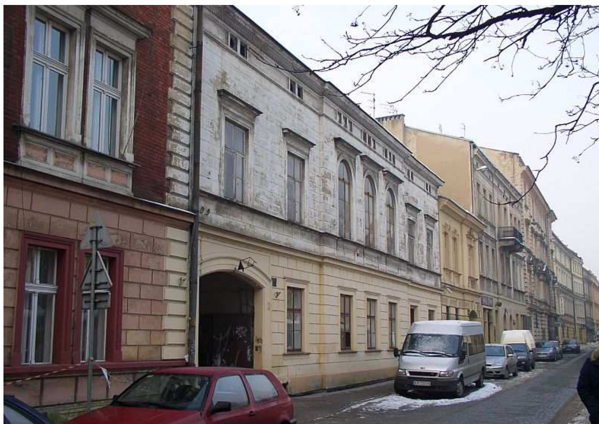
Fot. nr 171. Kamienica Zieleniewskich z ulicy św. Marka 31. 10.02.10