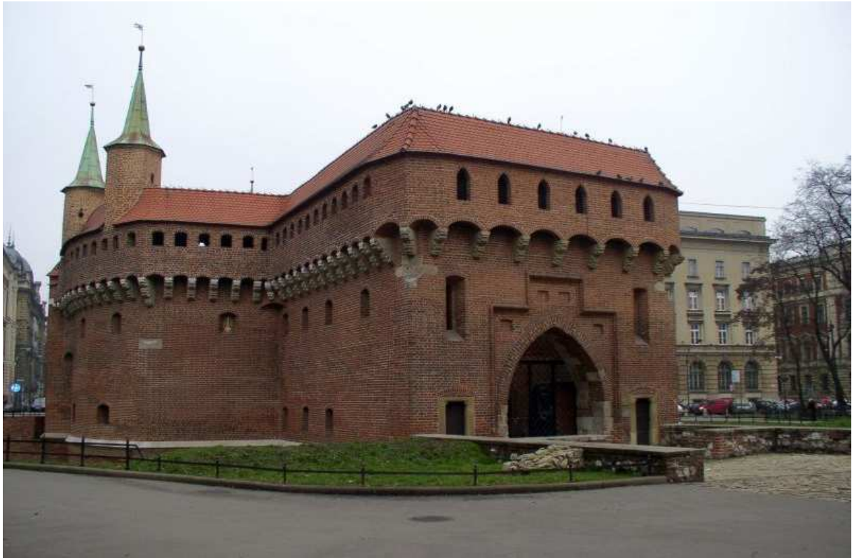
Fot. nr 15. Brama wjazdowa od strony zburzonej na początku XIX-go wieku szyi. 04.12.09