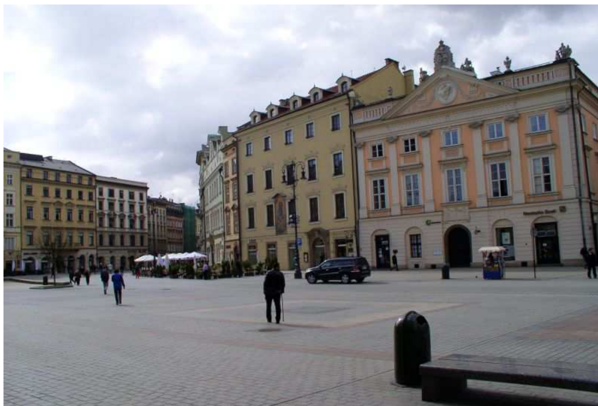
Fot. nr 93. Fragment zabudowy Rynku przy wylocie ulicy Grodzkiej. 09.04.11