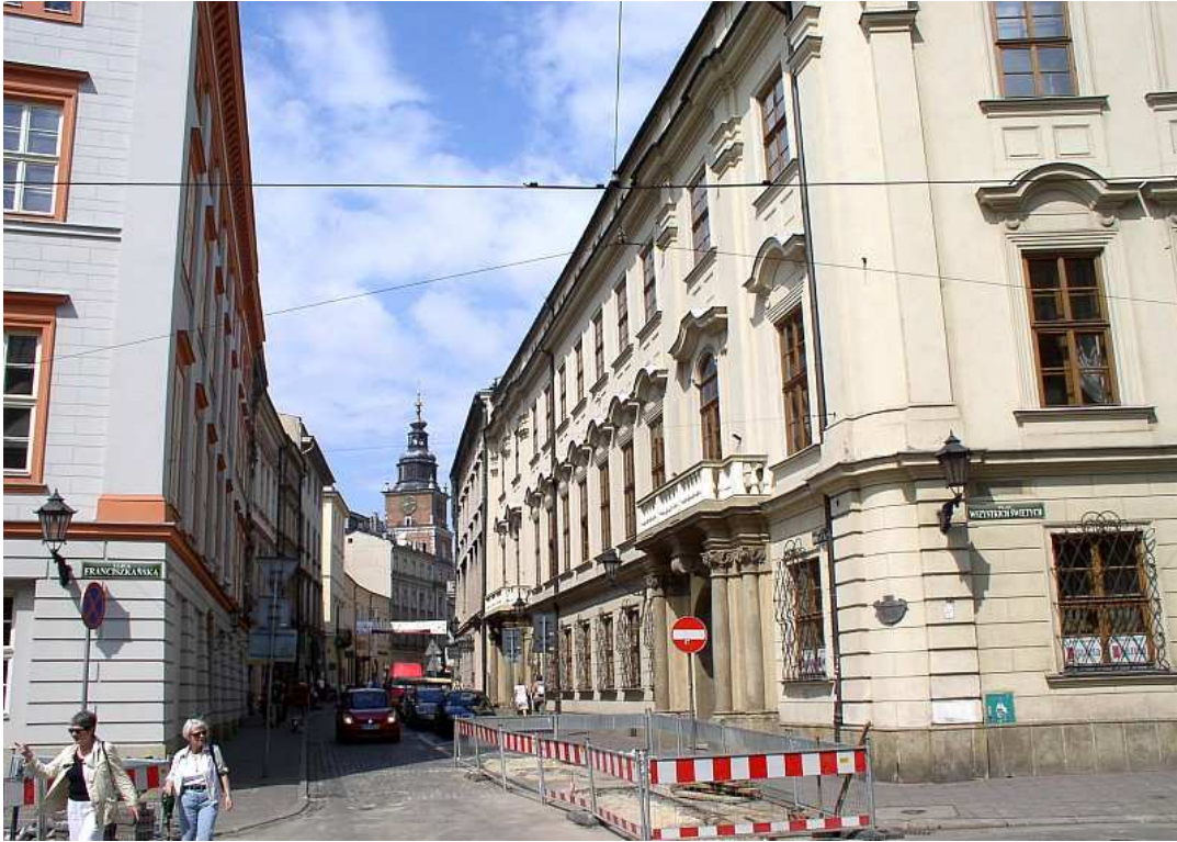
Fot. nr 115 (115-118). Widoki w stronę Rynku Głównego z wieżą ratuszową w tle. 06.08.09