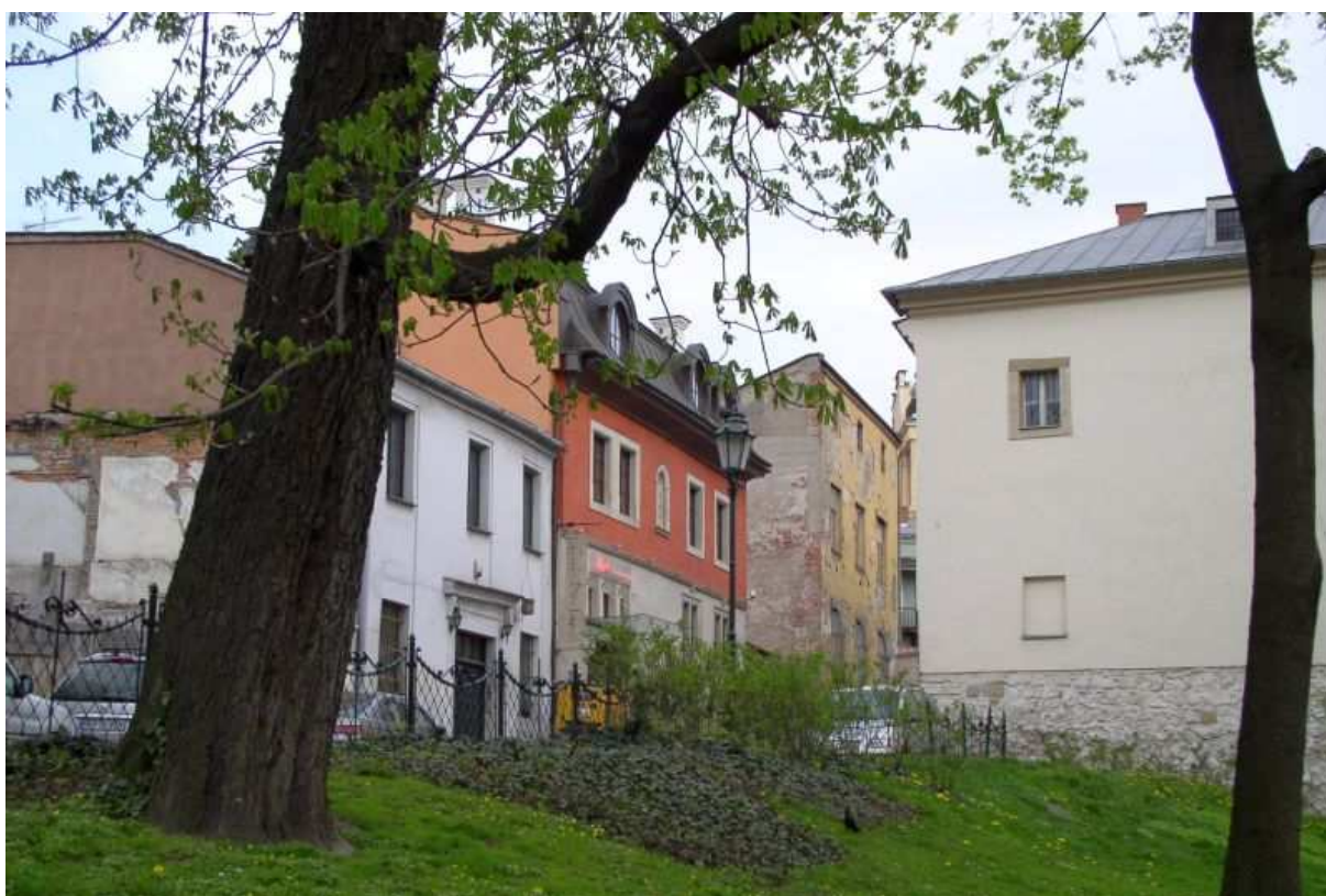
Fot. nr 192. Ulica Na Gródku. 17.04.09