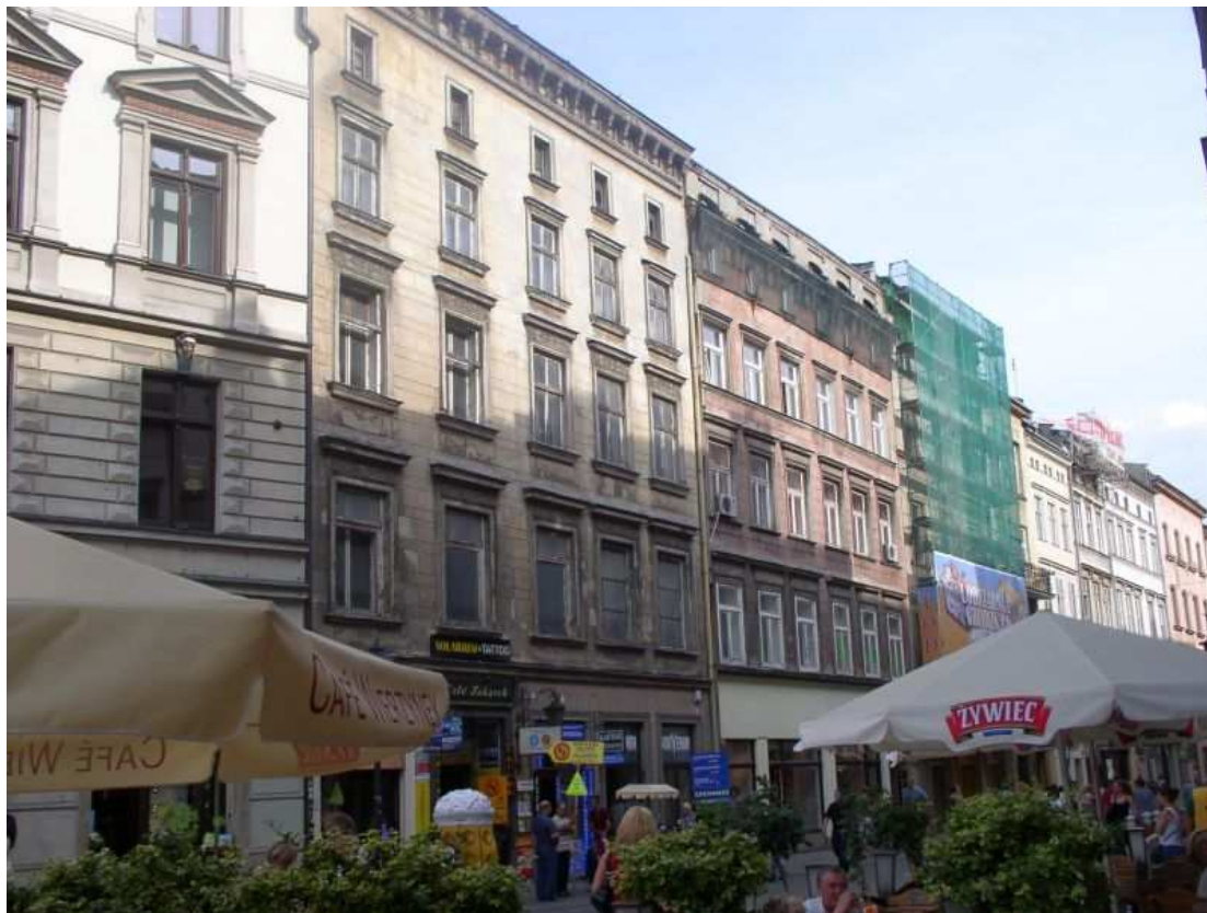
Fot. nr 102. Nieciekawy architektonicznie, początkowy fragment ulicy Grodzkiej przy wlocie do Rynku. 16.06.11