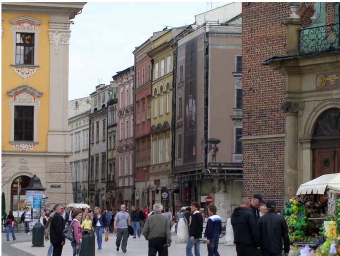
Fot. nr 49. Początek ulicy – widok spod Kościoła Mariackiego. 17.04.09