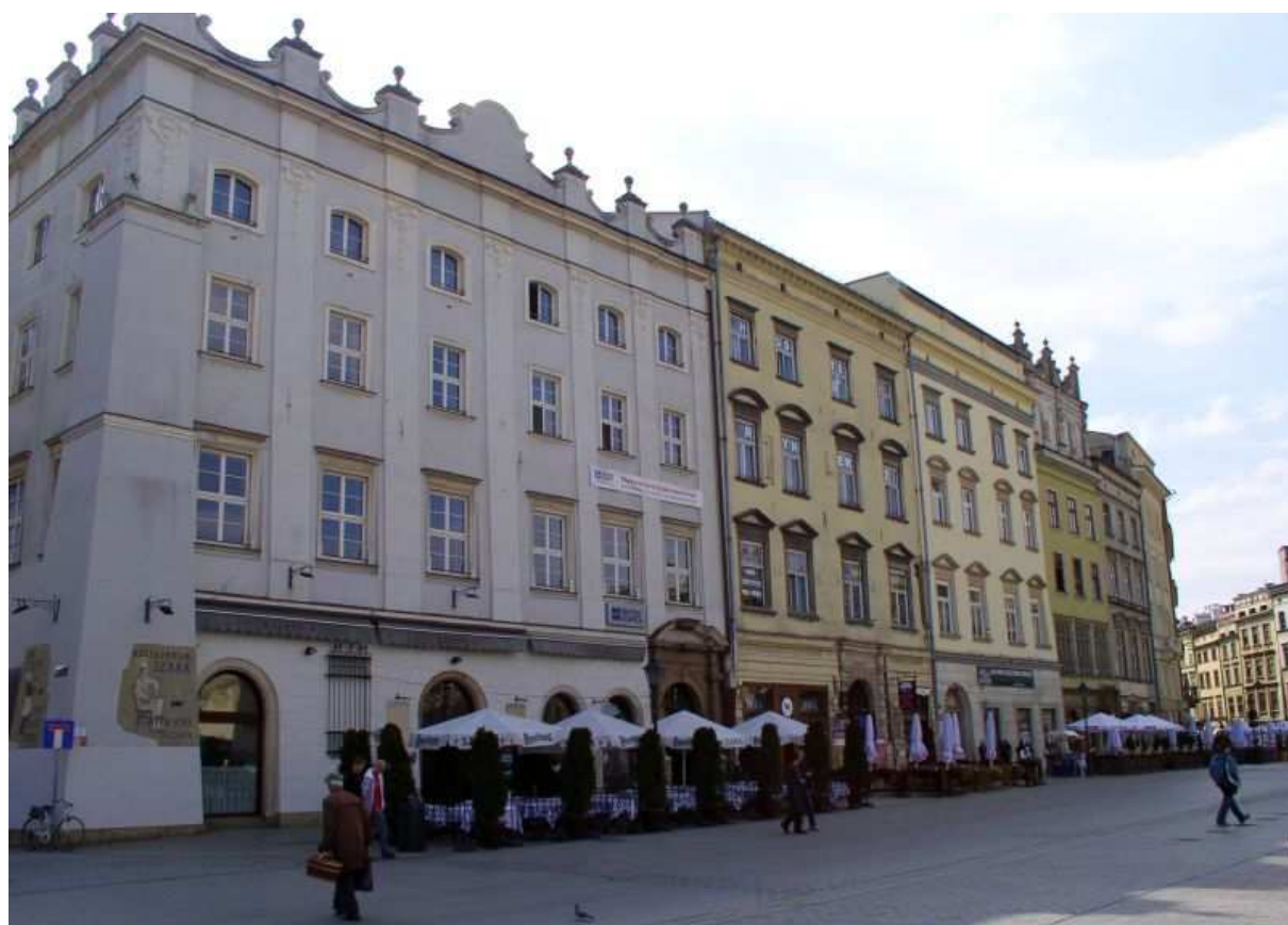
Fot. nr 68. Szara kamienica pod nr 6. 17.04.09