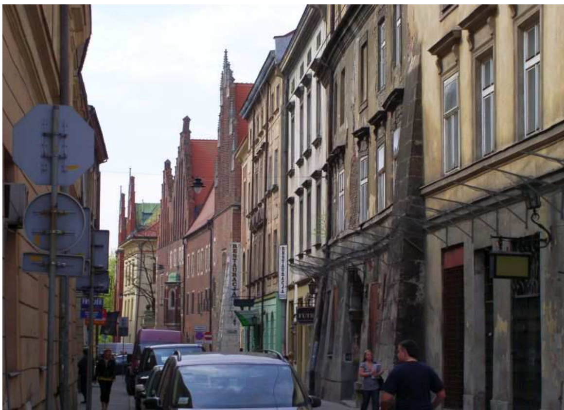
Fot. nr 149. Fragment ul. Jagiellońskiej od ulicy Szewskiej w stronę kolegiów UJ. 17.04.09