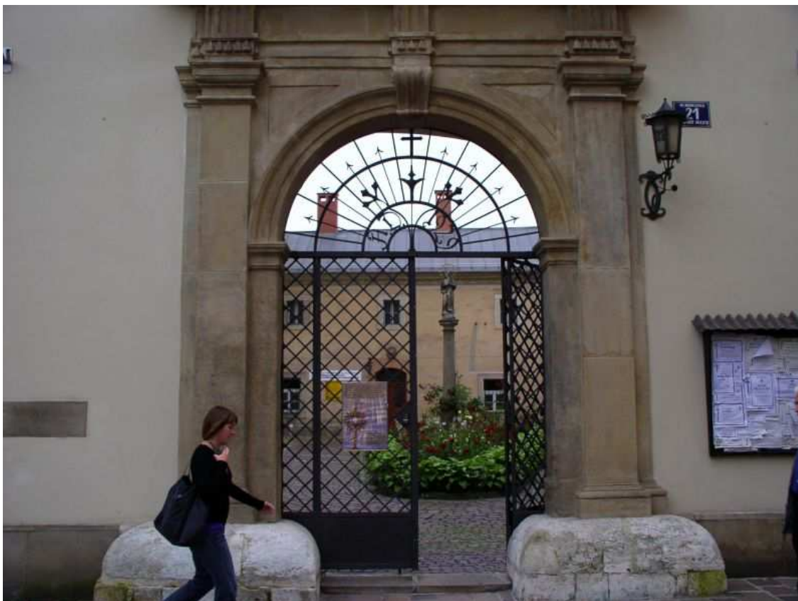
Fot. nr 179. Portal bramy wiodącej na dziedziniec kościoła Dominikanek. 29.06.09