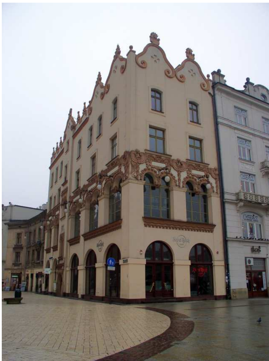
Fot. nr 66. Dawna kamienica Czynciela w narożu z Placem Mariackim, ze zrekonstruowanym, secesyjnym zdobnictwem. 11.01.10