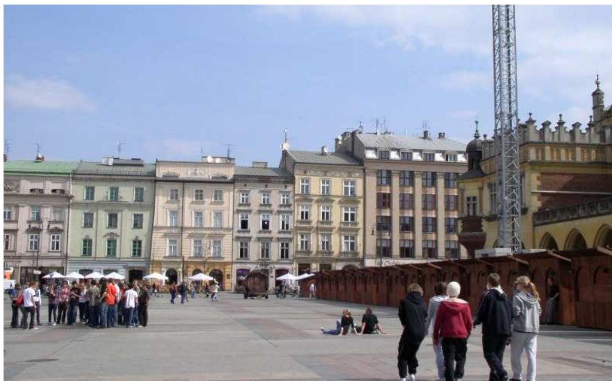
Fot. nr 72. Widok spod wieży ratuszowej. 17.04.09