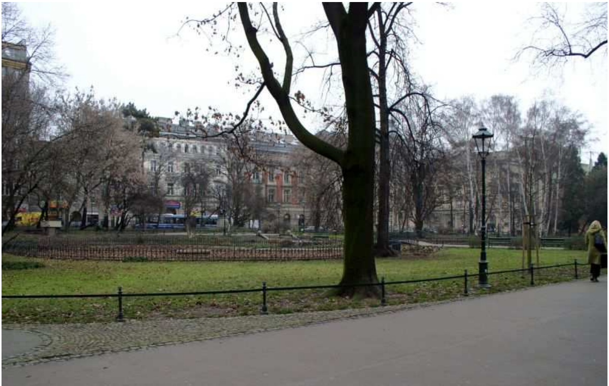
Fot. nr 3. Sadržawka w zimowym śnie. 04.12.09