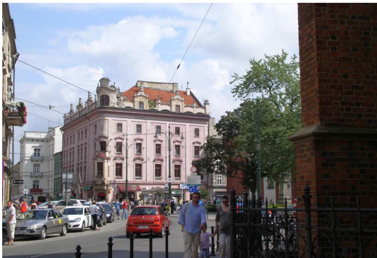
Fot. nr 244. Modernistyczna kamienica Suskich z naroża z ulicą Grodzką. 06.08.09