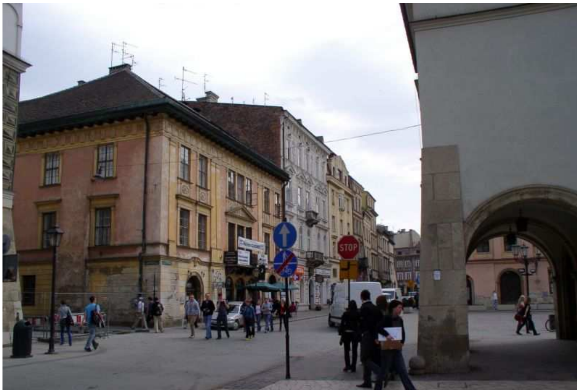
Fot. nr 184. Początkowy fragment ulicy Mikołajskiej na styku z Małym Rynkiem. 17.04.09