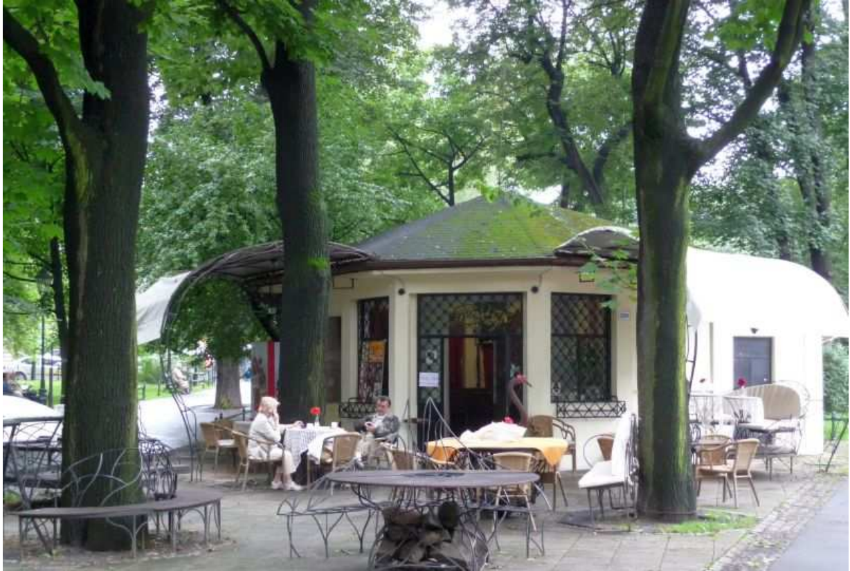
Fot. nr 6. Mała kawiarenka w sąsiedztwie ulicy Sławkowskiej. 26.07.11