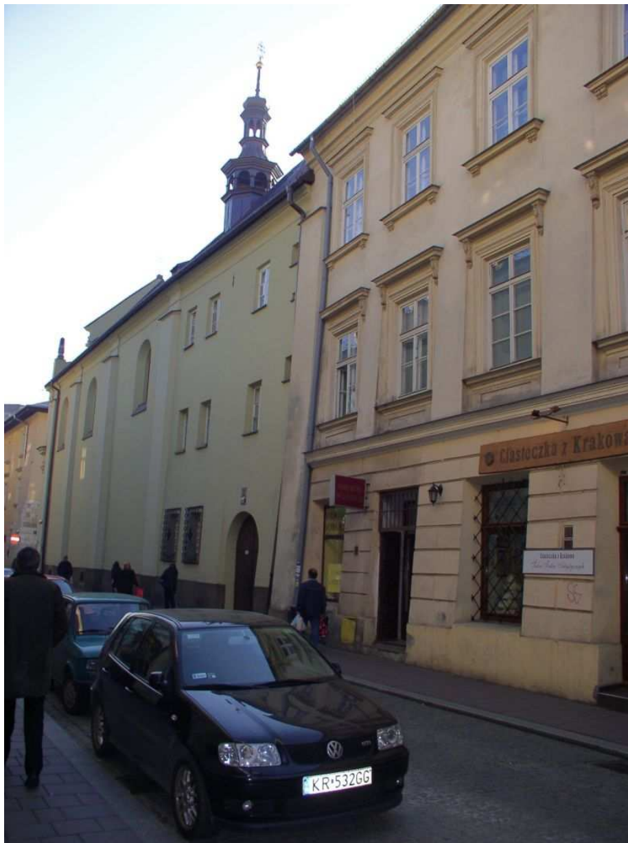
Fot. nr 174. Fragment kościołka i zabudowań klasztornych od strony ulicy św. Tomasza. 27.11.09