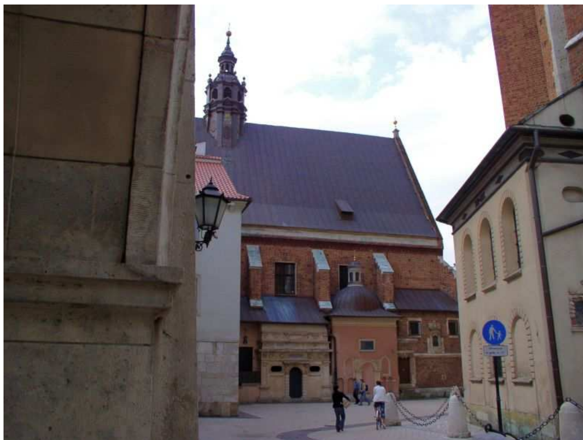
Fot. nr 223. Kościół św. Barbary – widok sprzed Prałatówki. 17.04.09