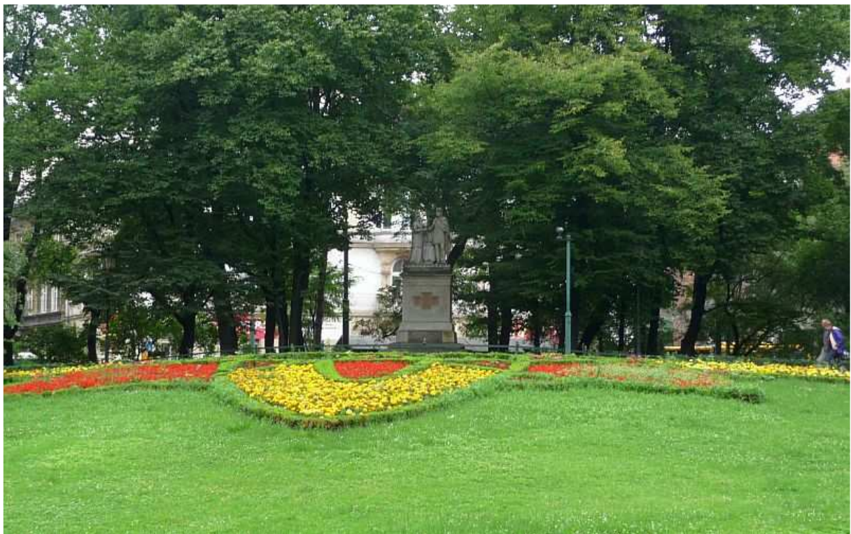
Fot. nr 7. Klombik kwiatowy przy pomniku Królowej Jadwigi i Jagiełły. 26.07.11