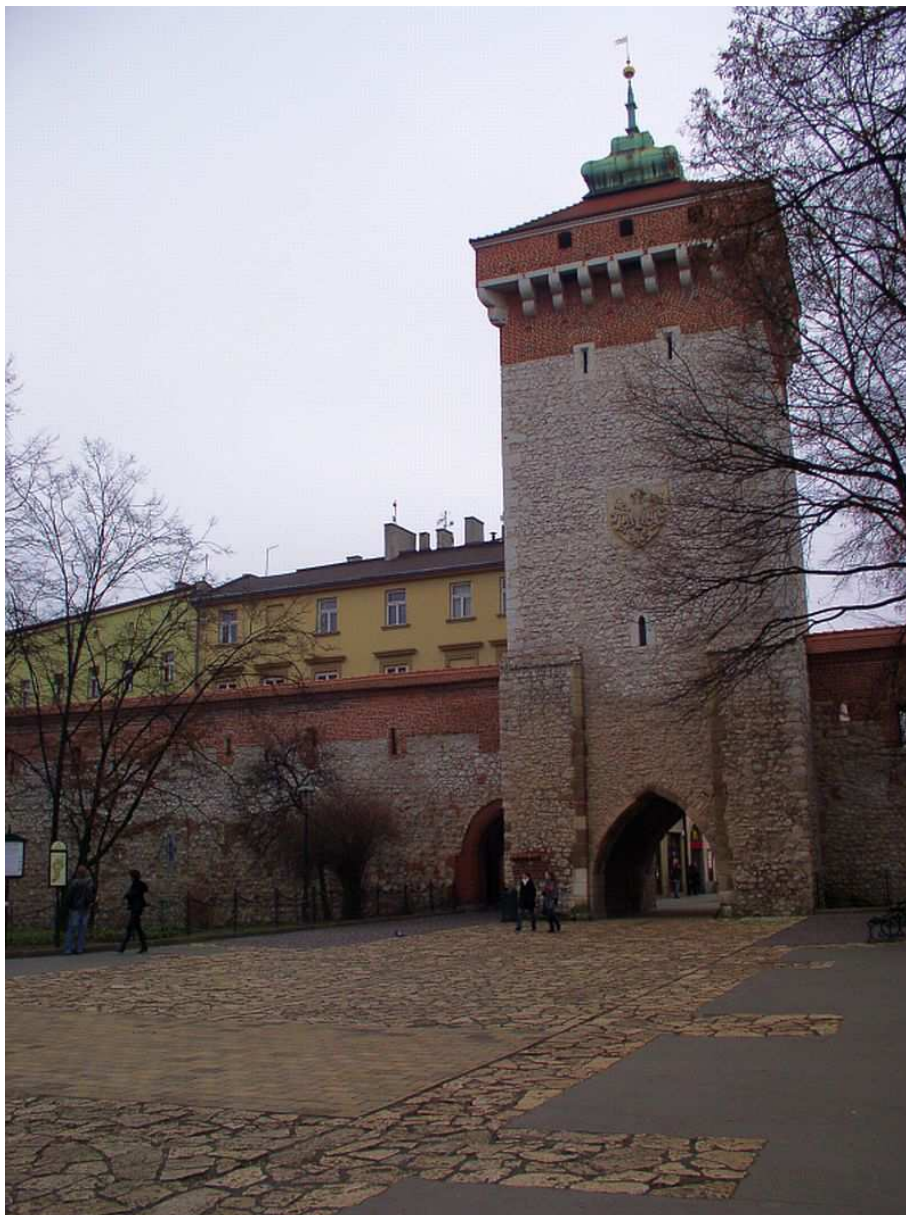
Fot. nr 19. Brama Floriańska, której powstanie datuje się na sam początek XIV-go wieku. 04.12.09