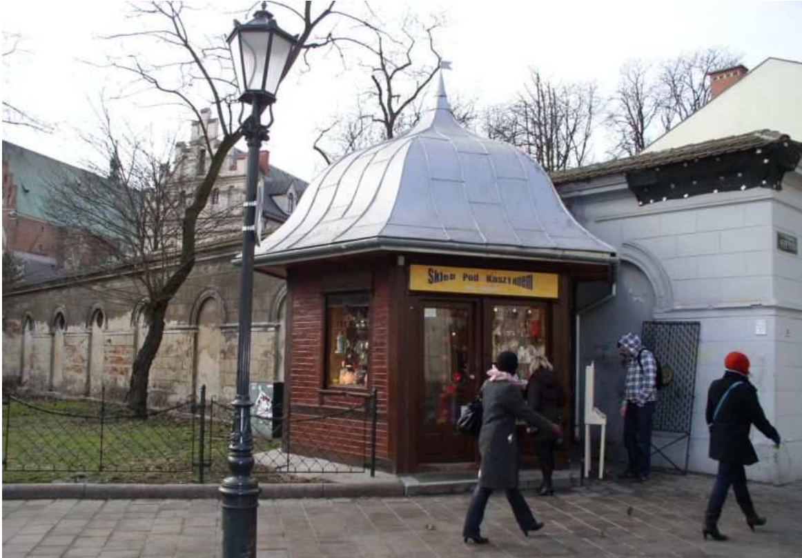
Fot. nr 195. Jeden z nielicznych, przedwojennych okraglaków na styku z Plantami. 05.02.11