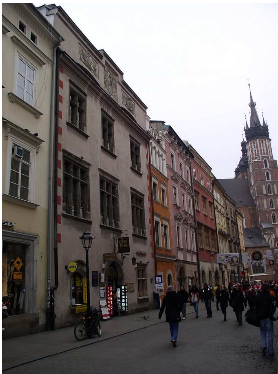
Fot. nr 45. Szczególnie efektowny, początkowy fragment ulicy o numerach: 1-13. 04.12.09