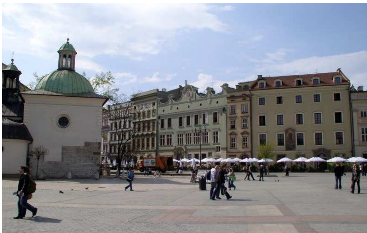
Fot. nr 96 (96-97). Fragment zabudowy południowego fragmentu Rynku przy wylocie ulicy Grodzkiej, o numerach: 14-19. Z lewej kościółek św. Wojciecha z fragmentami romańskiej faktury murów. 17.04.09