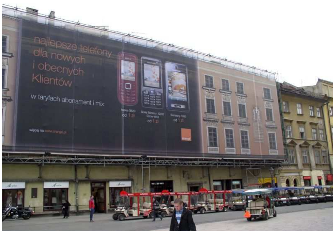
Fot. nr 222. Kamienica pod Murzynami (nr 1) w trakcie remontu. 17.04.09