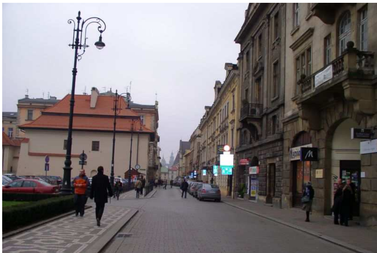
Fot. nr 170. Widok w stronę Małego Rynku. 04.12.09