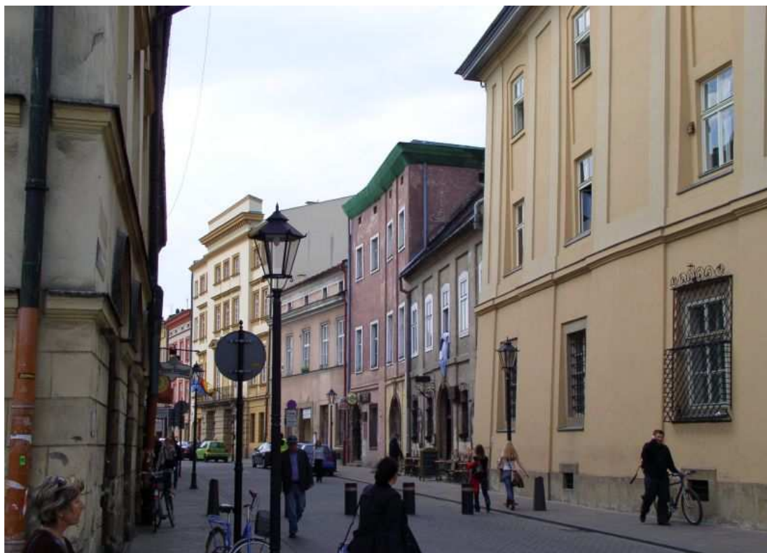
Fot. nr 230 (230-234). Początkowy fragment ulicy Stolarskiej – widoki z naroża z ulicą Sienną. 17.04.09