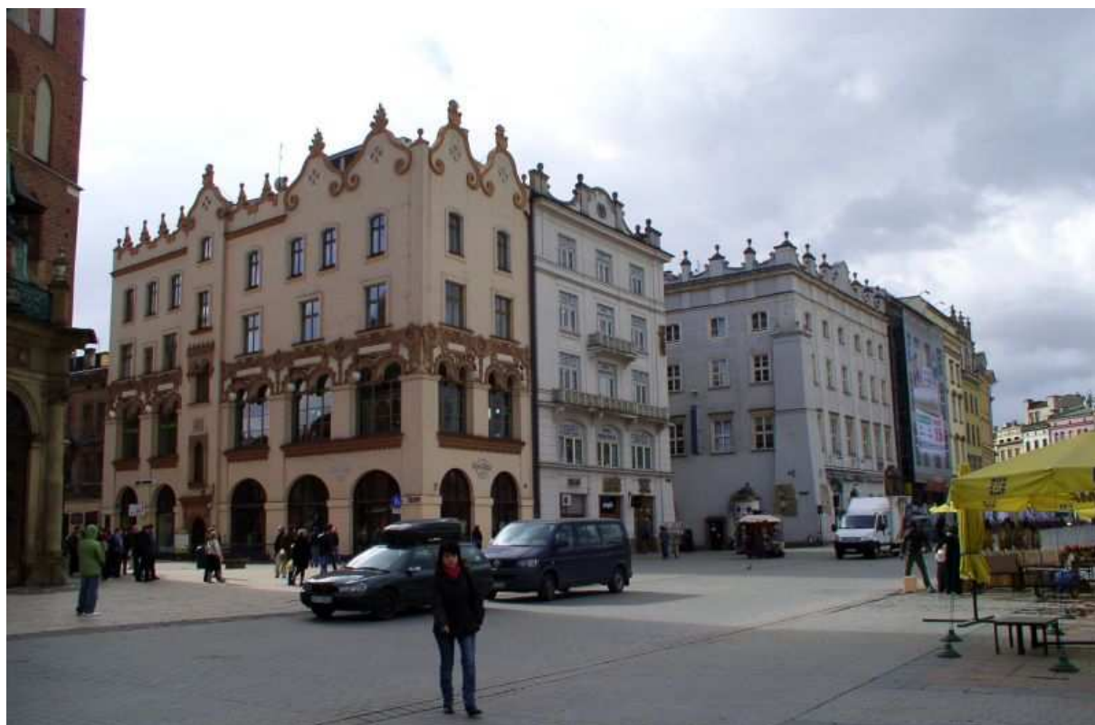
Fot. nr 67 (67-69). Wschodnia pierzeja Rynku w kierunku ulicy Grodzkiej. 09.04.11