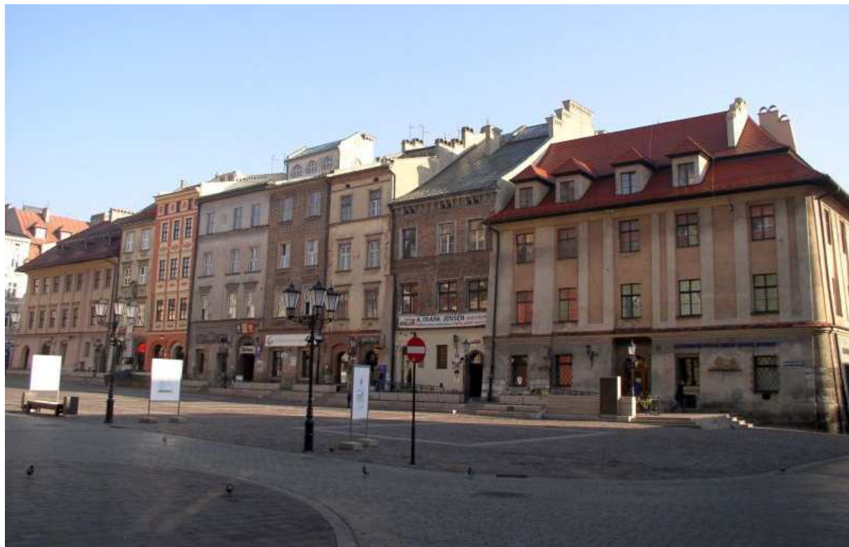
Fot. nr 213 (213-214). Wschodnia pierzeja Małego Rynku – widok z wylotu ulicy Siennej. 27.11.09