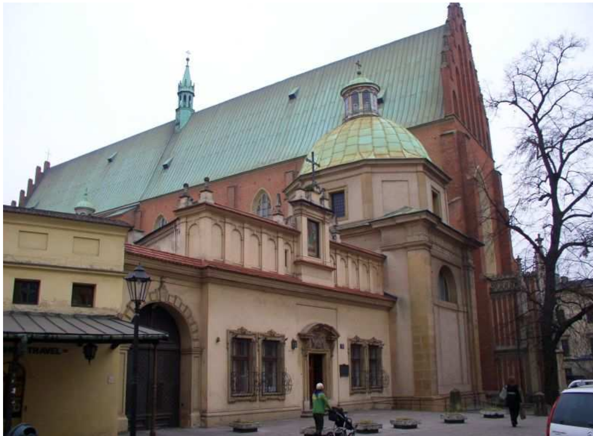
Fot. nr 237. Kościół Dominikanów, który zamyka ulicę od południa. 04.12.09