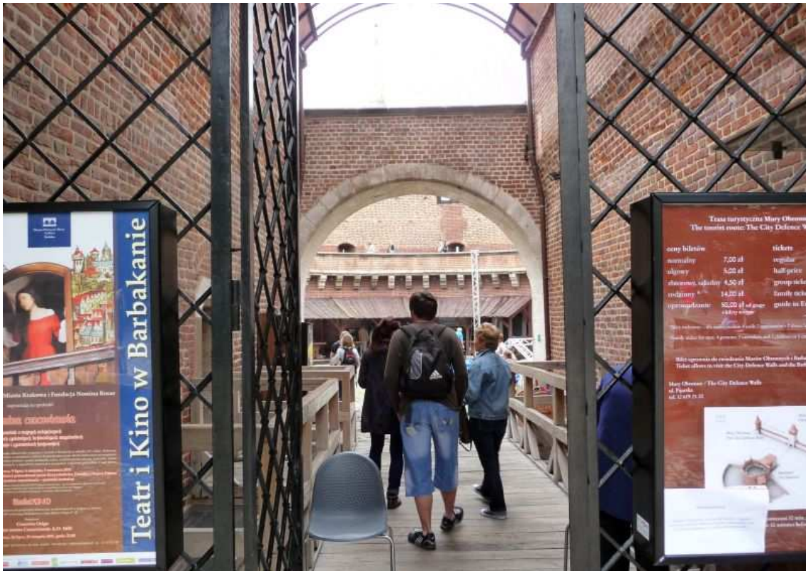
Fot. nr 17. Wnętrze „rondla”. 26.07.11