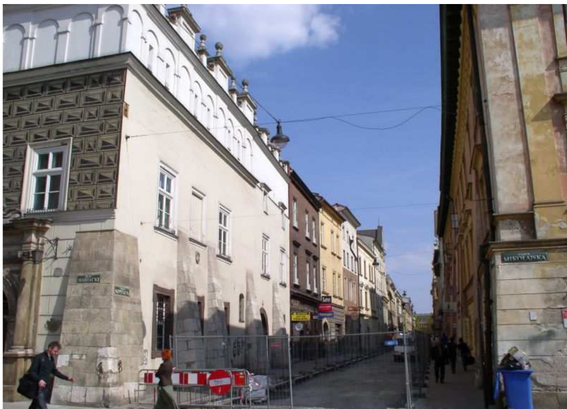
Fot. nr 177. Panorama ulicy z Małego Rynku - widok w stronę Plant. 17.04.09