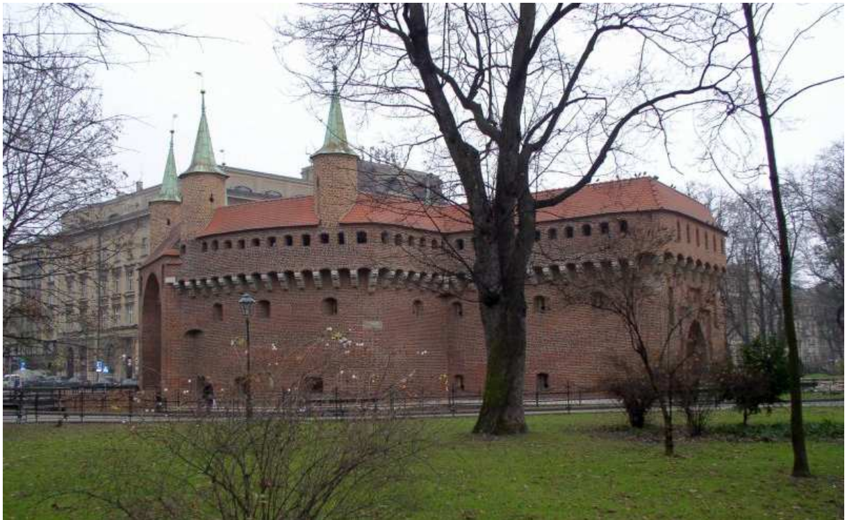
Fot. nr 12. Barbakan, czyli rondel. 04.12.09