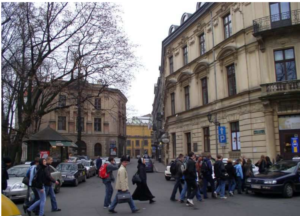
Fot. nr 152. W stronę ulicy Pijarskiej i Muzeum Czartoryskich. 04.12.09