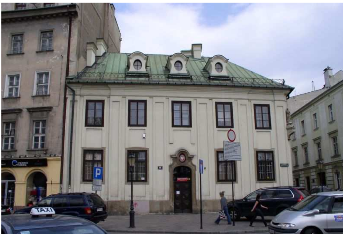
Fot. nr 198. Budynek dawnej mennicy pod nr 16. 17.04.09