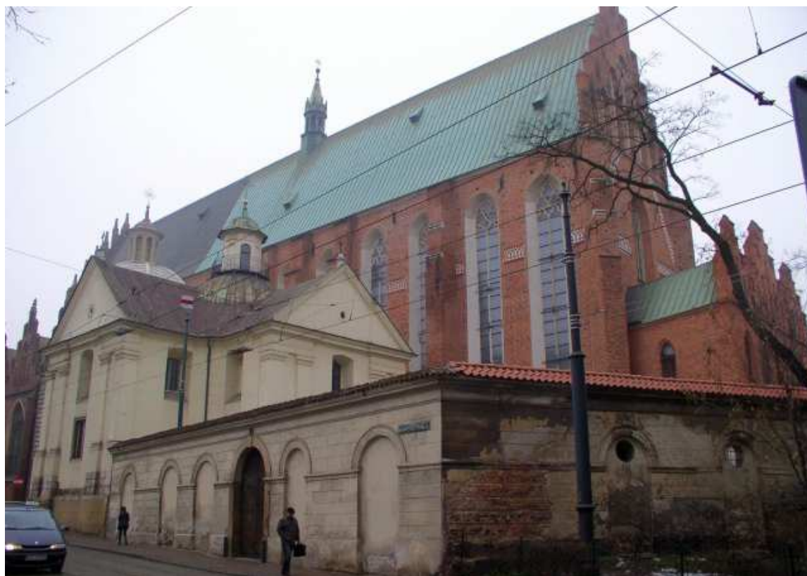
Fot. nr 240. Wschodni fragment kościoła, wraz z absydą – widok z Plant. 11.01.11