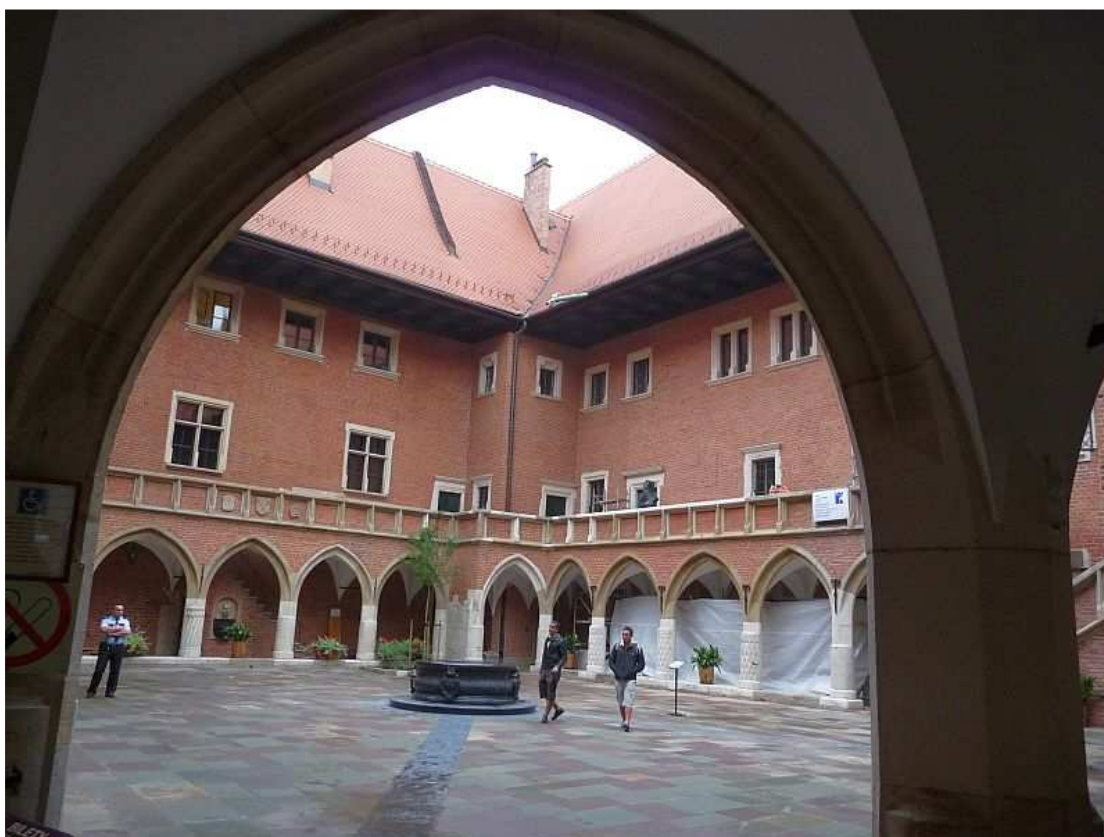
Fot. nr 131. Częściowo zrekonstruowany przez Karola Estreichera dziedziniec. 25.07.11