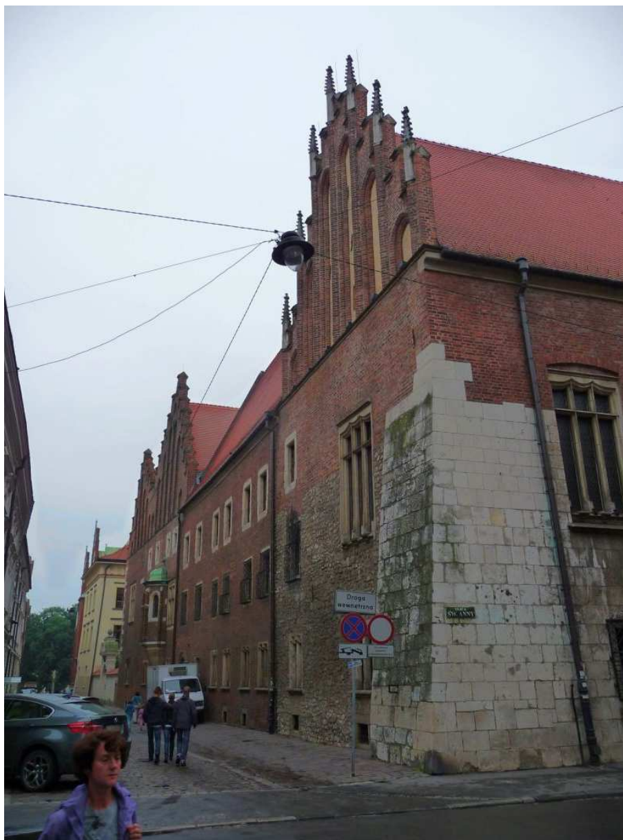
Fot. nr 127. Panorama Collegium Maius wzdłuż ulicy Jagiellońskiej. 25.07.11