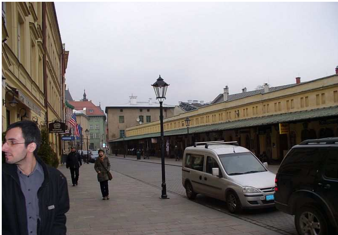
Fot. nr 236. Widok z Placu Dominikańskiego. 04.12.09