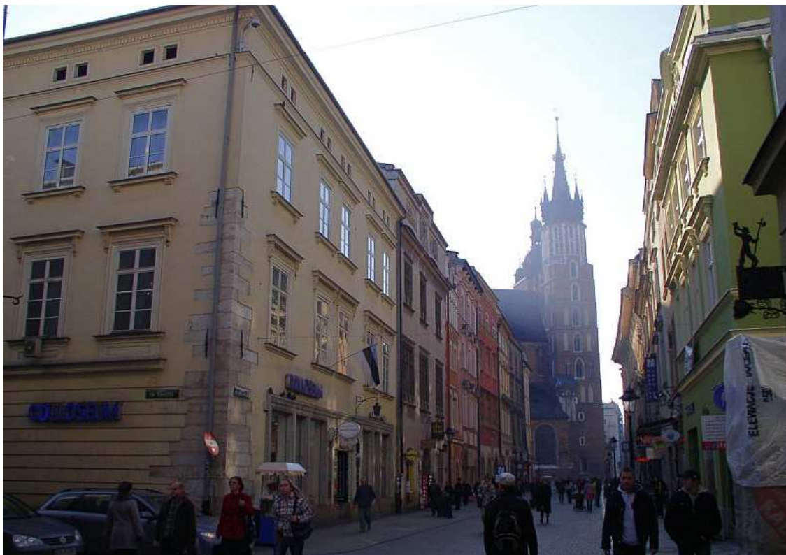
Fot. nr 44. Fragment zabudowy o numerach: 1-15, z Kościołem Mariackim w tle. 27.11.09