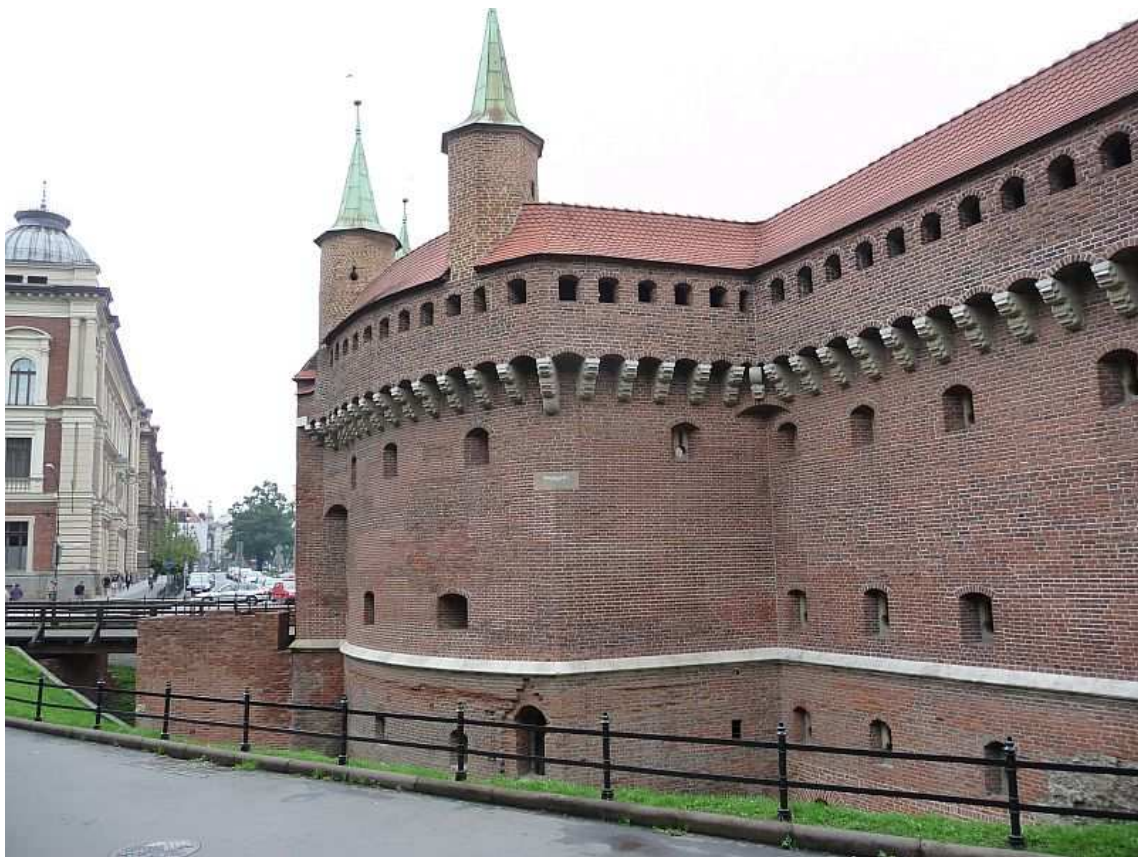
Fot. nr 14. Odtworzony most zwodzony do krakowskiego Rondla. 26.07.11