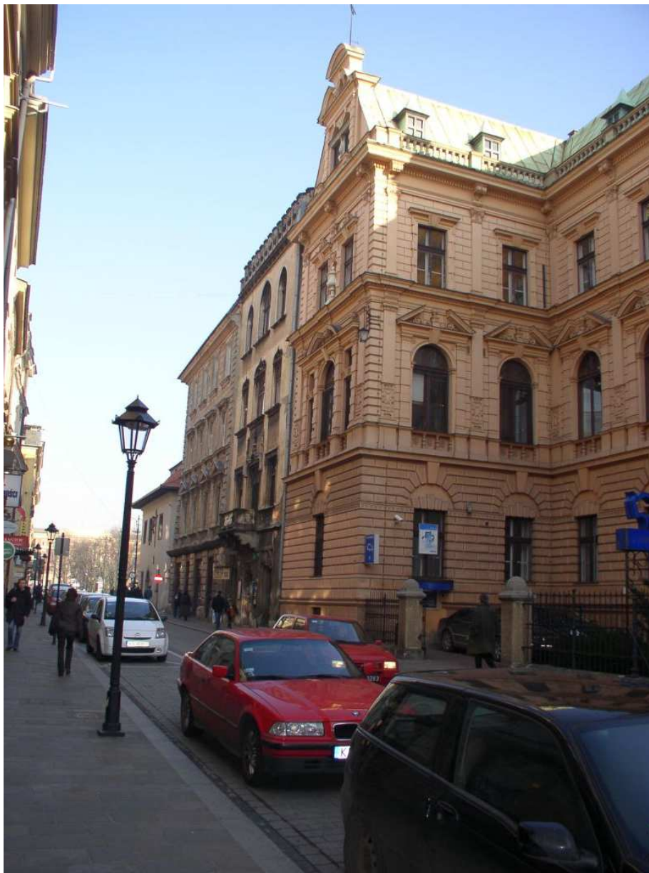
Fot. nr 172. Fragment ulicy Szpitalnej w sąsiedztwie ulicy św. Marka, jeszcze z antykwariatem na parterze narożnej kamienicy pod nr 19. 27.11.09