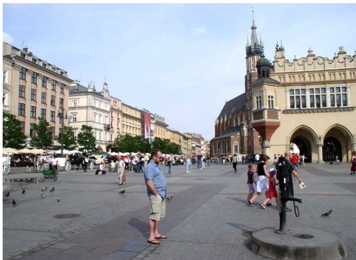
Fot. nr 73. Spod Krzysztoforów w stronę ulicy Mikołajskiej. 16.06.11