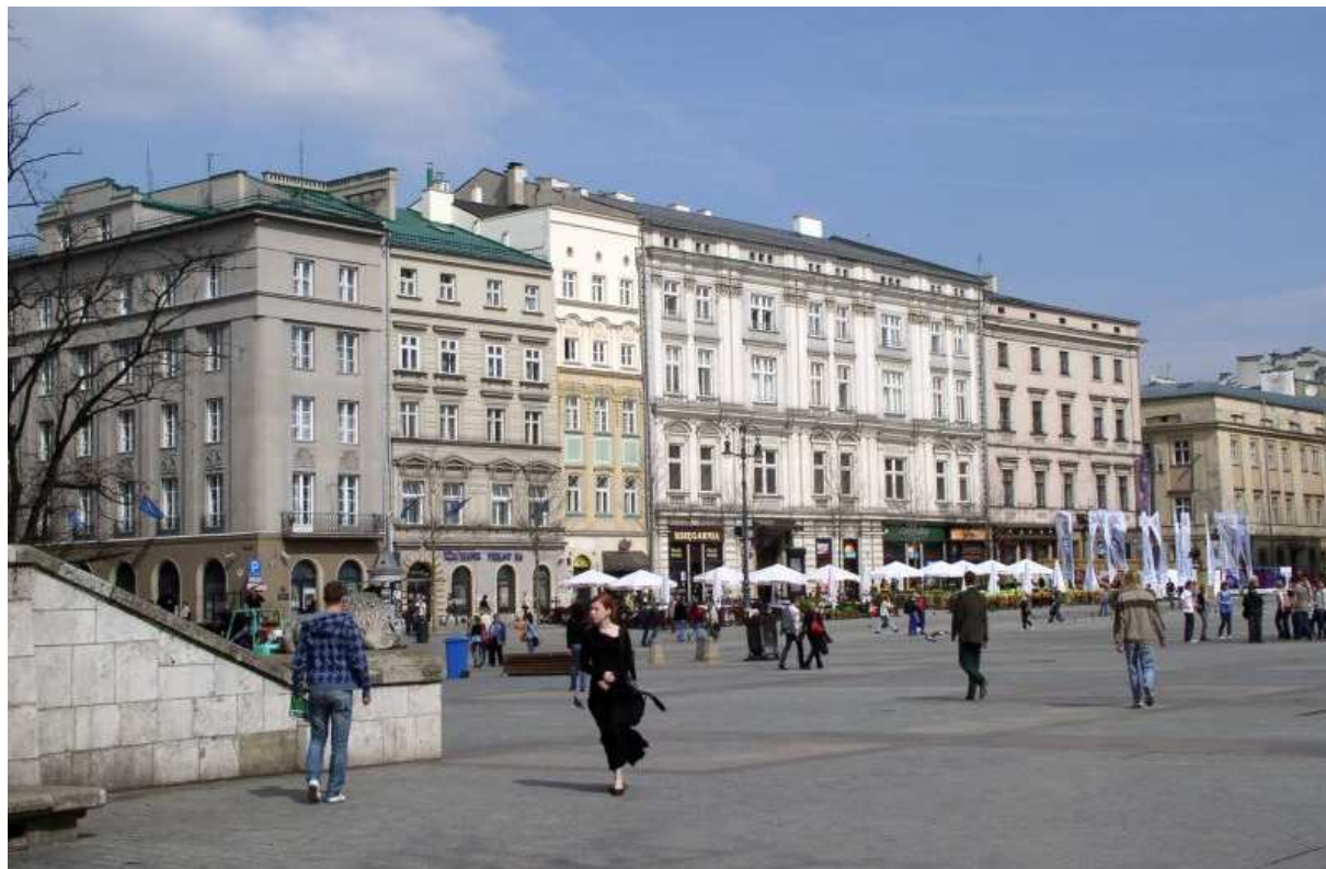
Fot. nr 74 (74-75). Fragment zabudowy Zachodniej pierzei Rynku pomiędzy ulicami: Szczepańską i Szewska – widok spod wieży ratuszowej. 17.04.09