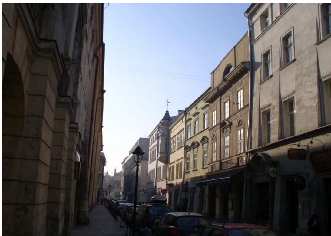
Fot. nr 161. W stronę Ryнку i Sukiennic – widok z ulicy św. Marka. 27.11.09