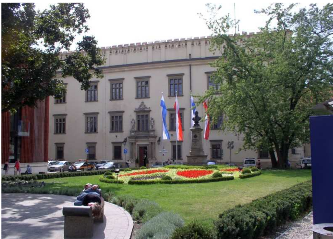
Fot. nr 105 (105-106). Pałac Wielopolskich, siedziba władz miasta Krakowa. 06.08.09