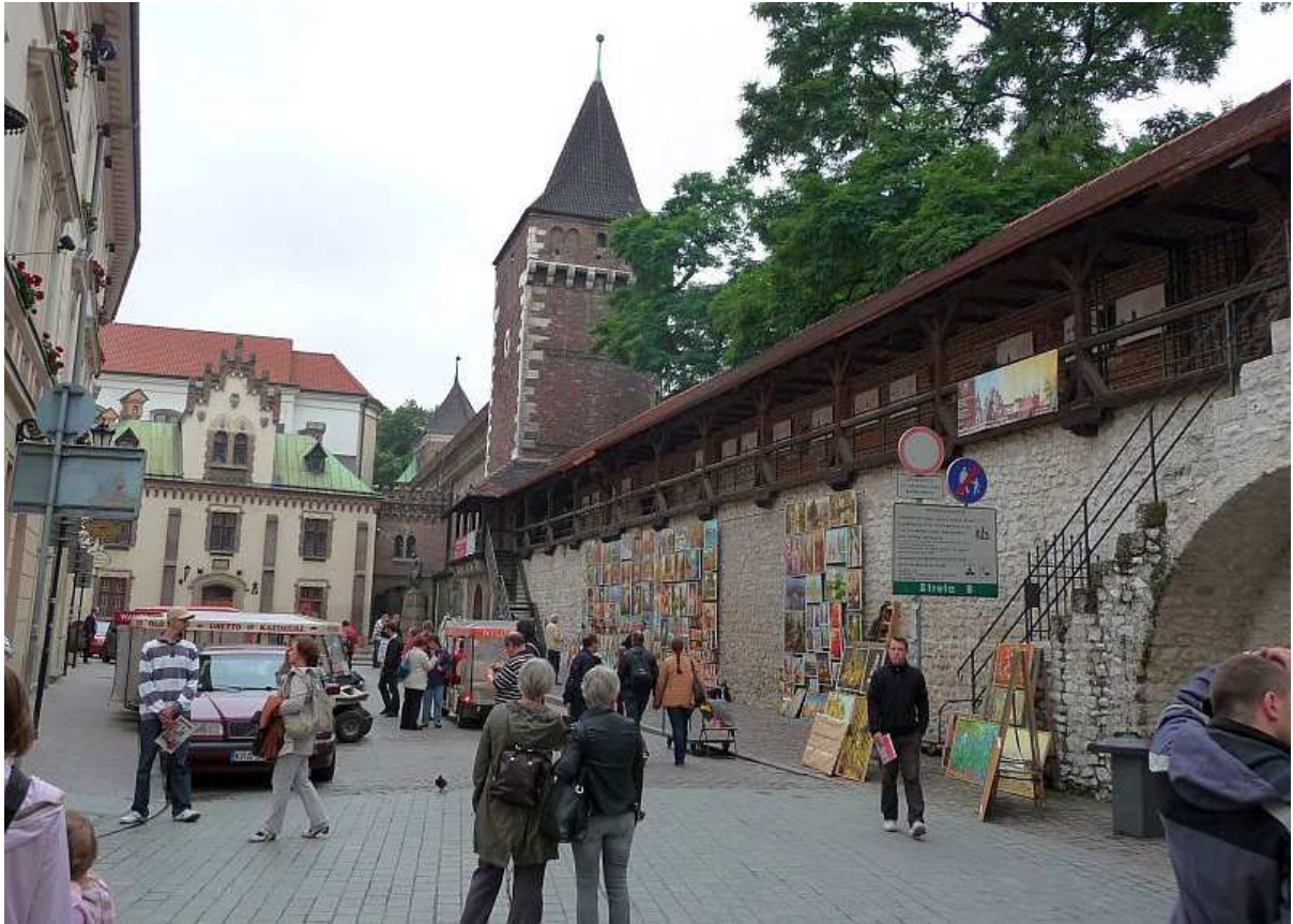
Fot. nr 31. Wewnętrzny fragment muru obronnego wzdłuż fragmentu ulicy Pijarskiej, w stronę baszt: Stolarskiej i Ciesielskiej. 26.07.11