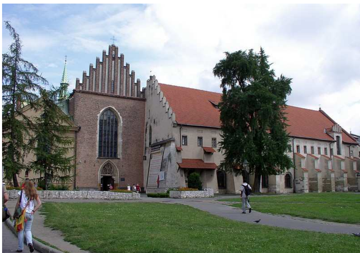
Fot. nr 113. Fasada kościoła Franciszkanów, powstała po pożarze z 1850-go roku – widok z Plant. 06.08.09