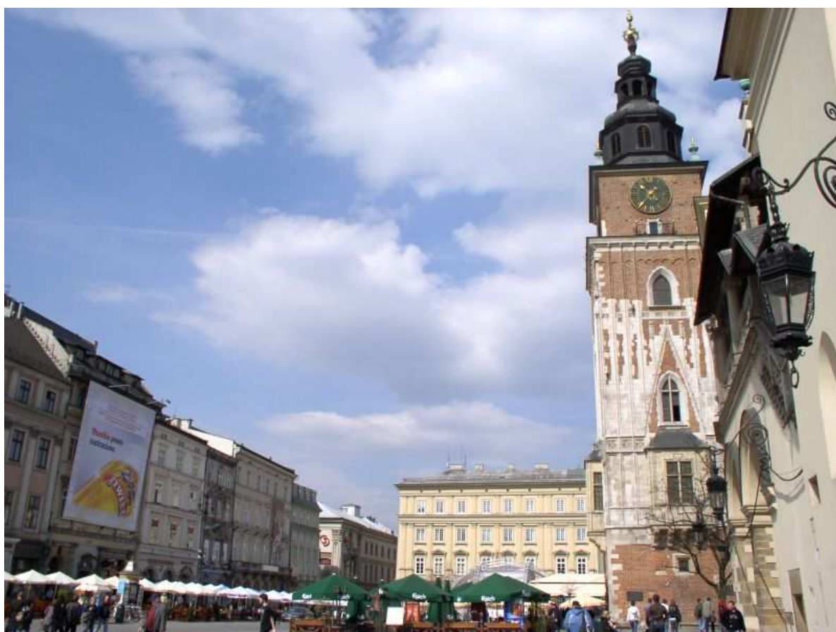
Fot. nr 84. Południowo-zachodni narożnik – widok spod Sukiennic, 17.04.09