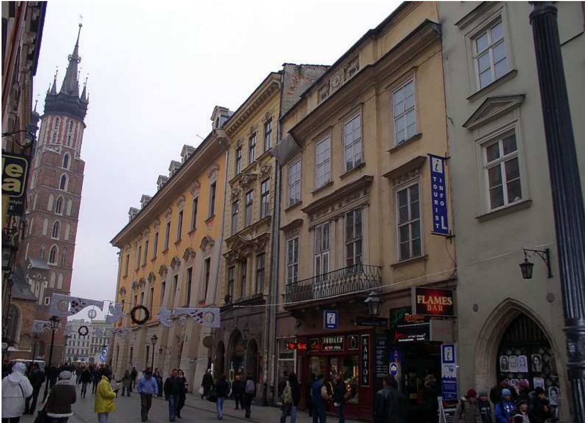
Fot. nr 43. Początkowy fragment zabudowy o numerach: 2-6. 04.12.09