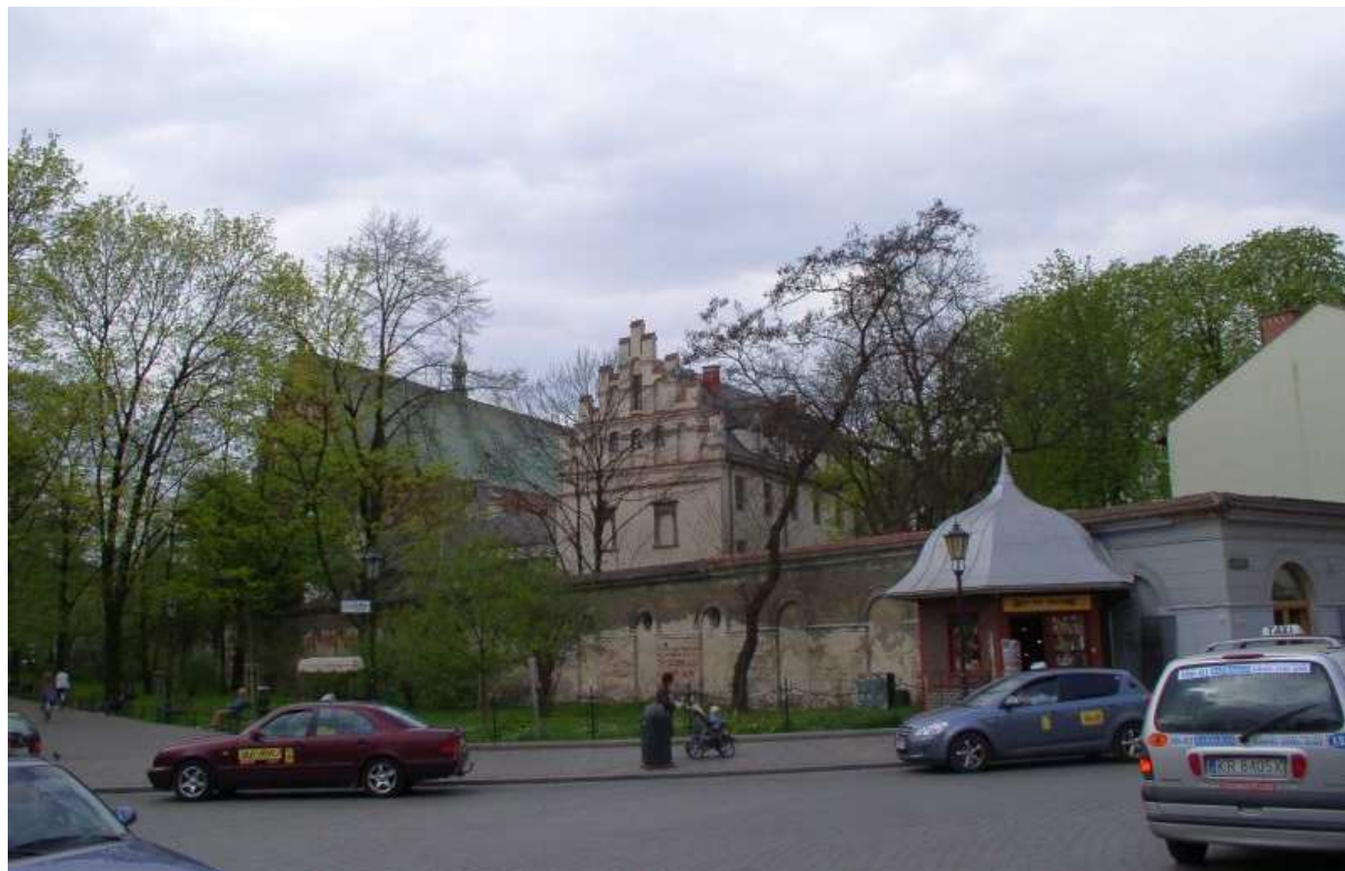
Fot. nr 241 (241-243). Kościół Dominikanów i budynek biblioteki – widoki z Plant na styku z ulicą Sienną. 17.04.09