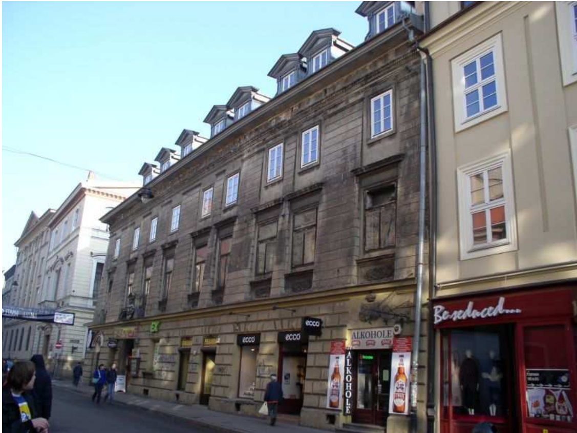
Fot. nr 156 (156-157). Pałac Tarnowskich w narożu z ulicą św. Marka. 27.11.09