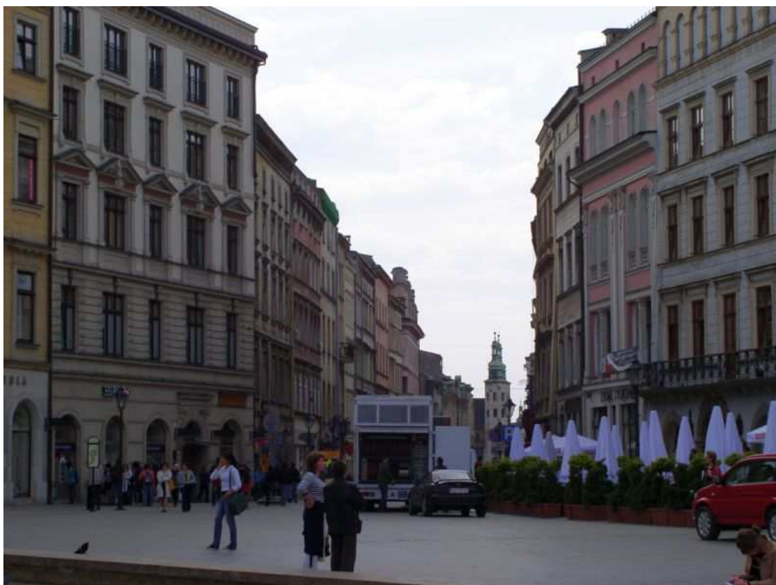
Fot. nr 98 (98-100). W stronę ulicy Grodzkiej, z kościołem św. Andrzeja w tle. 17.04.09