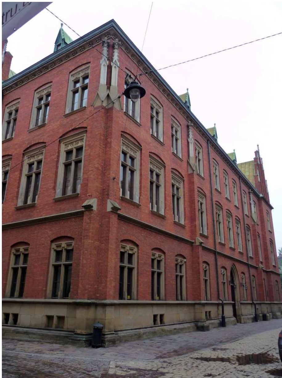
Fot. nr 135. Fragment Collegium Novum od strony ulicy Gołębiej. 25.07.11