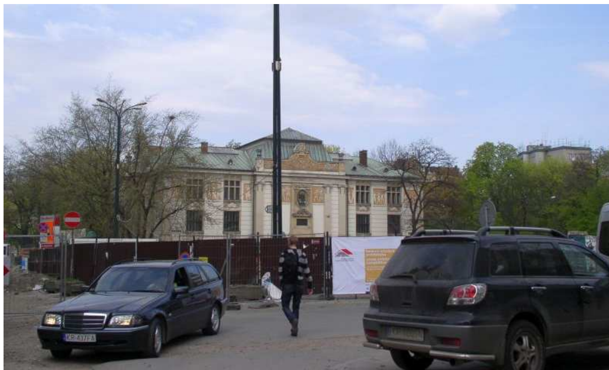
Fot. nr 144. Plac w czasie remontu i wymiany nawierzchni. 17.04.09