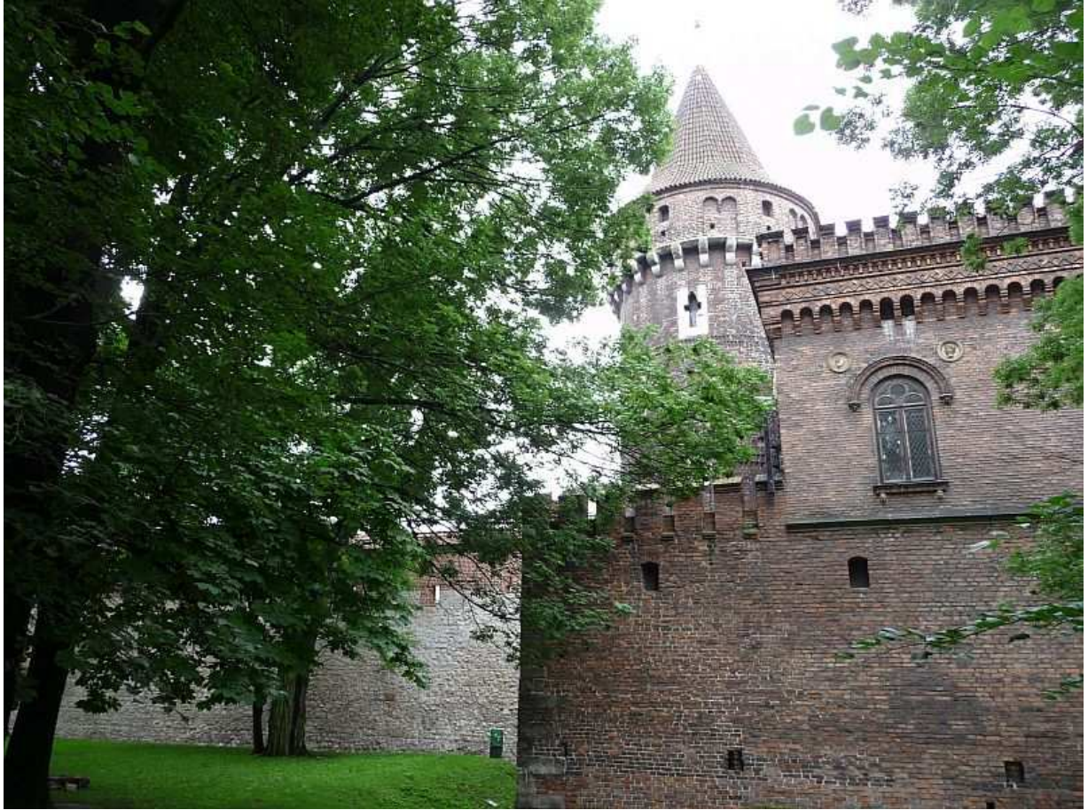
Fot. nr 11. Baszta Stolarska. 26.07.11