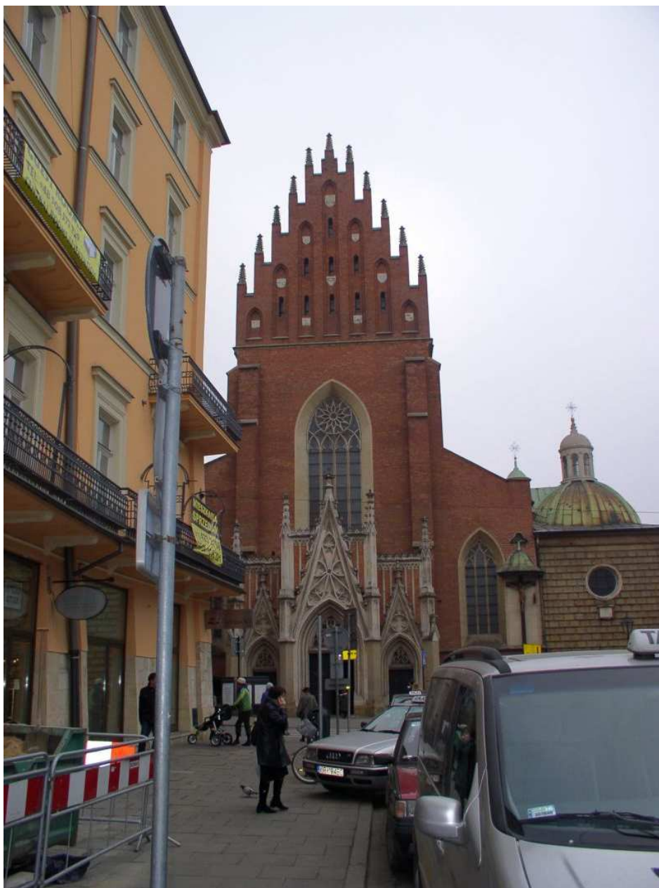
Fot. nr 238. Kościół Dominikanów – odbudowana po pożarze z 1850-go roku fasada, widoczna z Placu Dominikańskiego. 04.12.09