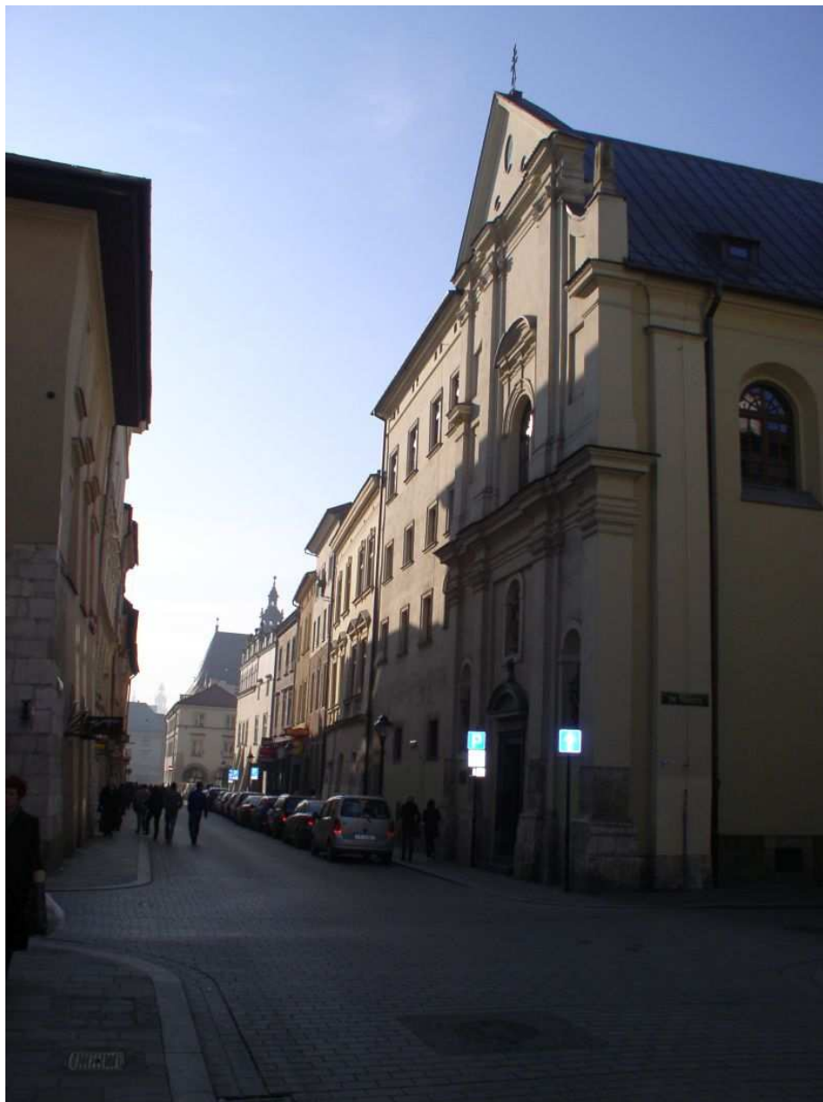
Fot. nr 173 (173-174). Wschodni fragment ulicy w stronę Małego Rynku. Na pierwszym planie kościół Duchaczek w narożu z ulicą św. Tomasza. 27.11.09