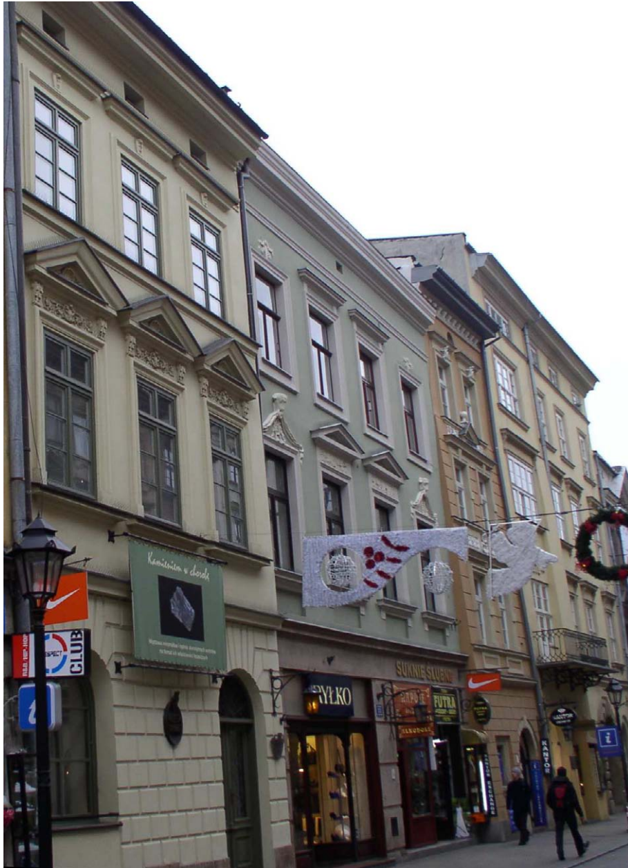
Fot. nr 40. Fragment zabudowy o numerach: 19-25. 04.12.09