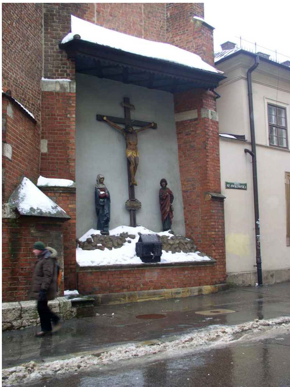
Fot. nr 155. Golgota przy kościele św. Marka. 07.12.10