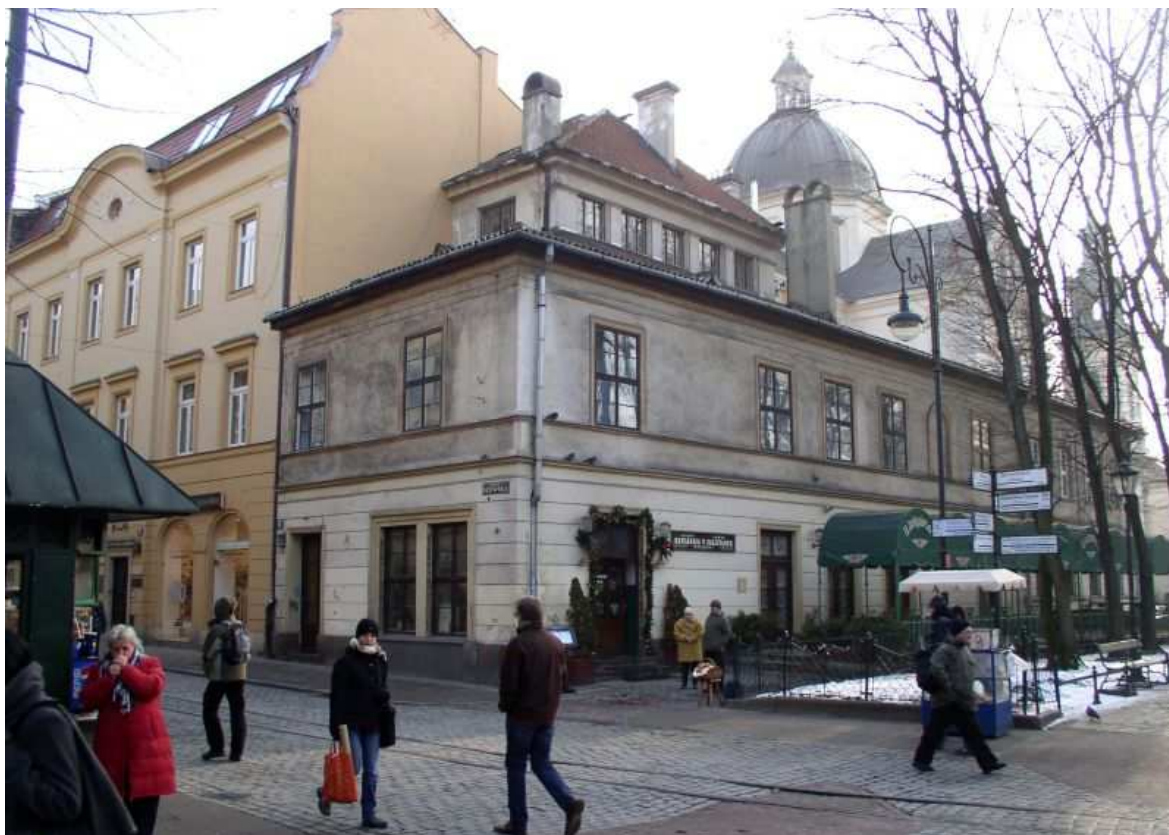
Fot. nr 139. Klasycystyczna kamieniczka spod nr 24, z naroża z plantami. 28.01.11