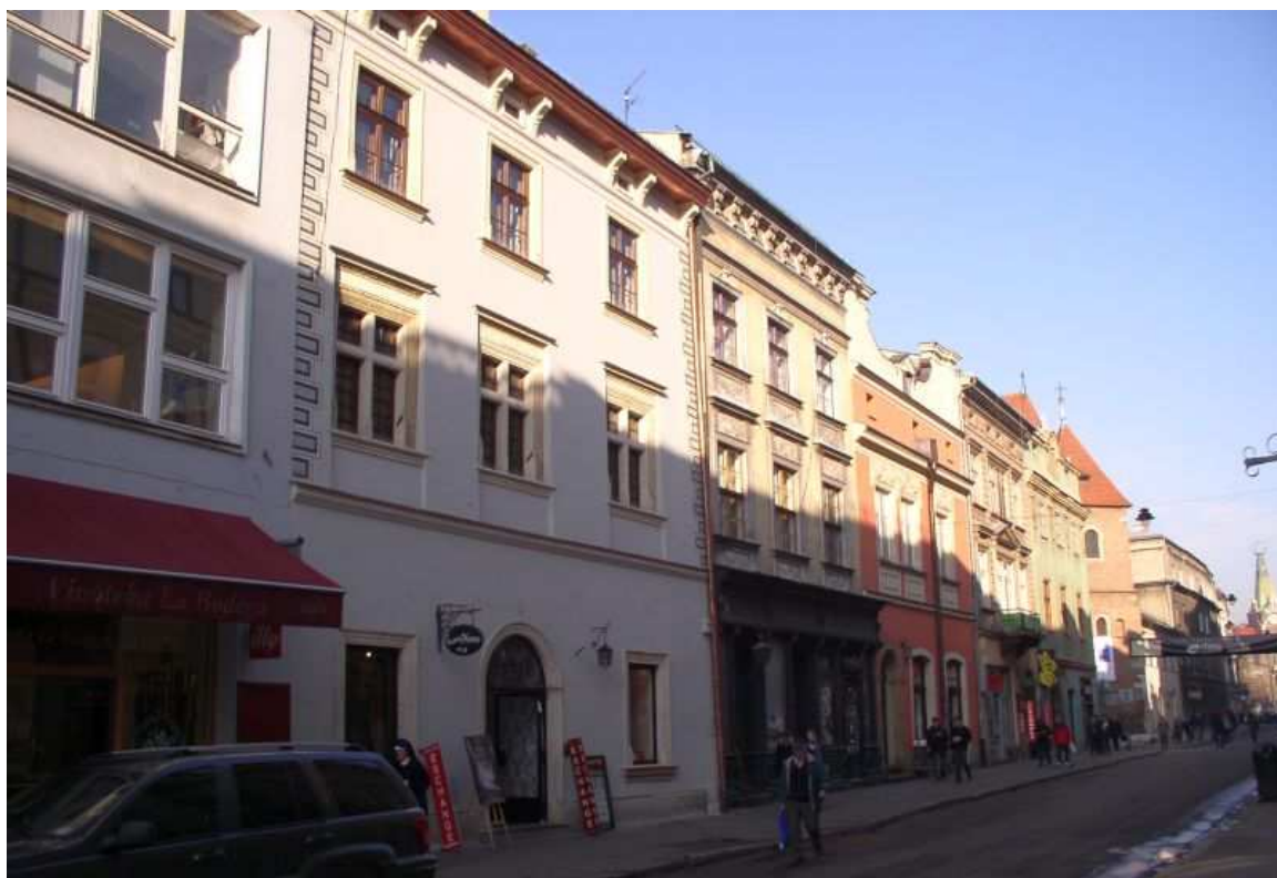
Fot. nr 153. Fragment zabudowy zachodniej pierzei pomiędzy ulicami: św. Marka i św. Tomasza. 27.11.09