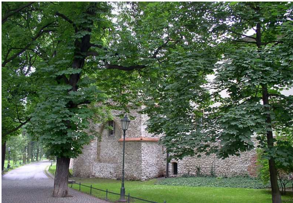
Fot. nr 187. Brama Rzeźnicza w murach klasztoru Dominikanek. 29.06.09