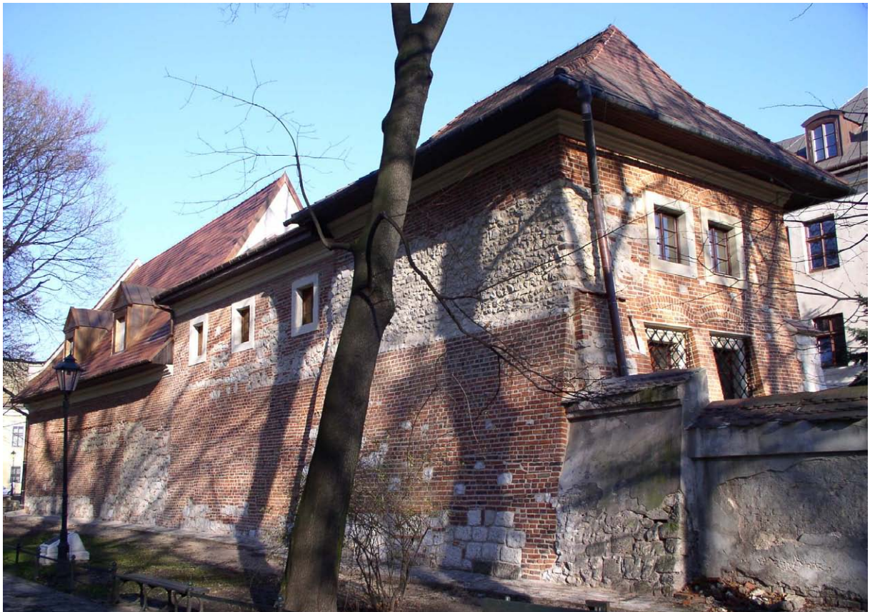
Fot. nr 114. Rekonstrukcja średniowiecznego budynku w sąsiedztwa klasztoru Franciszkanów, który stał w sąsiedztwie muru obronnego – widok z Plant. 25.11.10