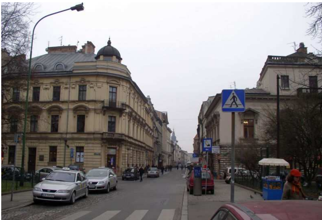
Fot. nr 151. Widok z Plant w stronę Ryнку. 04.12.09