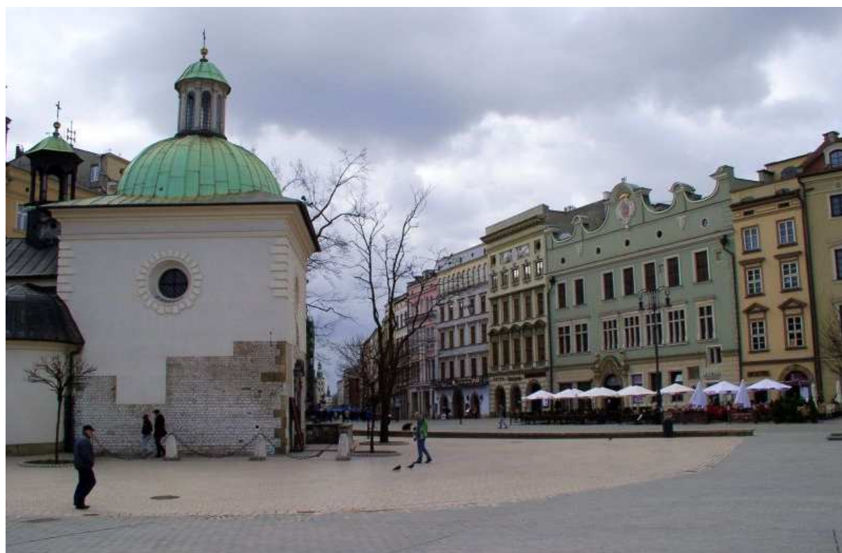
Fot. nr 97. Przedlokacyjna krzywizna południowo-wschodniego łuku Rynku. 09.04.11