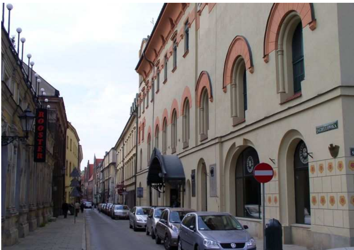
Fot. nr 148. Ulica Jagiellońska – widok z Placu Szczepańskiego. 17.04.09