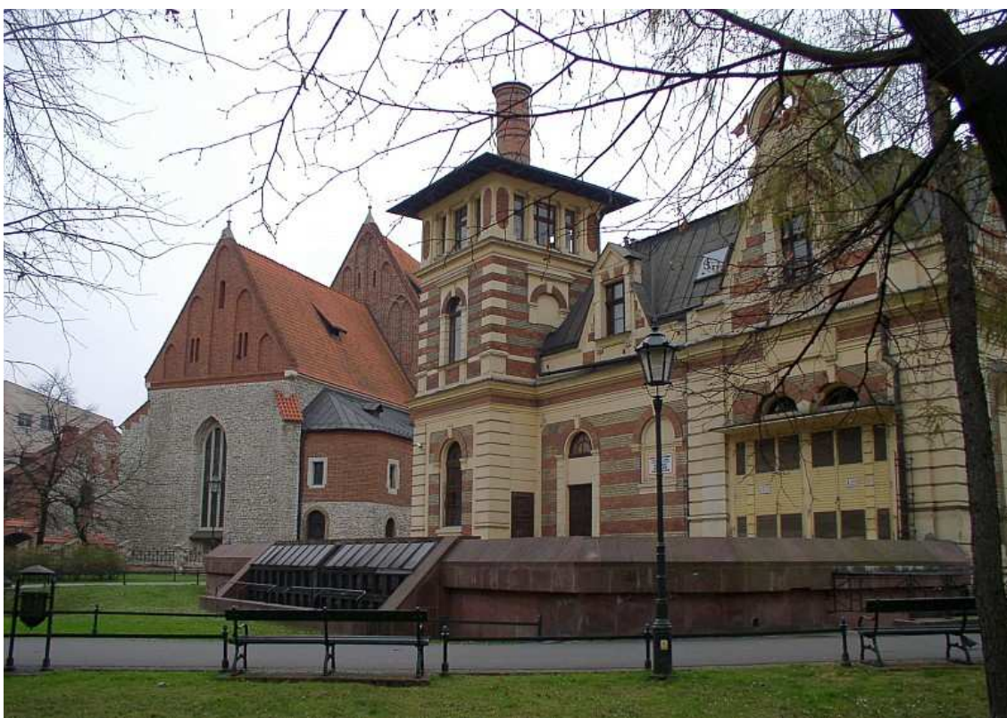
Fot. nr 166. Dawna maszynownia Teatru Słowackiego, dziś Teatr Miniatura. 26.11.10