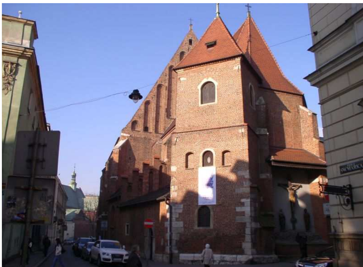
Fot. nr 154. Kościół św. Marka fundowany jeszcze przez Bolesława Wstydlivego. 27.11.09