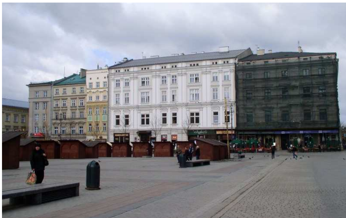
Fot. nr 75. Widok z okolic wylotu ulicy św. Jana. 09.04.11