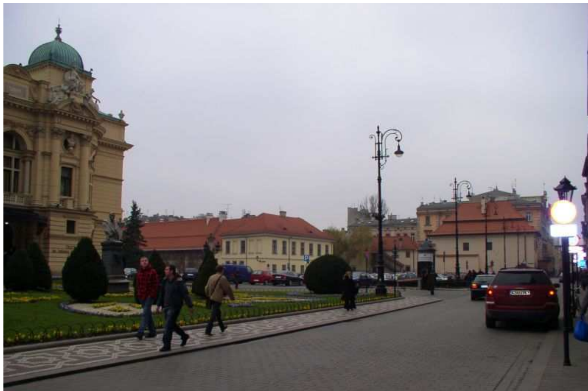
Fot. nr 167. Wzdłuż ulicy Szpitalnej, z Placem św. Ducha z lewej. 04.12.09