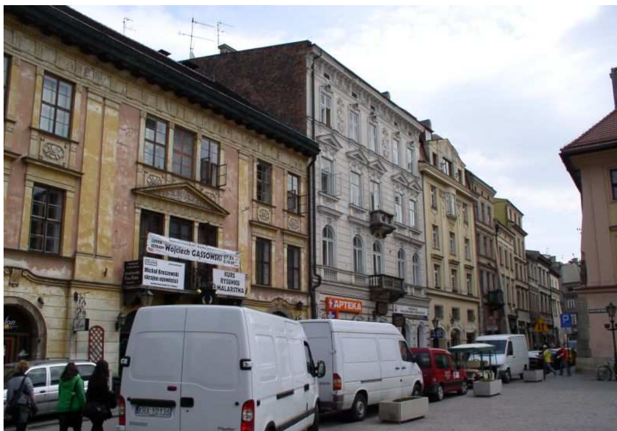
Fot. nr 218. Wzdłuż ulicy Mikołajskiej w stronę ulicy św. Krzyża. 17.04.09