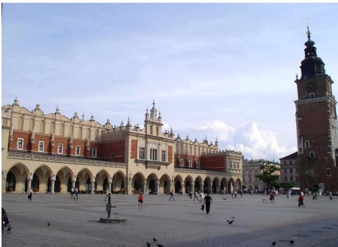
Fot. nr 80. Sukiennice i wieża ratuszowa – widok spod Krzysztoforów. 16.06.11