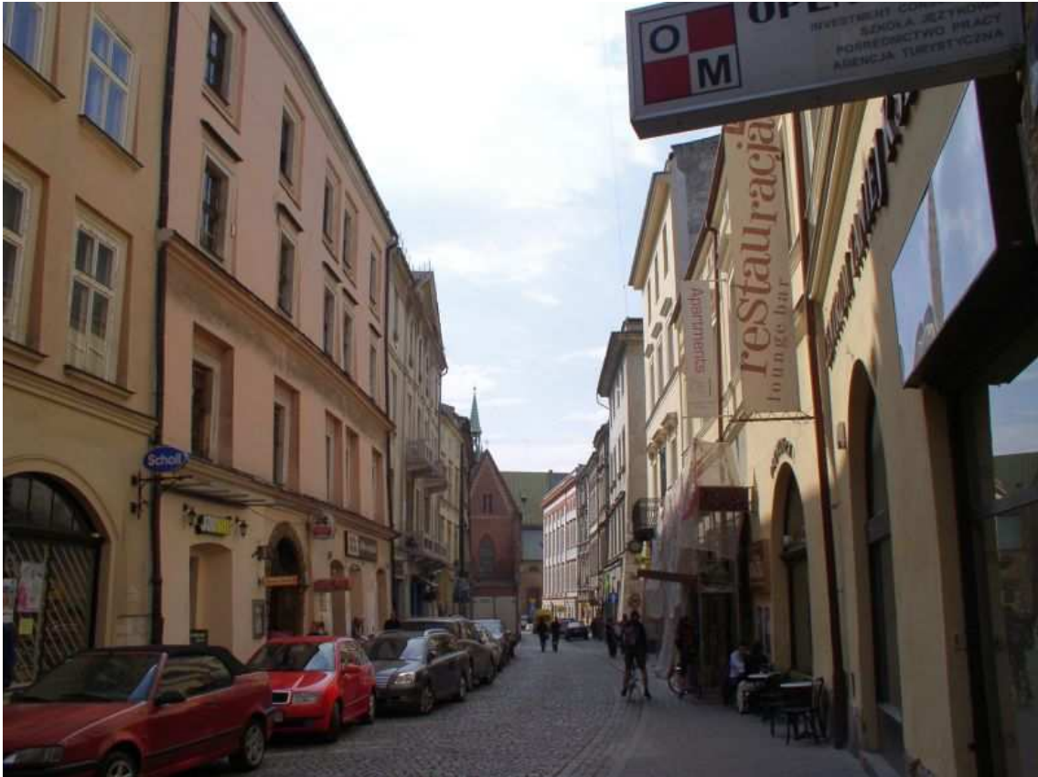
Fot. nr 119. Widok od strony Ryнку. W tle kruchta kościoła Franciszkanów. 17.04.09