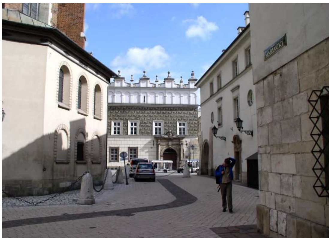
Fot. nr 220. Renesansowa Prałatówka Kościoła Mariackiego na styku z ulicą Szpitalną – widok spod kościoła św. Barbary. 09.04.11