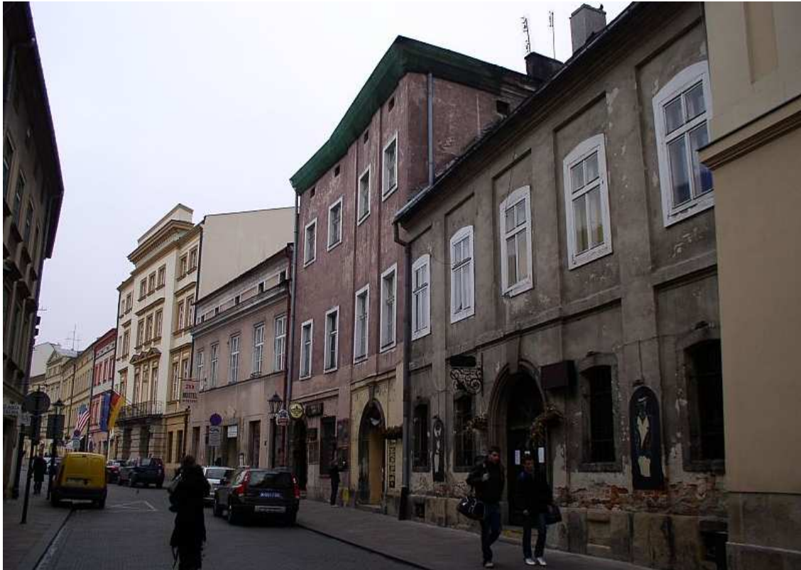
Fot. nr 232. Zachodnia pierzeja o numerach nieparzystych, przed remontem. 04.12.09