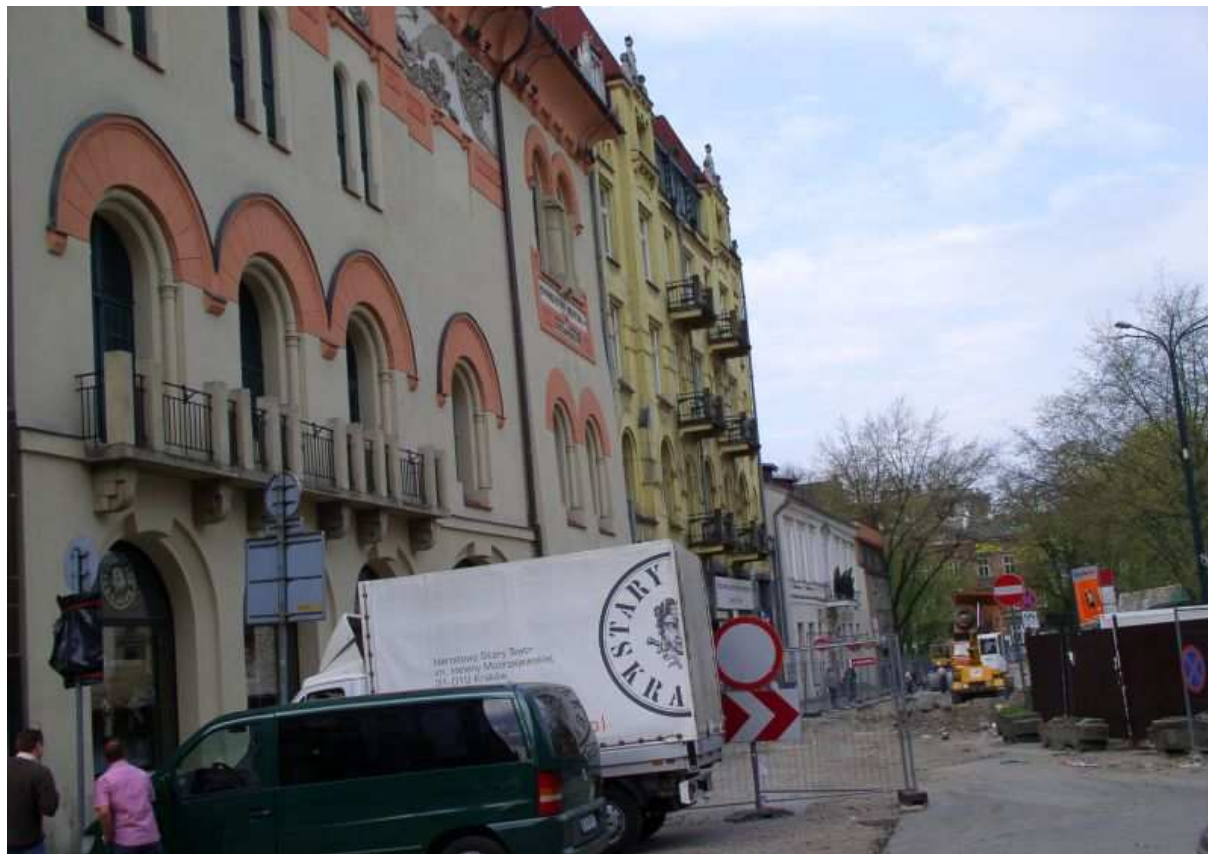
Fot. nr 145. Od ulicy Szczepańskiej w stronę Plant. 17.04.09