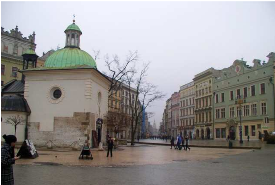
Fot. nr 100. Z kościołkiem św. Wojciecha z lewej strony. 11.01.11