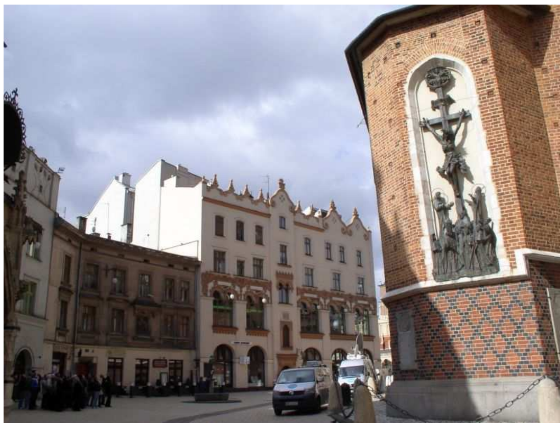
Fot. nr 225 (225-226). Plac Mariacki z kamienicą Czynciela w tle. 09.04.11