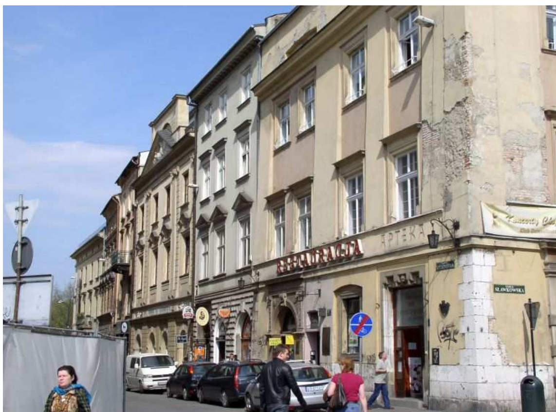
Fot. nr 159. W stronę ulicy Szczepańskiej; w narożu kamienica Pod Gruszką. 17.04.09