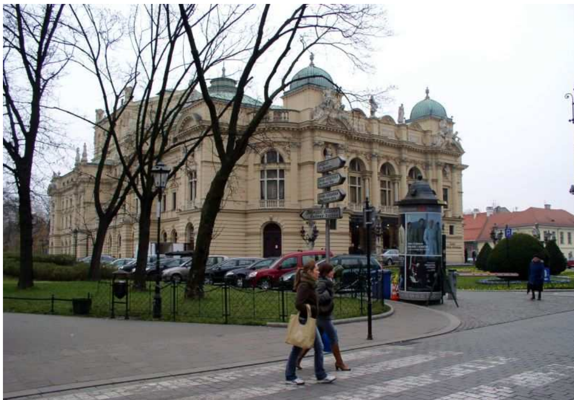
Fot. nr 163. Teatr Juliusza Słowackiego– widok z naroża Plant i ul. Szpitalnej. 04.12.09