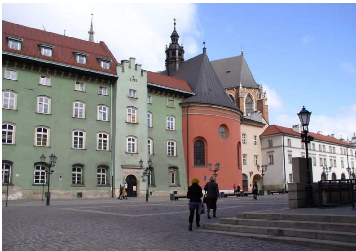
Fot. nr 206. Z kościołem św. Barbary pośrodku. 09.04.11