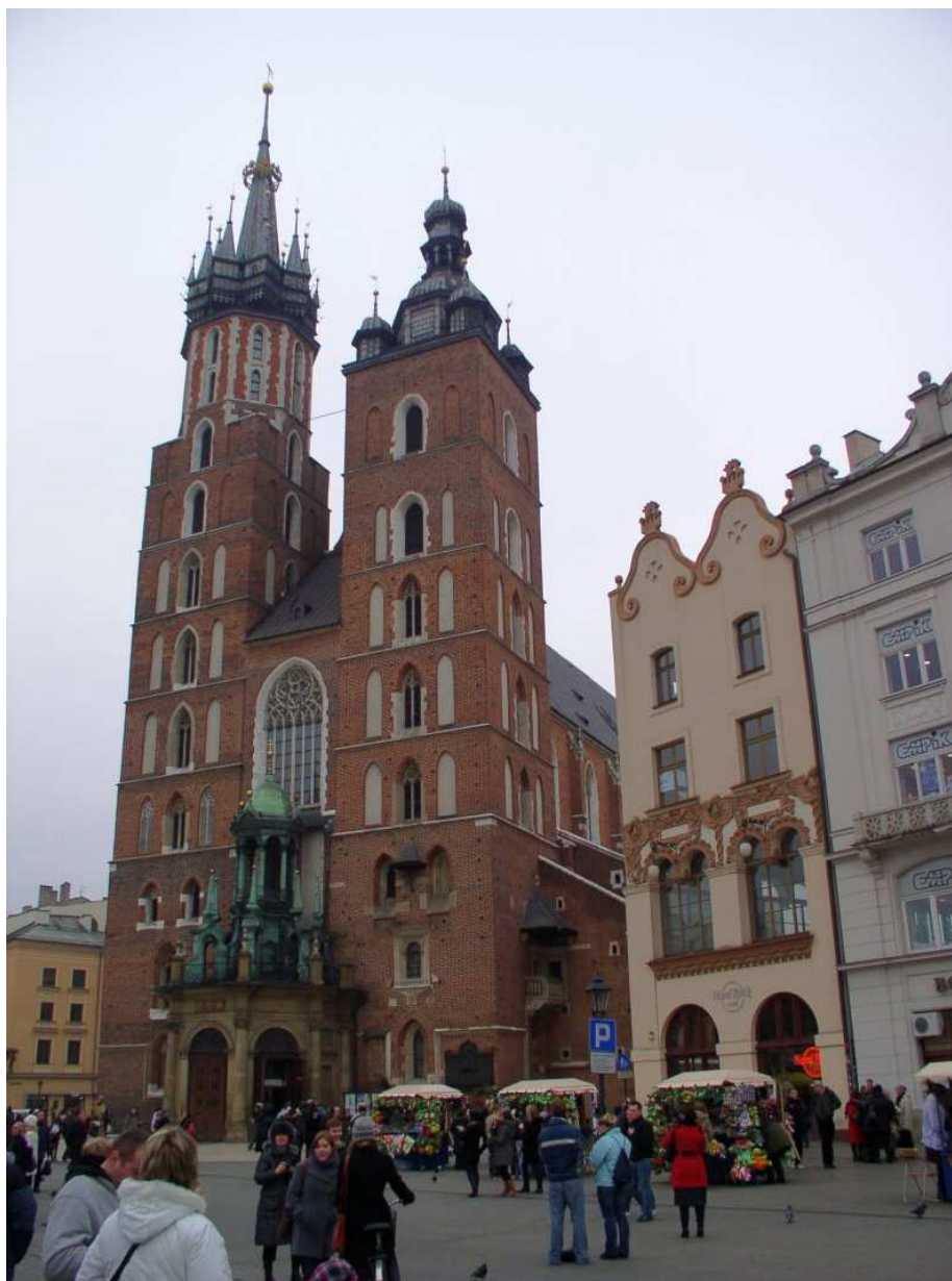
Fot. nr 50. Fasada kościoła Mariackiego, obiektu przedkolacyjnego, na co wskazuje jego ukośne usytuowanie stosunku do osi Rynku. 04.12.09