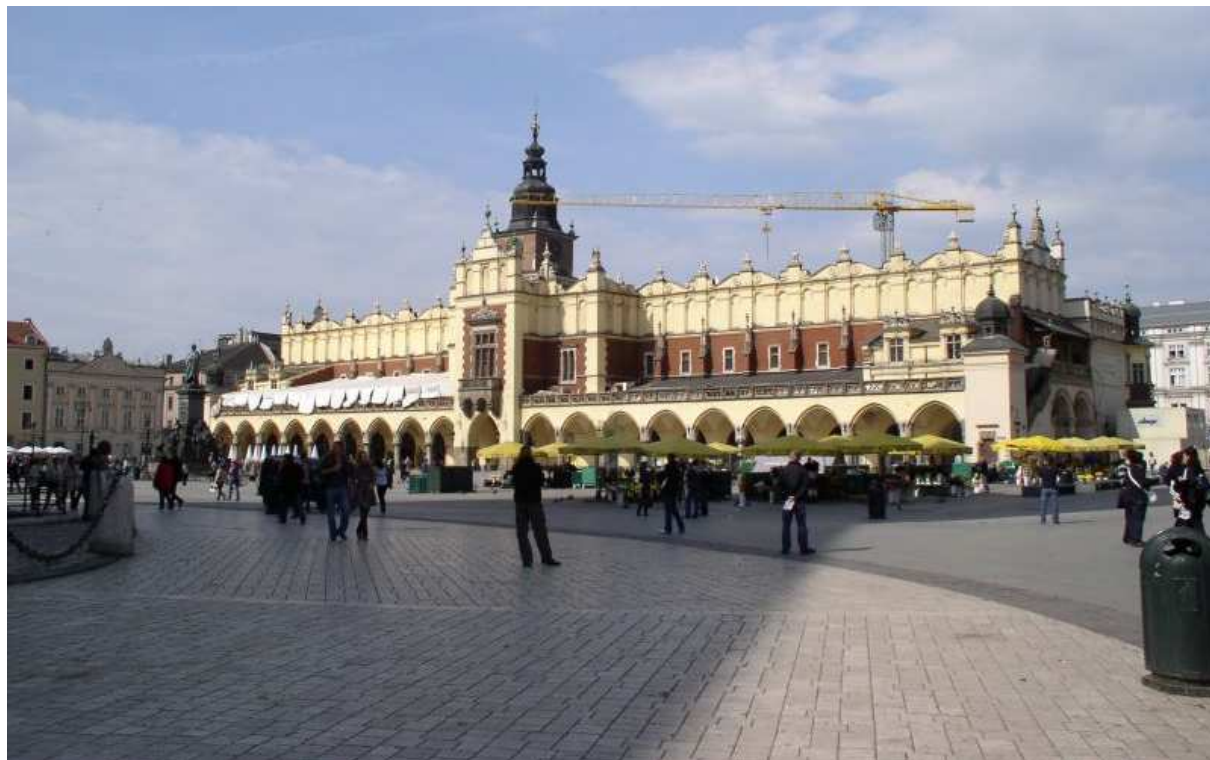
Fot. nr 54 (54-57). Sukiennice – widoki od strony ulicy Floriańskiej. 17.04.09