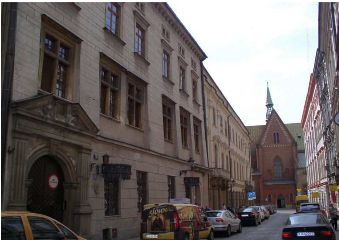
Fot. nr 120 (120-121). Widoki z wlotu ulicy Gołębiej. 17.04.09