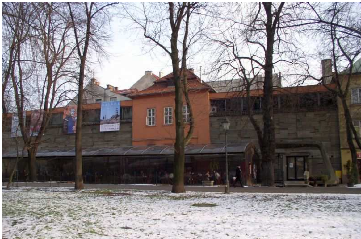
Fot. nr 140. Klasycystyczny rodzynek pośrodku Bunkra Sztuki. 28.01.11