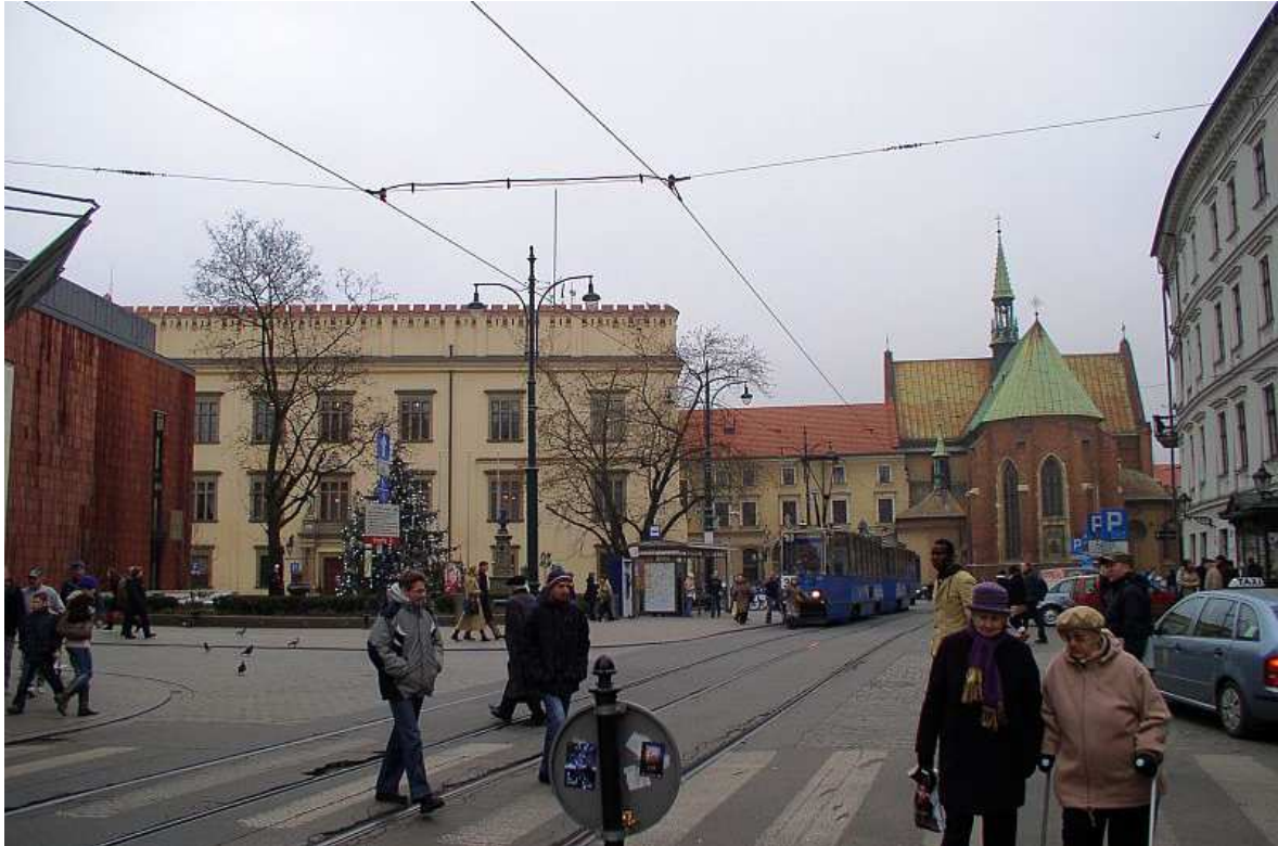
Fot. nr 103. Plac Wszystkich Świętych – widok z Placu Dominikańskiego. 04.12.09