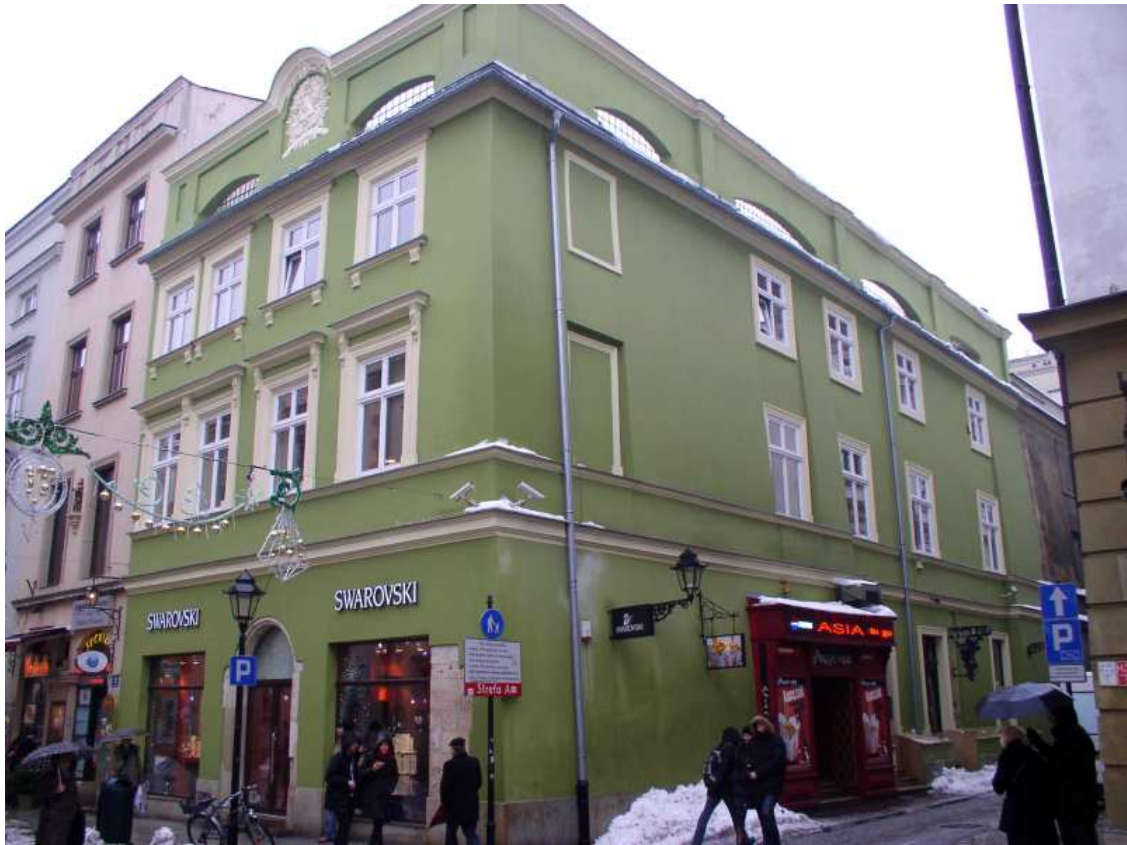
Fot. nr 41 (40-41). Narożnik z ulicą św. Tomasza; kamienica pod nr 12. 07.12.10