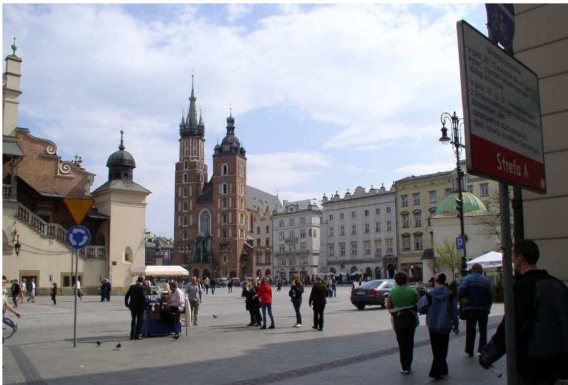
Fot. nr 91. Tradycyjne ujęcie Rynku – widok z wylotu ulicy Brackiej. 17.04.09