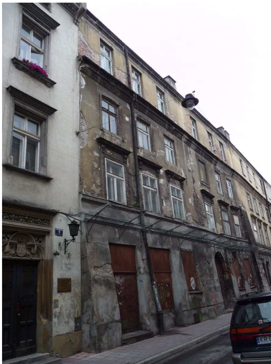
Fot. nr 150. Rudera z ulicy Jagiellońskiej 9. 25.07.11