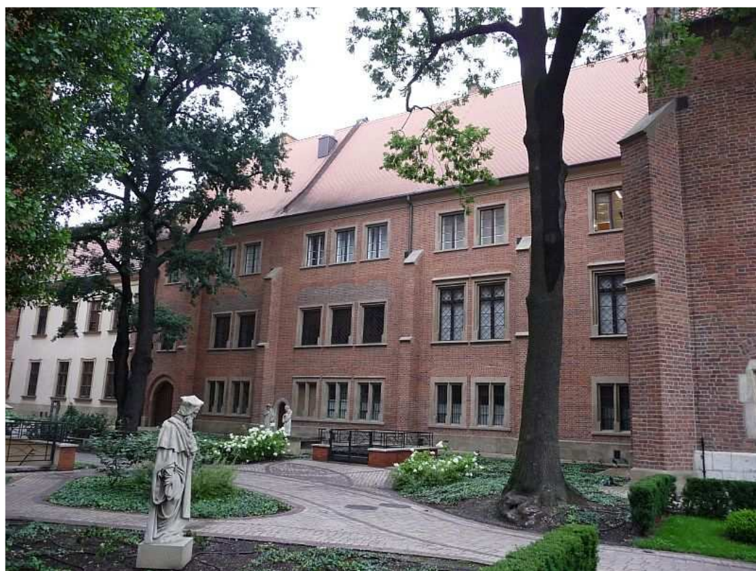
Fot. nr 133. Zrekonstruowany fragment zabudowań Collegium Maius od strony dawnego ogrodu. 25.07.11