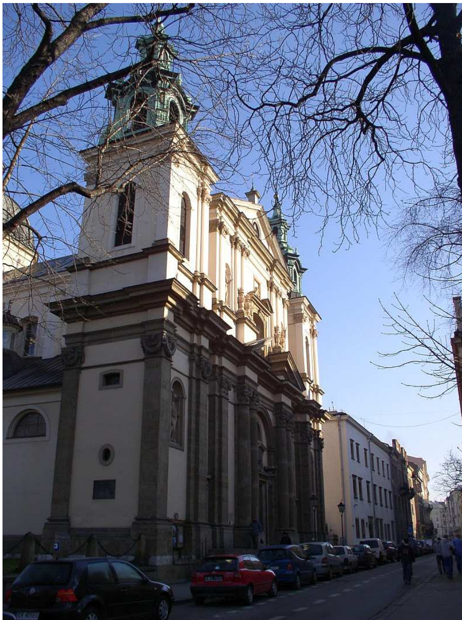
Fot. nr 126. Barkowy kościół św. Anny przylegający do Plant. 26.11.10