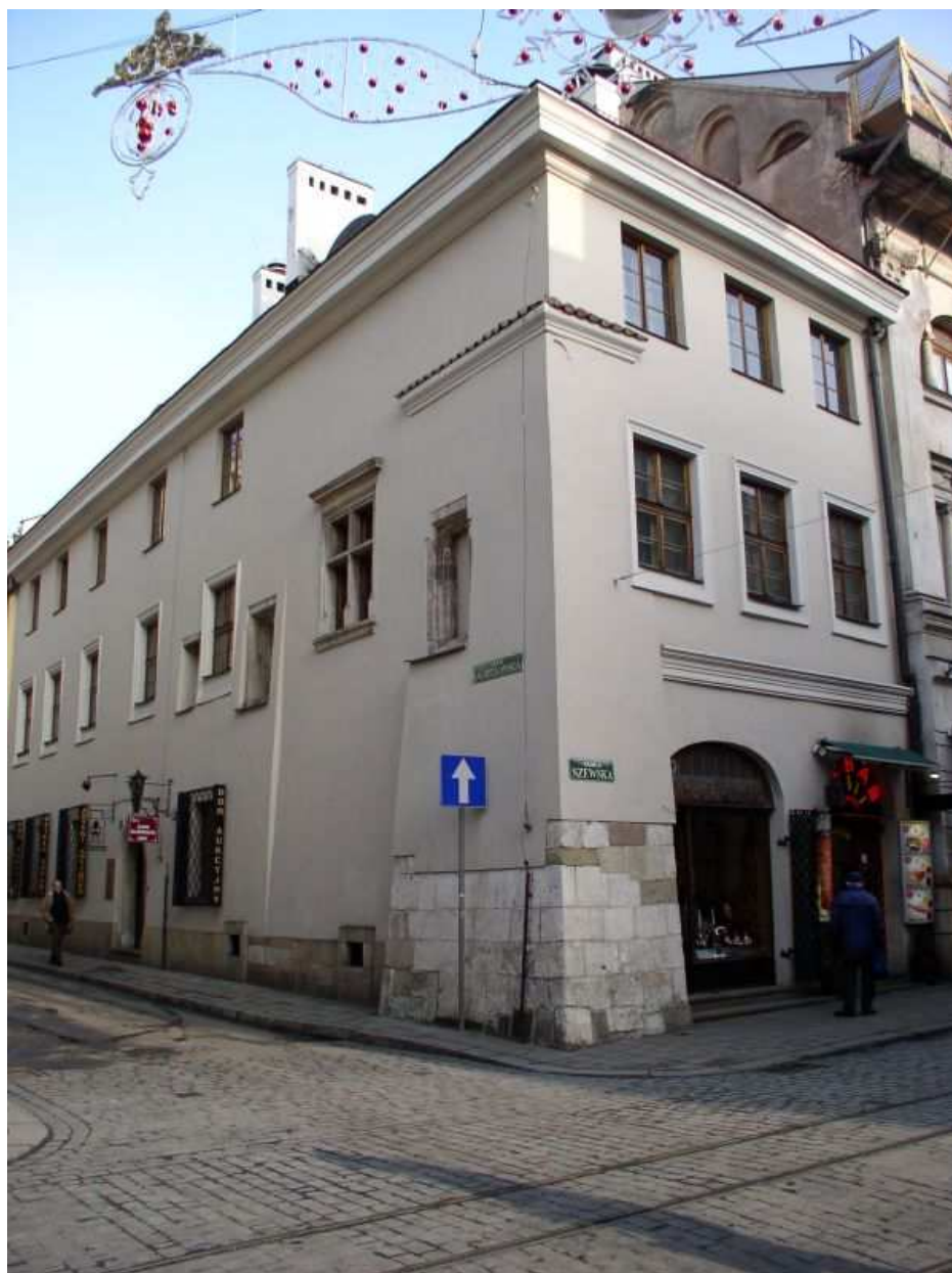
Fot. nr 141. Udana rekonstrukcja kamieniczki z naroża ulic: Szewskiej i Jagiellońskiej. 28.01.11