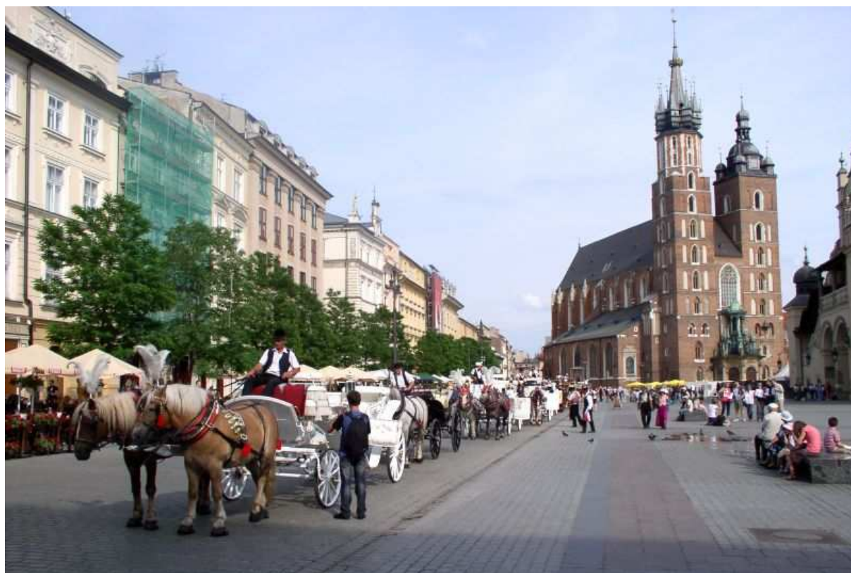
Fot. 53. Linia A-B Rynku i Kościół Mariacki – widok od ulicy Szczepańskiej. 16.06.11