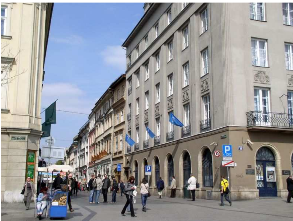
Fot. nr 77. Ulica Szewska. 17.04.09