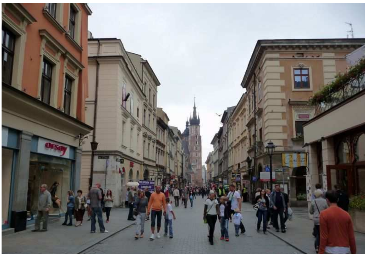
Fot. nr 38 (38-39). Widoki od ulicy św. Marka w stronę Kościoła Mariackiego. 26.07.11