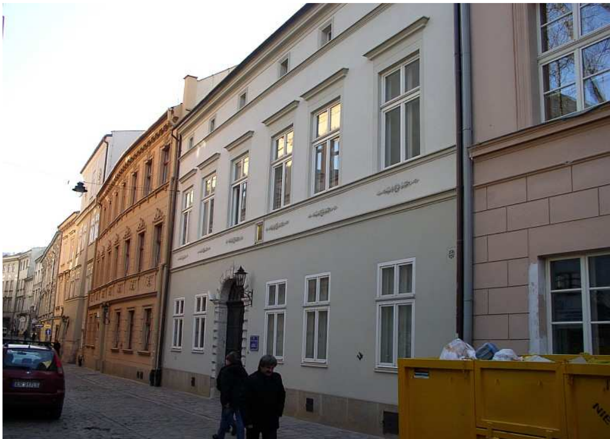
Fot. nr 122. Zabudowania tzw. „Gołębnika” UJ z ulicy Gołębiej – widok od strony ulicy Jagiellońskiej w stronę ulicy Wiślniej 26.11.10