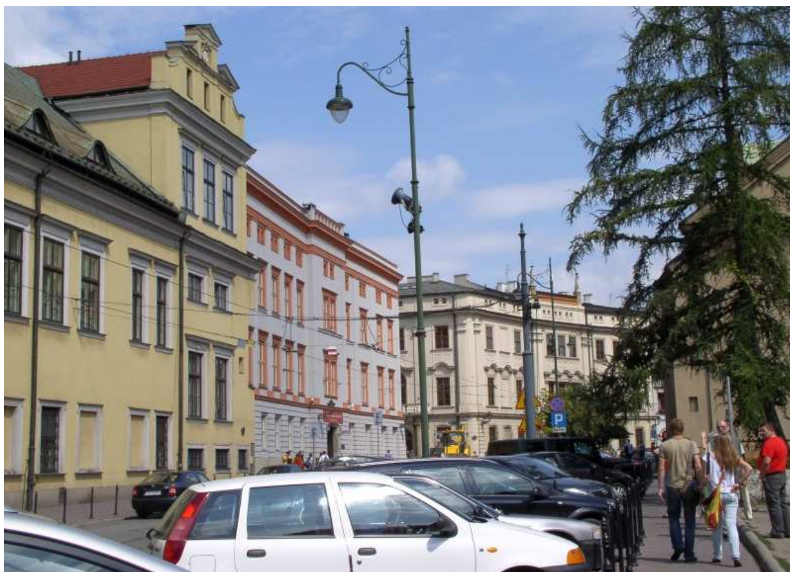
Fot. nr 108. Ulica Franciszkańska spod Pałacu Biskupiego. 06.08.09