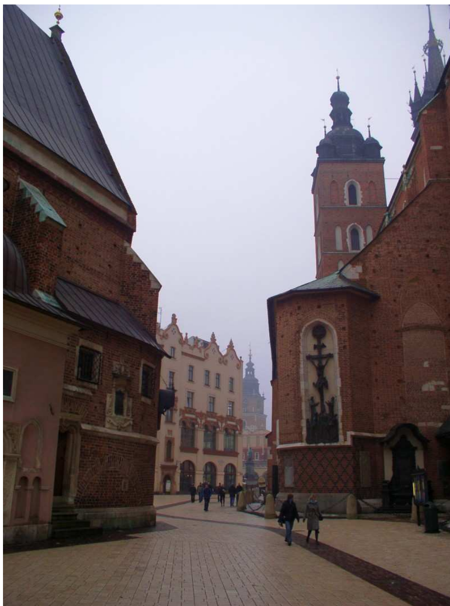
Fot. nr 226. Z kamienicą Czynciela i wieżą ratuszową w tle. Z prawej fragment Kościoła Mariackiego, z lewej kościoła św. Barbary. 11.01.11