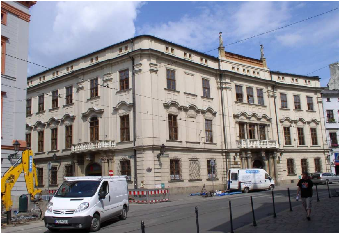
Fot. nr 110. Pałac Larischa, również przebudowany w duchu klasycystycznym. 06.08.09