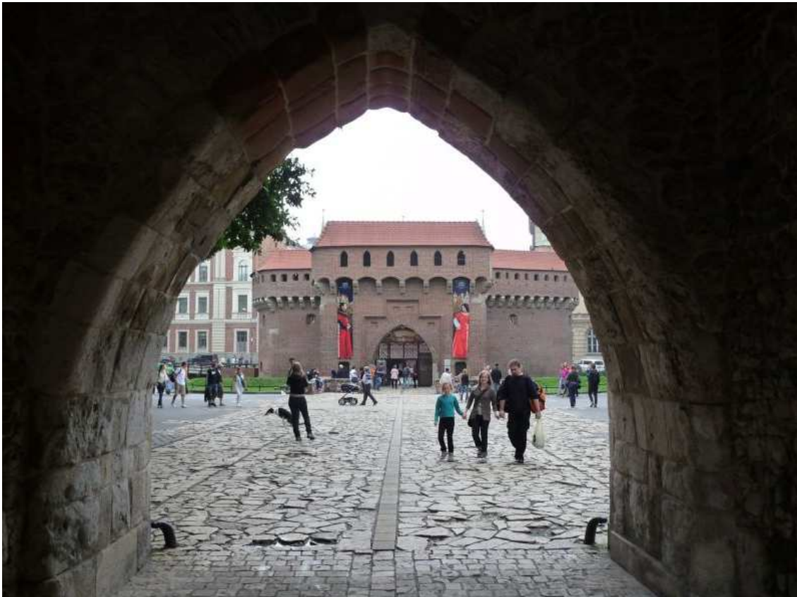
Fot. nr 18. Spod Bramy Floriańskiej w stronę Barbakanu. 26.07.11