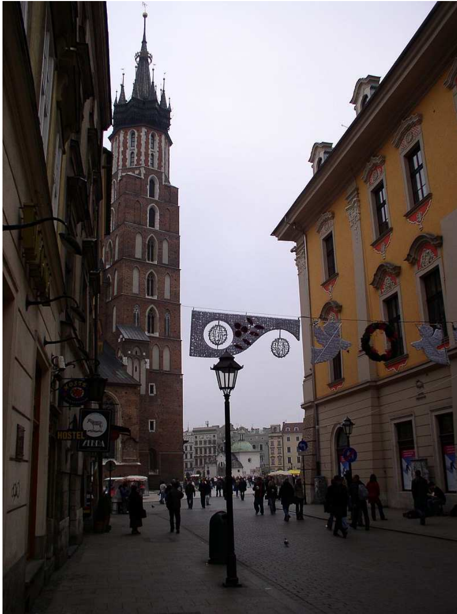
Fot. nr 46. W stronę Kościoła Mariackiego i Rynku Głównego. 04.12.09