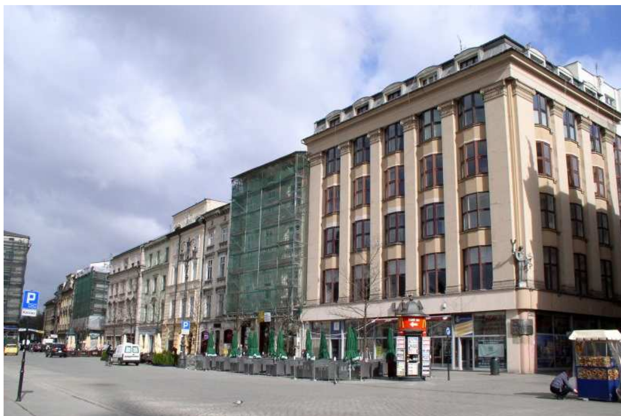
Fot. nr 71 (71-72). Fragment linii A-B, czyli południowej pierzei Rynku, pomiędzy ulicami: św. Jana i Sławkowską – widok od strony Sukiennic. 09.04.11