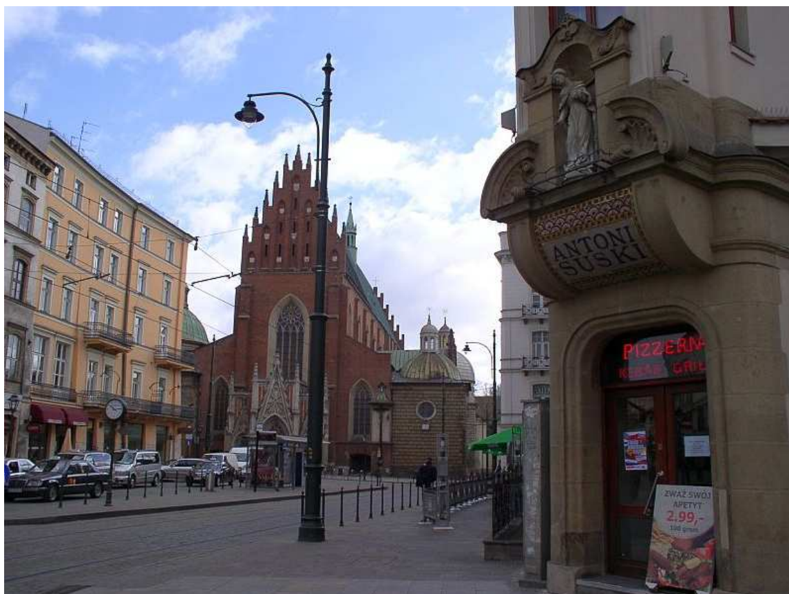
Fot. nr 239. Kościół Dominikanów – widok z naroża z ulicą Grodzką. 09.04.11