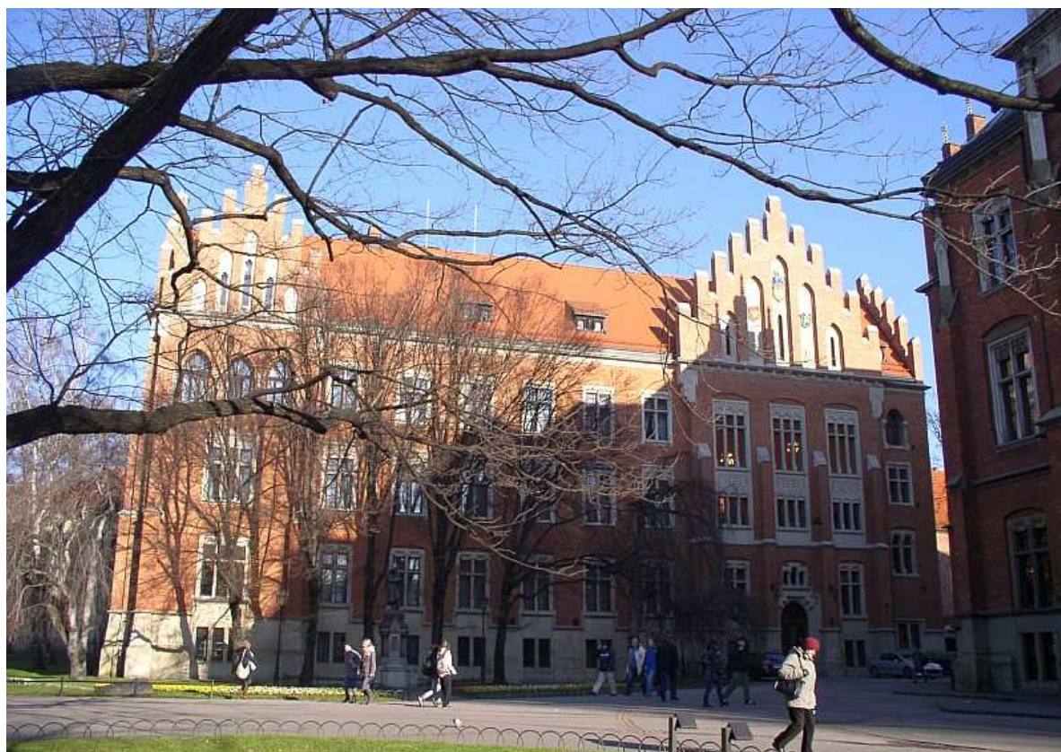
Fot. nr 137 (137-138). Neogotycki gmach Collegium Witkowskiego. 26.11.10