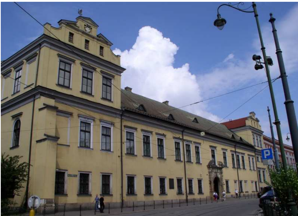
Fot. nr 111 (111-112). Pałac Biskupi. 06.08.09