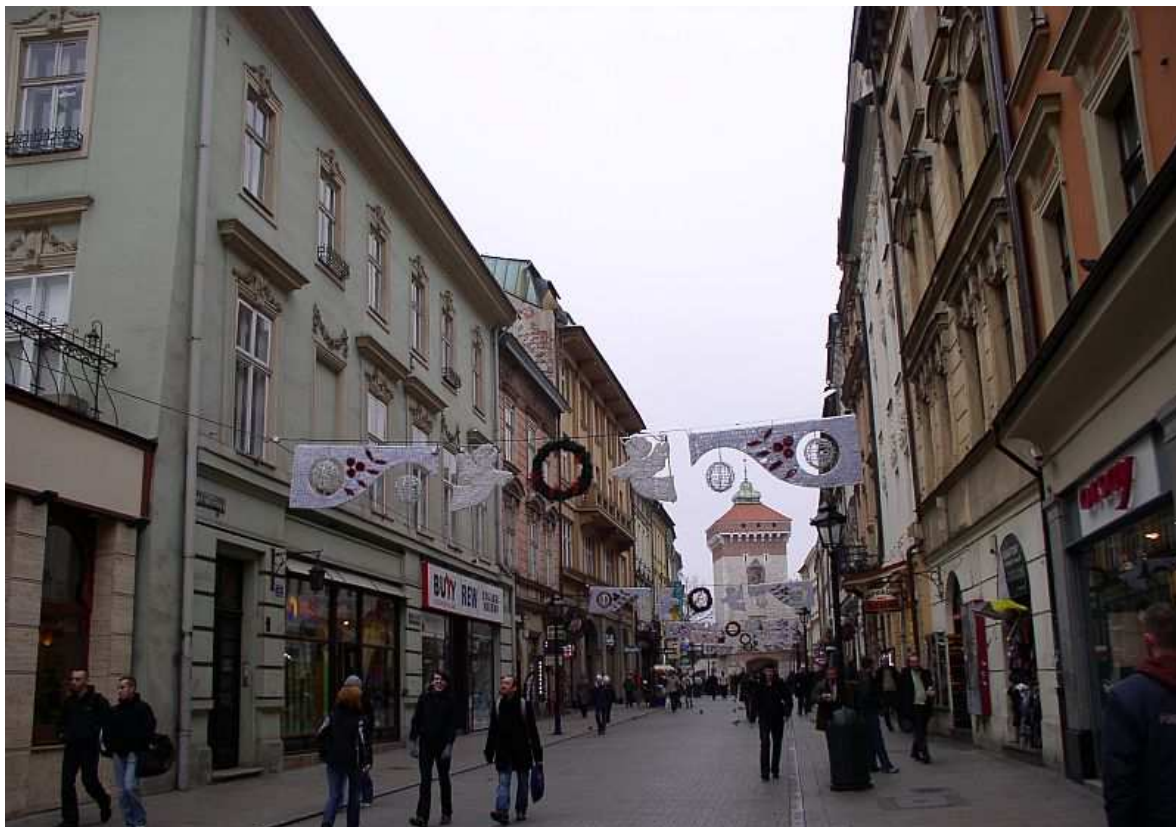
Fot. nr 34. Fragment ulicy Floriańskiej od ulicy św. Marka. 04.12.09