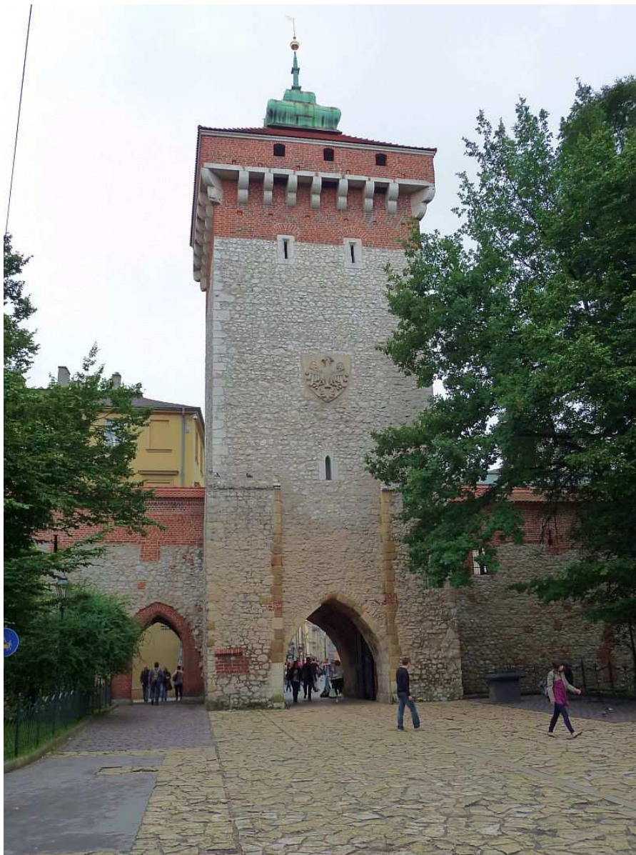
Fot. nr 20. Jeszcze jeden widok od strony Barbakanu. 26.07.11