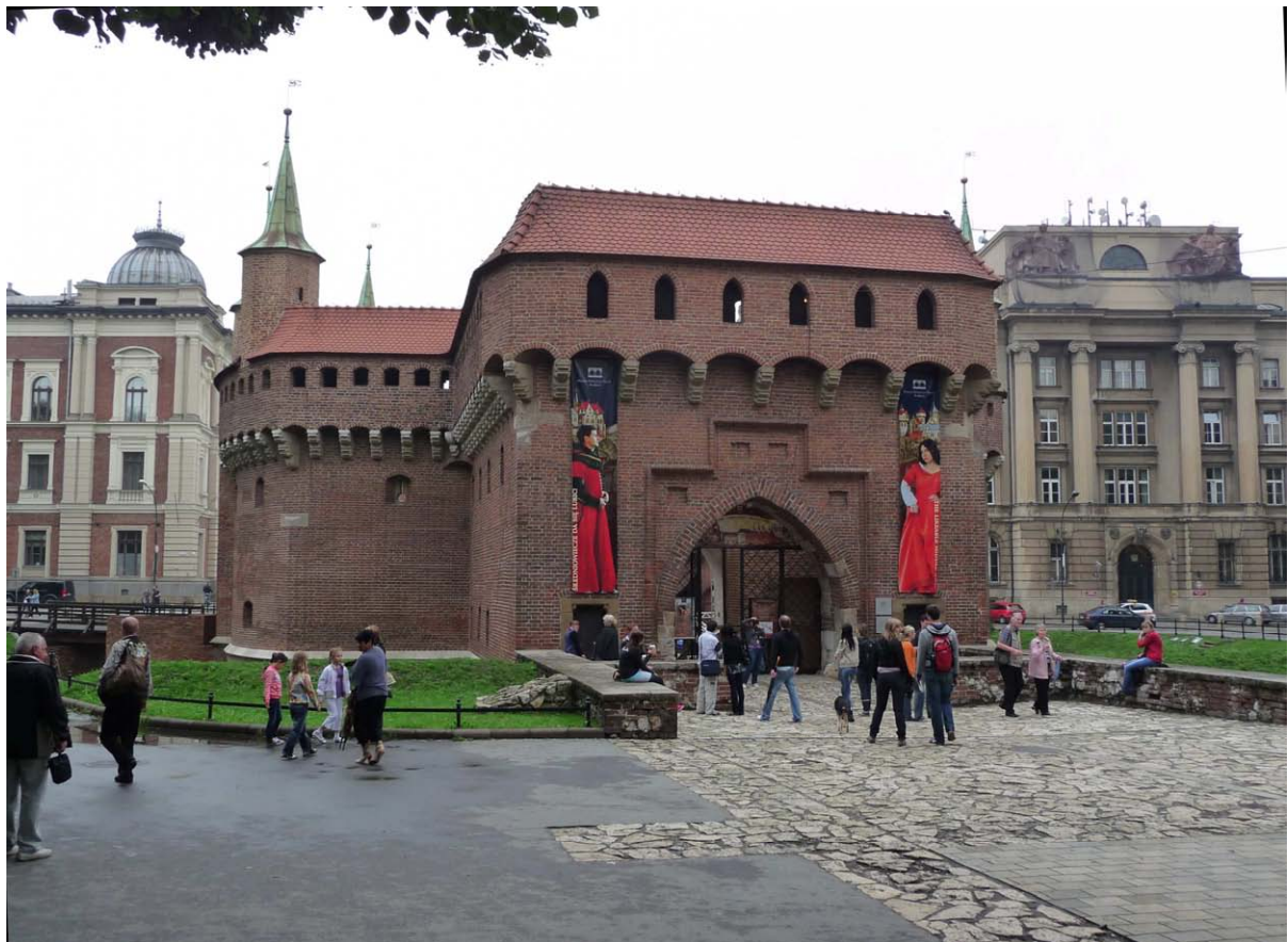
Fot. nr 16. Barbakan z narysem dawnej szyi, odtworzonym na poziomie bruku. 26.07.11