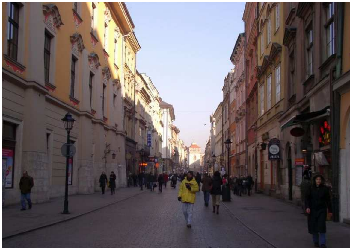
Fot. nr 37. Widok z początku ulicy w stronę Bramy Floriańskiej. 27.11.09