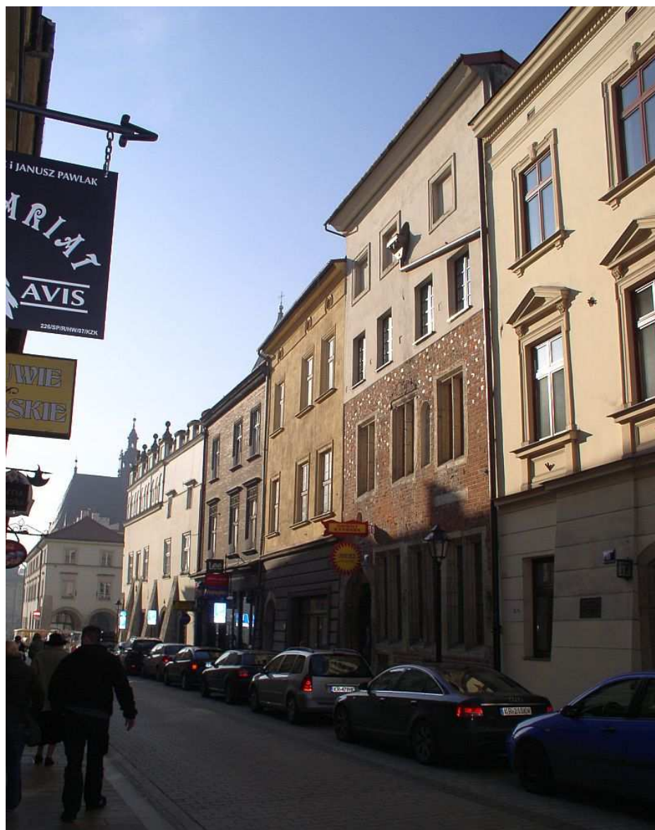
Fot. nr 175. Początkowy fragment zabudowy ulicy Szpitalnej o numerach: 1-7. 27.11.09