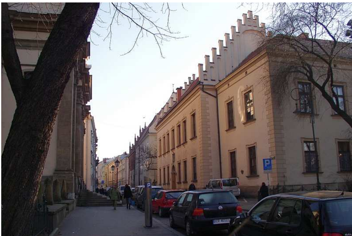
Fot. nr 124. Panorama ulicy z Plant. Z lewej gmach Collegium Nowodworskiego. 26.11.10