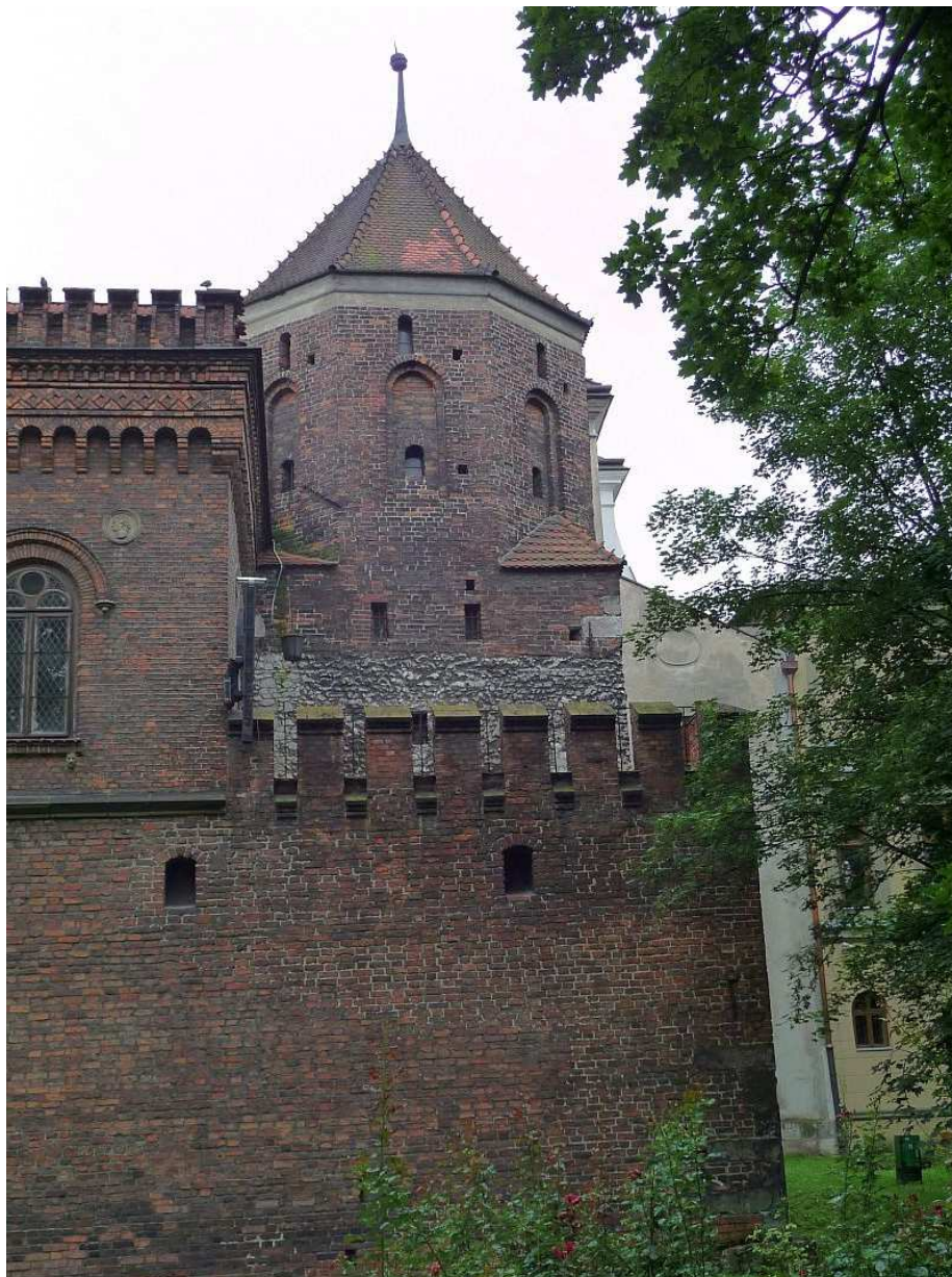
Fot. nr 10. Baszta Ciesielska. 26.07.11