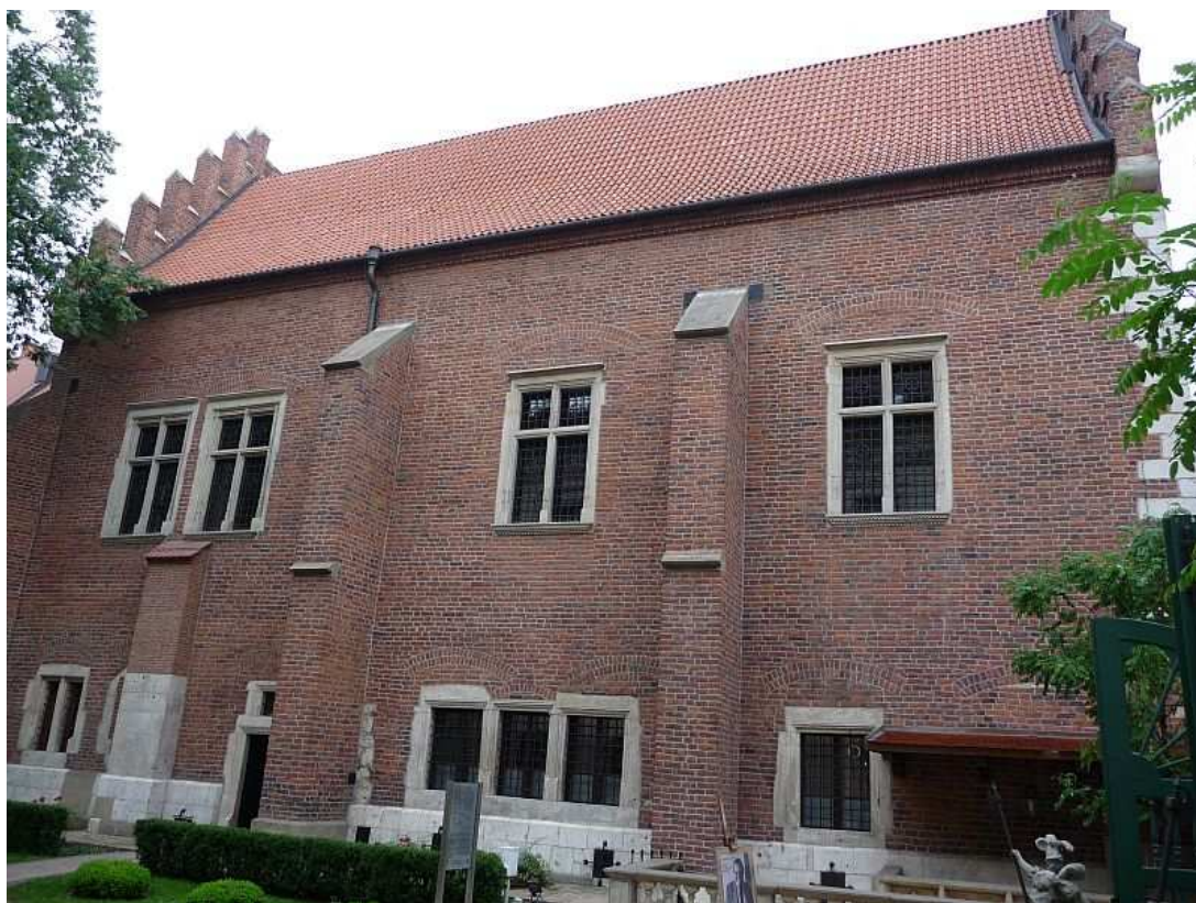
Fot. nr 132. Ściana boczna Librarii (biblioteki) – widok od strony ogrodu. 25.07.11