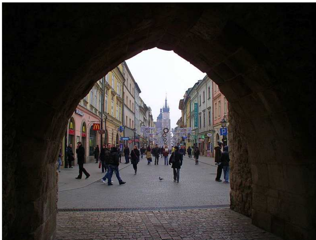
Fot. nr 32 (32-33). Ulica Floriańska – widoki z przejścia pod Bramą Floriańską. 04.12.09