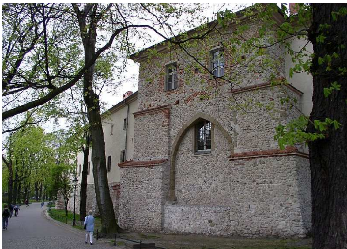
Fot. nr 188. Brama Rzeźnicza, jedna z pierwszych bram w systemie obronnym Krakowa, potem zastąpiona przez Bramę Mikołajską. 17.04.09