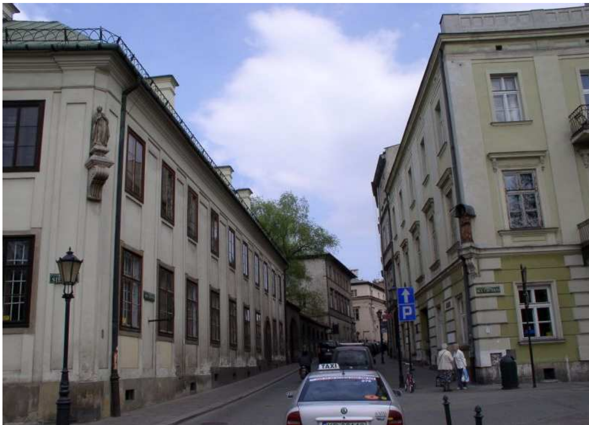
Fot. nr 197. Wzdłuż ulicy św. Krzyża. 17.04.09