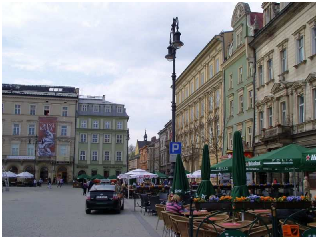
Fot. nr 81. Południowo-zachodni narożnik Rynku, z ulicą Wiślną w tle. 17.04.09