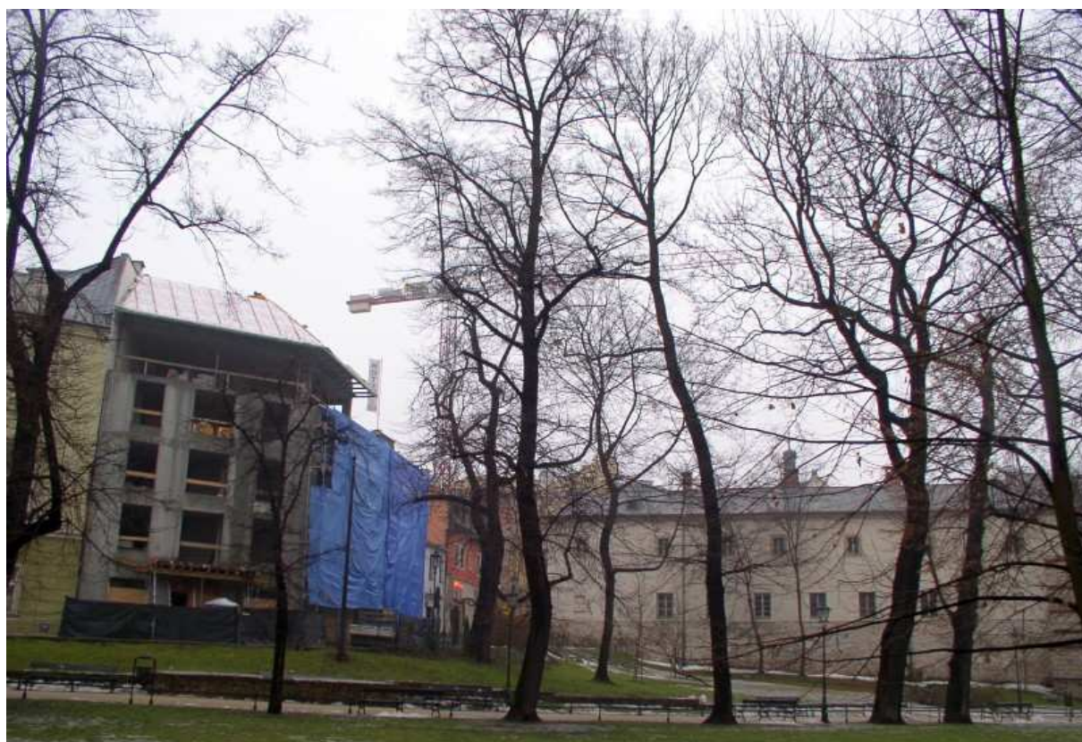
Fot. nr 194. I powstające w tym samym miejscu współczesne straszyldeko. 11.01.11