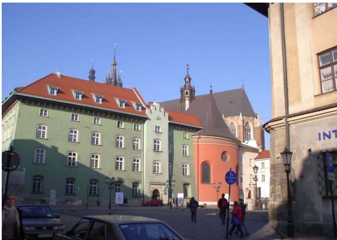
Fot. nr 205 (205-207). Zachodnia pierzeja Małego Rynku – widok z naroża z ulicą Sienną. 27.11.09