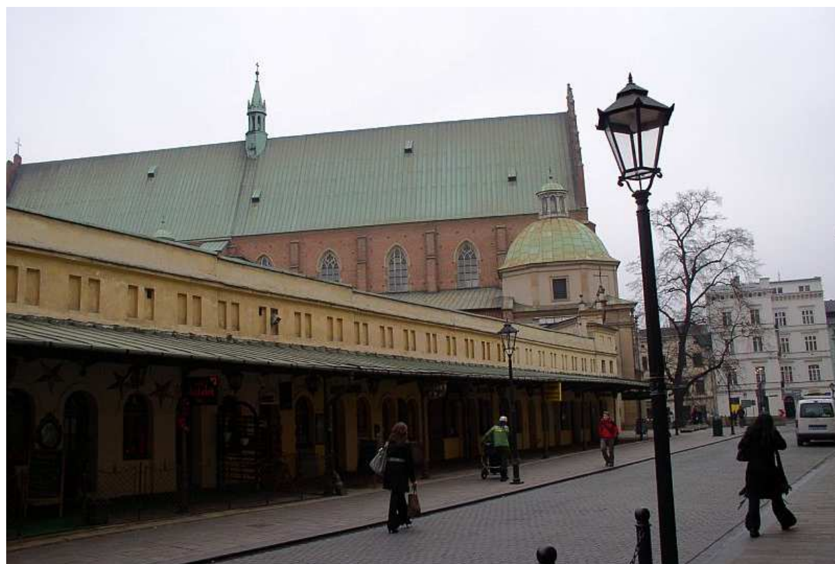
Fot. nr 235 (235-236). Kramy dominikańskie. 04.12.09