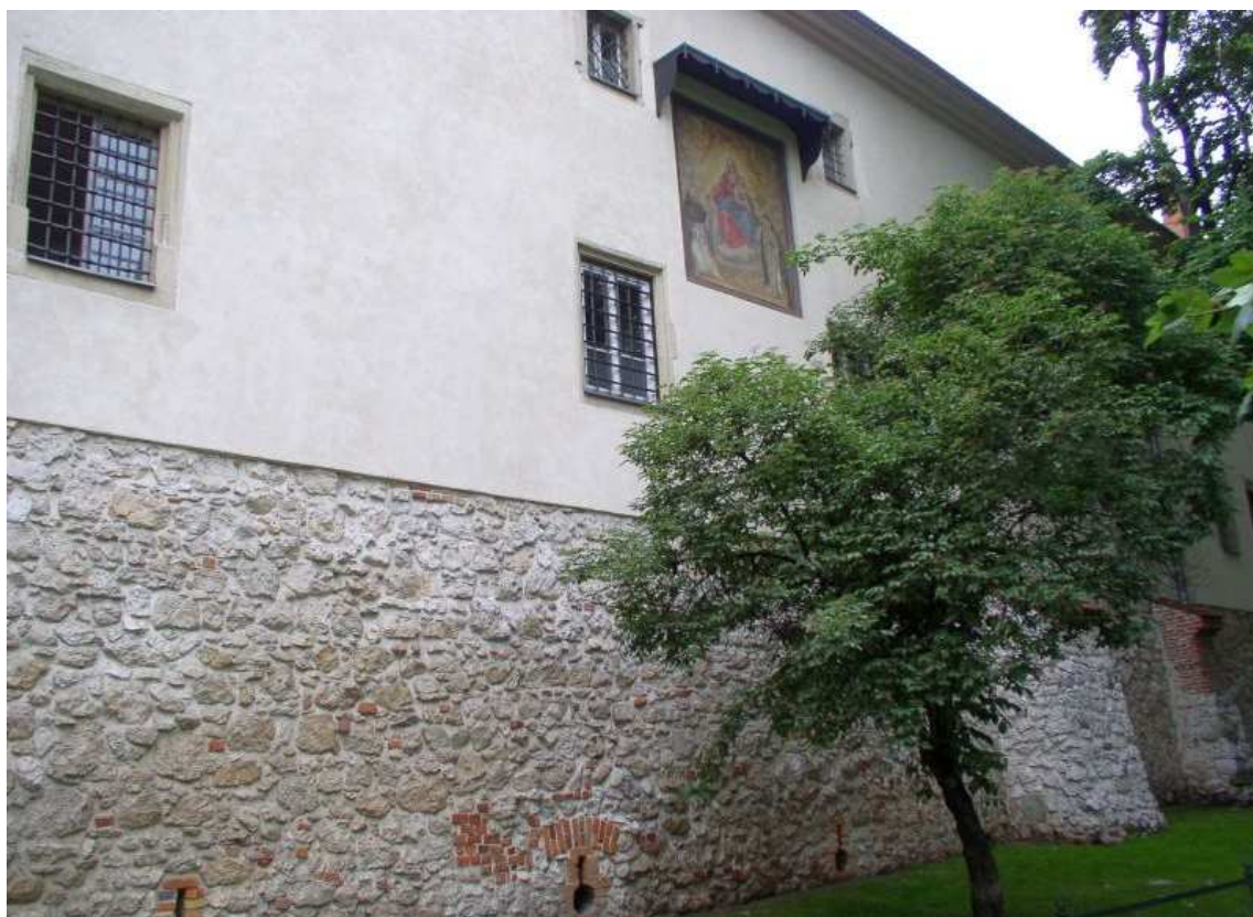
Fot. nr 189. Ołtarz w murze klasztoru – widok od strony Plant. 29.06.09