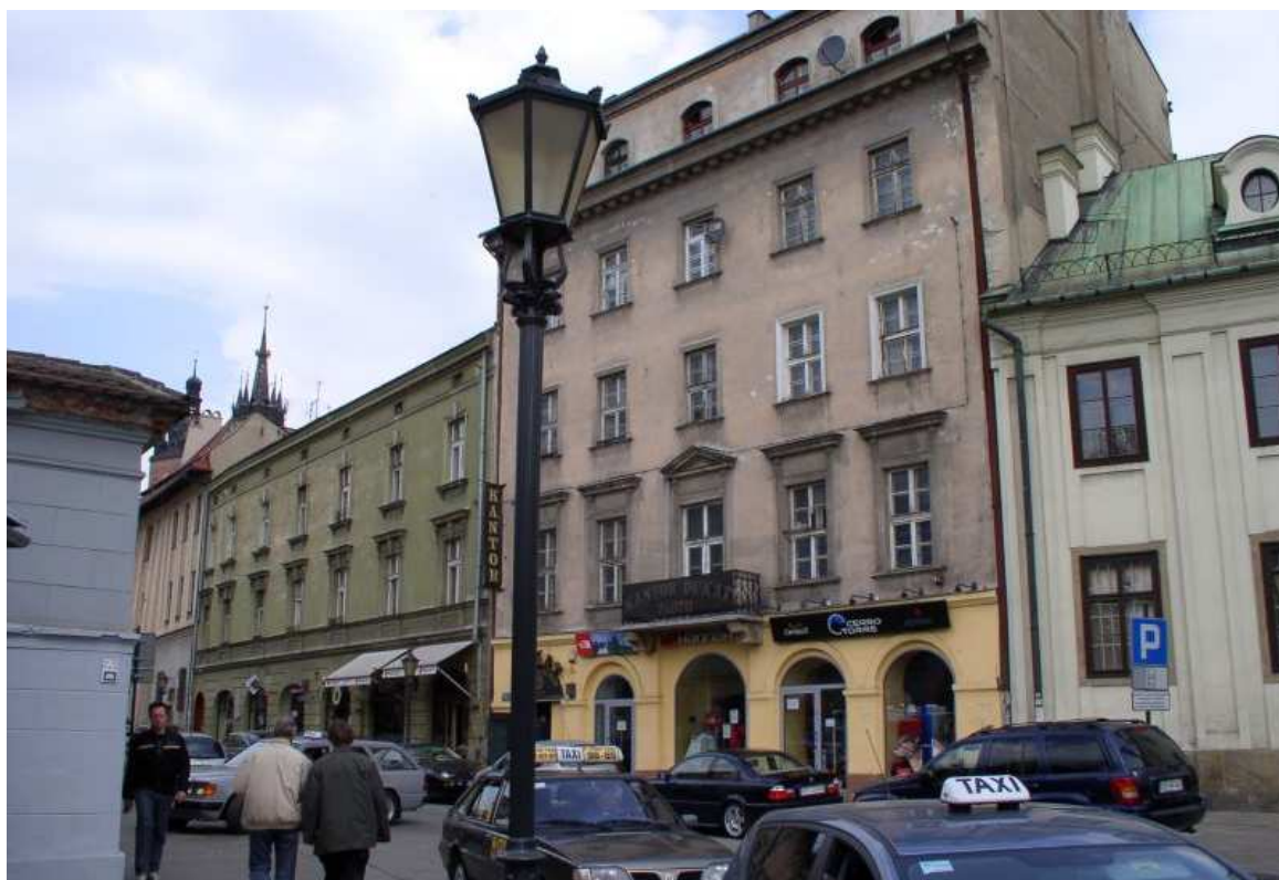
Fot. nr 199. Galicyjska zabudowa pod nr: 12 i 14. 17.04.09