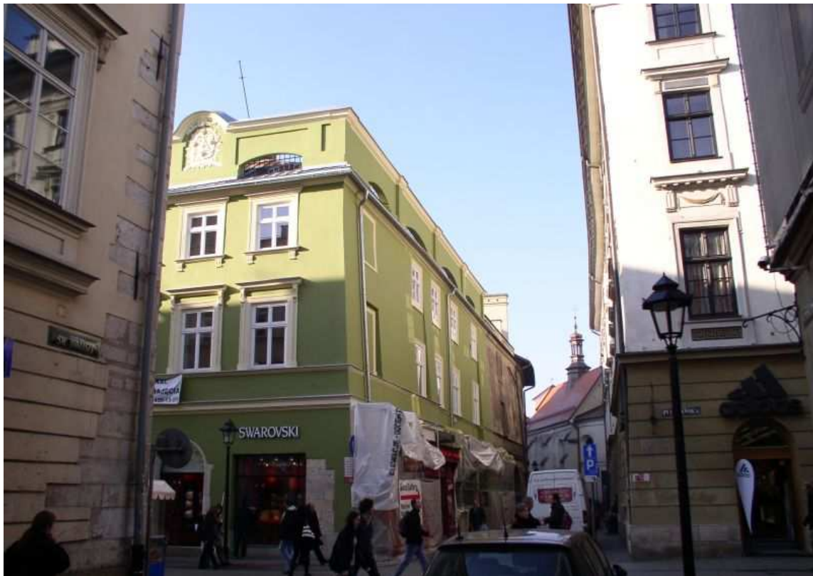
Fot. nr 42. Widok wzdłuż ulicy św. Tomasza, z kościołem św. Jana w tle. 27.11.09