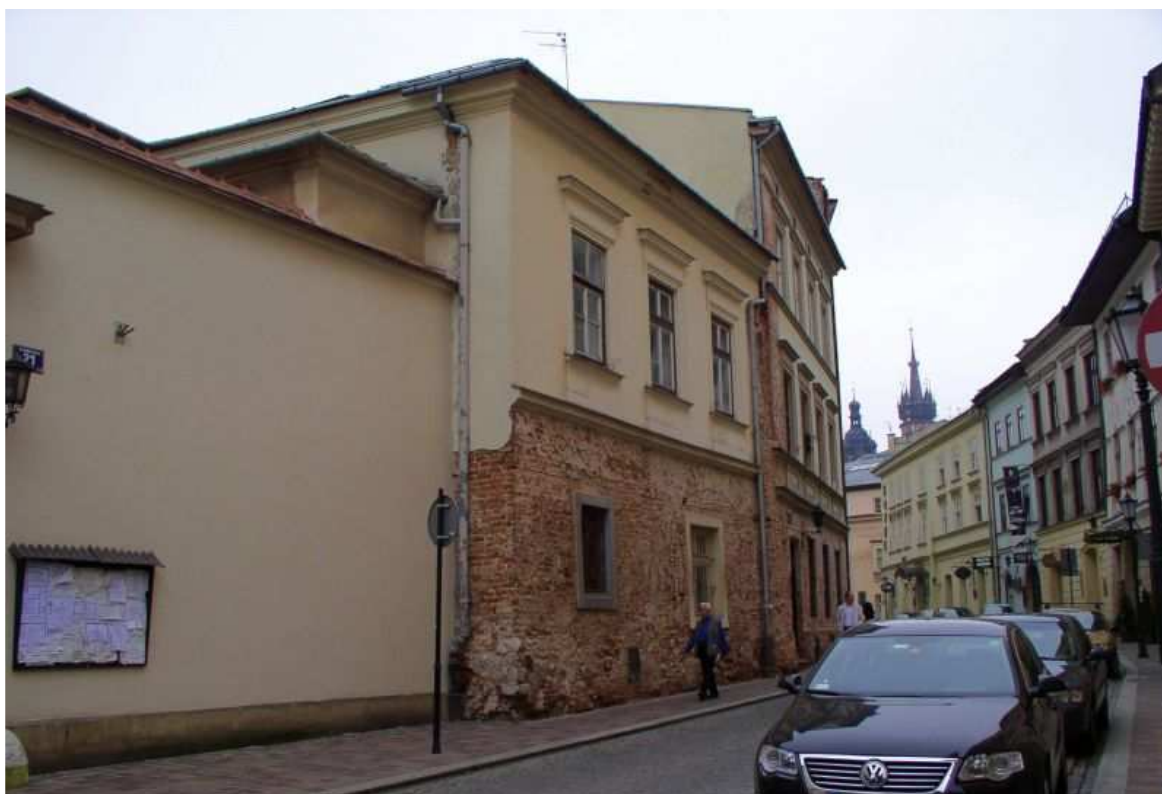
Fot. nr 181. Na pierwszym planie przelotowa kiedyś kamienica pod nr 19, której się łączyła ulice: Mikołajską i Na Gródku. 29.06.09