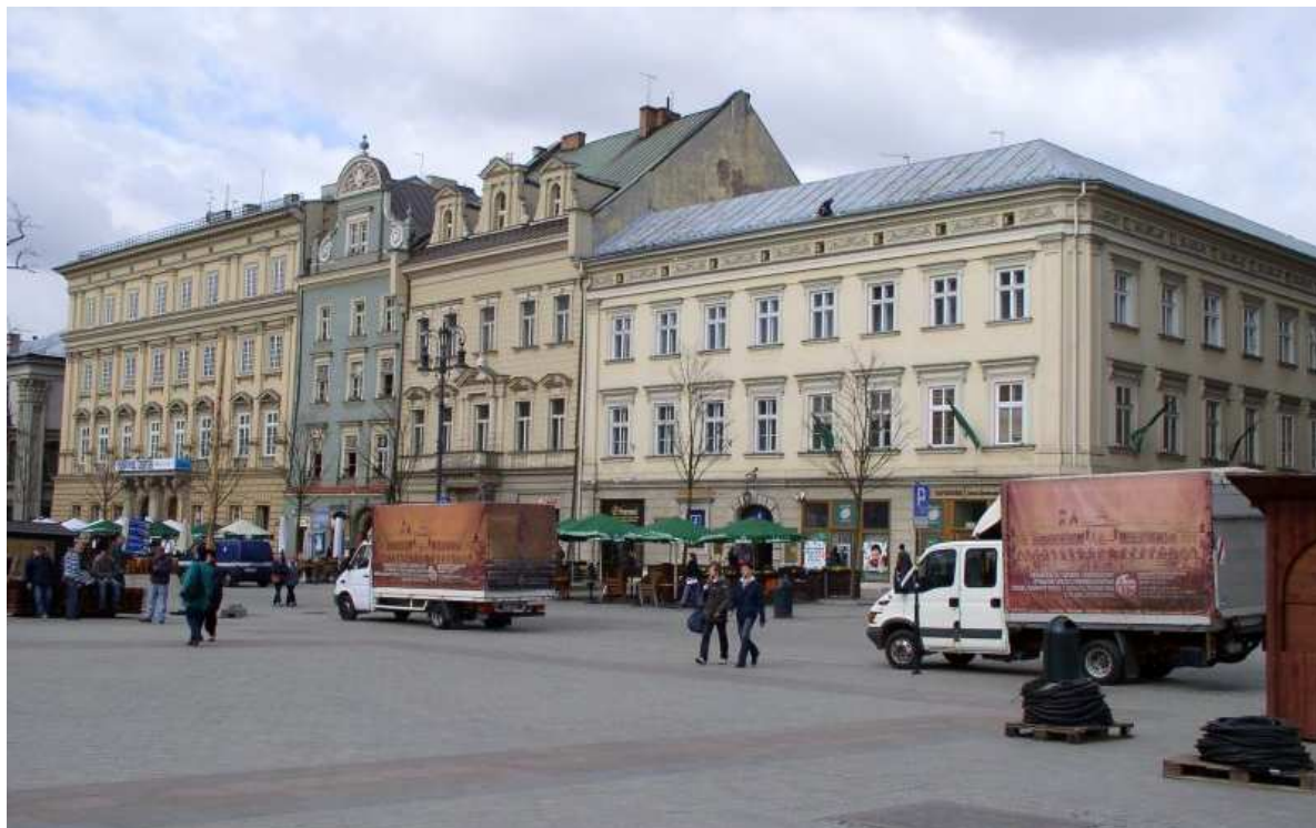
Fot. nr 83. Fragment zachodniej pierzei Rynku między ulicami: Szewską i św. Anny. 09.04.11