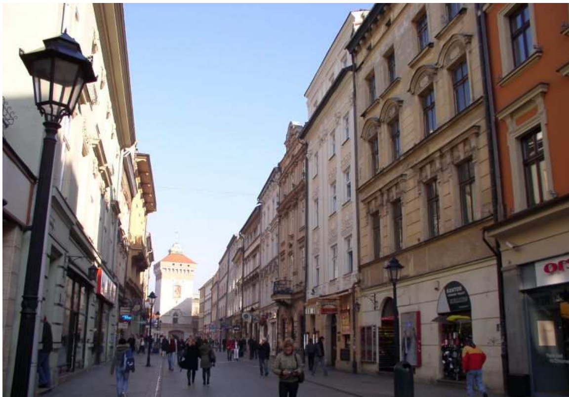
Fot. nr 36. Druga z prawej kamienica Jana Matejki. 27.11.09