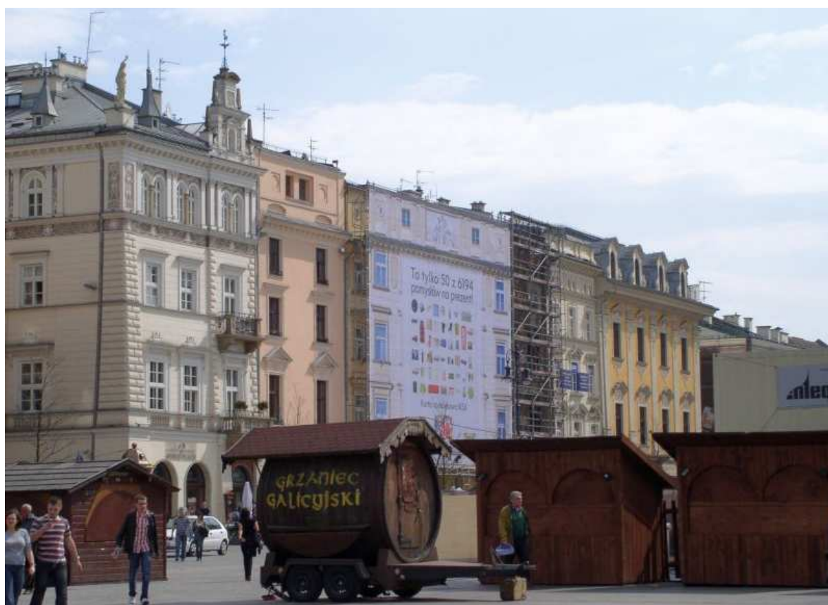
Fot. nr 63. Fragment linii A-B od strony (dawnej Syndyktówki) Sukiennic. 17.04.09