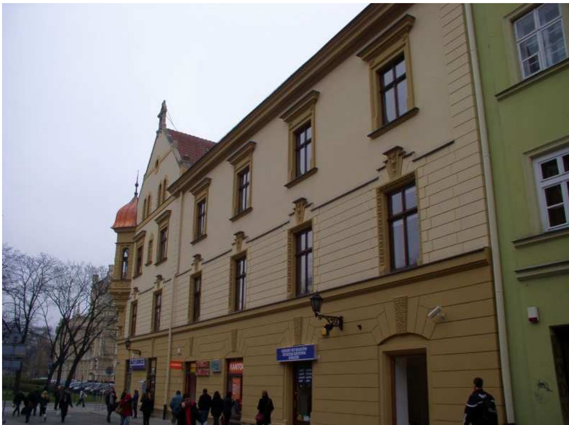
Fot. nr 165. Niedawno odrestaurowana, eklektyczna kamienica z naroża ulic: Pijarskiej i Szpitalnej. 04.12.09