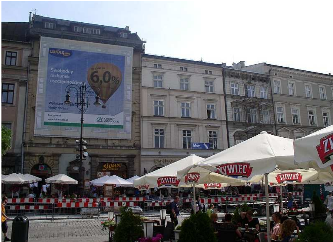
Fot. nr 90. Z kamienicą pod nr 22 (pierwsza z lewej), która w tym czasie stała się banerem reklamowym. 16.06.11