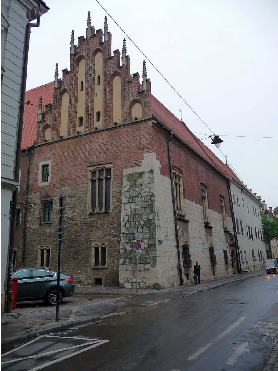
Fot. nr 125. Gotycka kamienica Pęcherza w kompleksie Collegium Maius, dziś aula UJ. 25.07.11