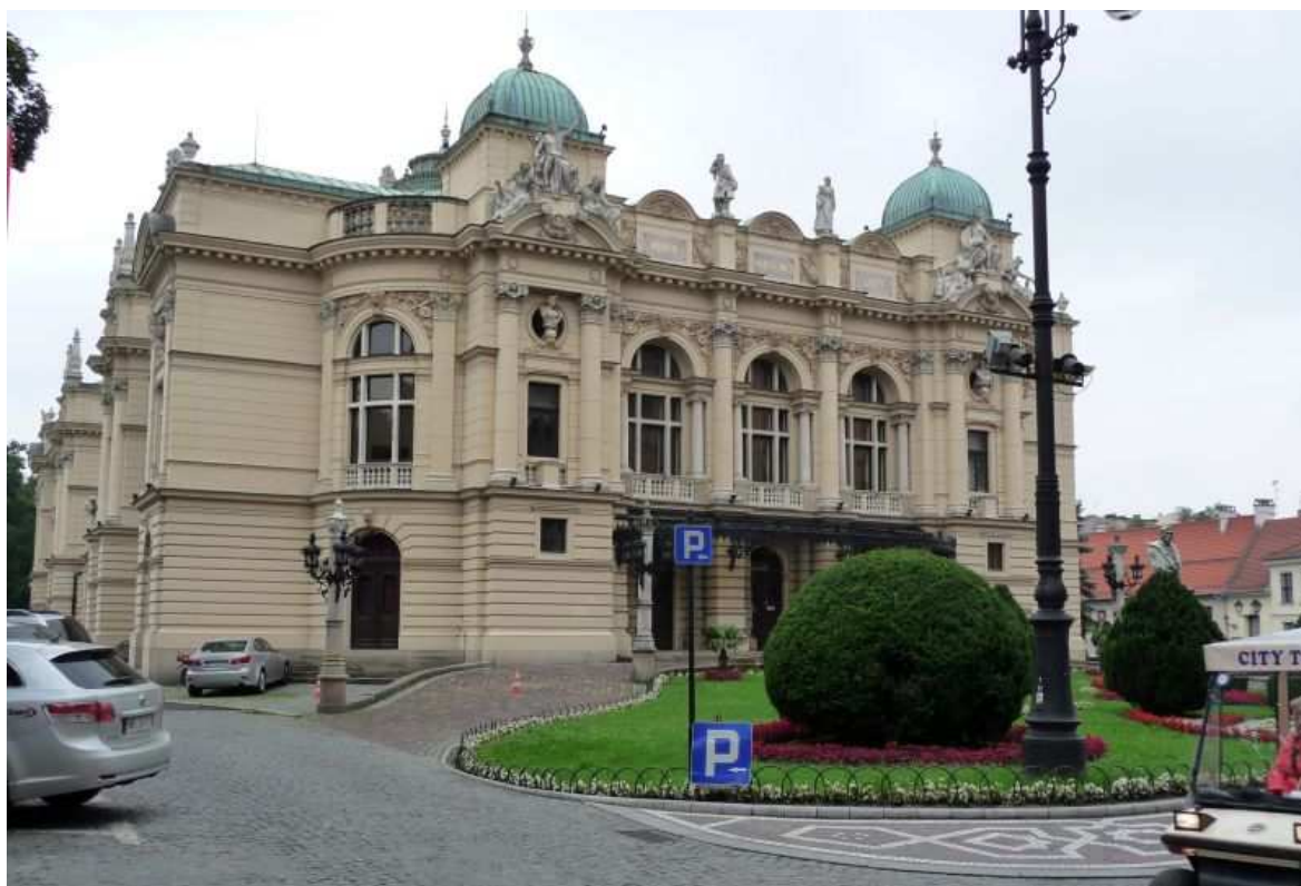
Fot. nr 164. Fasada Teatru od strony ulicy Szpitalnej. 26.07.11