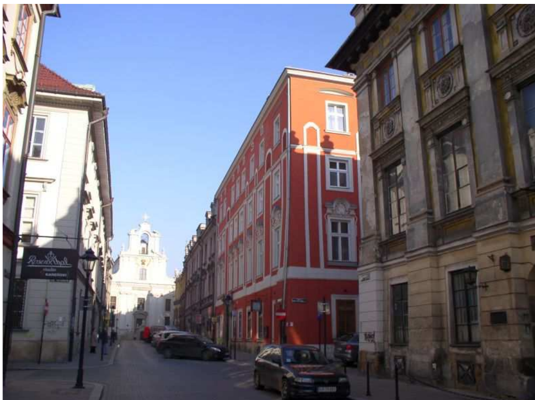
Fot. nr 160. W stronę kościoła Pijarów – widok od ulicy św. Marka. 27.11.09