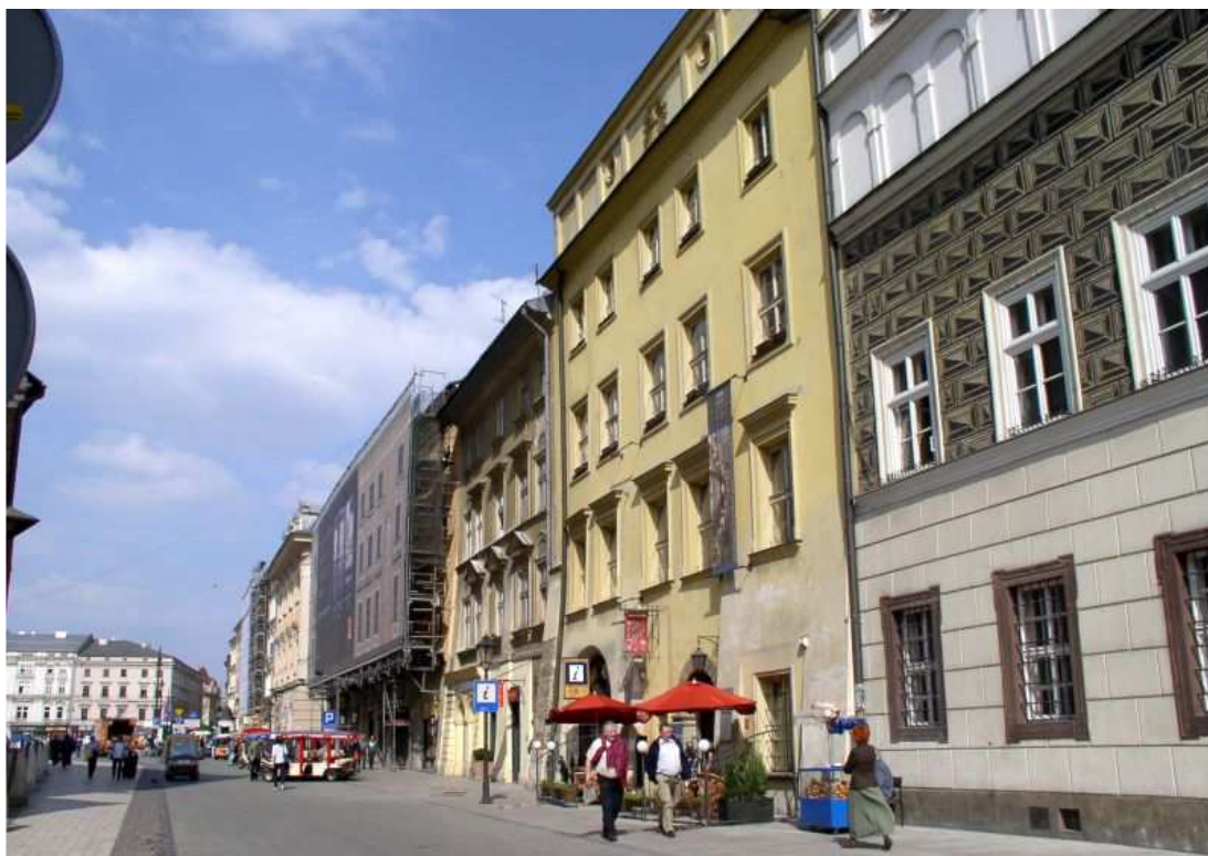
Fot. nr 219. Południowa część Placu Mariackiego o numerach: 1-4. 17.04.09