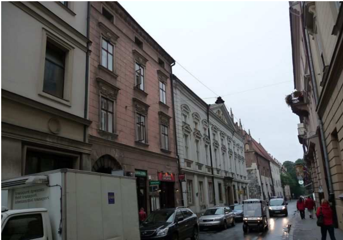
Fot. nr 123. Widok od strony Rynku w kierunku Collegium Maius i Plant. 25.07.11