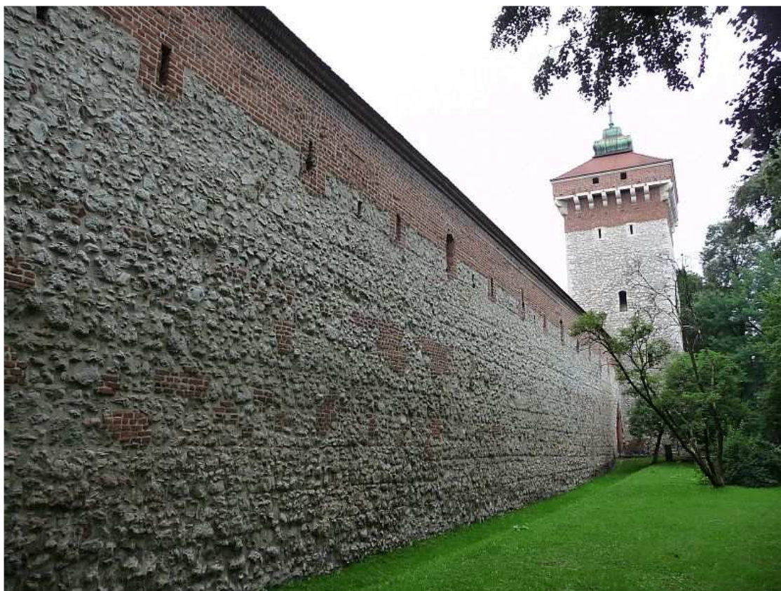
Fot. nr 22. Wzdłuż muru obronnego – widok od strony ulicy Szpitalnej, 26.07.11