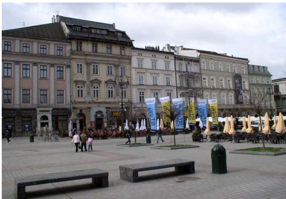
Fot. nr 87. Widok spod Sukiennic. 09.04.11