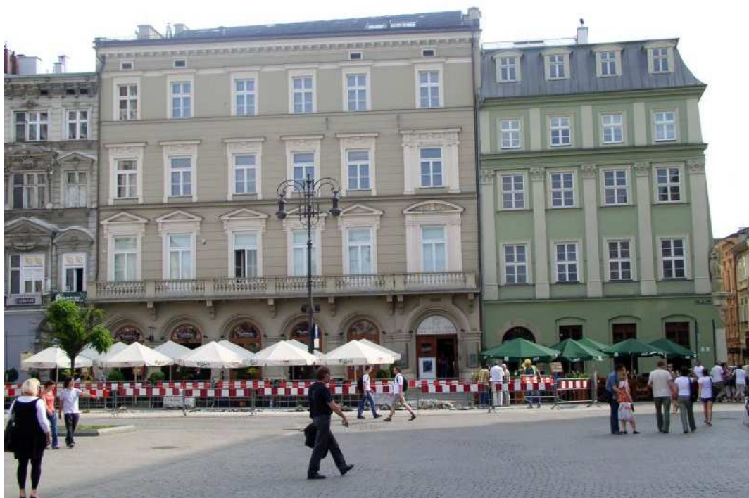
Fot. nr 88. Kamienice o numerach: 25 i 26. 16.06.11