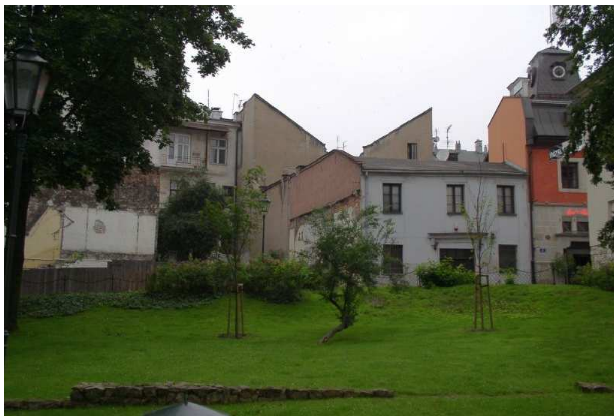
Fot. nr 193. Wyburzona właśnie kamienica z ulicy Na Gródku. 29.06.09