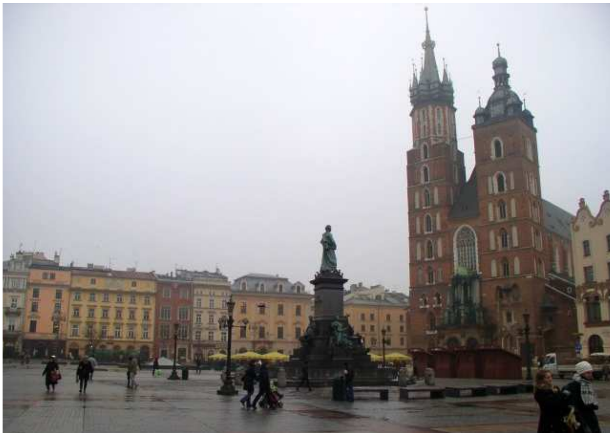
Fot. nr 92. Północno-wschodni narożnik z „Adasiem” na pierwszym planie. 11.01.11