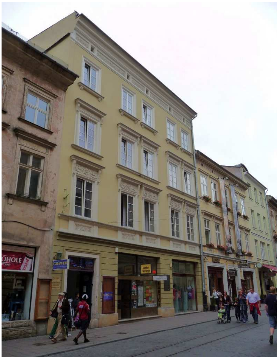
Fot. nr 142. Kamieniczka z ulicy Szewskiej 19, której przywrócona została dawna elewacja. 26.07.11