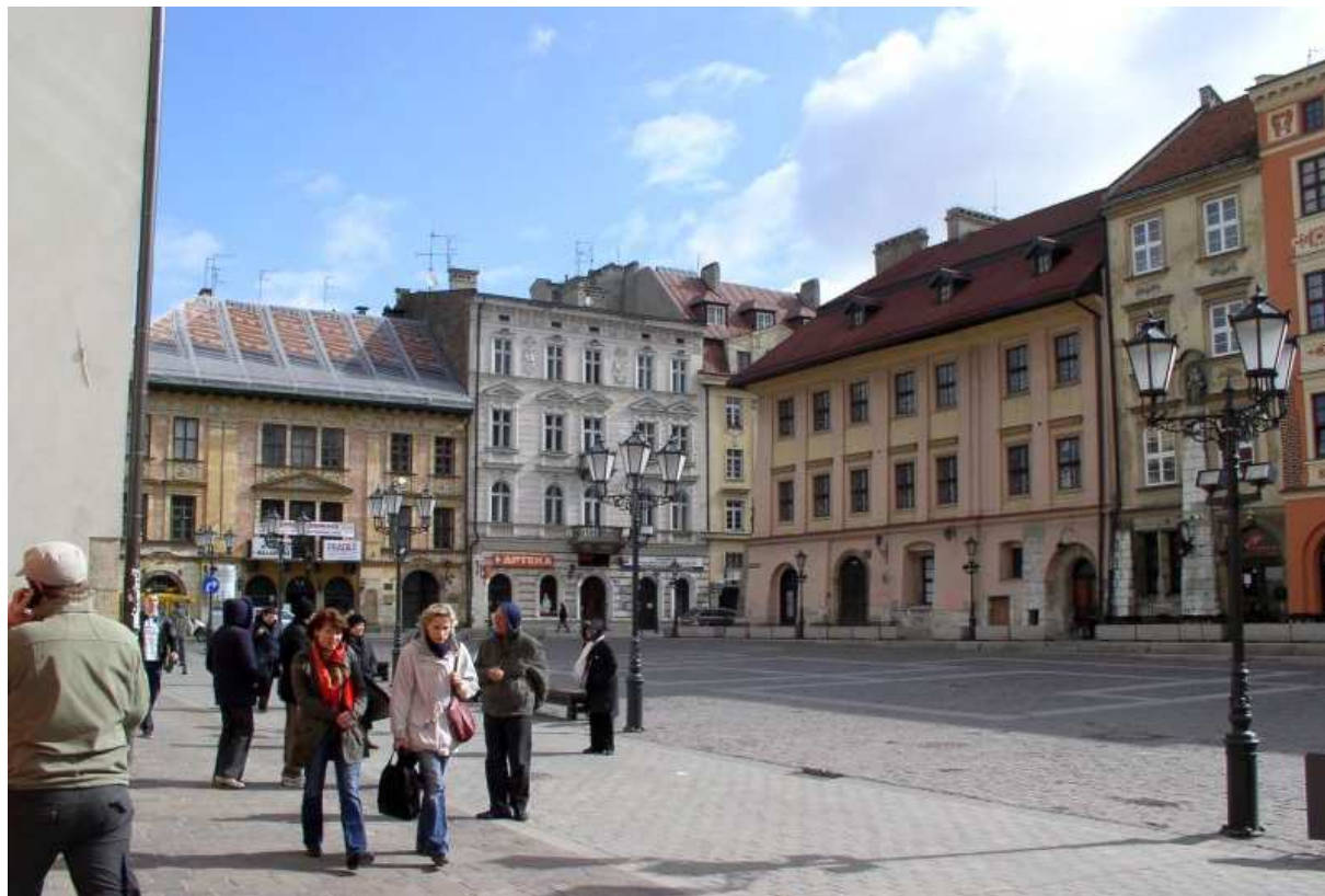
Fot. nr 217. Południowo-wschodnie naroże Małego Rynku z ulicą Mikołajską. 09.04.11