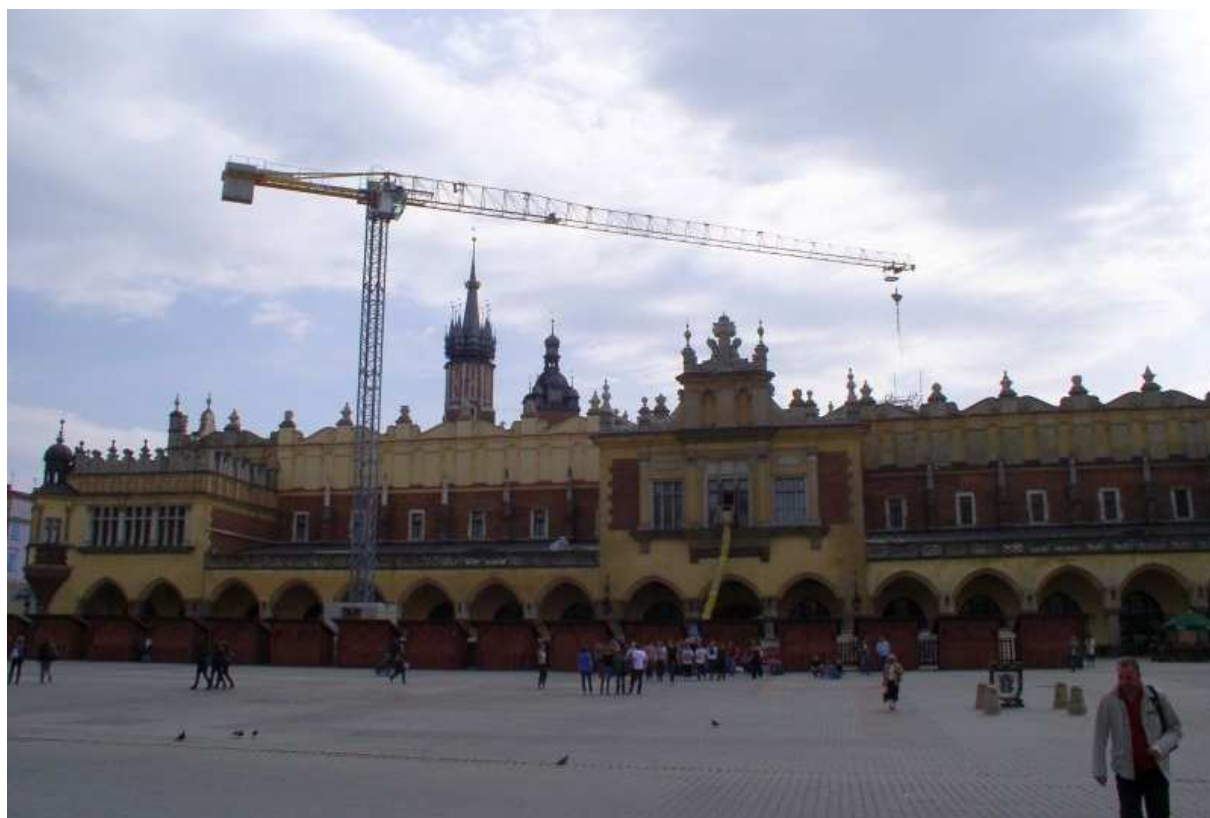
Fot. nr 78 (78-79). Sukiennice – widoki z wylotu ulicy Szewskiej. 17.04.09