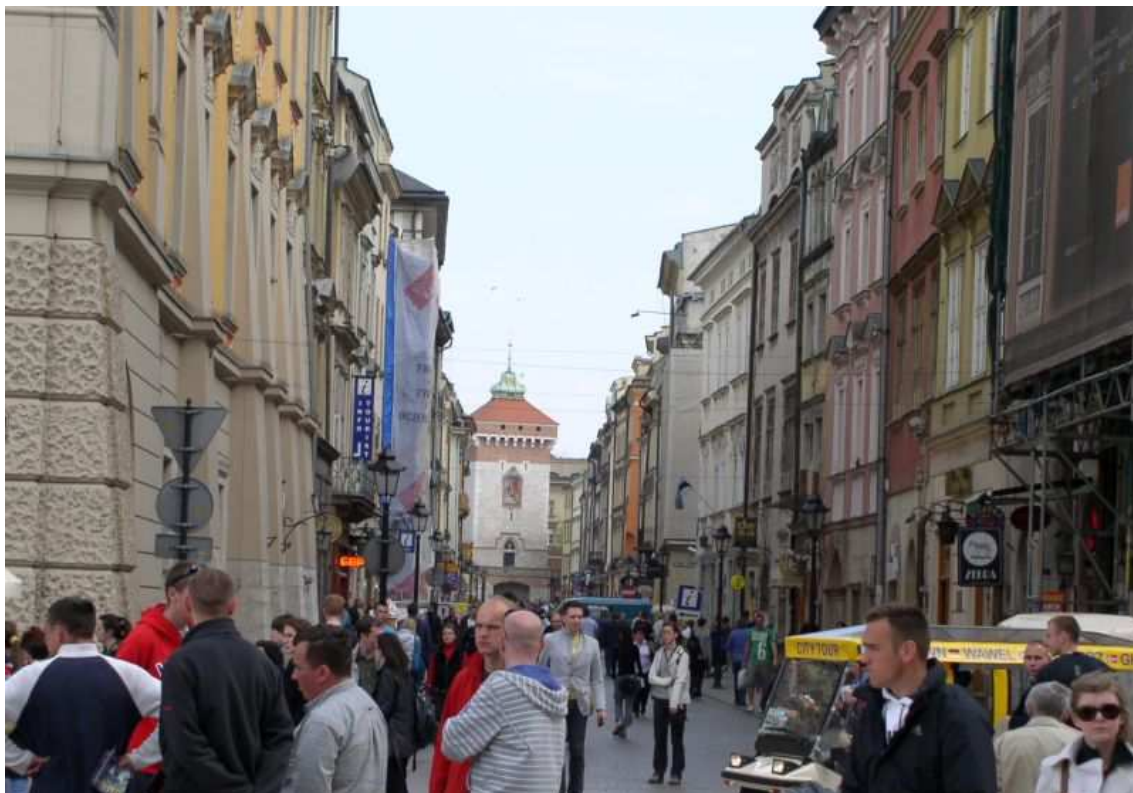
Fot. nr 47 (47-48). Wzdłuż ulicy Floriańskiej – widoki od strony Ryunku Głównego. 17.04.09