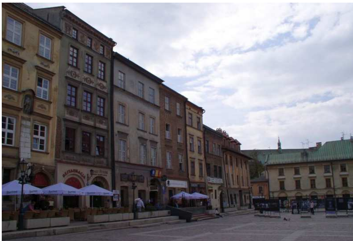
Fot. nr 215(215-216). Wschodnia pierzeja tym razem od strony ul. Mikołajskiej. 17.04.09