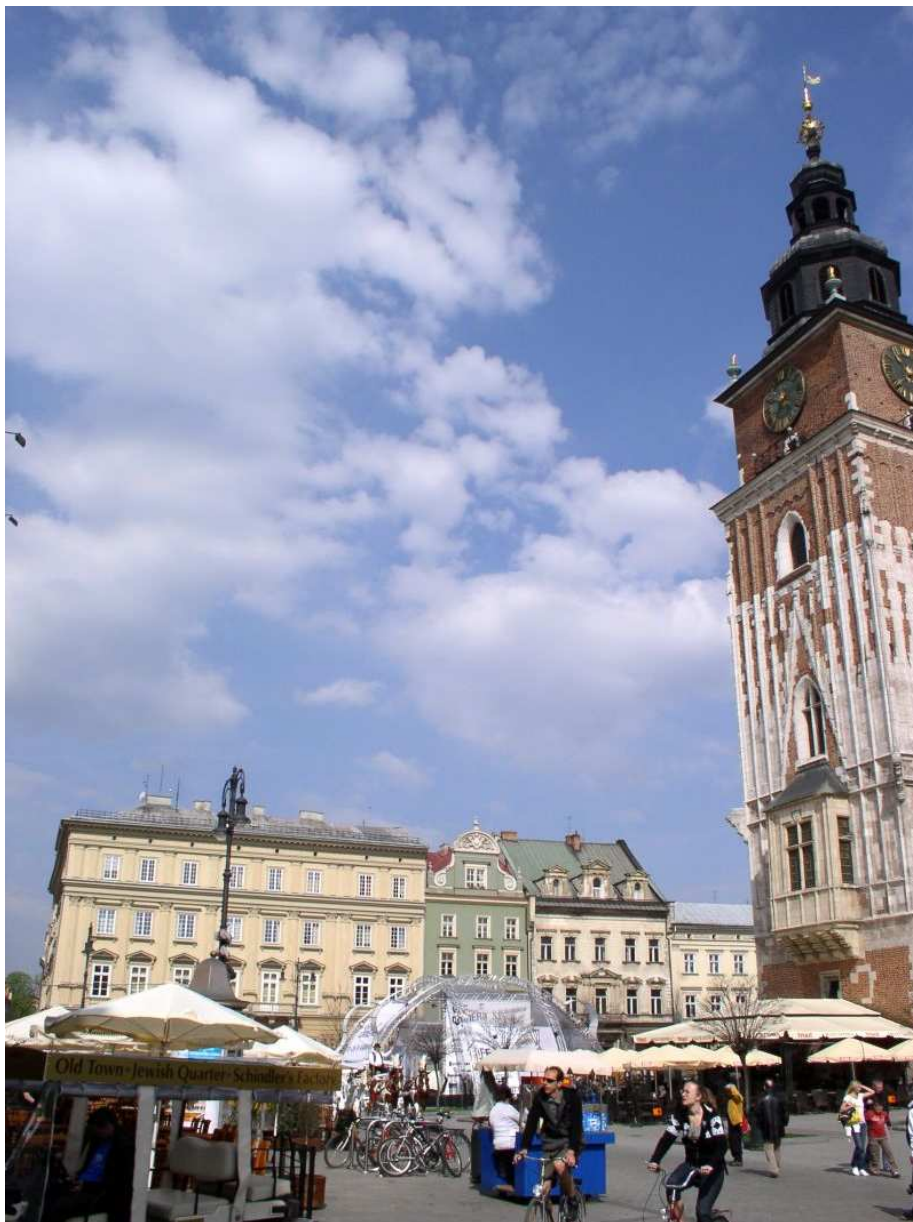
Fot. nr 82. Fragment zachodniej części Rynku w sąsiedztwie ulicy św. Anny. 17.04.09