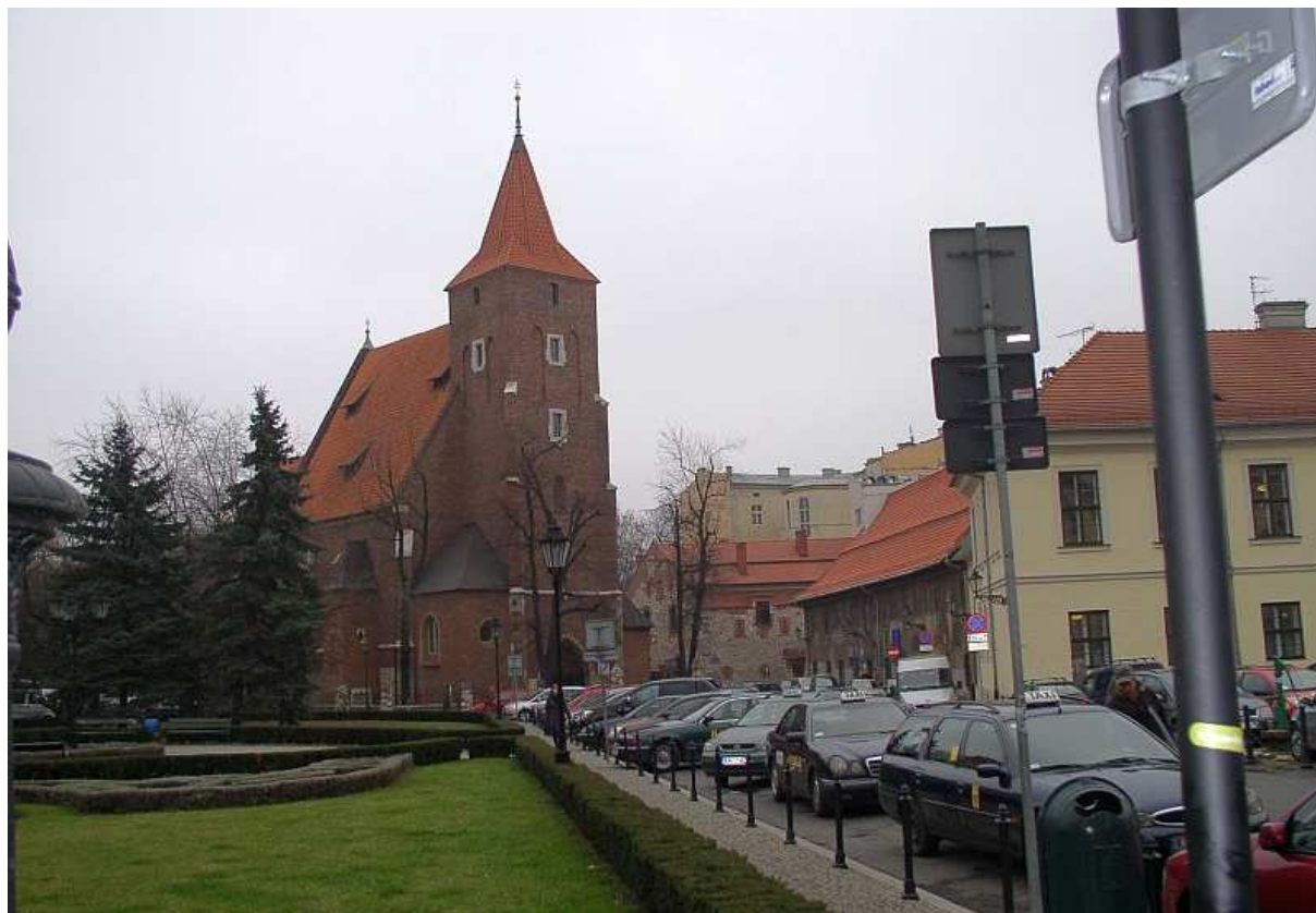
Fot. nr 168. Gotycki kościół św. Krzyża. 04.12.09