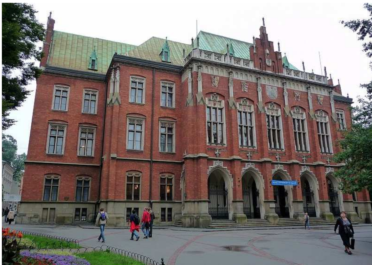
Fot. nr 136. Fasada Collegium Novum od strony Plant. 25.07.11