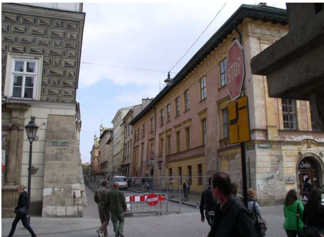
Fot. nr 176. Początkowy fragment zachodniej strony ulicy – widok spod Wikarówki na Małym Rynku. 17.04.09