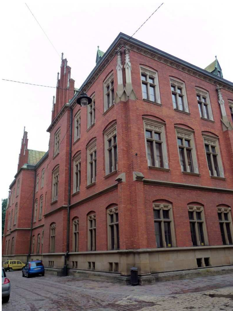
Fot. nr 134. Neogotycki gmach Collegium Novum – narożnik na styku ulic: Jagiellońskiej i Gołębiej. 25.07.11