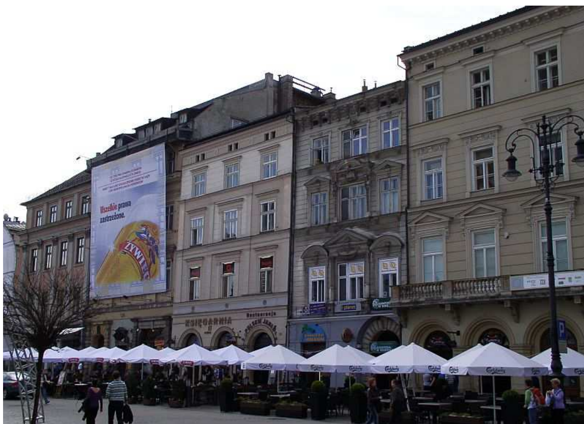
Fot. nr 86 (86-87). Mało reprezentacyjny fragment południowej pierzei Rynku; kamienice o numerach: 21-25. – widok spod pałacu Pod Baranami. 17.04.09