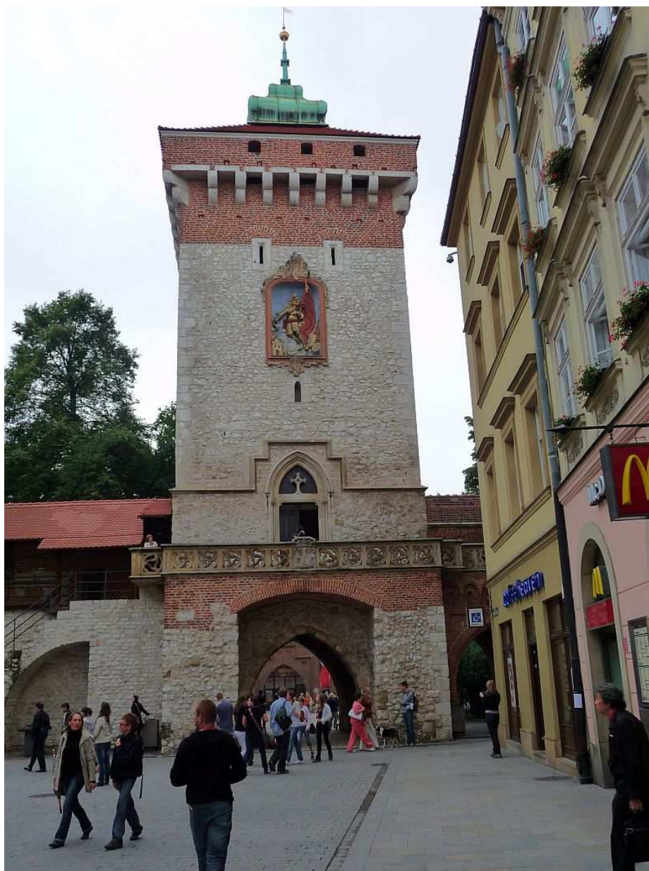
Fot. nr 29. Brama Floriańska z płaskorzeźbą św. Floriana, swego patrona, na fasadzie – widok z końca ulicy Floriańskiej. 26.07.11