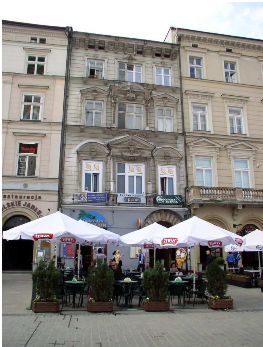
Fot. nr 85. Pstrokaczna fasady kamienicy pod nr 23. 17.04.09