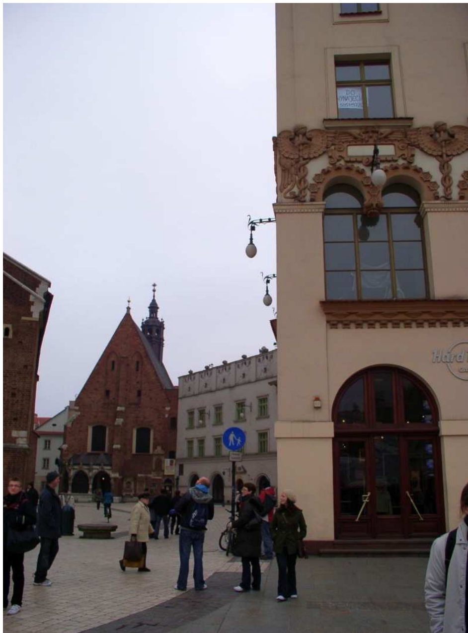
Fot. nr 227 (227-229). Widoki z Rynku Głównego; w tle kościół św. Barbary. 04.12.09