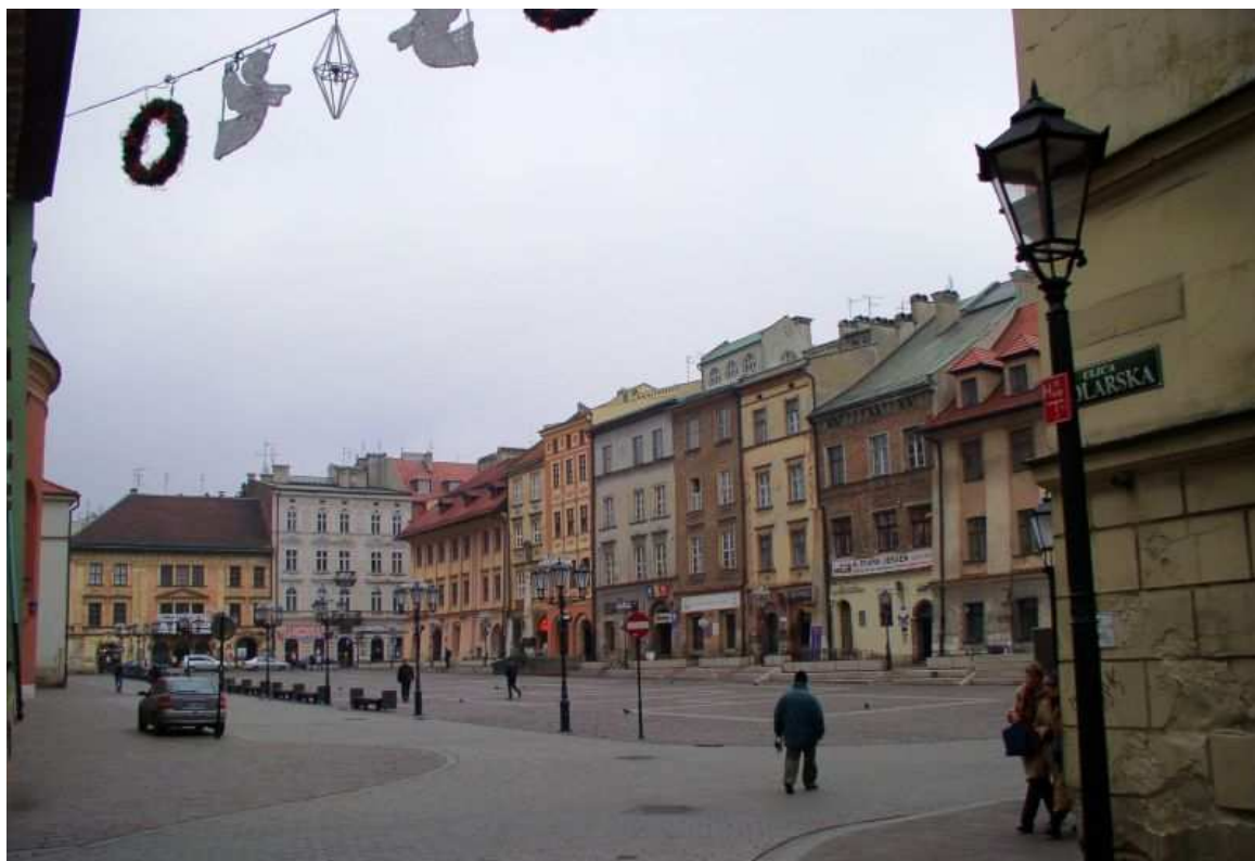
Fot. nr 201 (201-204). Wschodnia pierzeja Małego Rynku, a w tle początkowy fragment ulicy Mikołajskiej – widoki w wylotu ulicy Stolarskiej. 04.12.09