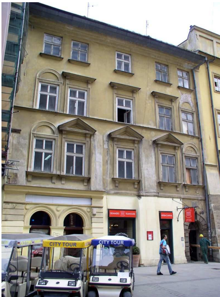
Fot. nr 221. Kamienica księży Mansjonarzy pod nr 2 – stan sprzed remontu. 17.04.09