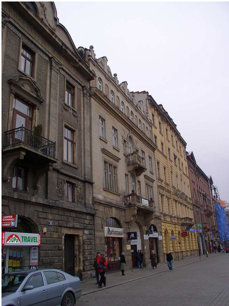
Fot. nr 169. Zabudowa ulicy Szpitalnej z początku XX-go wieku (nr: 22-30). 04.12.09