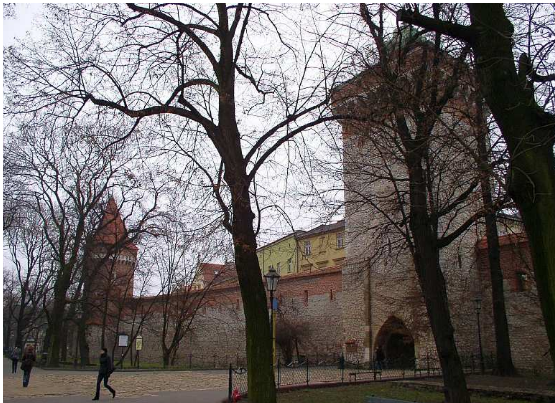
Fot. nr 21. Fragment murów z Bramą Floriańską i Basztą Pasamoników. 04.12.09