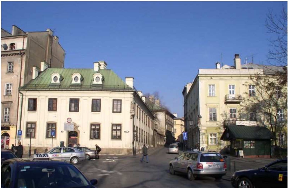
Fot. nr 196. W stronę ulicy św. Krzyża. 27.11.09