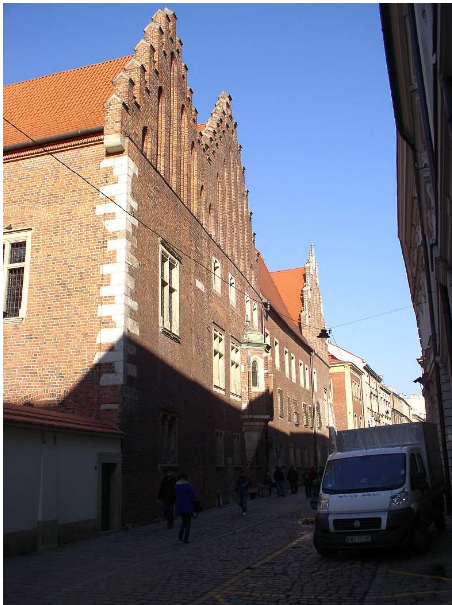
Fot. nr 129 (129-130). Kompleks Collegium Maius – widok od strony ulicy Gołębiej. 26.11.10