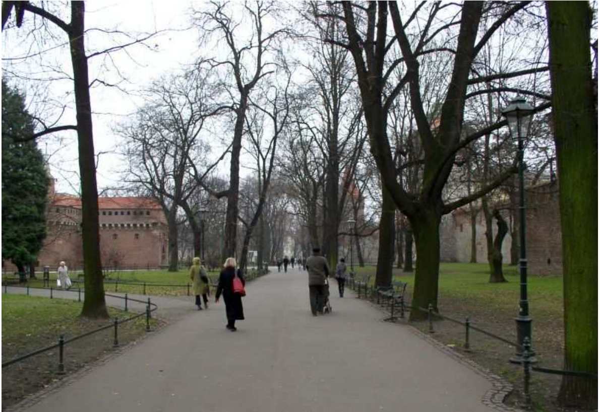
Fot. nr 2. Wzdłuż murów obronnych przy Bramie Floriańskiej. 04.12.09