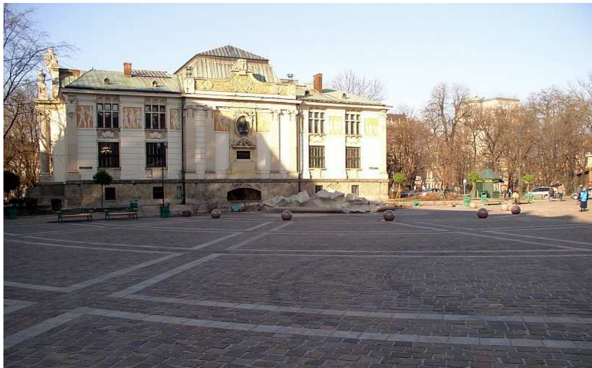
Fot. nr 146 (146-147). Plac Szczepański w nowej, secesyjnej szacie. 26.11.10