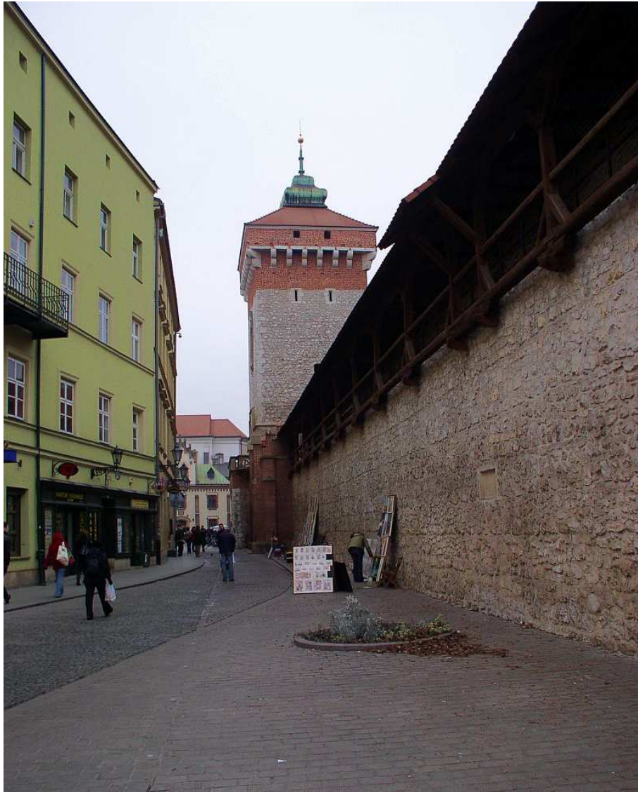
Fot. nr 24 (24-27). Fragment muru od strony wewnętrznej, wzdłuż ulicy Pijarskiej, z odtworzonym gankiem strzelniczym. W tle Brama Floriańska. 04.12.09