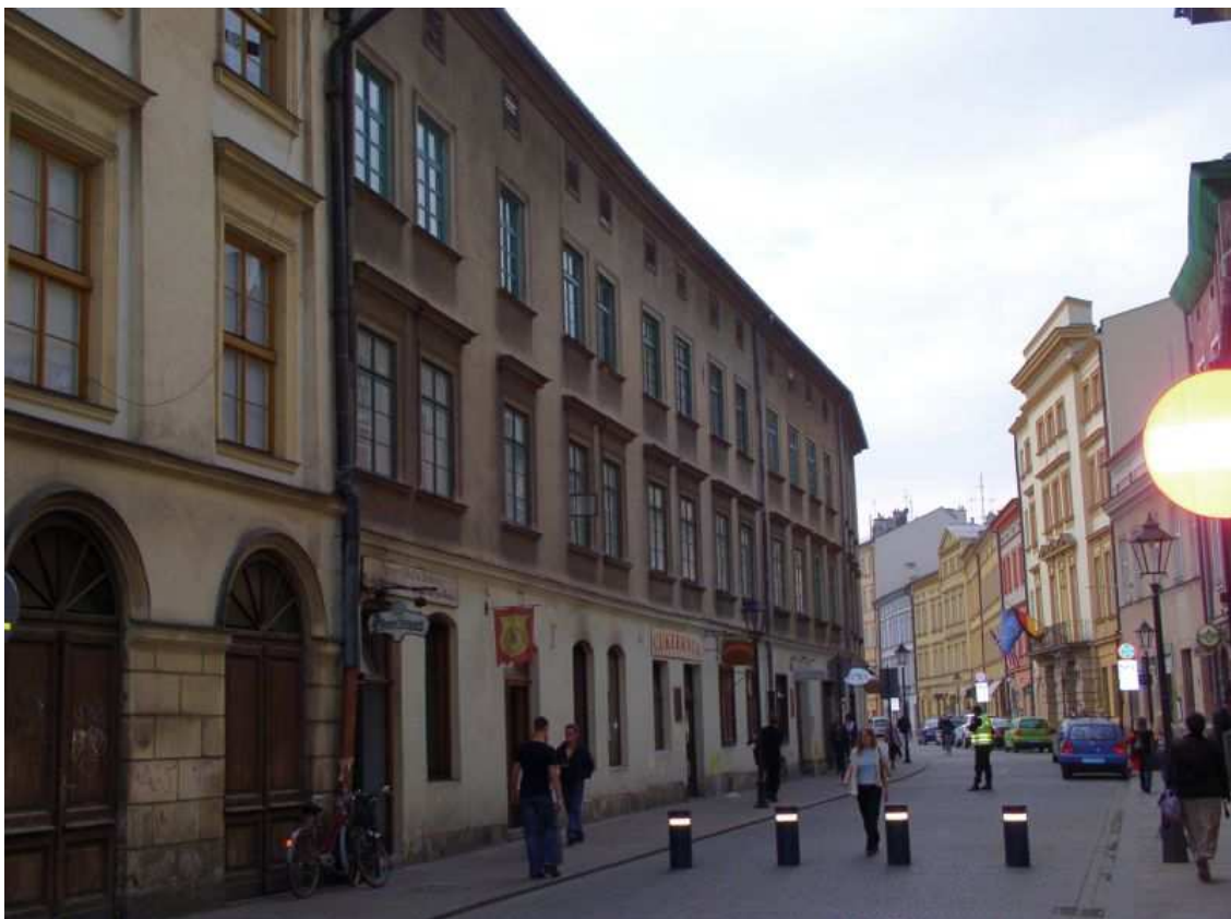
Fot. nr 233 (233-234). Klasycystyczny oryginał spod nr 4, jeszcze ze znaną cukiernią w parterze. 17.04.09