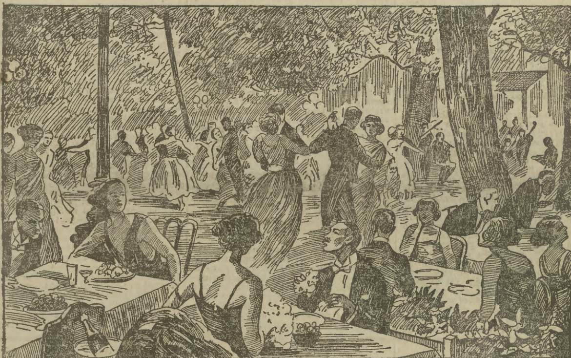
Paryż i w lecie — nawet podczas największych upałów nie rezygnuje z tańca. Ilustracja nasza przedstawia zabawę taneczną w lasku Bułońskim w restauracji „Chateau de Madrid”.

Za pozwoleniem Ministerstwa Wyznań Religijnych i Oświecenia Publicznego otwarte