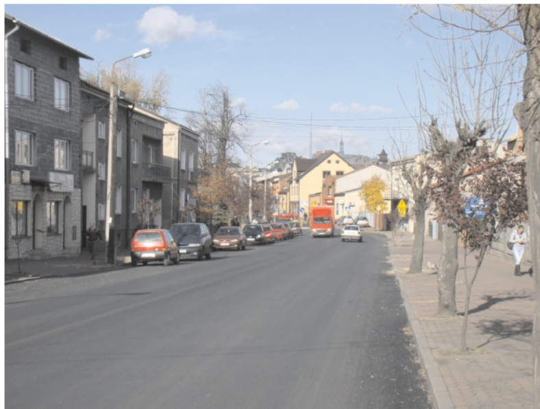
Krakowska gładka jak stół

Zakończenie prac w centrum miasta nie oznacza jednak jeszcze zakończenia robót drogowych prowadzonych przez MZGKiM. Obecnie trwa nakładanie asfaltu na drodze z Chrzastowic do Zarzeczca oraz rozpoczęto długo oczeki-