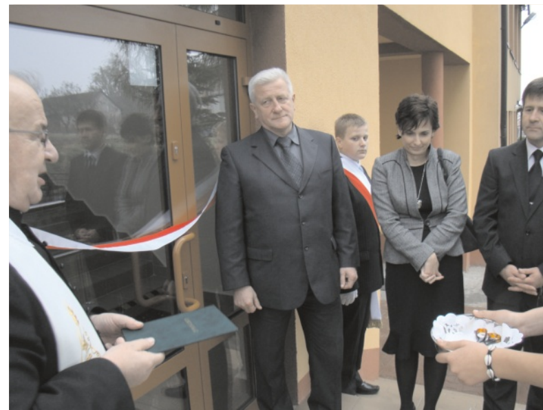
Nowy oddział przedszkolny w Gołaczewach otwarty

Wcześniej MZGKiM zakończył sprawnie przeprowadzony remont drogi od cmentarza aż za przejazd kolejowy przed Wierchowiskiem. Tam również użytkownicy dróg z satysfakcją przejadą po nowym dywanie asfaltowym.