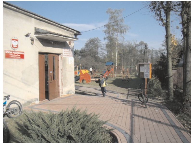
Obejście szkoły w Chrzastowicach zmieniło się nie do poznania

Sukcesy społeczności lokalnej, wynikającej ze zgodnego współdziałania władz, mieszkańców i dobroczyńców cieszą i mogą być budującym przykładem dla innych – razem można zrobić bardzo wiele!