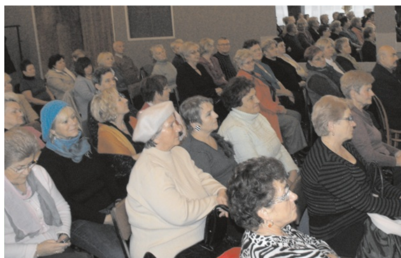
Uniwersytet odmiadza seniorów

Gratulujemy organizatorom pomysłu, zawodnikom zapału, a zwycięzcom sukcesu!