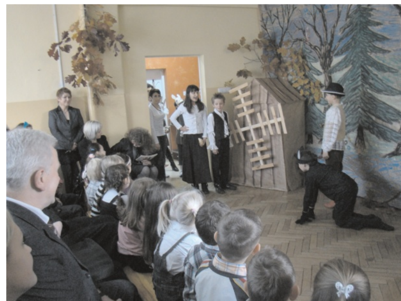
Publiczność zachwyciła się przedstawieniem Kota w butach przygotowanym przez dzieci