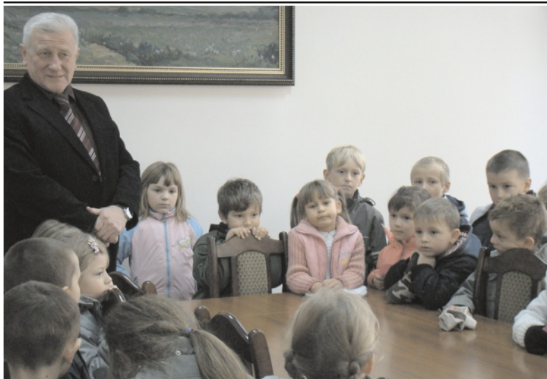
Przedшкоlaki w magistracie

brom, w części południowo-wschodniej Etap III”. Na inwestycję, która ma się zamknąć kwotą 1 mln 170 tys. zł Gmina Wolbrom zaciągnęła częściowo pożyczkę, która w 30% będzie umorzona. Obydwie inwestycje prowadzi konsorcjum firm „Kanbud” z Libiąża i „Pebex II” z Będzina, które wygrało oba przetargi.