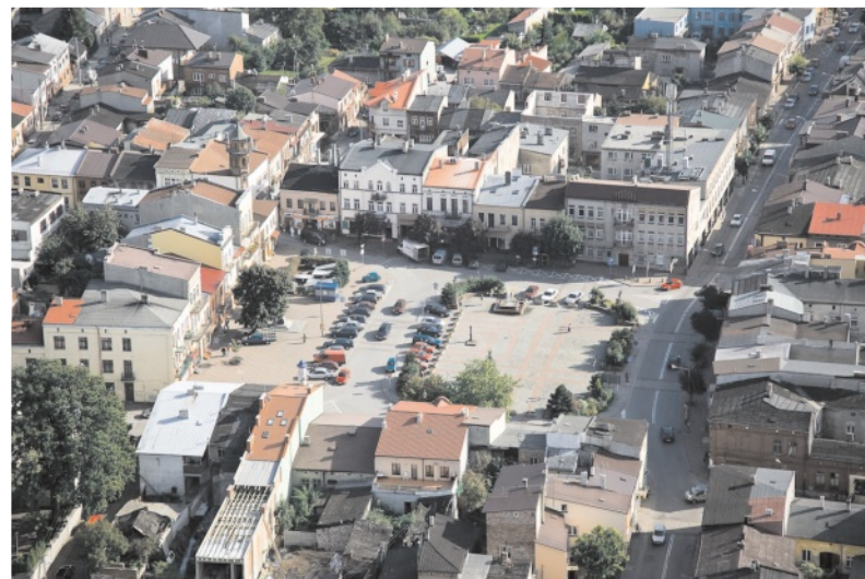
Rozkwit gminy zależy od władz samorządowych. W rękach mieszkańców - wybór najlepszych kandydatów

-KOMITET WYBORCZY WYBORCÓW WSPÓLNOTA SAMORZĄDO-