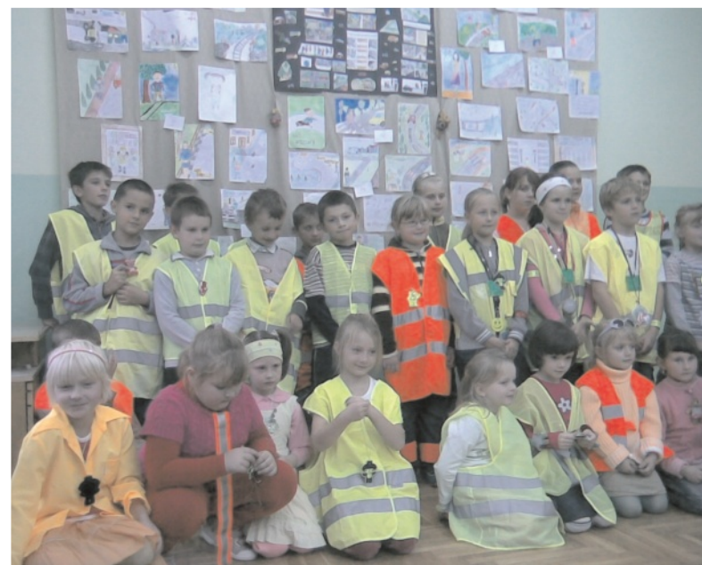
....i uczniowie z Jeżówki