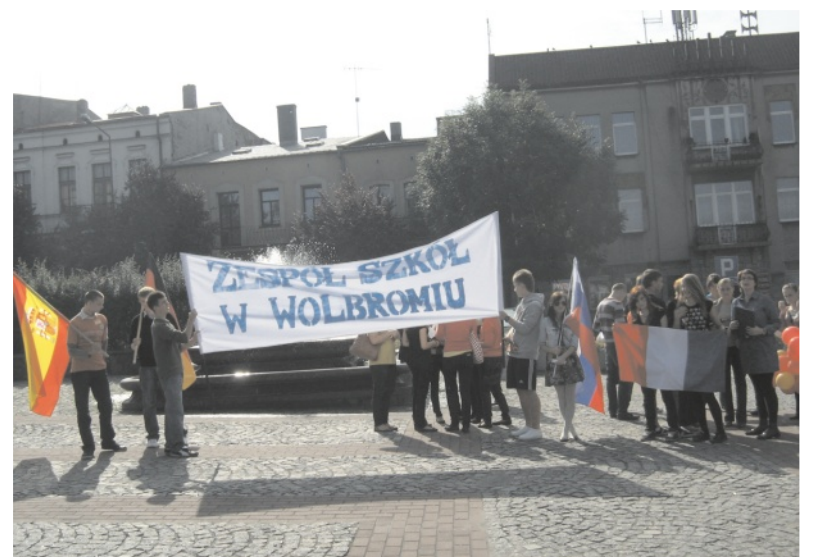
Języki nie są nam obce