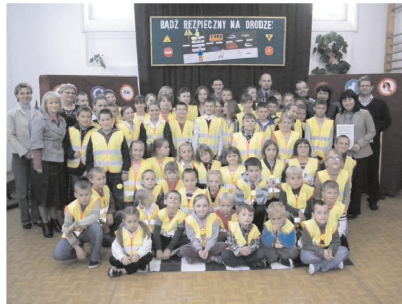
Bardzo widoczna młodzież z Poręby Górnej...

Po zakończeniu akcji, temat bezpieczeństwa będzie kontynuowany nadal pod hasłem „Byłem, jestem i będę bezpieczny. Dotychczasowe przedsięwzięcia pozwoliły na wzrost świadomości uczniów na temat bezpieczeństwa w ruchu drogowym.