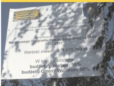
Druga w mieście „schetynówka” już gotowa! - str. 3.