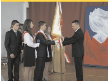
Zespół Szkół w Dłużcu otrzymał imię i sztandar - str. 5.

Minęło już kilka tygodni od czasu ogłoszenia terminu wyborów samorządowych i rozpoczęcia kampanii wyborczej. W naszym środowisku, gdzie wszyscy się znają i łatwiej weryfikować wiarygodność kandydatów kampania ma określoną od lat specyfikę. Wydaje się, że nawet „zestaw” kandydatów na burmistrza i radnych różnych szczebli nie może nas już zaskoczyć - pewnie będzie ich kilku, każdy ma jakąś wizję, bardziej lub mniej realną, mniejsze lub większe doświadczenie. Jak będzie? - czas pokaże... Mamy nadzieję, że nasza lokalna społeczność podejdzie do wyborów z należytą dojrzałością, a duża frekwencja i przemyślane wybory będą miały odzwierciedlenie w ciągłej poprawie jakości naszego lokalnego życia w przyszłości.