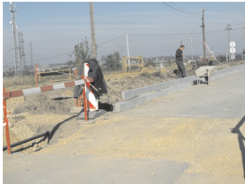
Niedługo ruszy pierwsza nitka nowej kanalizacji

Niedługo rozpocznie się montaż przepompowni ścieków, a w ramach dodatkowych robót związanych z odtworzeniem drogi w Grabiu, wzdłuż której prowadzone były wykopy, układane są obecnie krawężniki i nowy chodnik. Zakończenie tych prac, a także robót przy drugim aktualnie realizowanym odcinku kanalizacji, obejmującym budowę sieci od Chełmu (kolonia Grabie), przez ul. Słowackiego i Polną do ul. Łukasińskiego przewidziany jest na 30.11.2010 r. Kolejny etap kanalizacji południowej części miasta, zakładający budowę odcinka sieci od ul. Łukasińskiego, przez ul. Okrzei i 1-go Maja będzie realizowany do końca października przyszłego roku. Całość nowo wybudowanej sieci kanalizacyjnej zostanie włączona do istniejącego kolektora ściekowego w rejonie ul. Garbarskiej. Budowa sieci kanalizacyjnej sanitarnej w Chemie-Grabiu, kosztem