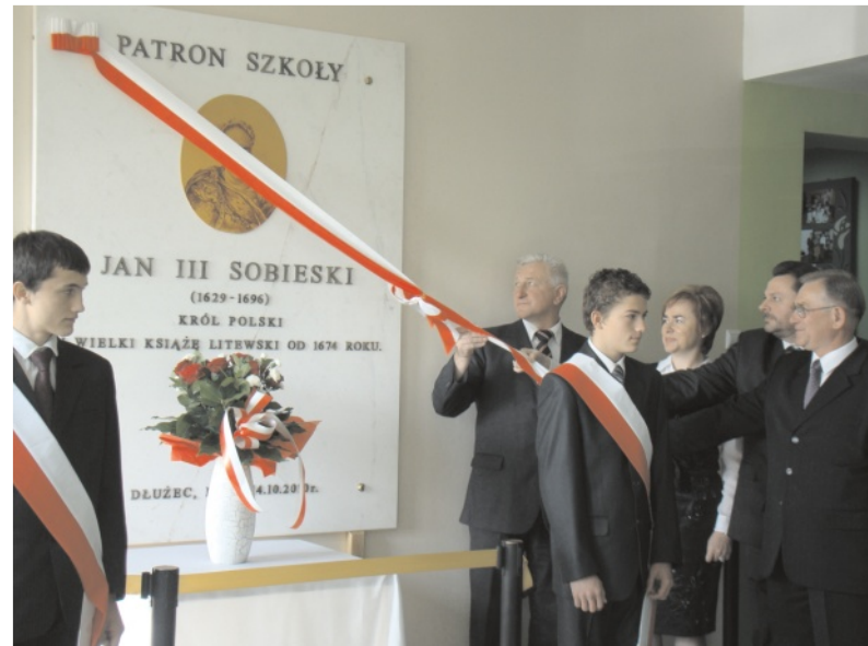
Moment odsłonięcia tablicy

Z okazji Dnia Edukacji Narodowej wszystkim świętującym składamy serdeczne życzenia zdrowia, energii, pozytywnego zacięcia i powodzenia