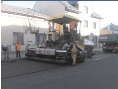
Praca wre - str. 2.