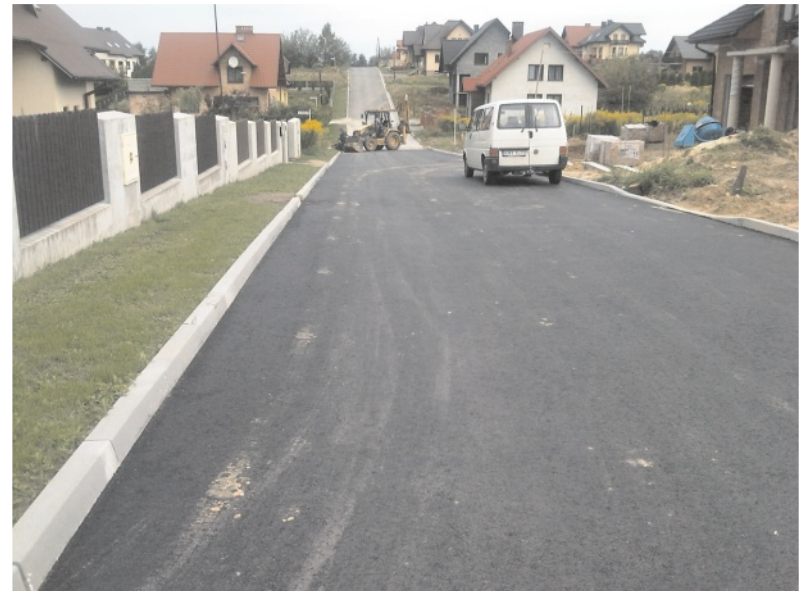
Każda nowa droga to zysk dla gminy, ale i wydatek...