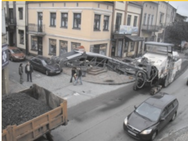
Jak poruszać się po mieście w okresie remontu głównych ulic? - str. 3.