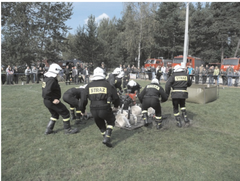
Ćwiczyli sprawność i szybkość, przy okazji wszyscy dobrze się bawili