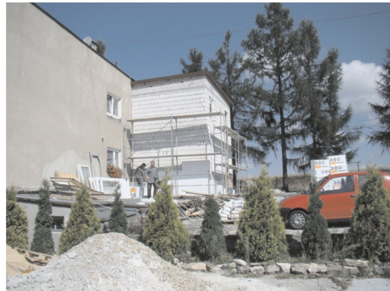
Jeszcze niedawno trwały prace budowlane - dziś czekamy już tylko na odbiór techniczny

Chociaż teraz „zerówkowicze” korzystają jeszcze z gościnności szkoły, już za kilka dni sytuacja się zmieni i maluchy rozpoczną zajęcia we własnej sali. Nowe pomieszczenia są już praktycznie gotowe, pozostały jedynie drobne prace, wynikające z zaleceń Sanepid-u. Obecnie trwają procedury odbiorcze, a pracownicy Referatu Inwestycji UMiG Wolbrom robią