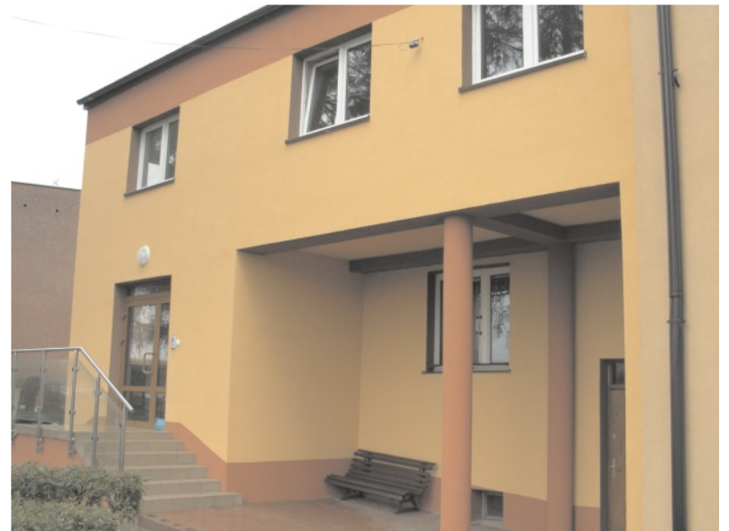
Dzięki tej inwestycji - oddziałowi przedszkolnemu przy ZS w Gołaczewach zostało odciążone przedszkole