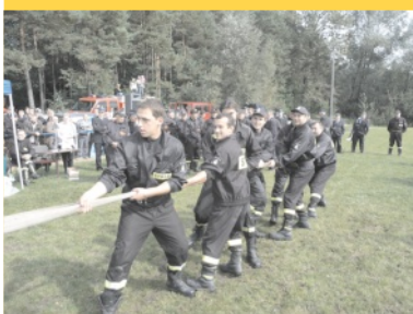
Strażacy trenowali w Zarzeczcu - str. 7.