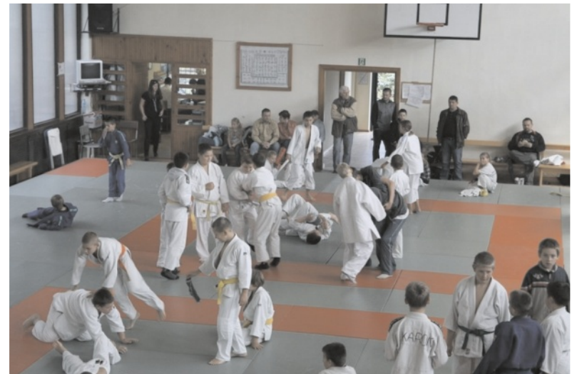
Międzynarodowe zawody to okazja do rywalizacji i nawiązywania przyjaźni

Organizacja wymiany międzynarodowej była możliwa m.in. dzięki pozyskaniu przez klub środków z Lokalnego Konkursu Grantowego Działaj Lokalnie VII „Przez sport do sukcesów w nauce i życiu osobistym”, jest również szansa na dofinansowanie campu z zakwa-