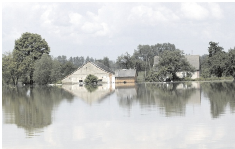
Zalany powodzią Słupiec