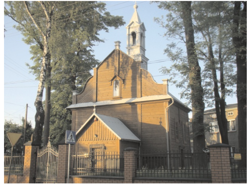
Niedawno odnowiony najstarszy wolbromski zabytek

przedmieścia łobzowskie, pilickie, lgockie, miechowskie