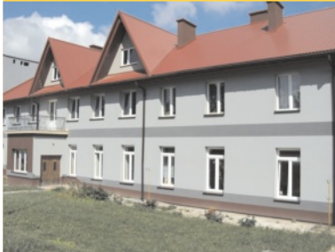
Zapominają o pożarze - str. 4.