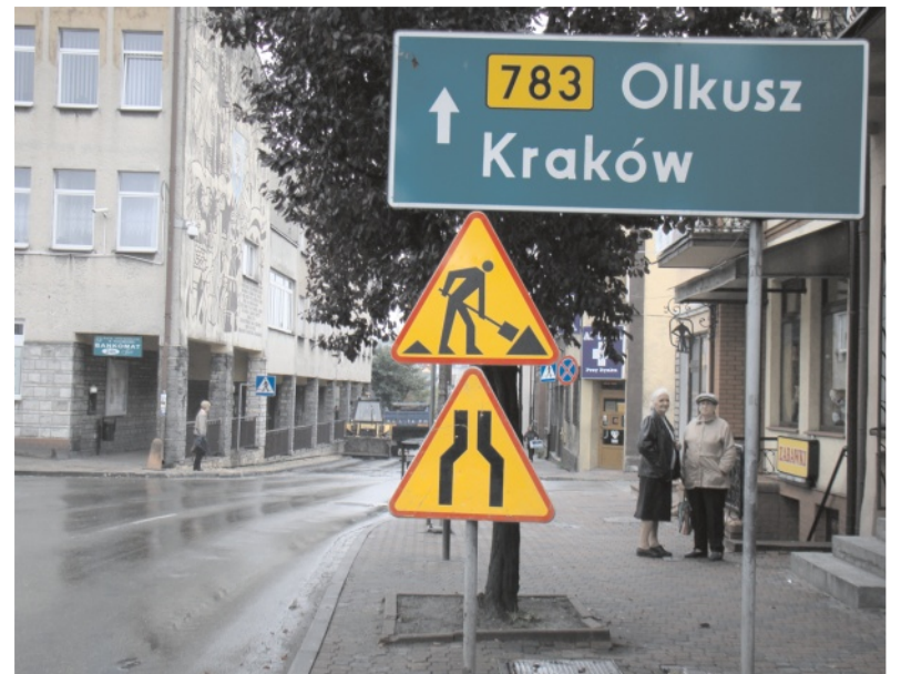
Remont głównych ulic miasta idzie pełną parą; oby zdążyć przed zapowiadaną wczesną zimą!

Dobiegają także końca prace na naszej tegorocznej „schetynówce”- ciągu ulic Targowej, Armii Krajowej i Kazimierza Jagiellończyka, a wniosek na kolejną jest już przygotowany. Jeżeli uda się przeforować ten trzeci z kolei wniosek (co w tym roku, z powodu nie będzie łatwe, bo gminy powodziowe otrzymają dodatkowe punkty podczas oceny wniosków) o dofinansowanie projektu w ramach „Narodowego Programu Przebudowy Dróg Lokalnych 2008 – 2011” w Wolbromiu zostanie rozwiązany kolejny „odwieczny” problem – regulacja kanalizacji deszczowej w ul. Nowej i Wyzwolenia oraz remont ciągu dróg gminnych od ul. Wyzwolenia,