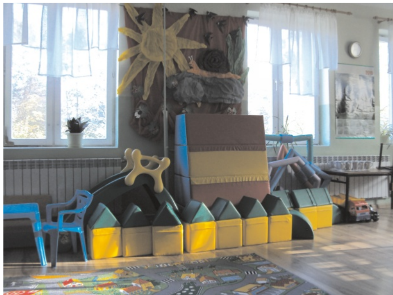
W takich salach aż chce się uczyć

Szczególnie podziękowania kierujemy do władz Urzędu Miasta i Gminy Wol-