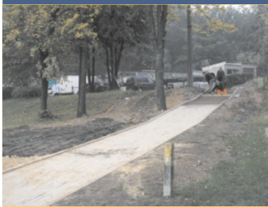
Pogoda rządzi remontami - str. 2.