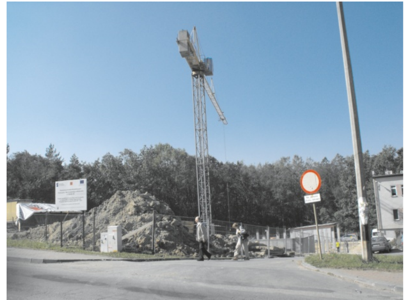
Na nowe miejsca w OREW-ie czekają kolejne chore dzieciaki

Na rozbudowę Ośrodka Rehabilitacyjno-Edukacyjno-Wychowawczego w Wolbromiu, Stowarzyszenie na Rzecz Osób z Upośledzeniem Umysłowym Koło w Wolbromiu, które jest inwestorem rozbudowy otrzymało aż 3 812 410,00 złotych dotacji w ramach Małopolskiego Regionalnego Programu Operacyjnego na lata 2009-2013 finansowanego z budżetu