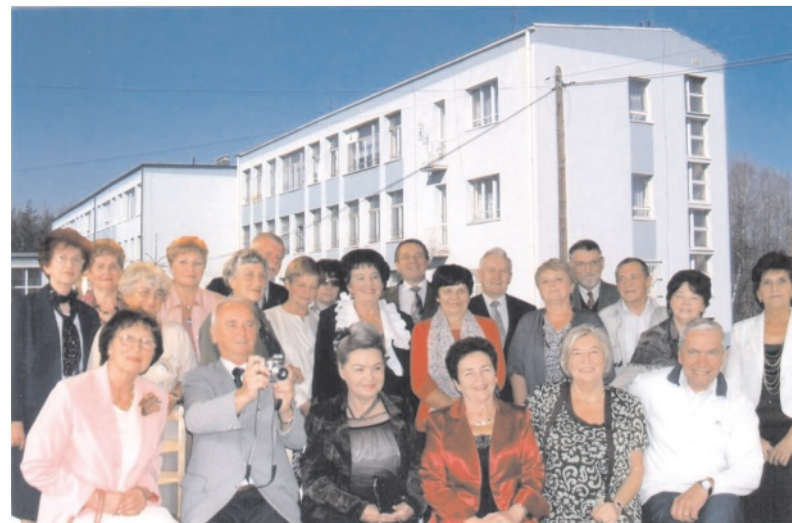
A oni duchem wciąż młodzi!