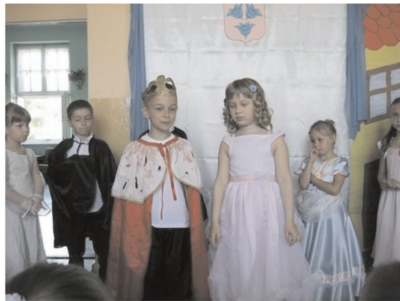
Dzięki dodatkowym zajęciom dzieci wyrównują szanse i szlifują talenty - Przedstawienie "Kopciuszka" przygotowane w ubiegłym roku szkolnym w SP1

Szybko i sprawnie radni przyjęli zmianę do budżetu gminy wynikającą z pozyskania przez gminę dodatkowych środków z rezerwy budżetowej MEN na remonty w placówkach oświatowych w wysokości 67.600 zł. Bez sporów odbyło się także głosowanie w sprawie wyrażenia przez radnych zgody na zakup terenu powiększającego boisko sportowe w Łobzowie, wykorzystywane przez grający w A klasie lokalny zespół sportowy, które zostało dopuszczone do rozgrywek ligowych tylko warunkowo. Od zezwolenia na dokonanie zakupu nie powstrzymała radnych nawet wyższa od sugerowanej w wycenie rzeczoznawcy, wynegocjowana ze sprzedającymi cena – interes społeczny zwyciężył. Chciałoby się złośliwie skomentować: czemu jest