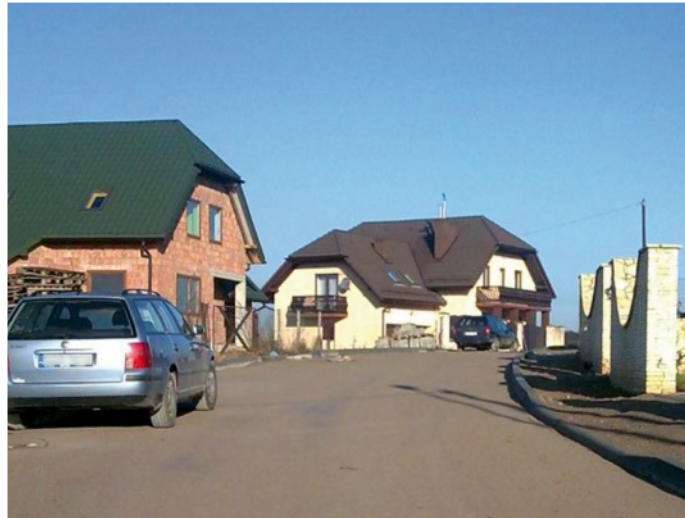
Nowa nawierzchnia na ul. Klonowej – os. Wąwóz – Kapkazy

Radny pytał również, czy burmistrz planuje podniesienie podat-