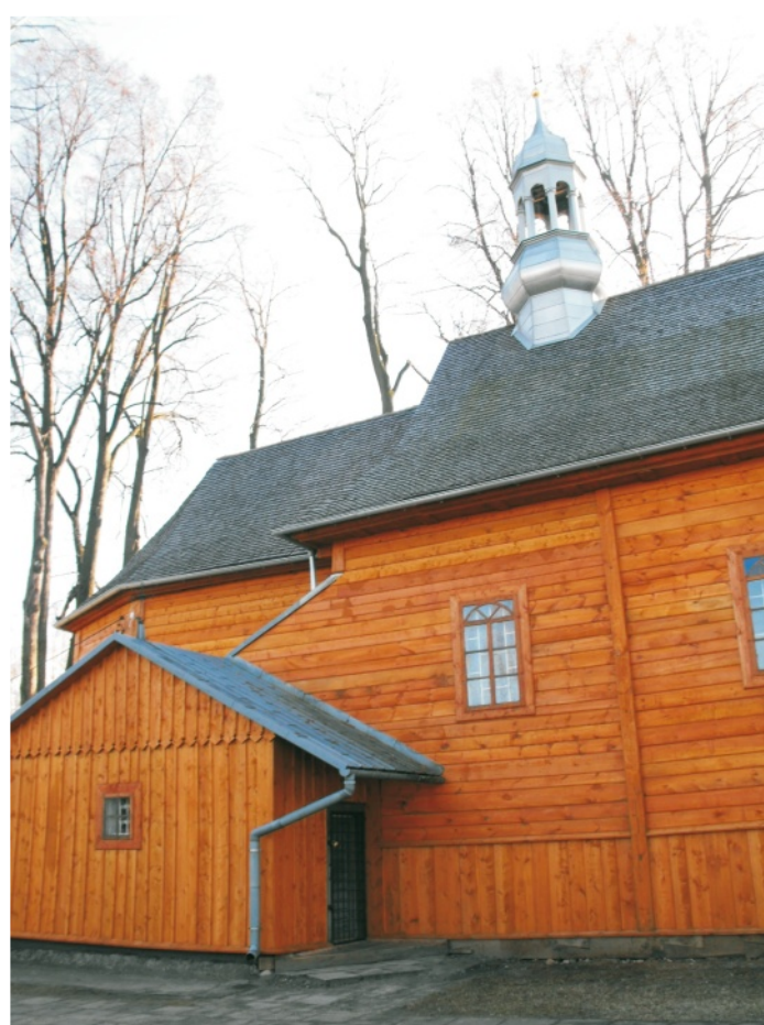
Stary kościół jak nowy