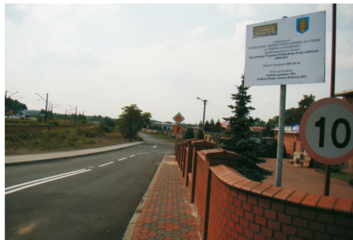
Wyremontowana ulica Pompka

Uchwalony program współpracy Gminy z organizacjami pozarządowymi określa, że jego obszarem działania będą objęte przede wszystkim: pomoc społeczna, działalność charytatywna, podtrzymywanie tradycji narodowej, ochrona i promocja zdrowia, edukacja i wychowanie, kultura - także fizyczna, ekologia, przeciwdziałanie patologiom oraz integracja europejska. Środki na działalność organizacji, uprawnionych do korzystania z takiej pomocy Gminy, przyznawane są, zgodnie z prawem, w drodze