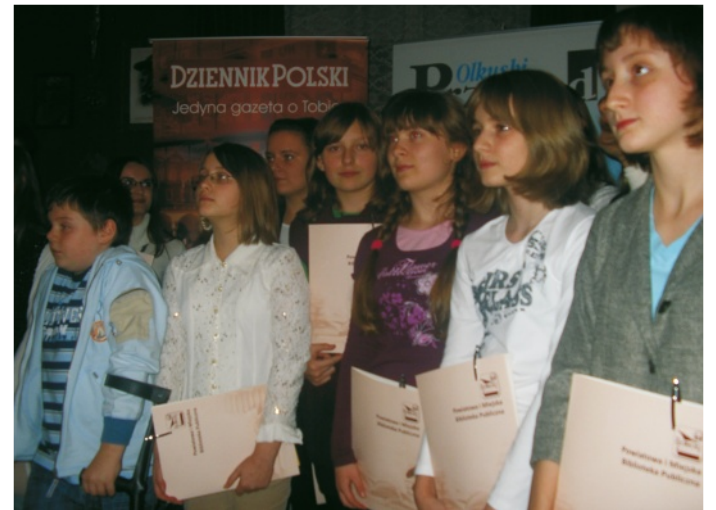
Młode pisarki z Poręby Górnej po odebraniu nagród