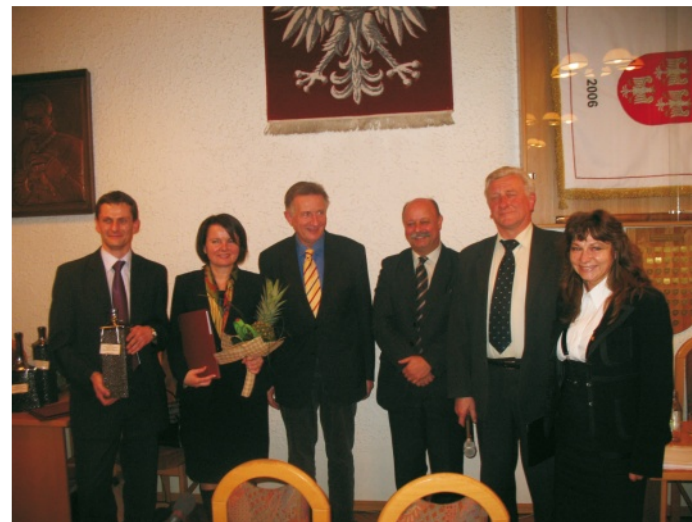
Zdobywcy drugiej nagrody – FTT Wolbrom

Uczniowie gimnazjów i szkół ponadgimnazjalnych z Olkusza, którzy również włączyli się w obchody Światowego Dnia Zdrowia, wzięli udział w happeningu polegającym na zjedzeniu tony jabłek, co ma zmotywować