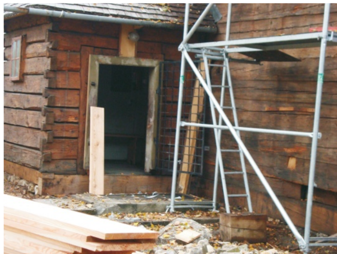
Świątynia przed renowacją