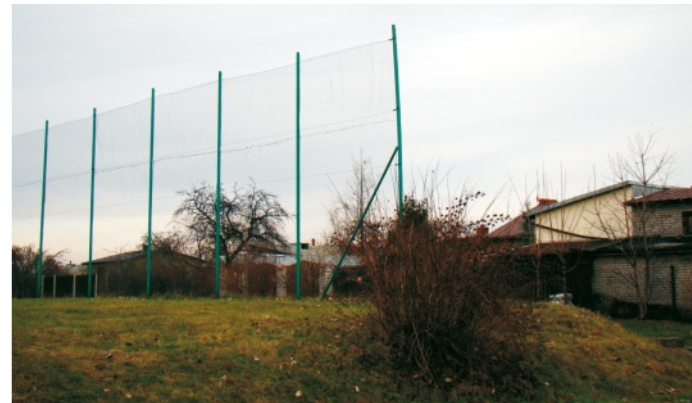
Boisko od sąsiednich posesji oddziela wysoka siatka

podnosząc, iż zeznania świadków, materiał faktograficzny oraz opinia biegłego ds. ochrony środowiska wskazują na takie rozstrzygnięcie w sprawie. 27 czerwca 2009r. na przedmiotowe postanowienie Prokuratury Rejonowej w Olkuszu wniesione zostało zażalenie do Sądu Rejonowego Wydział II Karny w Olkuszu. Żalący się wnioskowali o dopuszczenie jeszcze jednej opinii biegłego zarzucając, iż opinia na której zostało oparte postanowienie Prokuratury jest nierzetelna. Sąd Rejonowy Wydział II Karny w Olkuszu postanowieniem, wydanym 22 października 2009r., na posiedzeniu jawnym, utrzymał w mocy zaskarżone postanowienie, a w uzasadnieniu postanowienia Sąd stwierdził, iż opinia biegłego ds. ochrony środowiska, jest rzetelna i wyczerpująca, pobrane na miejscu zdarzenia próbki zbadano