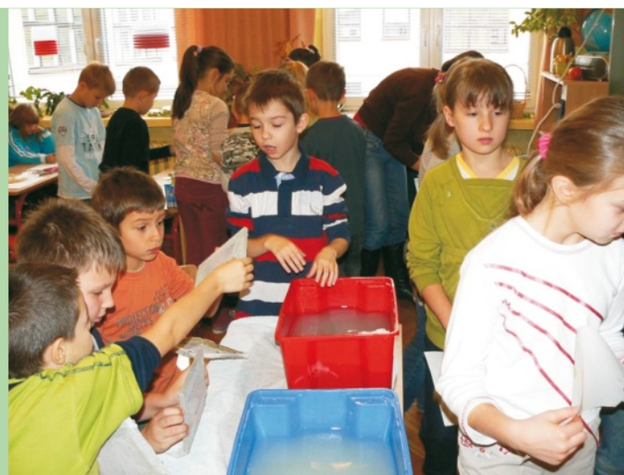
Dzieci własnoręcznie wykonały kartkę papieru ręcznie czerpanego

ekologicznym, podczas których dzieci i młodzież ma możliwość praktycznie przekonać się, że zbiórka materiałów wtórnych ma sens, a dobra gospodarka nimi faktycznie może spowodować ograniczenie dewastacji środowiska naturalnego człowieka. Może, dzięki konsekwentnej edukacji, uda się spowodować, że edukacja najmłodszych zmieni ich podejście do sprawy i później – jako dorośli – będą wprowadzać idee w życie.