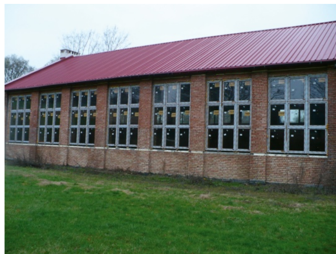
Sala przy Szkole Podstawowej w Jeżówce została wyposażona w nowe okna

otwartych konkursów, a nadzór nad realizacją poszczególnych zadań sprawują odpowiednie wydziały Urzędu.