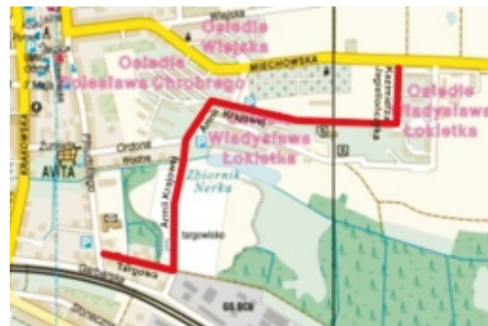
Na czerwono zaznaczono zakres planowanego remontu drogi i jej otoczenia

O przyznaniu dofinansowania decydowała komisja, która oceniła wnioski i ogłosiła listy rankingowe. Największa liczba punktów była przyznawana tym inwestycjom, które będą wpływać na poprawę bezpieczeństwa ruchu drogowego. Duże znaczenie przy wyborze inwestycji miał też jej wpływ na całość układu komunikacyjnego Małopolski. Ponadto, preferowane były również wspólne wnioski kilku samorządów. Dofinansowanie mógł otrzymać jeden projekt gminny i dwa projekty powiatowe. W przypadku miast na prawach powiatu dofinansowanie mogły otrzymać dwa wnioski.