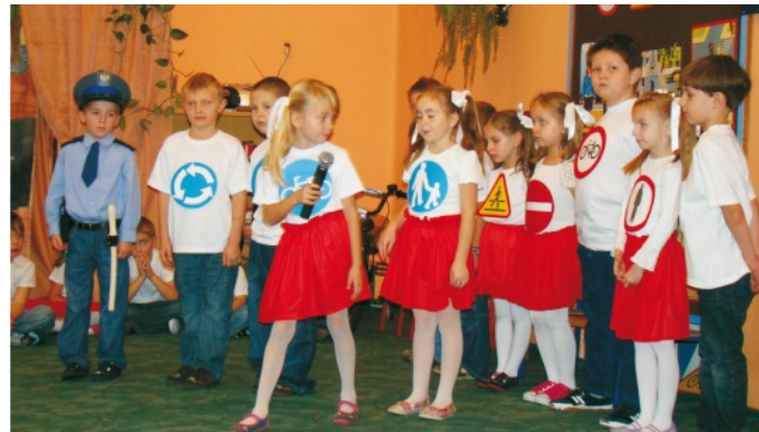
Grupa 6-latków zaprezentowała przedstawienie pt. „Znaki drogowe”

Na początek grupa 6-latków zaprezentowała przedstawienie pt. „Znaki drogowe”, po którym odbył się turniej wiedzy „BEZPIECZNY PRZEDSZKOLAK I UCZEŃ”. Udział w nim wzięli uczniowie z klasy I „b” ze Szkoły Podstawowej Nr 1 w Wolbromiu oraz 6-latki