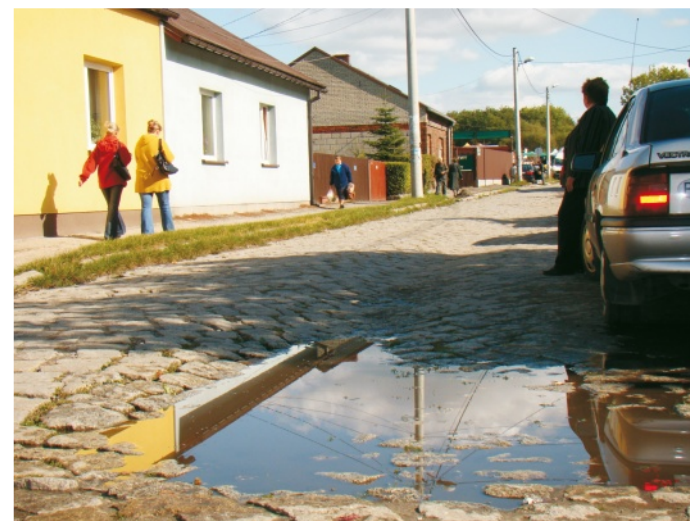
Wkrótce zmieni się obraz targowej

Harmonogram dyżurów aptek: Apteka „Przy Rynku” ul. Krakowska 2 16.11. - 22.11.2009 Apteka „Mediq” ul. Mariacka 6 23.11. - 29.11.2009 Apteka „Pod Koroną” ul. 1-go Maja 39 30.11. - 06.12.2009