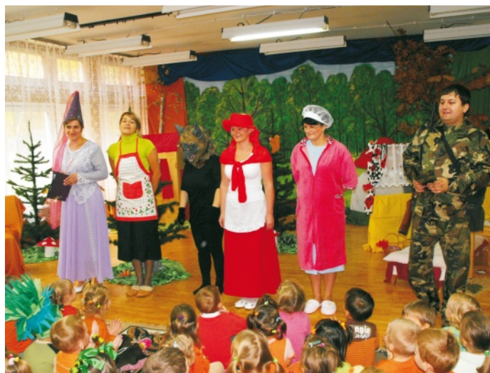
Postaci z „Czerwonego Kapturka” zagrali rodzice

W związku z obchodzeniem tego dnia „Świętem marchewki” w całym przedszkolu było naprawdę marchewkowo. Zarówno dzieci, jak i personel, ubrani w zielono-żółto-pomarańczowe stroje, bawili się i tańczyli przy