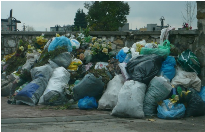
Śmieci pod cmentarnym murem zamiast w kontenerze