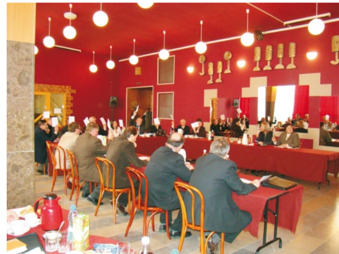
Głosowanie nad odrzuceniem skargi na Burmistrza