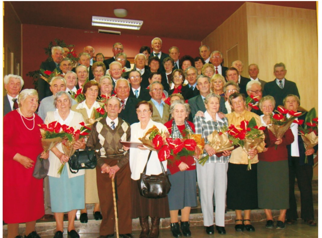
Diamentowi i złoci jubilaci