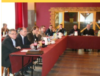
Podczas sesji radni omawiali i uchwalili - str. 4