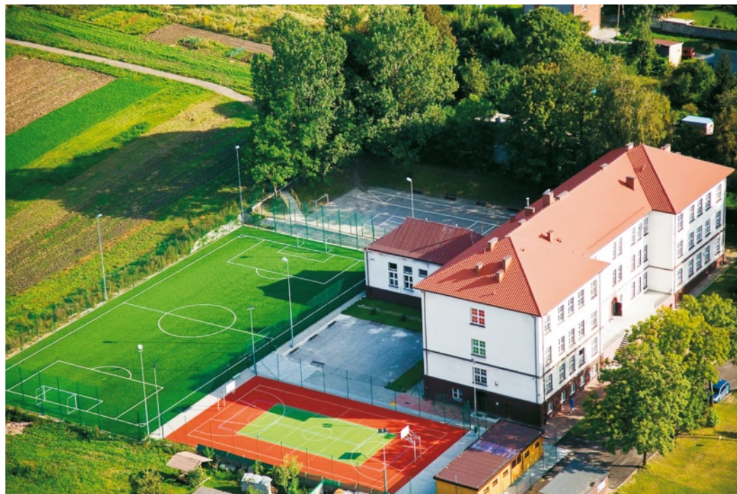
„Orlik” przy SP1 w Wolbromiu

Osiągnięcia uczniów są wynikiem edukacji szkolnej, przy czym w znacznym stopniu zale-