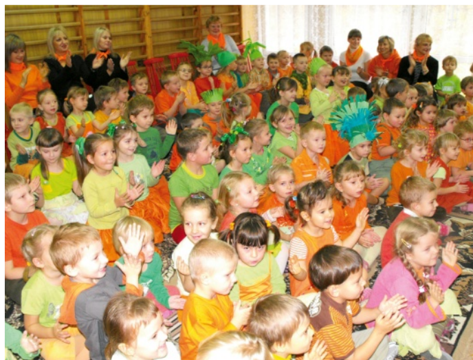
Dzieci żywo reagowały na to co działo się na scenie