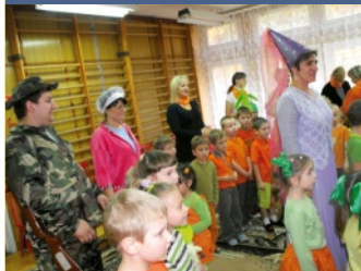
Święto pasowania na przedszkolaka w PP 2 - str. 2