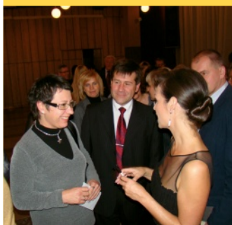
Świąteczne spotkanie pracowników oświaty - str. 3