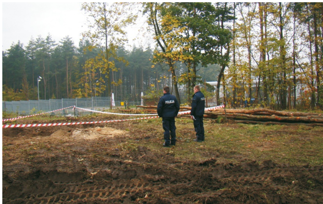
Policja zabezpieczyła teren budowy z odkrytymi szczątkami