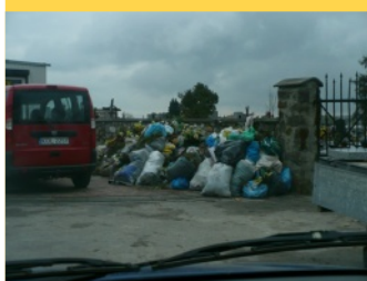
Nie umiemy uszanować cmentarza i siebie wzajemnie? - str. 6.