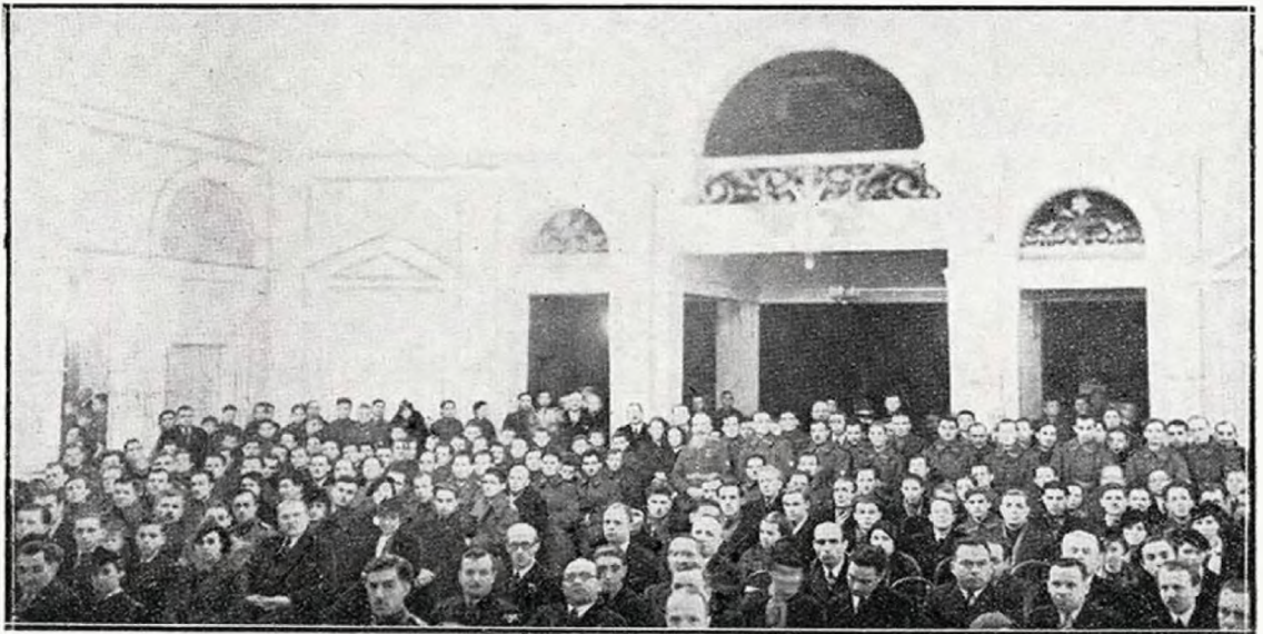
Z Uroczystości Słowackiej w Warszawie w dniu 12 grudnia b. r.: na ilustracji część sali z zebraną publicznością.