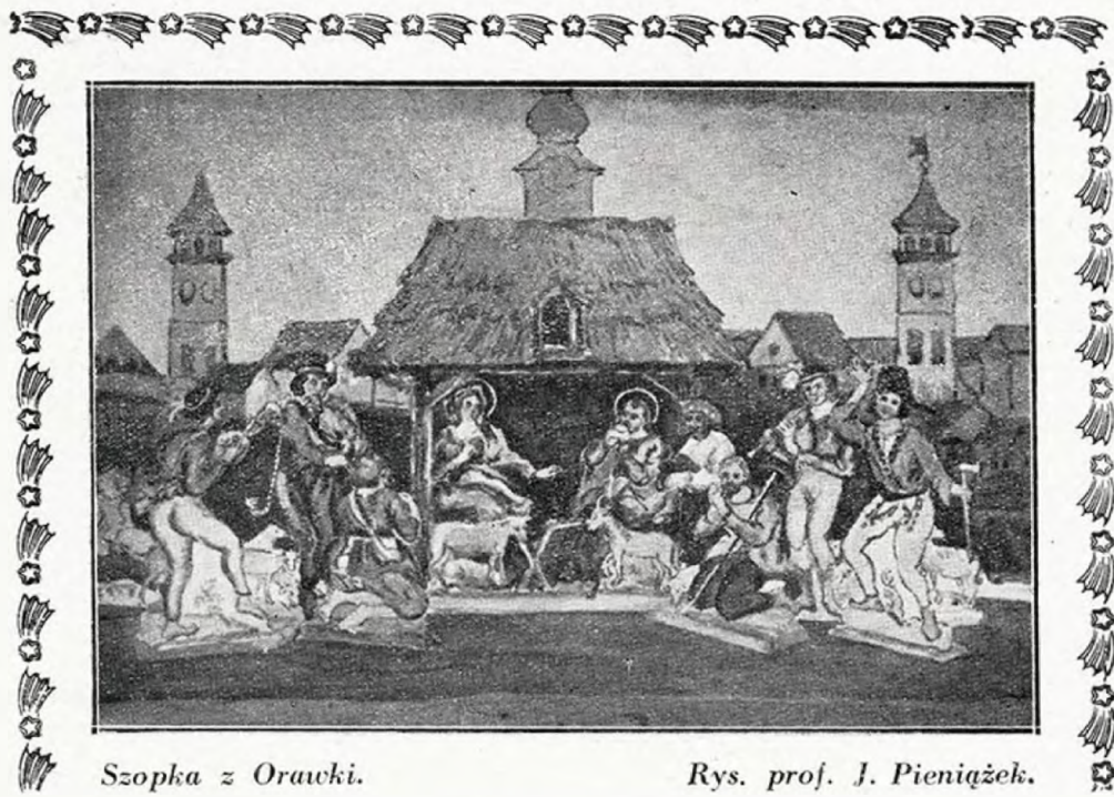
Szopka z Orawki.