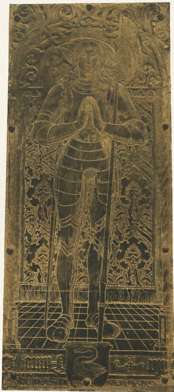
Fig. 6. Mikołaj (?) Salomon na płycie w presbiterium kościoła N. M. Panny.