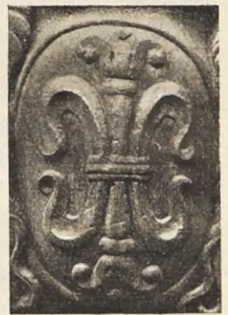
Fig. 2. Lilia z herbu Bonarowa.

bankowych o sławie już ustalonej i dlatego chętnie dał się namówić Betmanowi na przybycie do Polski, gdzie z powodu braku prawdziwie zdolnych i obrotnych przemysłowców łatwo mógł ponad nich wypłynąć. A miał on po temu wiele danych za sobą. Oto posiadał swój herb, który mieli sobie zdobyć jego przodkowie przed stu kilkudziesięciu laty na polu walki, w krwawych zapasach z Anglikami, stojąc po stronie kró-