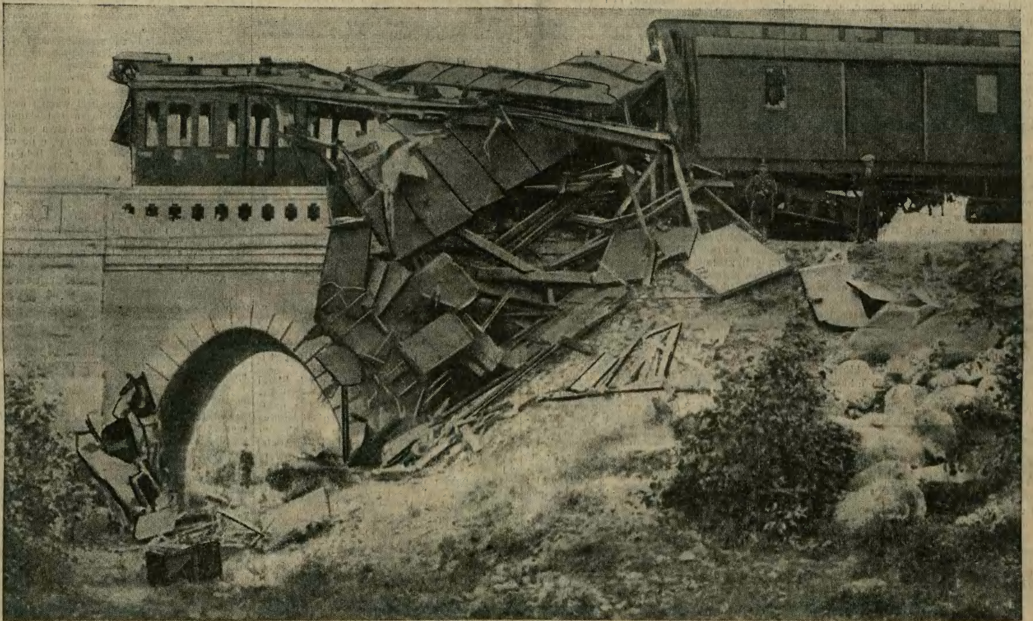
Wycina przedstawia miejsce strasznej katastrofy kolejowej, jaka wydarzyła się na stacji Sobolewo (w odległości 80 klm. od Warszawy), w której 3 osoby straciły życie, a 30 odniosło ciężkie rany.