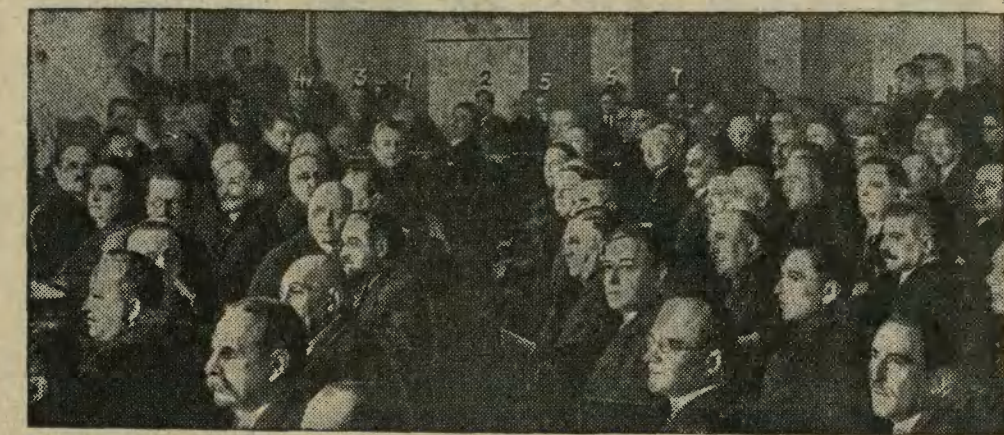
Z obrad przedstawicieli Izby przem. handl. w Min. Przem. i Handlu z udziałem p. premiera Świtalskiego (1), ministrów Kwiatkowskiego (2), Moraczewskiego (3), Prystora (4), Matuszewskiego (5), Kühna (6), Niezabytowskiego (7), oraz kół gospodarczych kraju.

gospodarczego, jako pewnego remedium na wybuchalność parlamentaryzmu i chęć drogą parlamentu gospodarczego uszczuplić prawa obecnych izb ustawodawczych. Pomysł te, wysuwane w latach ubiegłych z wielu stron, lansowane są ostatnio coraz słabiej i coraz mniej przekonująco. Charakterystycznym w tym względzie jest stanowisko oficjalnego „Przemysłu i Handlu”, który w ostatnim zeszycie (Z. 40) potępia te pomysły, dodając, że „mogłyby one zniewżyć samą ideę naczelnej Izby gospodarczej”.