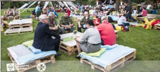
Harcerskie ŚDM w Więctawicach Starych