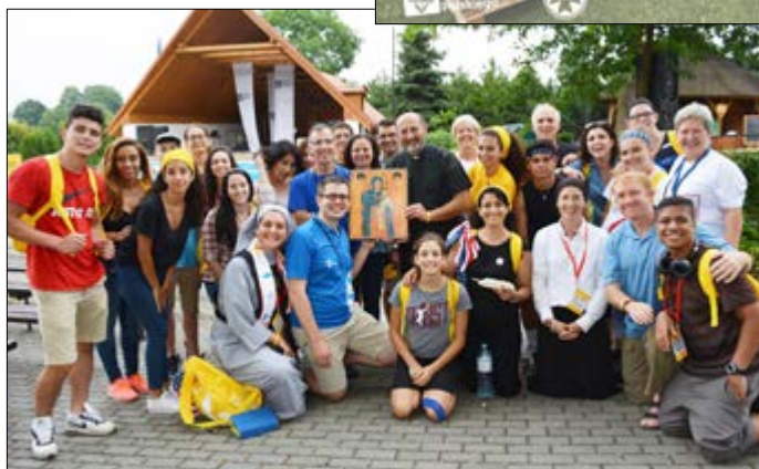
Przekazanie ikony Matki Bożej z Libanu przez grupę pielgrzymów z USA