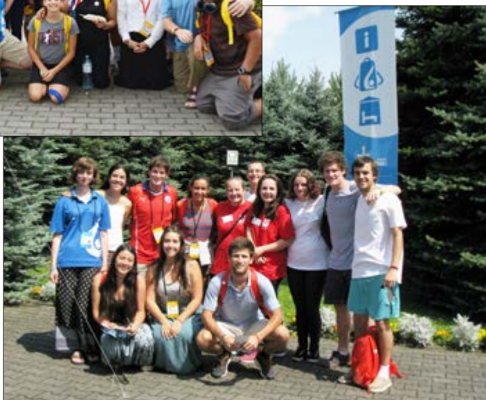
Wolontariusze z Michałowic z pielgrzymami z Chile