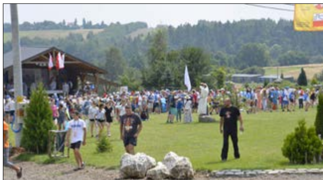
Pole namiotowe w Centrum Macierz Polonii