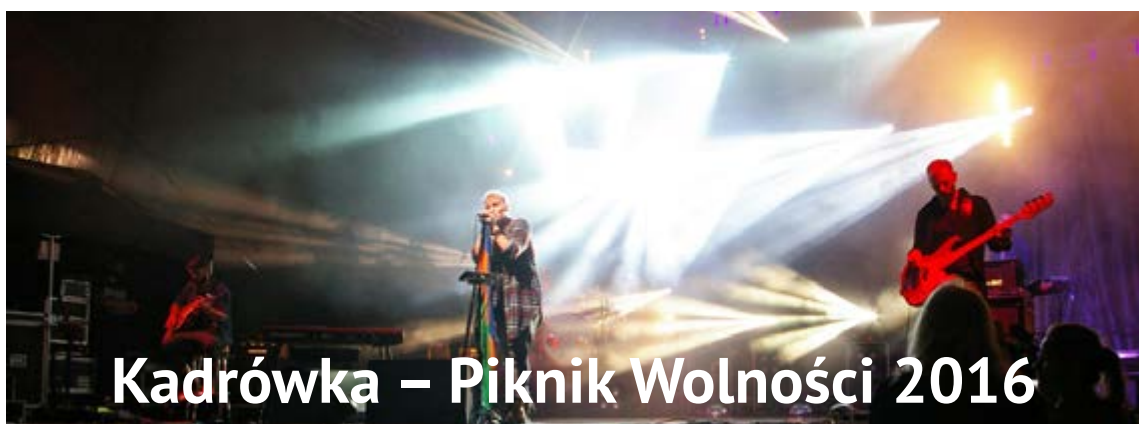
Kadrówka – Piknik Wolności 2016