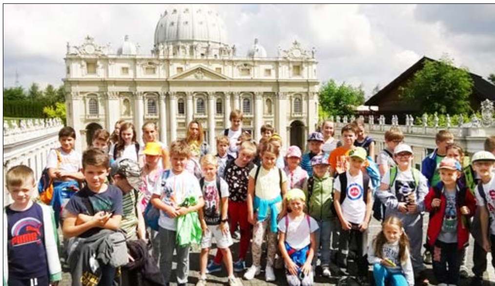
Wycieczka do Inwałdu