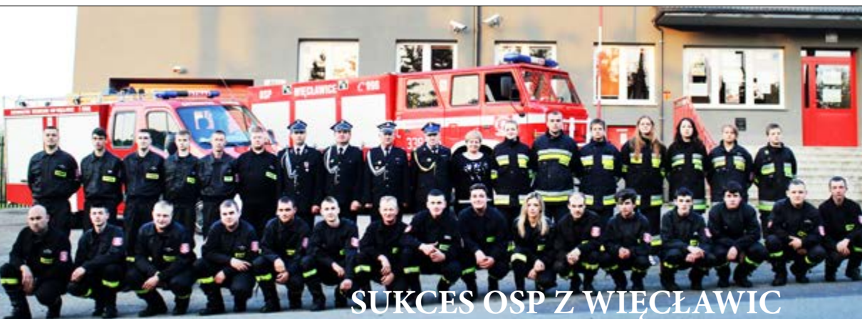
SUKCES OSP Z WIĘCŁAWIC