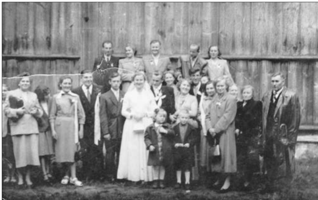
Lata 50. XX w. Ślub w Więctawicach.

Osoby zainteresowane udostępnieniem archiwaliów do zeskanowania lub nagraniem wspomnień proszone są o kontakt: kontakt@michas.org.pl , +48 510 683 503.