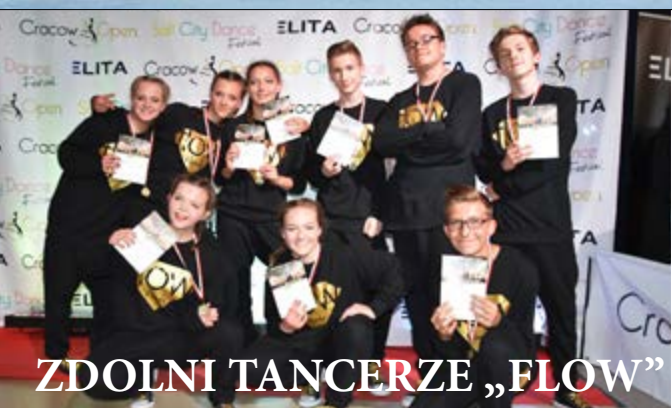
ZDOLNI TANCERZE „FLOW”