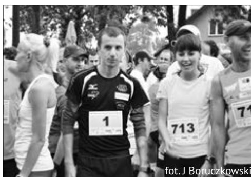
fol. J Boruczowski

Każdy uczestnik biegów głównych otrzyma podkoszulek oraz medal (nowy wzór, ale