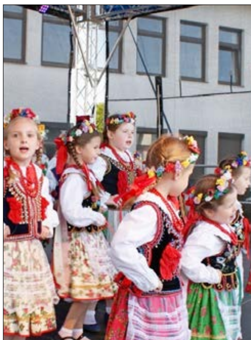
PIKNIK Z OKAZJI DNIA DZIECKA – PAWIE PIÓRA