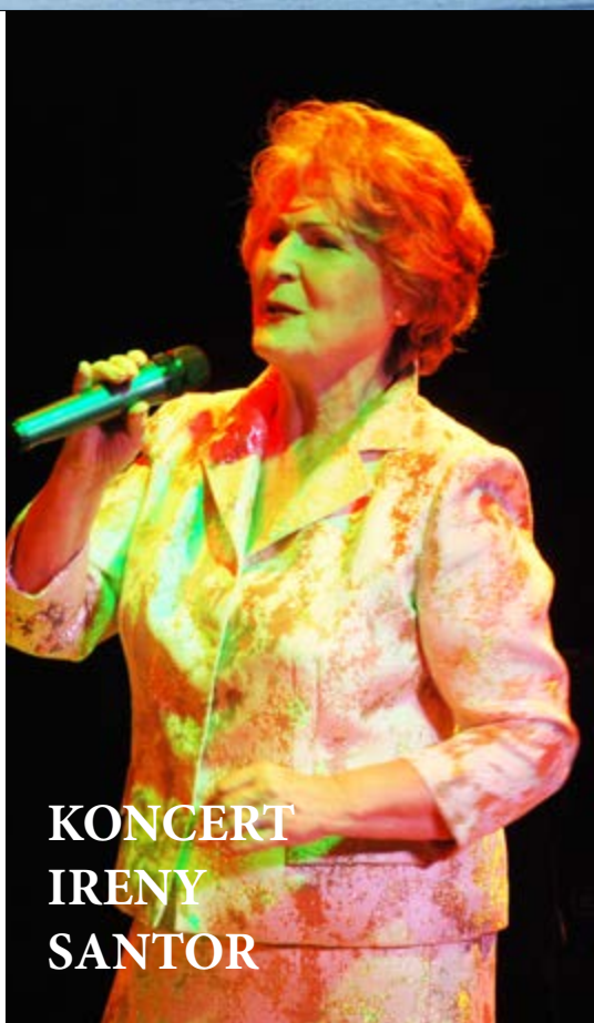
KONCERT IRENY SANTOR