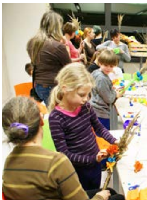
Warsztaty rękodzieła w Michałowicach