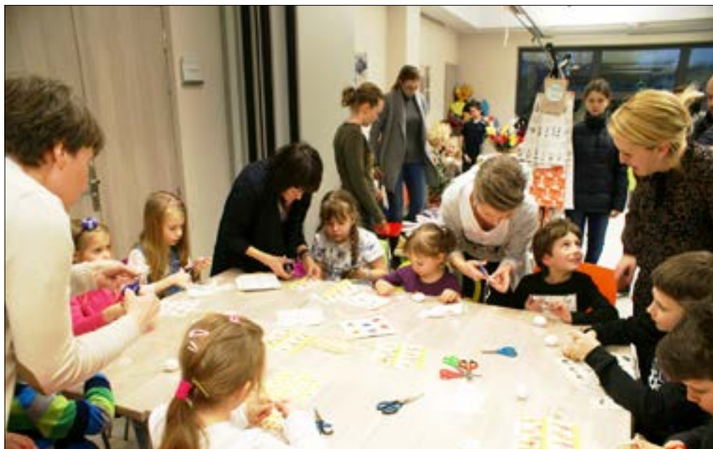
Warsztaty rękodzieła w Michałowicach