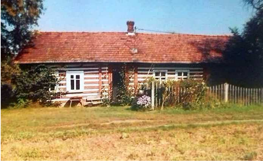
Fot. nr 2. Brzeźnica koło Skawiny.