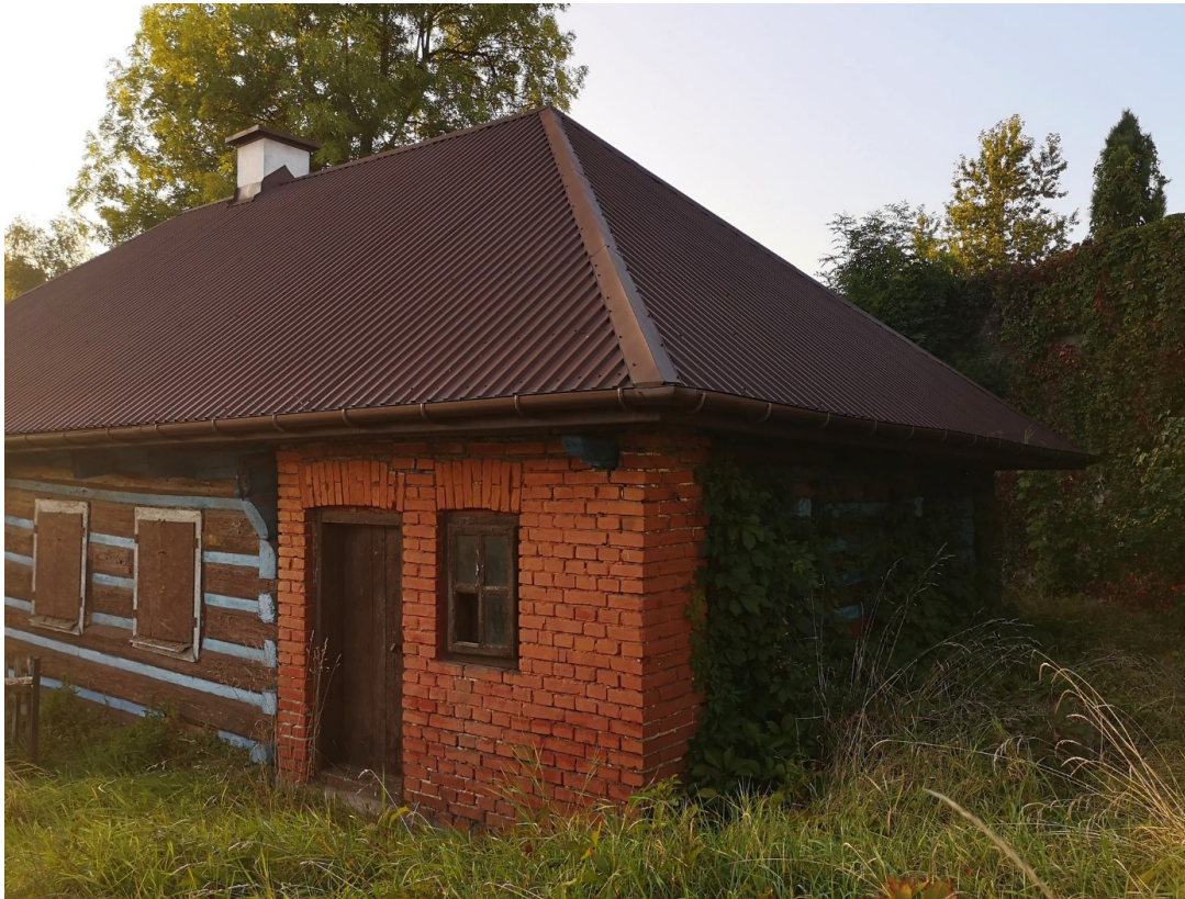
Fot. nr 157.