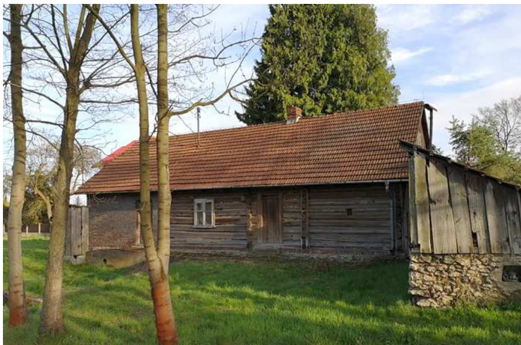
Fot. nr 76.