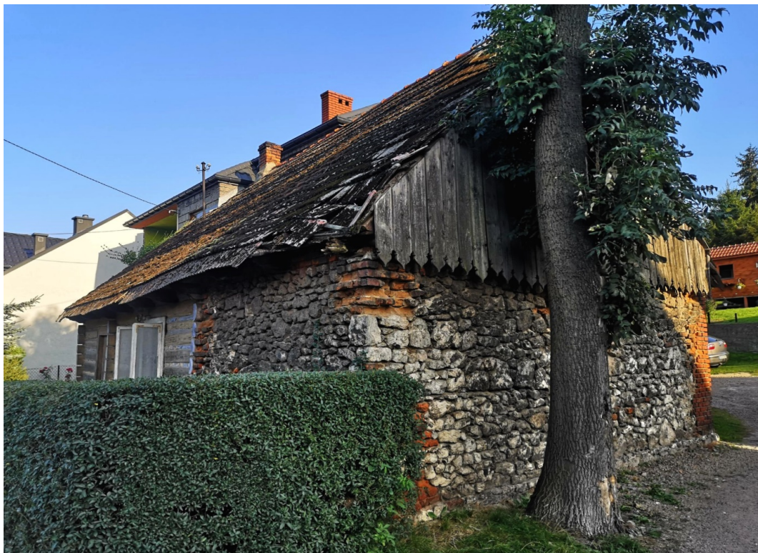
Fot. nr 172 (172 -175). Skromna chatka drewniana spod nr 63, z dobudowaną do niej z kamieni wapiennych częścią gospodarczą i jej detale.