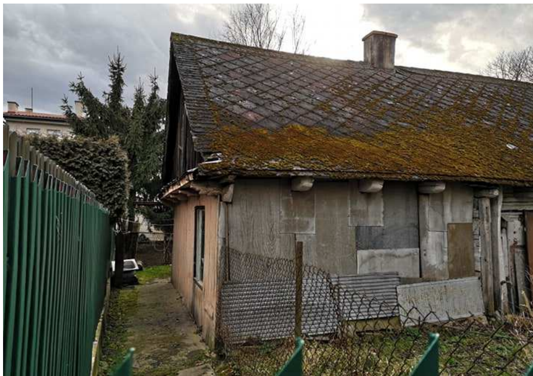
Fot. nr 11. Szczytowa ściana wewnętrzna.