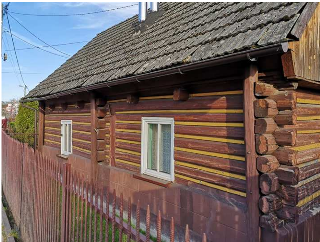
Fot. nr 63.