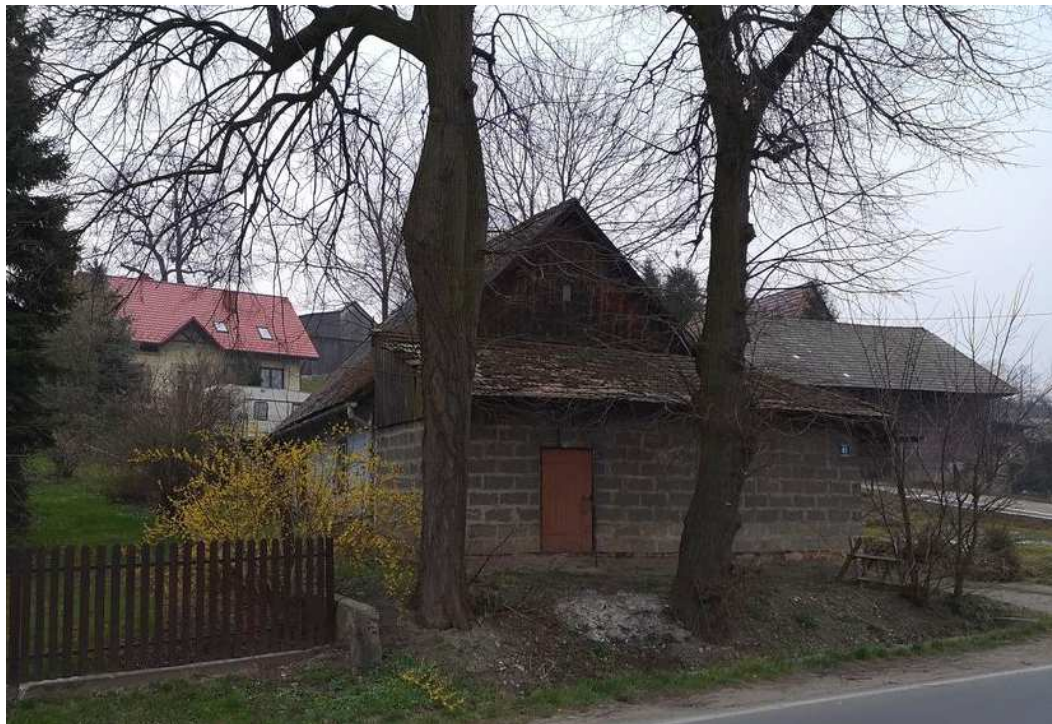
Fot. nr 217 (217-218). Widoki na boczny i tylny fragment.