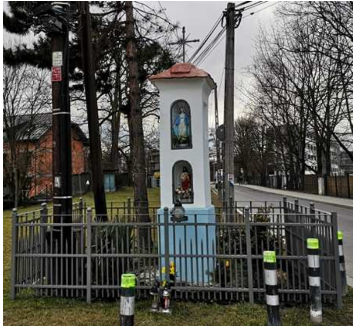
Fot. nr 3. Kapliczka z ulicy Filtrowej.