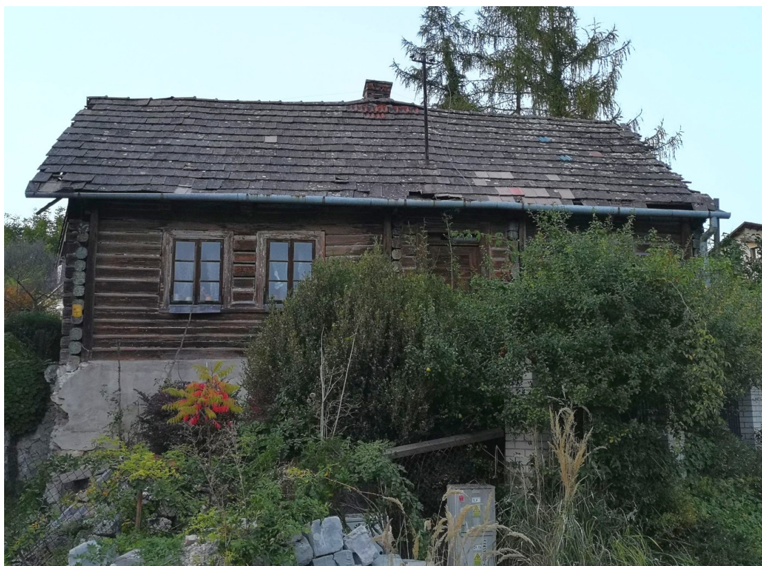
Fot. nr 34.