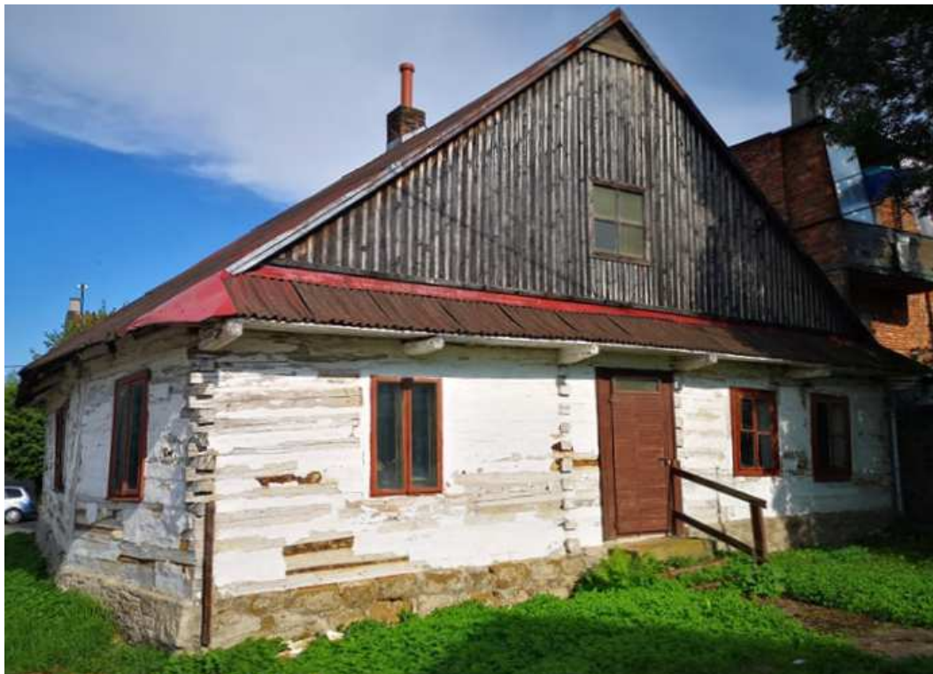
Fot. nr 242 (242-243). Druga ze ścian szczytowych.