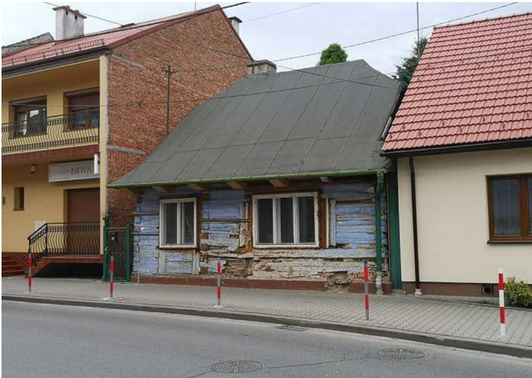
Fot. nr 198 (198-201). Archaiczna chatka z ulicy Zamkowej 18. Fot. nr: 198-200. Stan sprzed remontu.