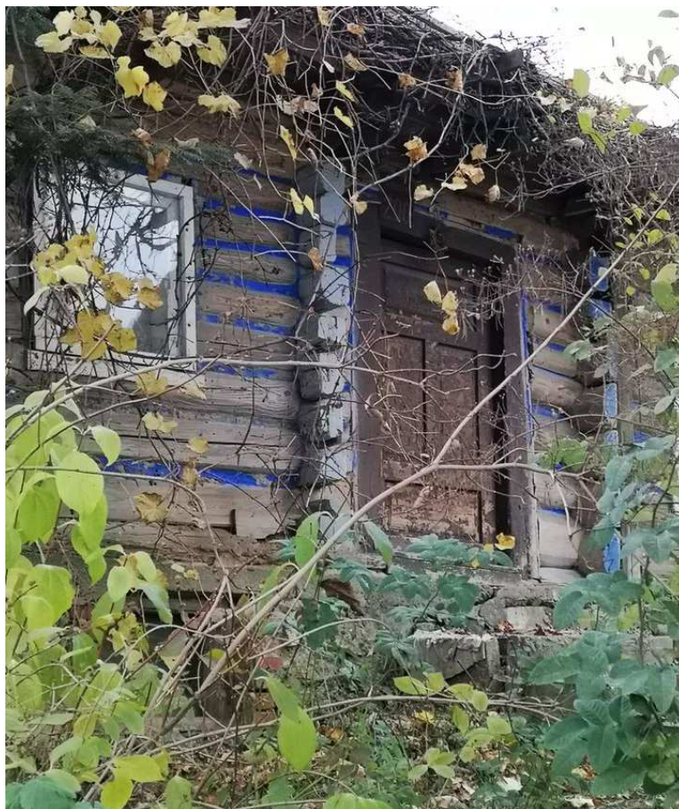
Fot. nr 133.