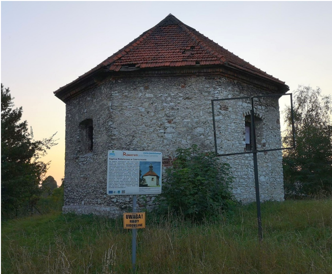
Fot. nr 167.