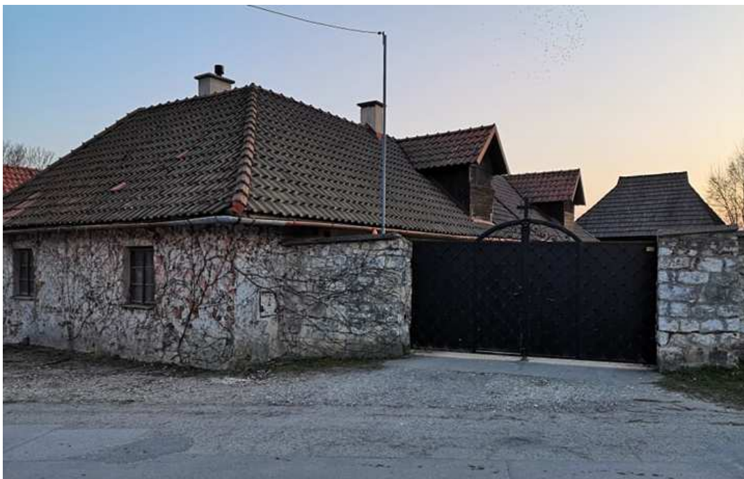
Fot. nr 184 (184-187). Zabudowania folwarku pod nr 33.