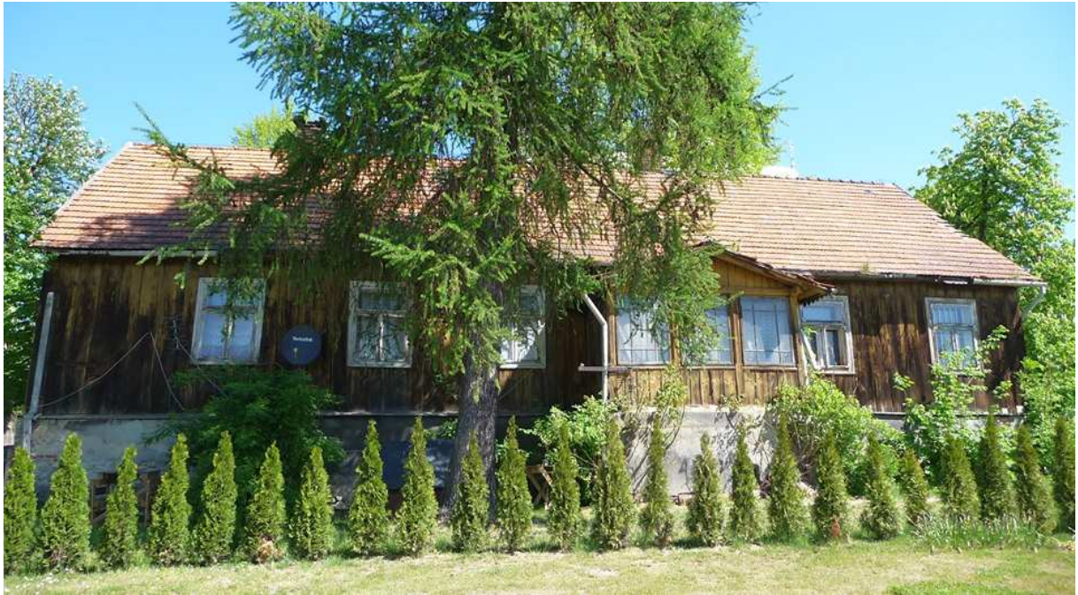
Fot. nr 301 (301-304). Rozległy dom z przełomu lat 20/30 z ulica Jana Pawła II (?) – może stara plebania?