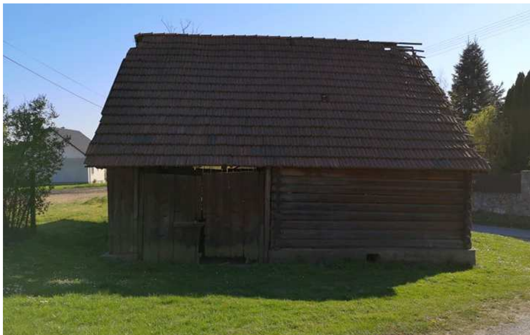
Fot. nr 109.