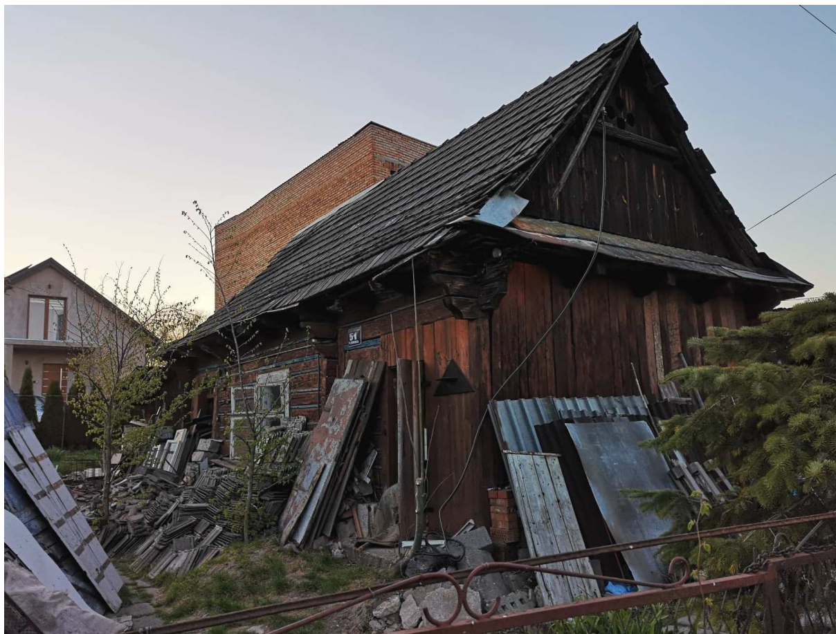
Fot. nr 83 (83-84). Zapewne około 100-letnia chałupa z ulicy Korzeniaka 51.