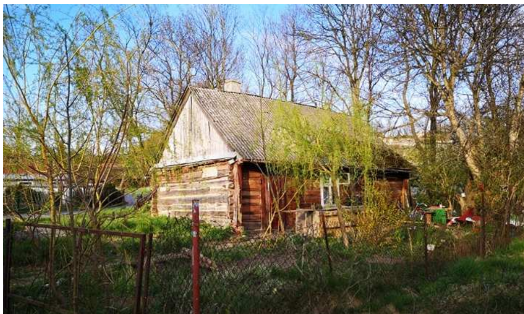
Fot. nr 72 (72-73). Oryginalna chatka pod nr 81.