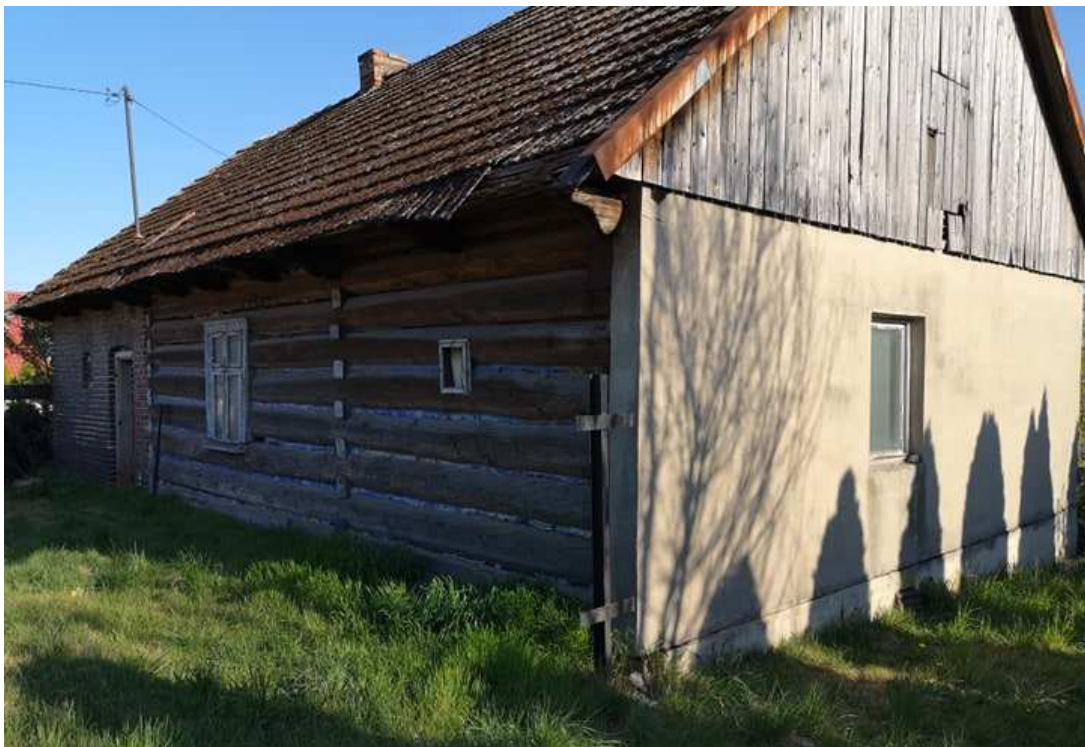
Fot. nr 114.