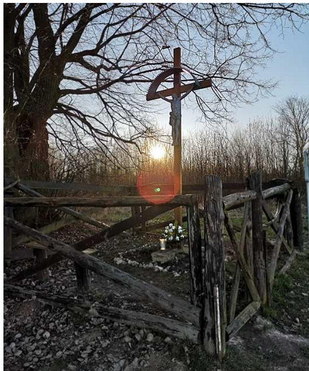
Fot. nr 16.