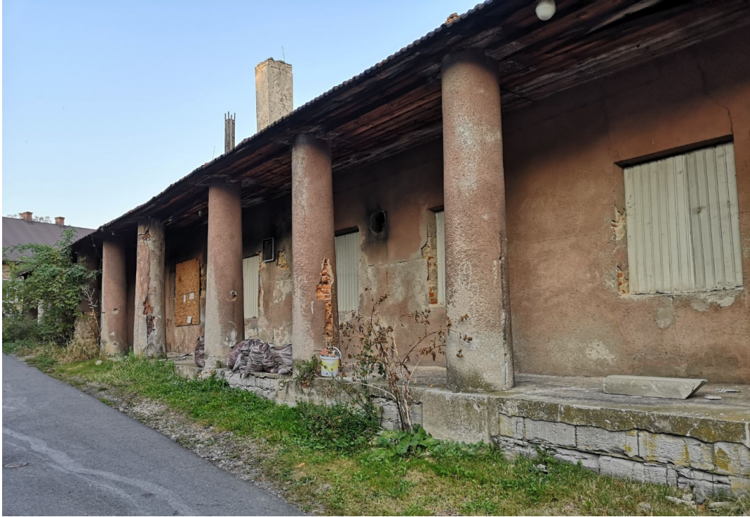
Fot. nr 163.