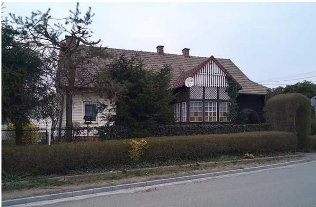
Fot. nr 211 (210-212). Widoki z ulicy Kościelnej.