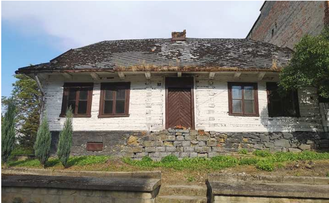
Fot. nr 245 (245-246). Frontowa ściana.