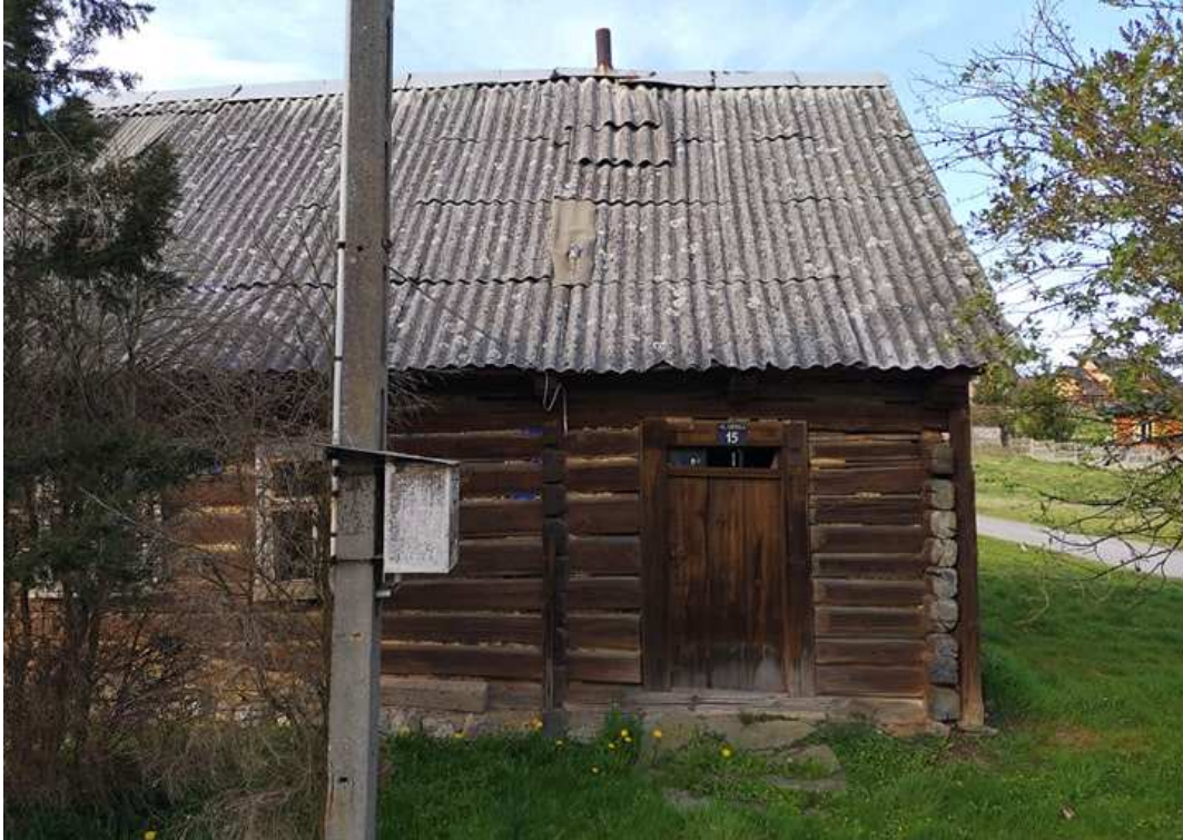
Fot. nr 47 (47-50). Drzwi frontowe i ich detale.