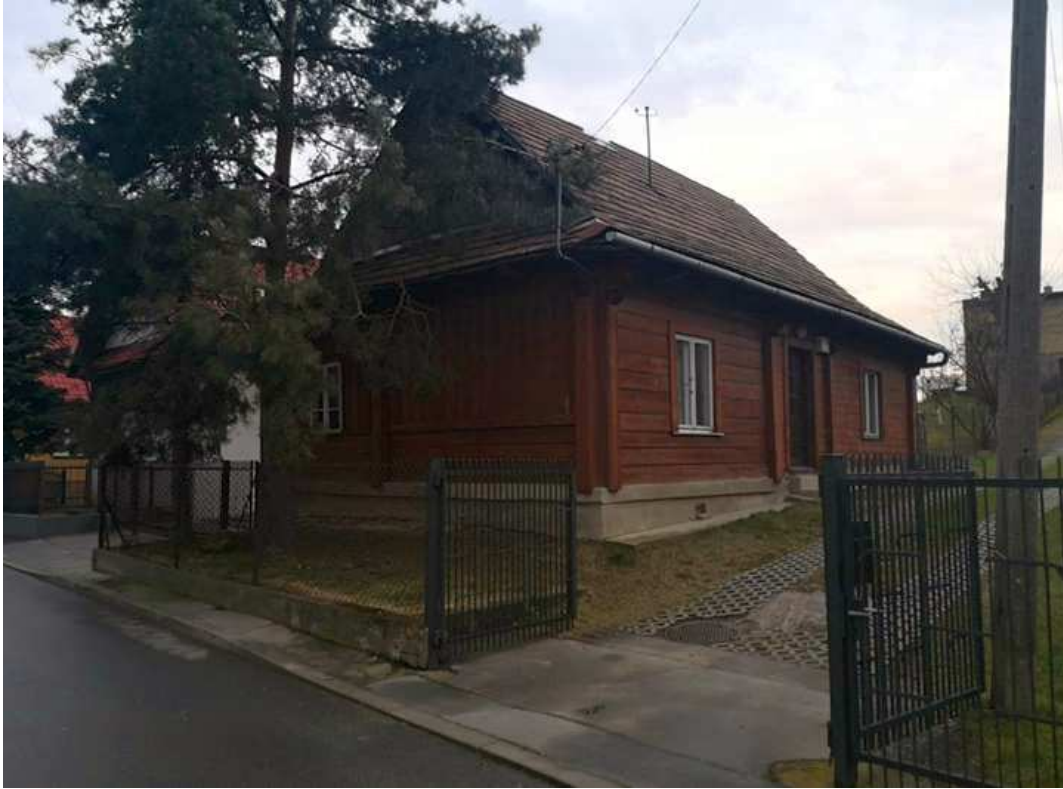
Fot. nr 87 (87-88). 100-letni dom z ulicy Majówny 42. (1919)