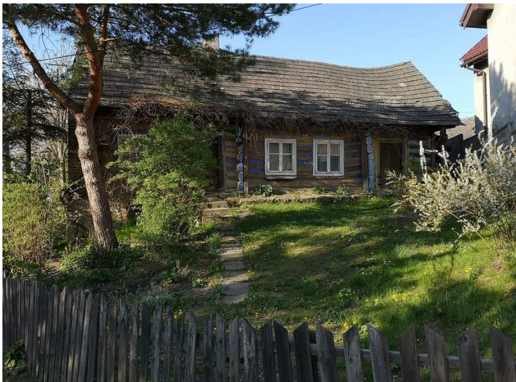
Fot. nr 131 (131-133). Wybudowana gdzieś na początku XX wieku chałupa spod nr 200.