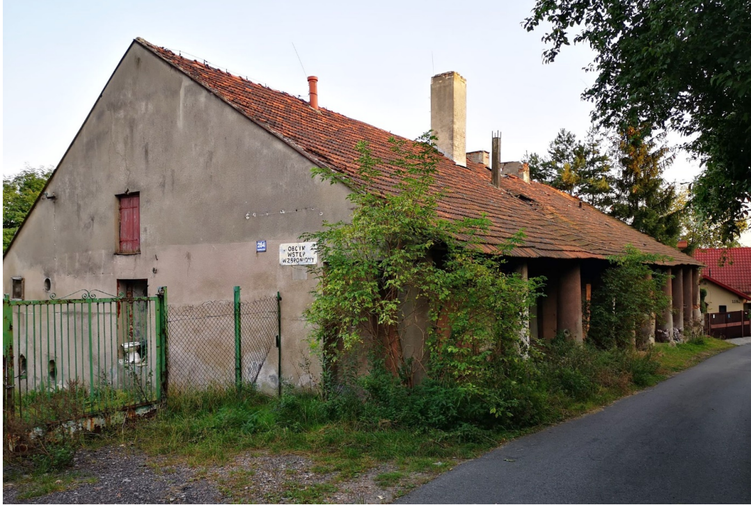
Fot. nr 161 (161-164). Karczma podcieniowa z pocz. XIX wieku spod nr 284 i jej detale.