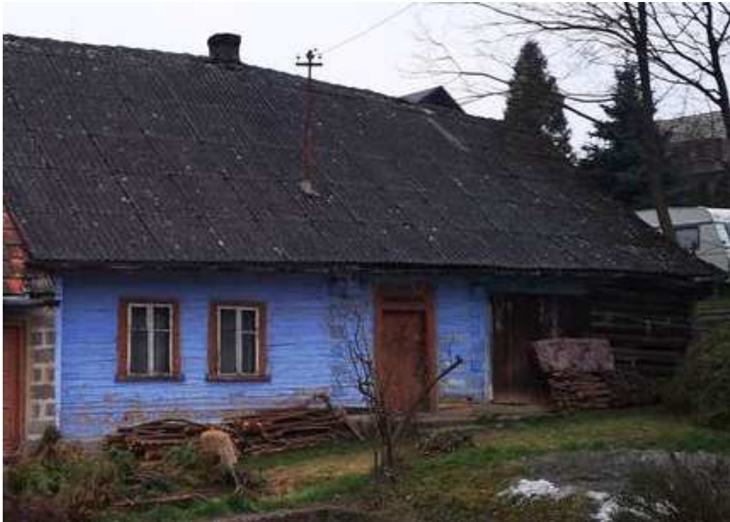
Fot. nr 216.