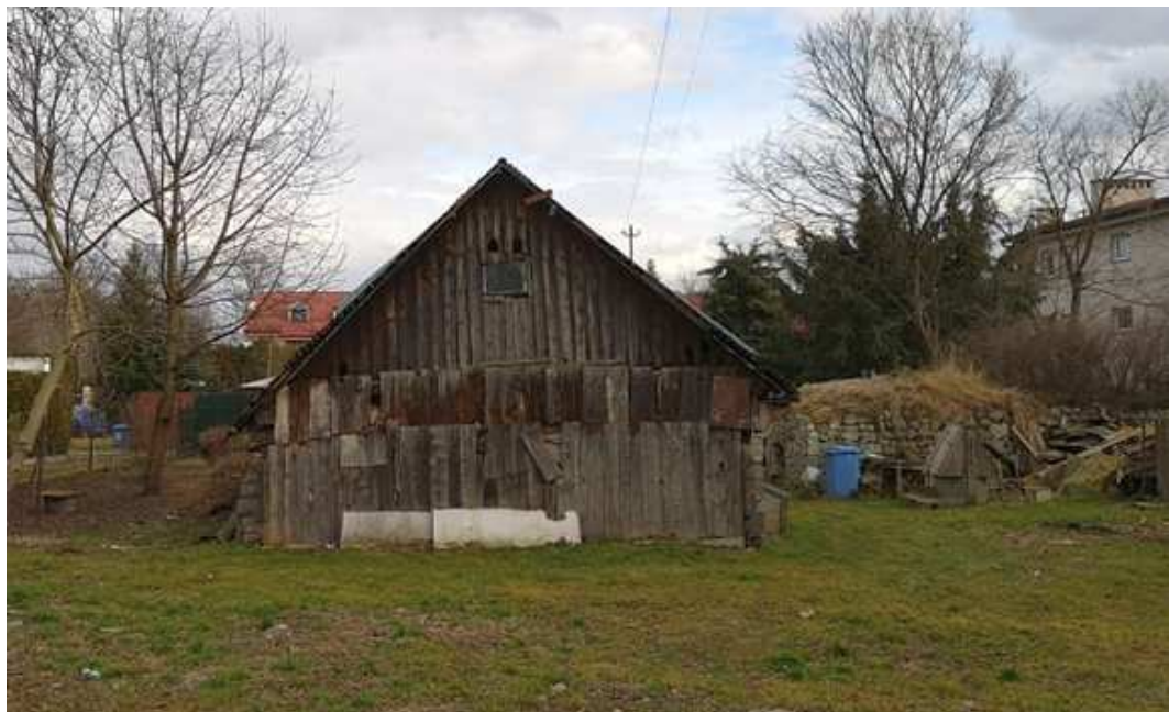
Fot. nr 10. Ściana szczytowa w ujęciu z ulicy