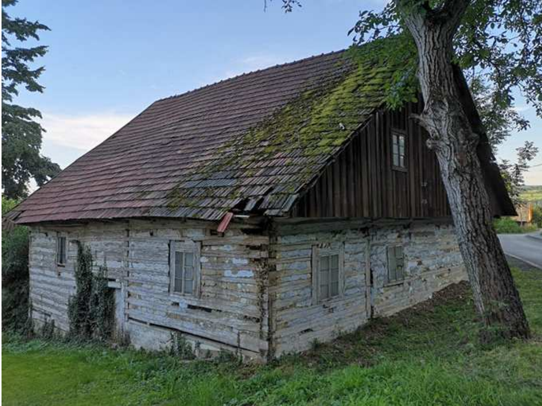
Fot. nr 373. Widok na tylną część.