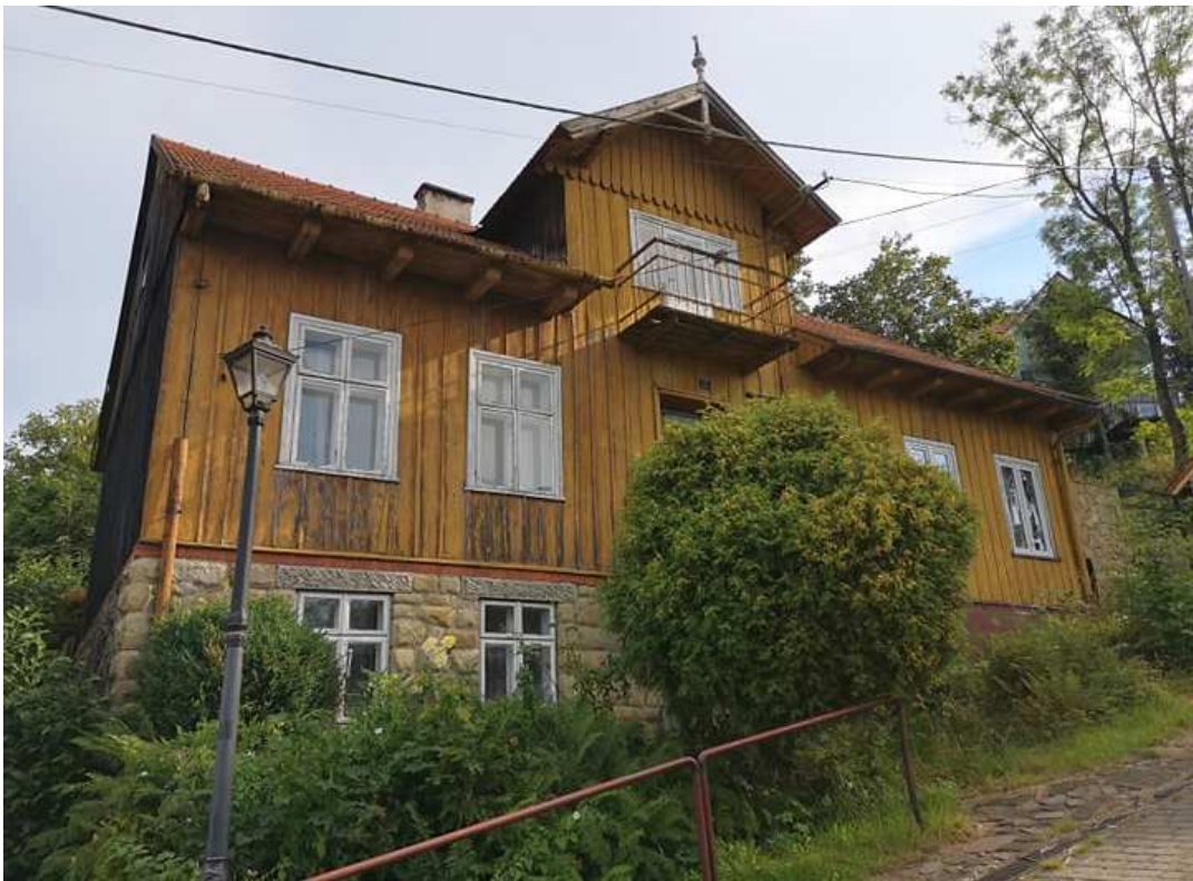
Fot. nr 252 (252-253). Willa z facjatką, która mogła powstać w latach 30. zeszłego wieku.