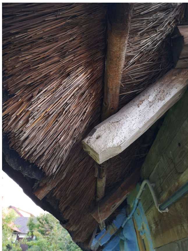
Fot. nr 30. Strzecha ukryta pod papą.