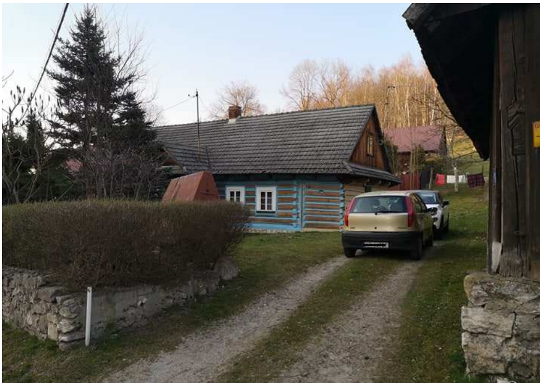
Fot. nr 193.