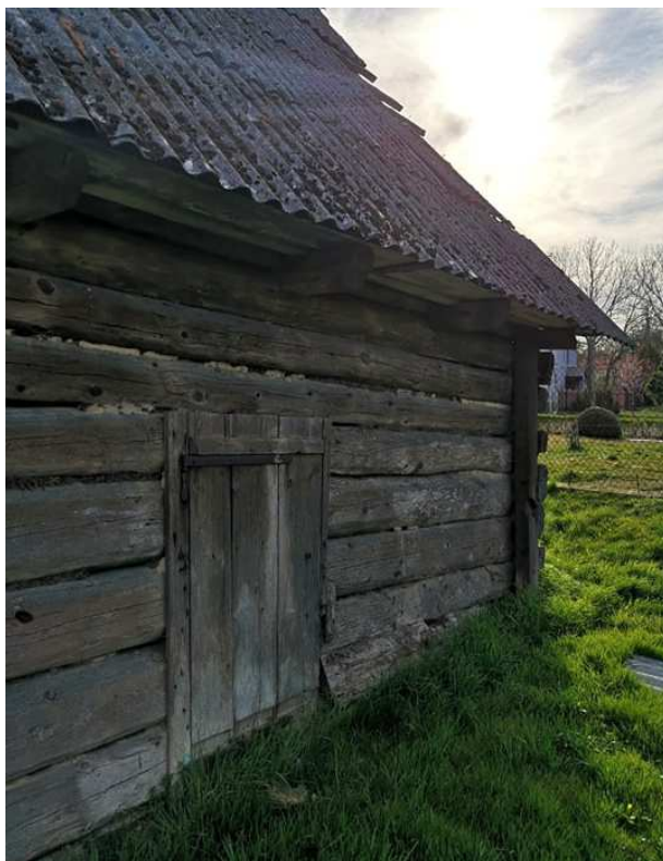
Fot. nr 54 (54-55). Drzwi od części gospodarczej.