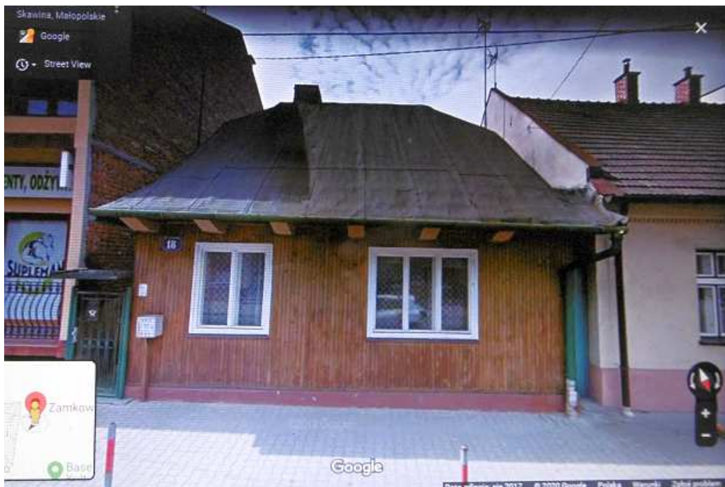
Fot. nr 201. Stan po remoncie.