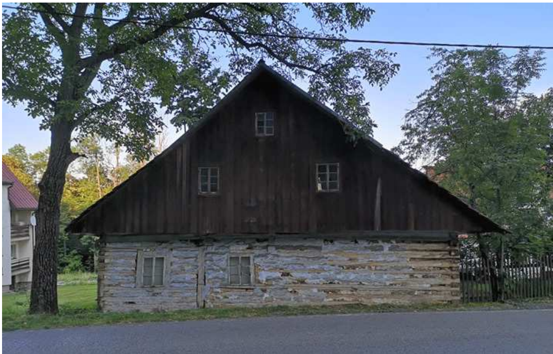
Fot. nr 268 (267-269). Ściana szczytowa.