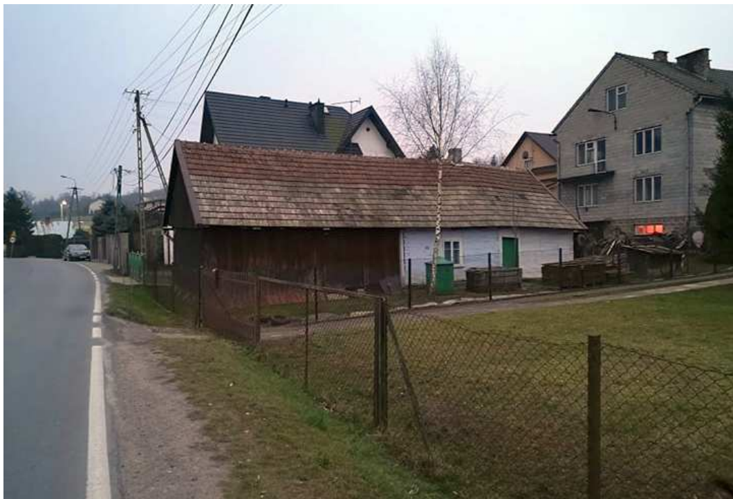
Fot. nr 207.