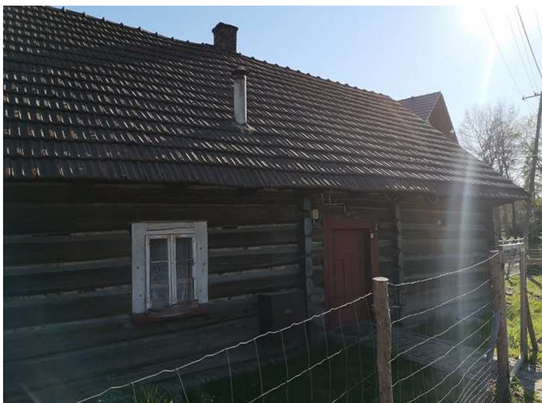
Fot. nr 102.