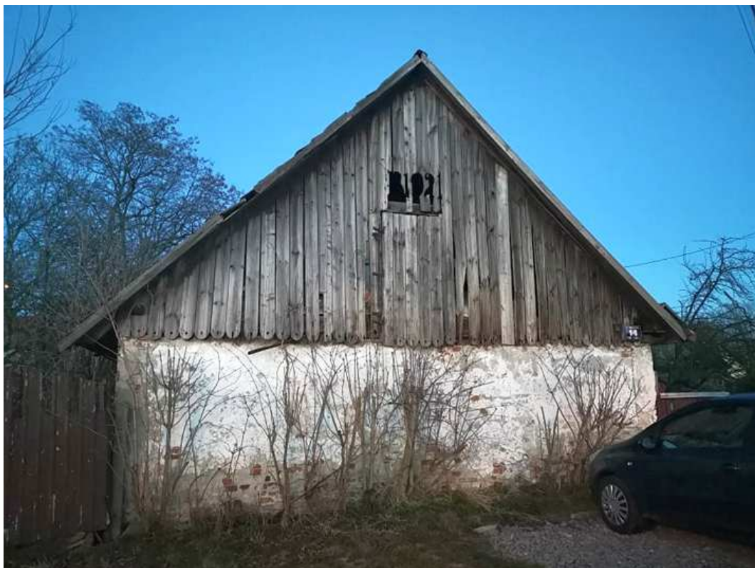
Fot. nr 89 (89-90). Zapewne przedwojenny, murowany dom z ulicy Jantarowej 14.