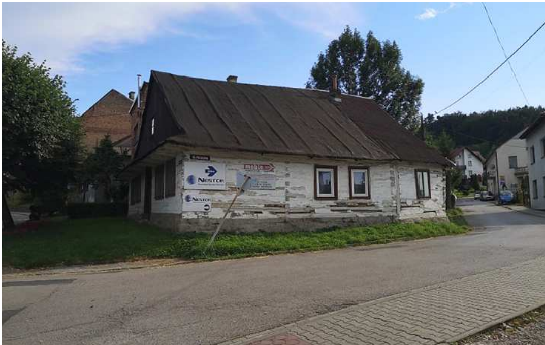
Fot. nr 236 (236-244). Rozległa chałupa z dachem okapowym z ulicy Piaskowej 2, która mogła powstać na przełomie XIX i XX wieku.