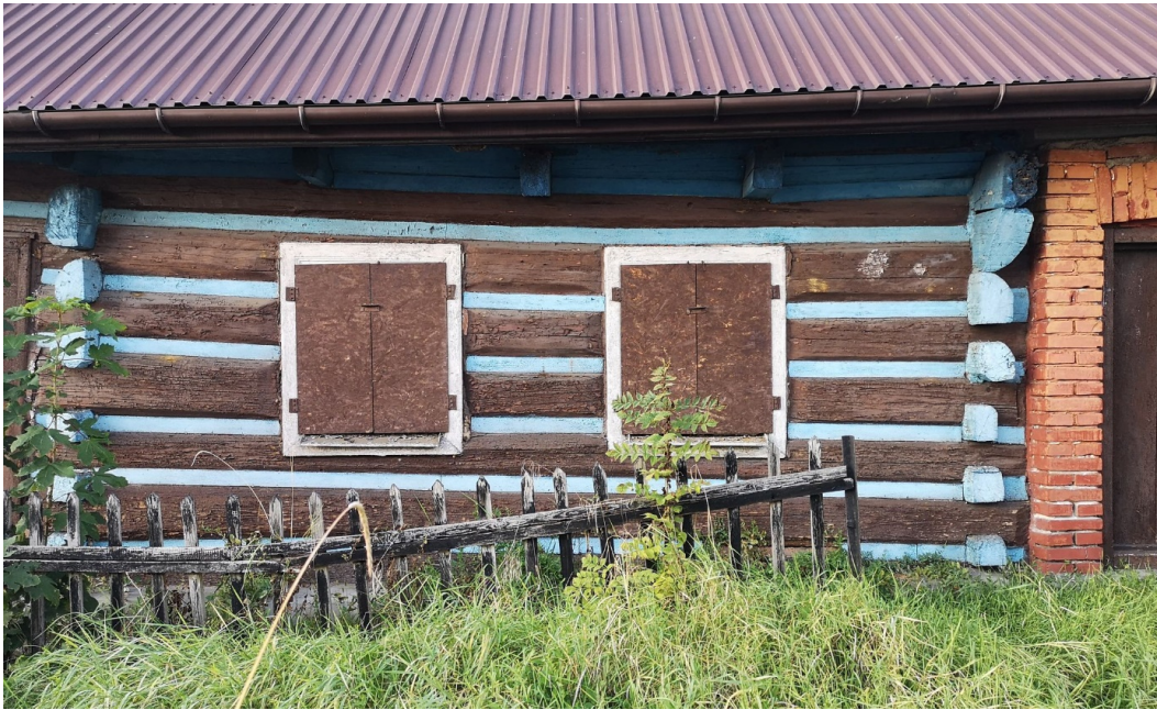
Fot. nr 155.