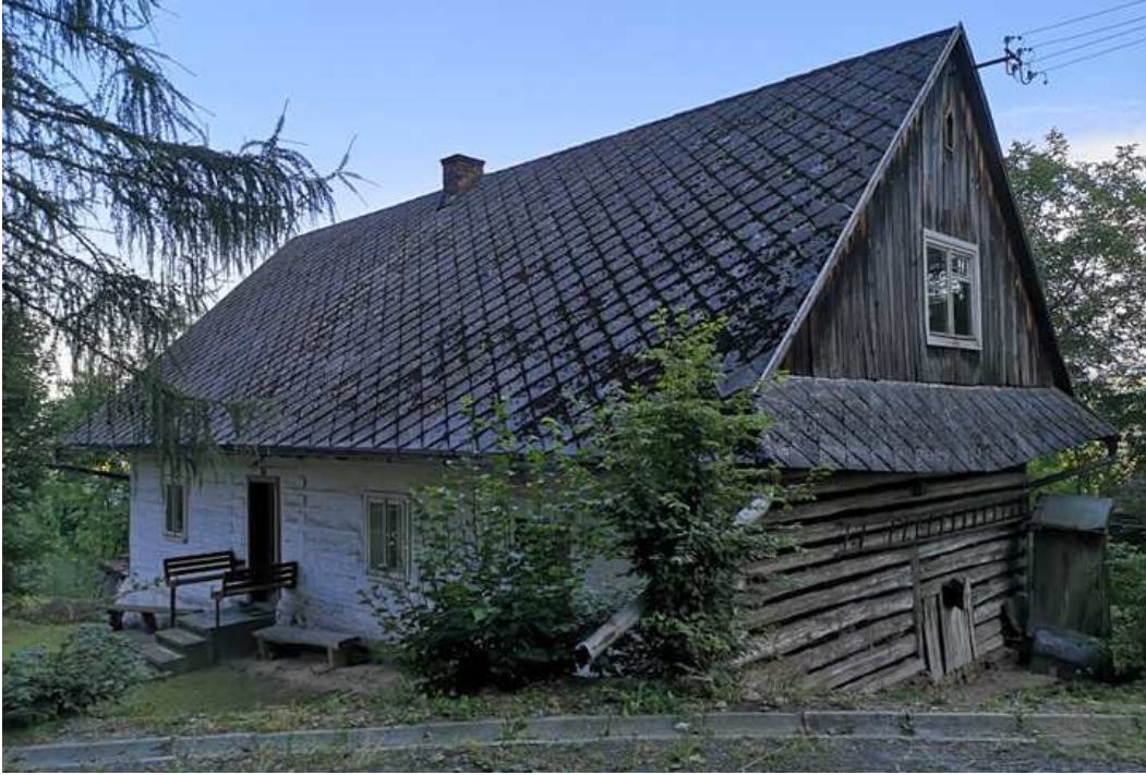
Fot. nr 287. Front i ściana szczytowa.