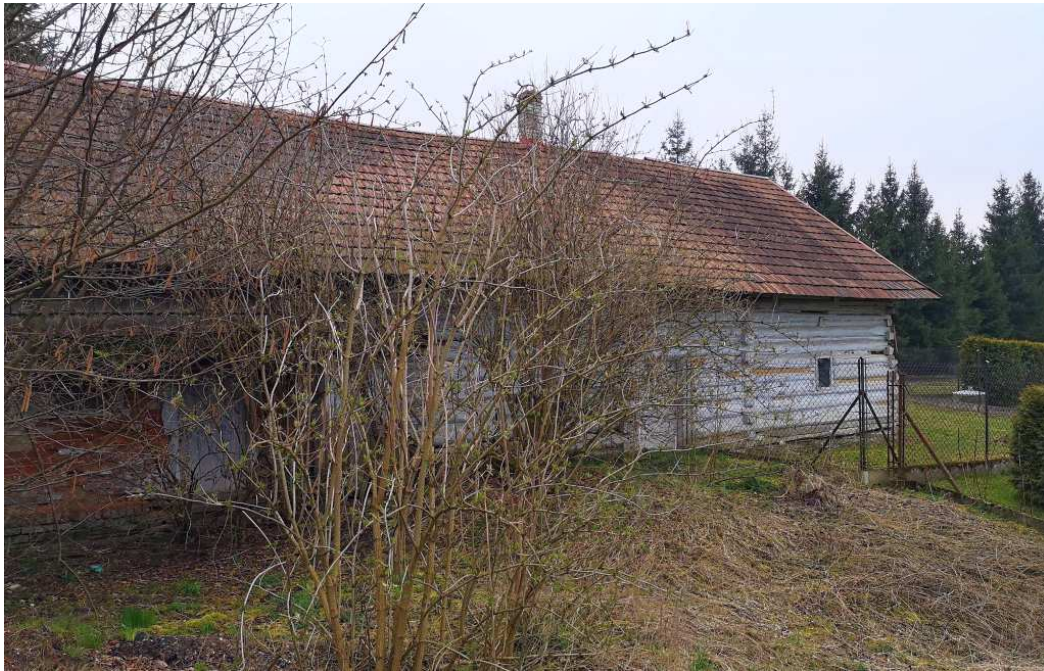
Fot. nr 226. Tylna część chałupy.