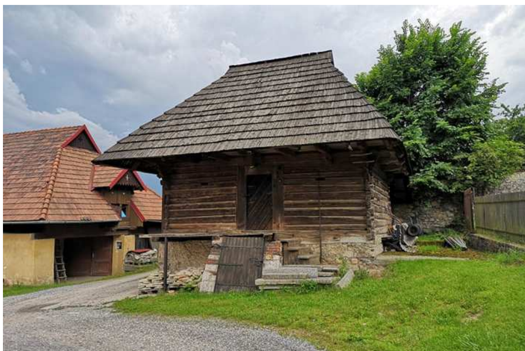
Fot. nr 187.