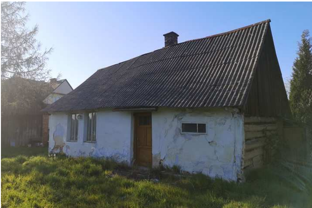
Fot. nr 116. Pokryta tynkiem dawna chałupa o nieustalonej lokalizacji.