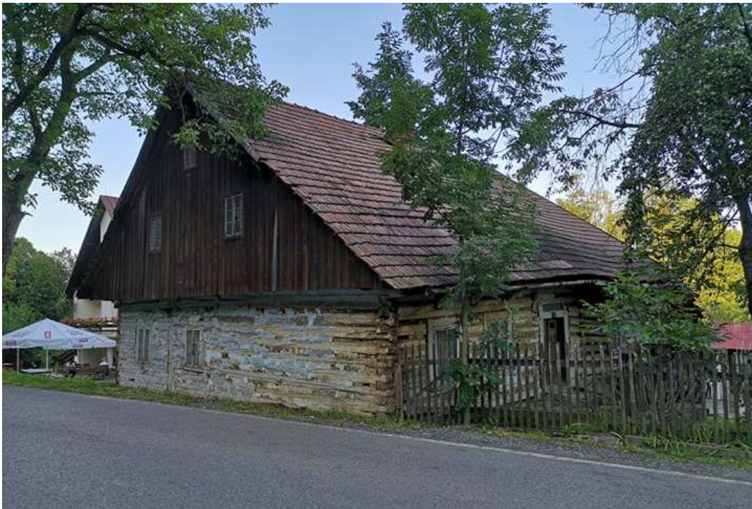
Fot. nr 270 (270-272). Fasada chałupy od strony ogrodu i jej detale.