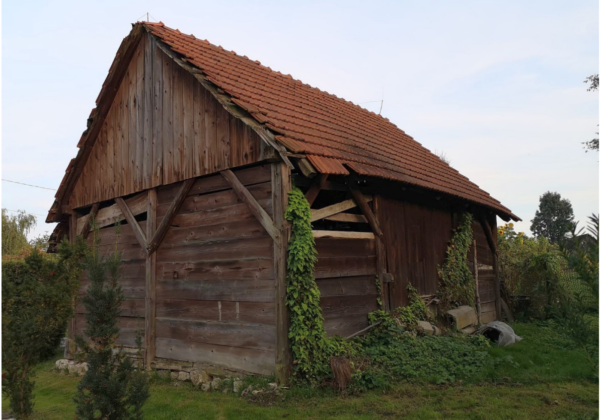
Fot. nr 41 (41-42). Przykład niewielkiej stodoły.