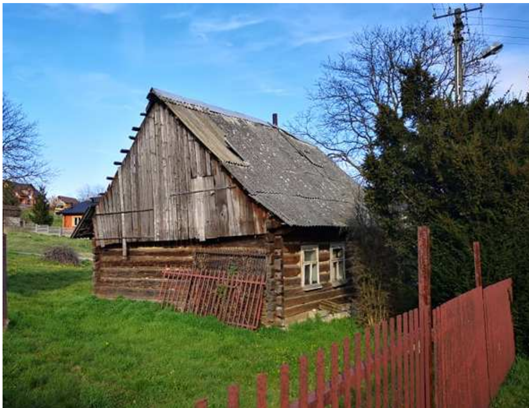
Fot. nr 43 (43-56). Około 100-letnia chałupa z ulicy Wesolej 15 i jej detale.