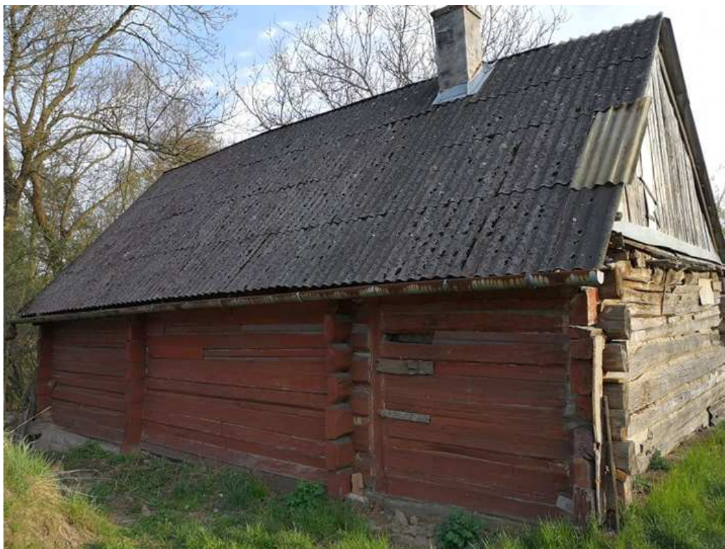
Fot. nr 73.