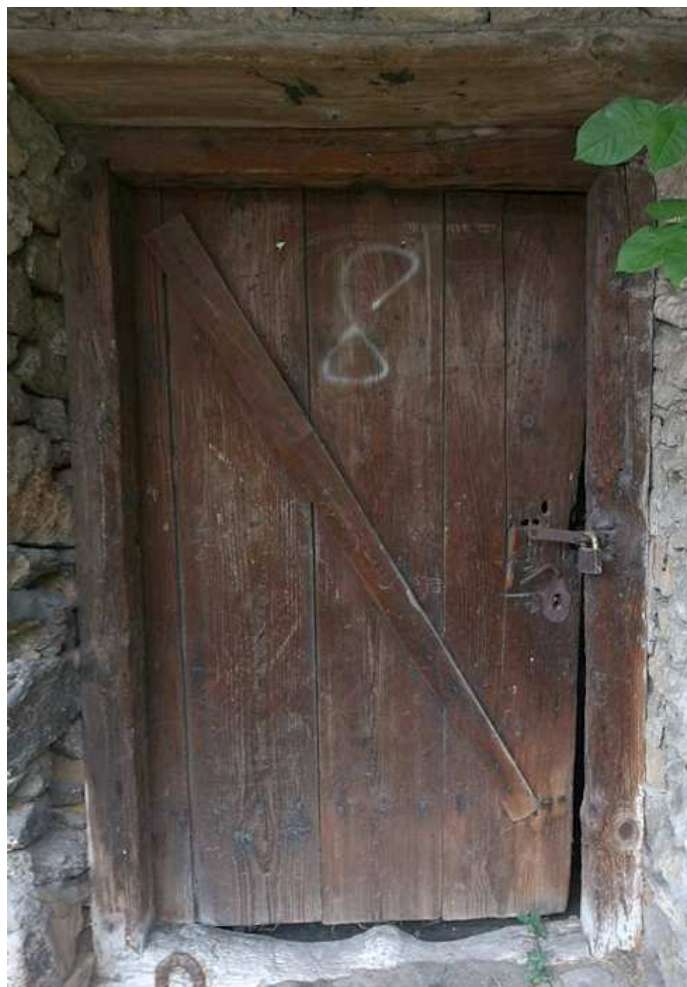
Fot. nr 37 (37-38). Oryginalne drzwi i ich zamknięcie.