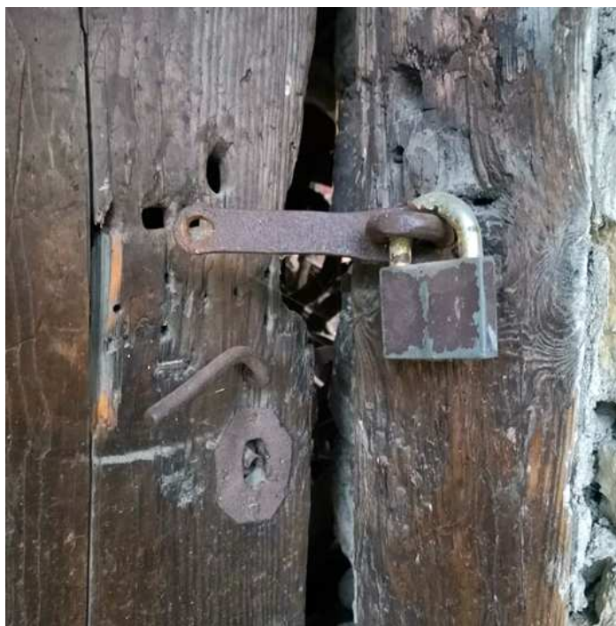
Fot. nr 38.