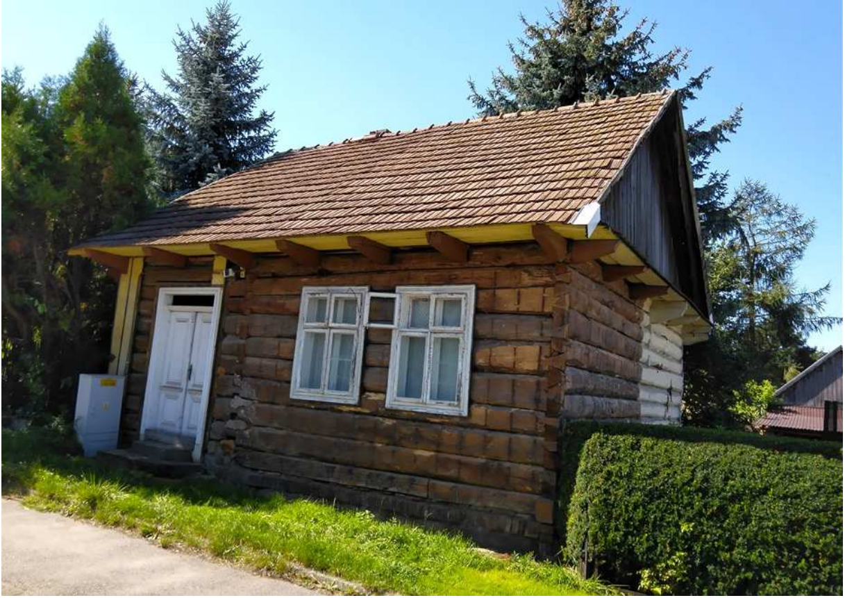
Fot. nr 312. Około stuletni domek spod nr 211 (?).