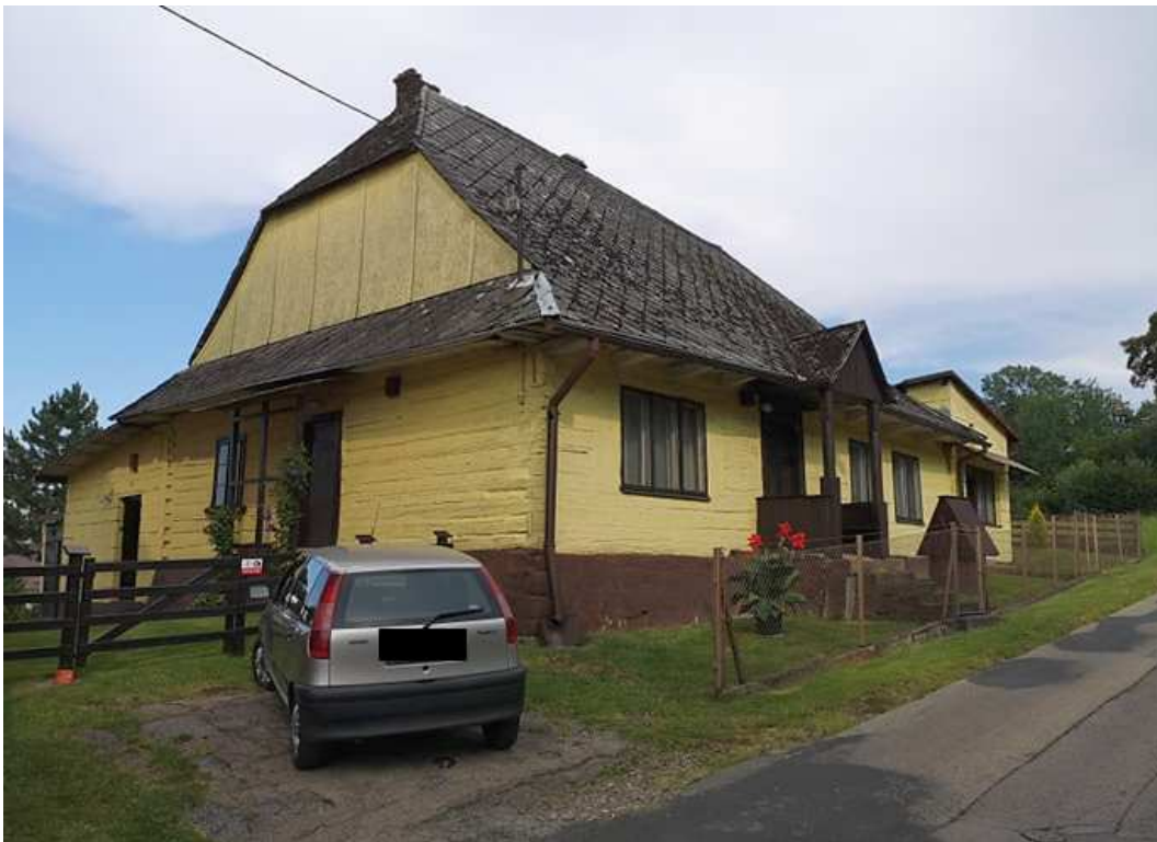
Fot. nr: 248-257. Domy przy ulicy Bernardyńskiej, których obrazy nie są dostępne w Google. Obiekty w kolejności od dołu ulicy.