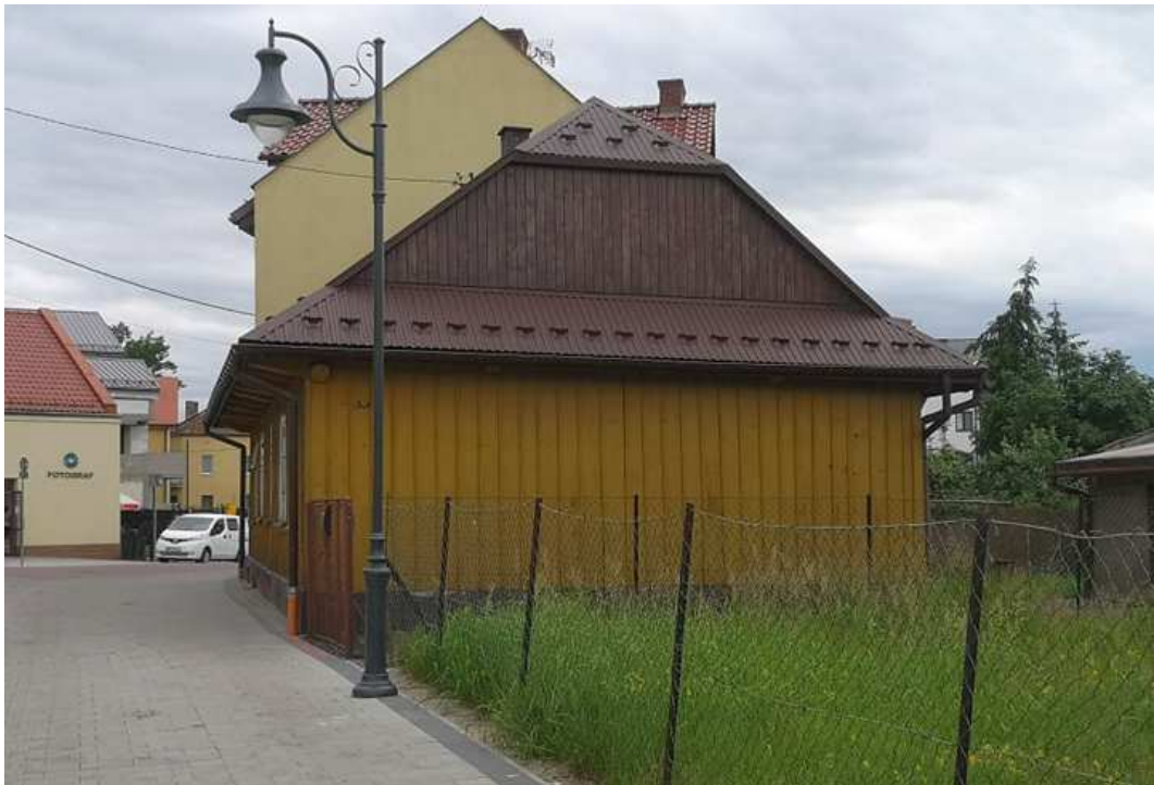
Fot. nr 203.