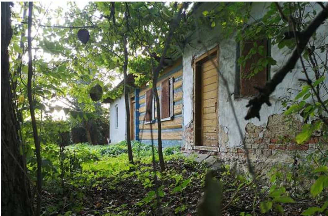
Fot. nr 171. Front ponad 100-letniej chałupy o nieustalonej lokalizacji.