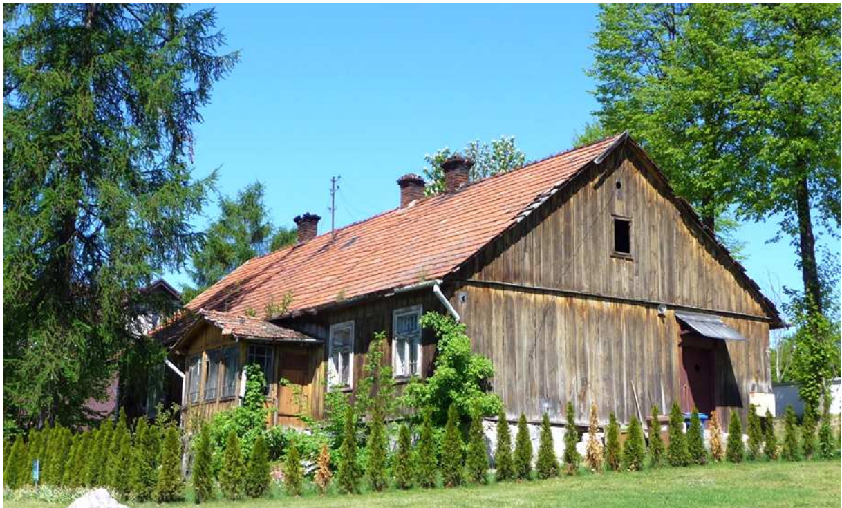
Fot. nr 302.