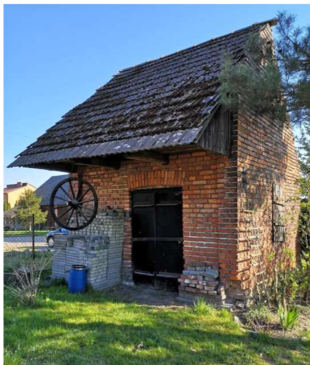
Fot. nr 120. Solidnie odnowiony, ceglany budynek zapewne dawnej kuźni.