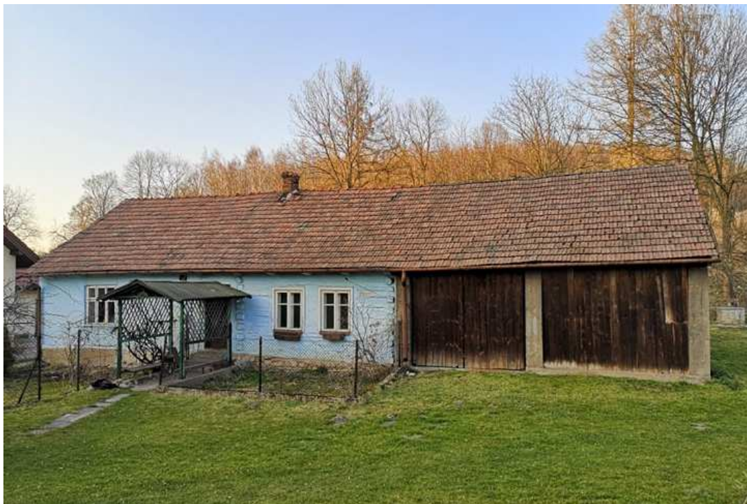
Fot. nr 191. Bielona chałupa spod 38, która powstała na początku XX wieku, gdzie część mieszkalna znajduje się we wspólnym korpusie ze stodołą.