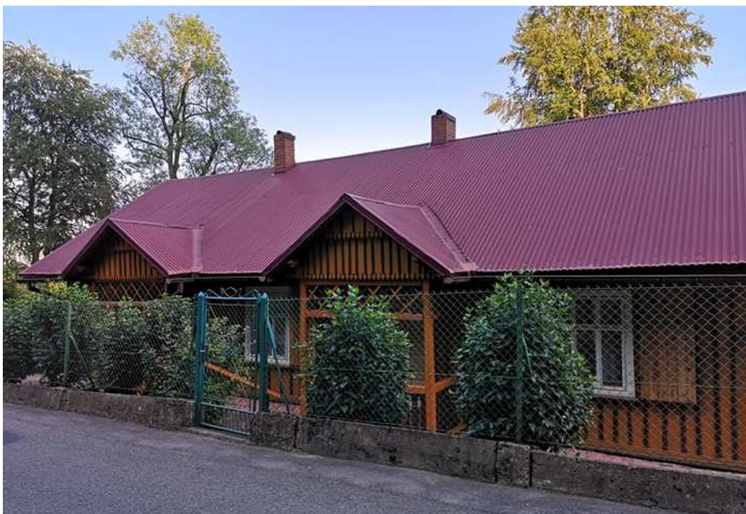
Fot. nr 278. Zapewne przedwojenny dom z profilowanym gankiem spod nr 19.