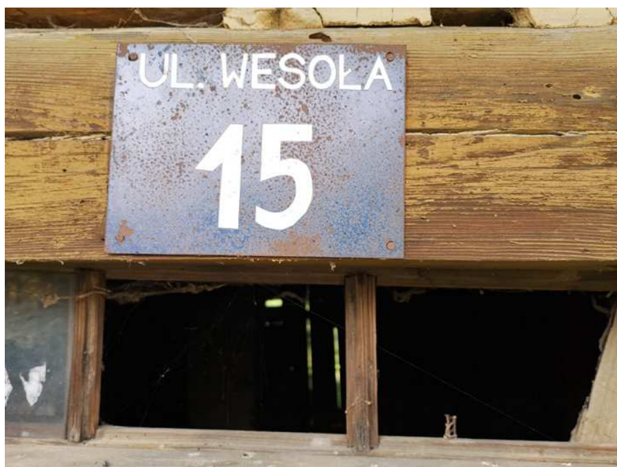
Fot. nr 50.