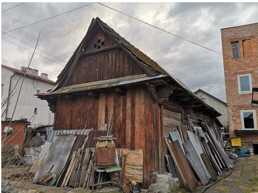
Fot. nr 84.