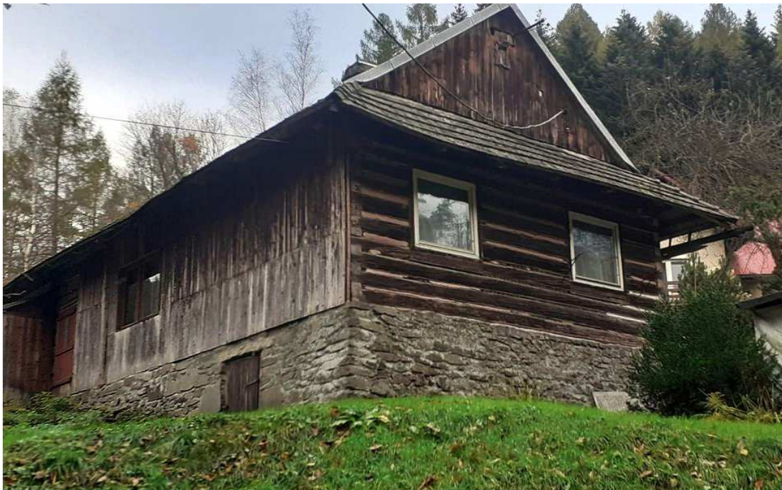
Fot. nr 329. Ściana szczytowa.