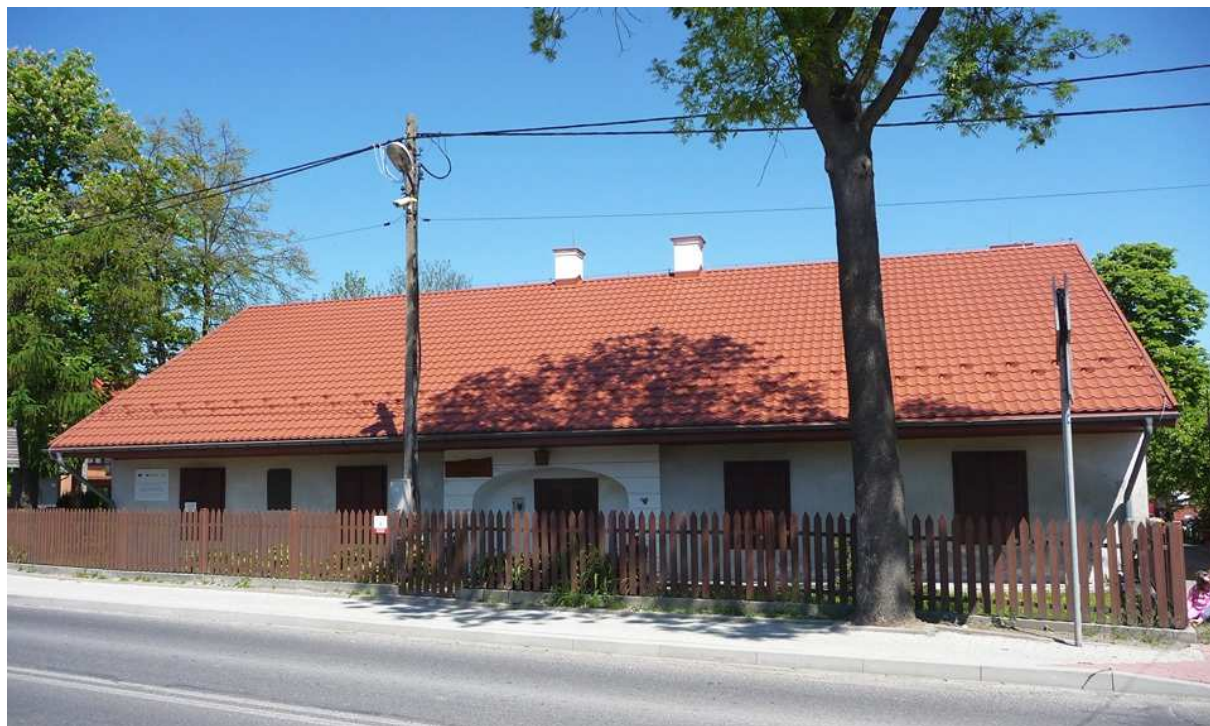
Fot. nr 305 (305-307). Muzeum Regionalne przy ulicy Warszawskiej 1.