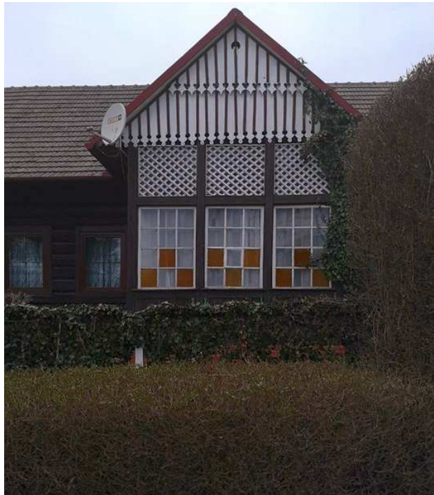
Fot. nr 212. Ganek zdobiony kolorowymi szybkami.