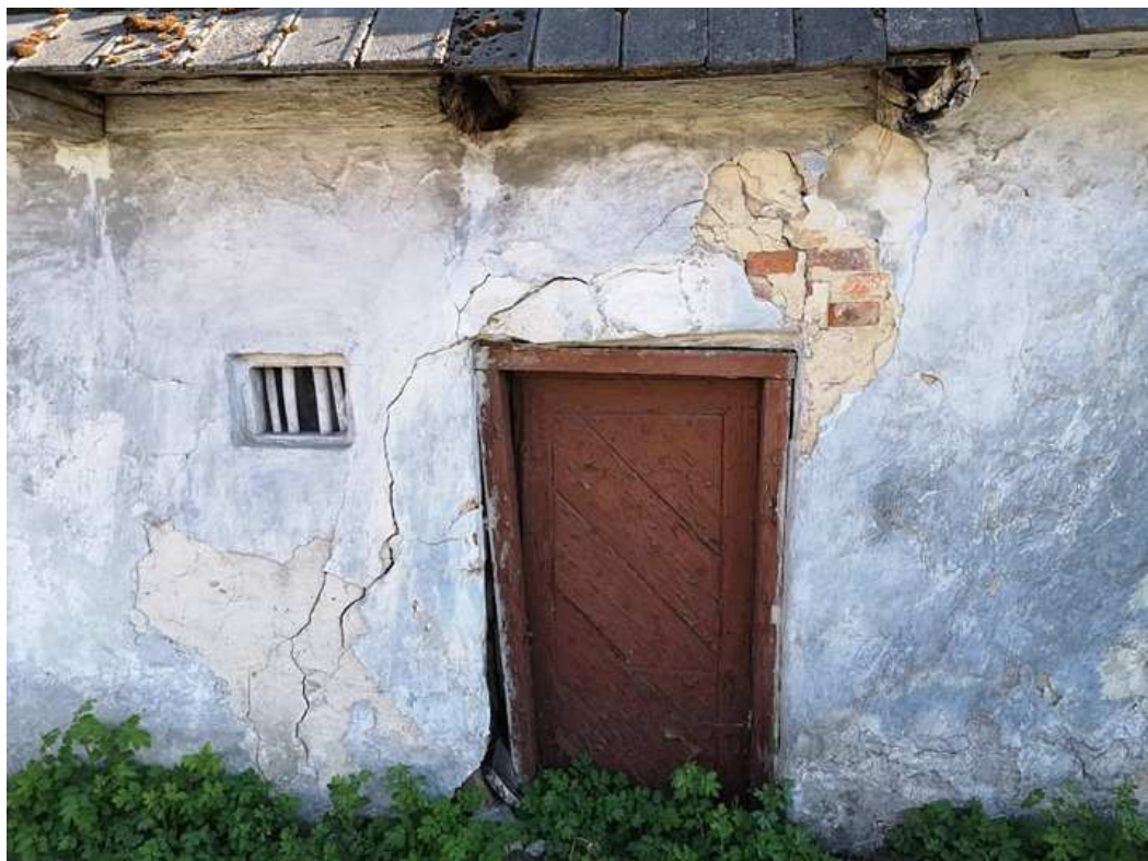
Fot. nr 119. Wejście do stajni.