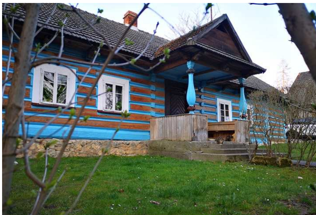
Fot. nr 195.