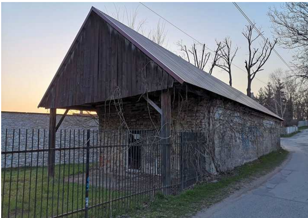
Fot. nr 180 (180-183). XIX wieczny budynek dawnej kuźni w zespole klasztornym Benedyktynów, który powstał w miejscu dawnej szkoły plebańskiej.