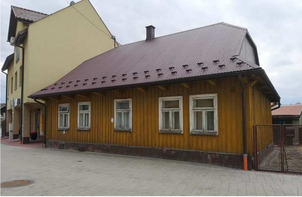
Fot. nr 202 (202-203). Zapewne niespełna 100-letni dom z naczółkowym i okapowym dachem z ulicy Kazimierza Wielkiego 6.