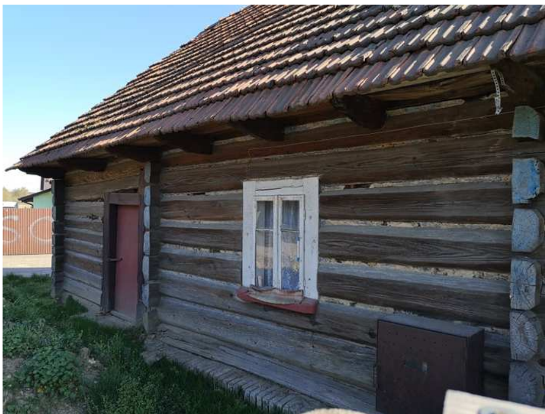
Fot. nr 101.