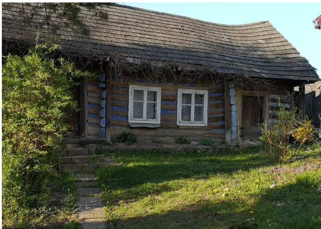
Fot. nr 132 (132-133). Detale frontowej ściany.