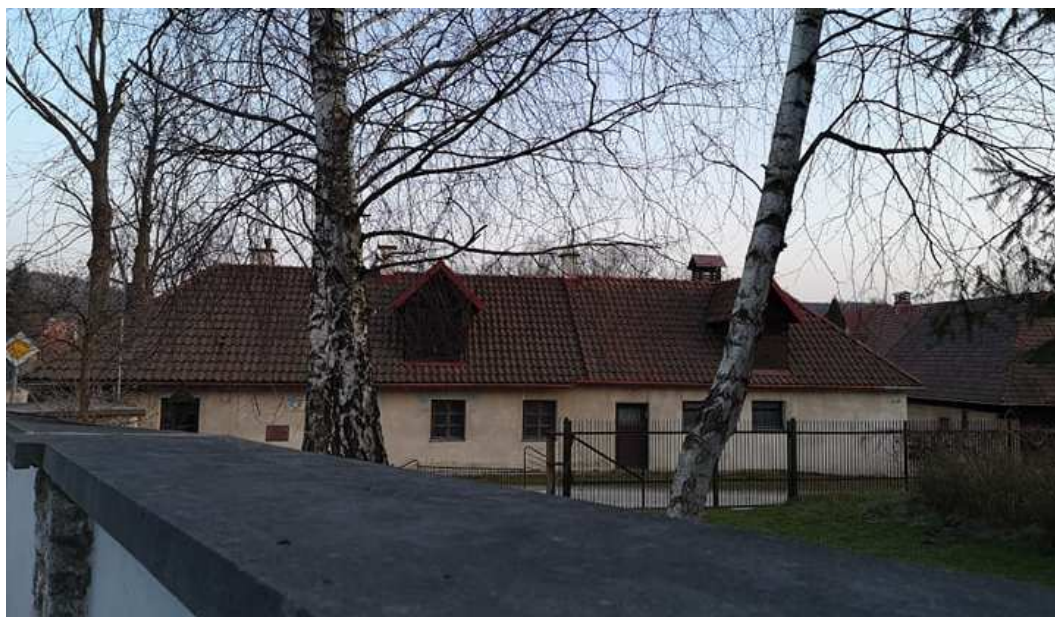
Fot. nr 185.