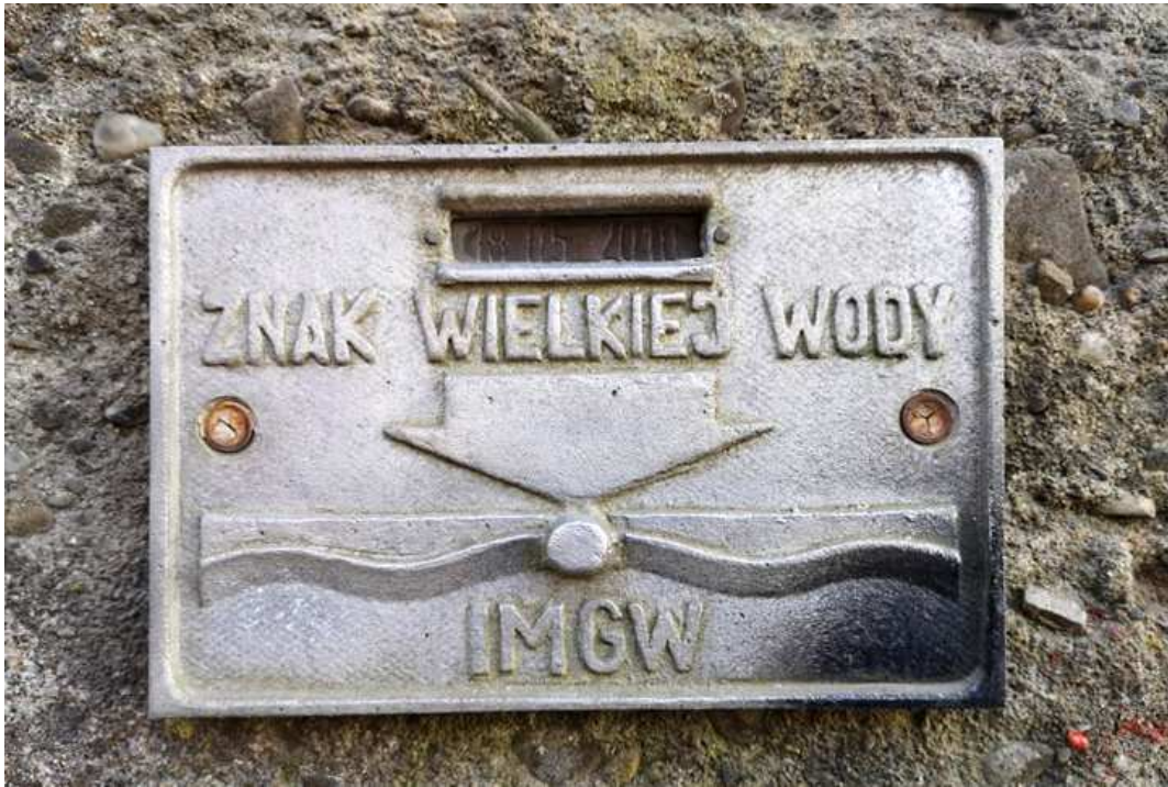
Fot. nr 182.