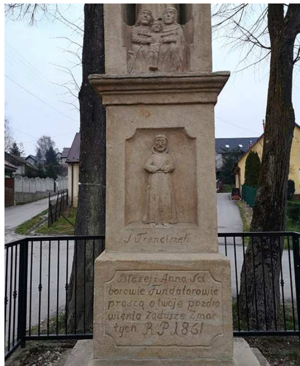
Fot. nr 231.