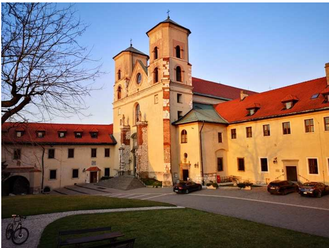
Fot. nr 197. Na klasztornym dziedzińcu.