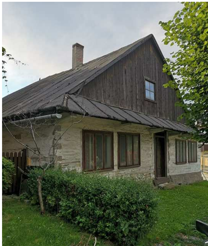
Fot. nr 238.