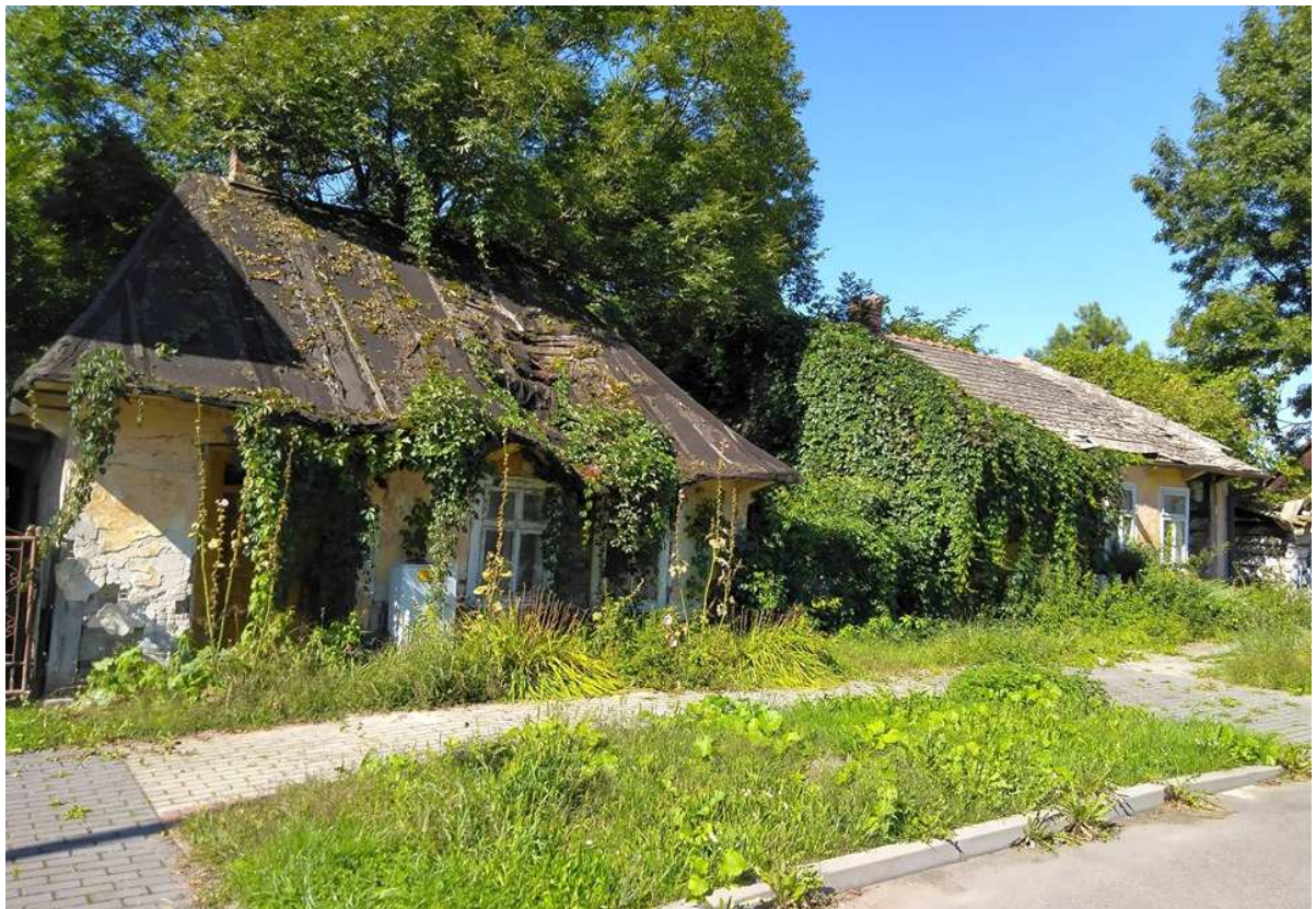
Fot. nr 309 (309-310). Chylące się ku upadkowi chałupy pod nr: 130 i 286.