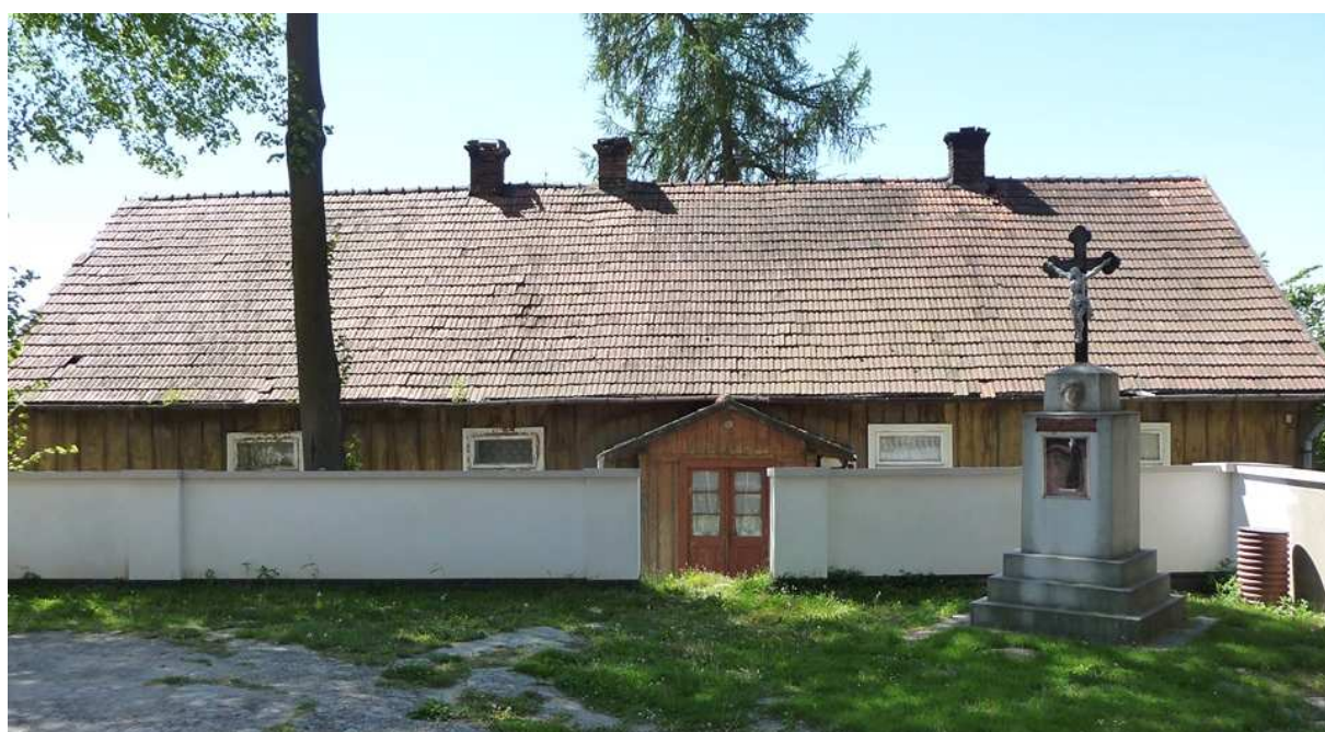
Fot. nr 304.