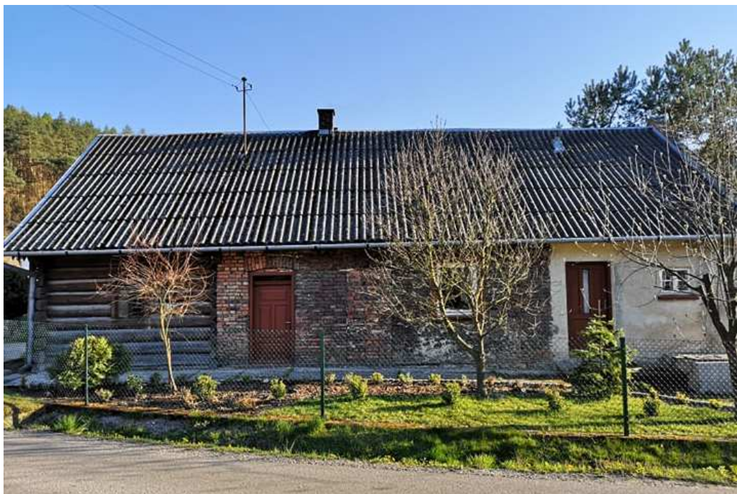
Fot. nr 142.