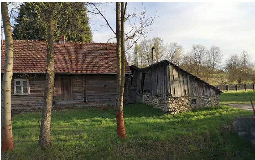
Fot. nr 77.