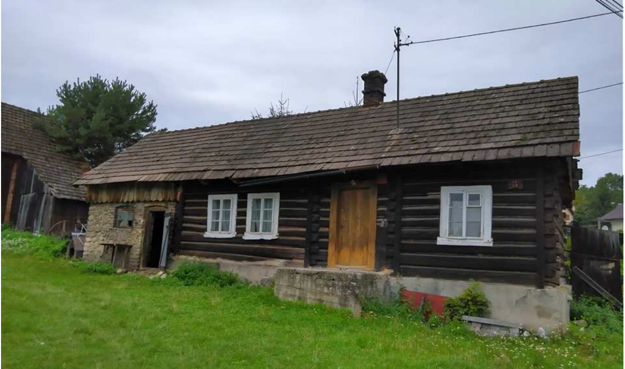
Fot. nr 297 (297-299). Chałupa w jednym korpusie z murowaną stajną z ulicy Turystycznej 3.