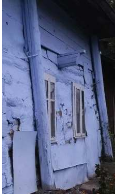
Fot. nr 291. Oryginalne (z lewej) okno.