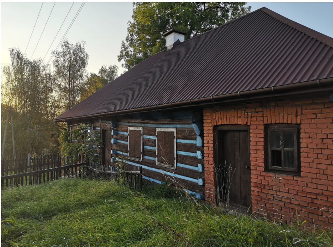
Fot. nr 156 (156-157). Dobudowana do chałupy ceglana stajnia.