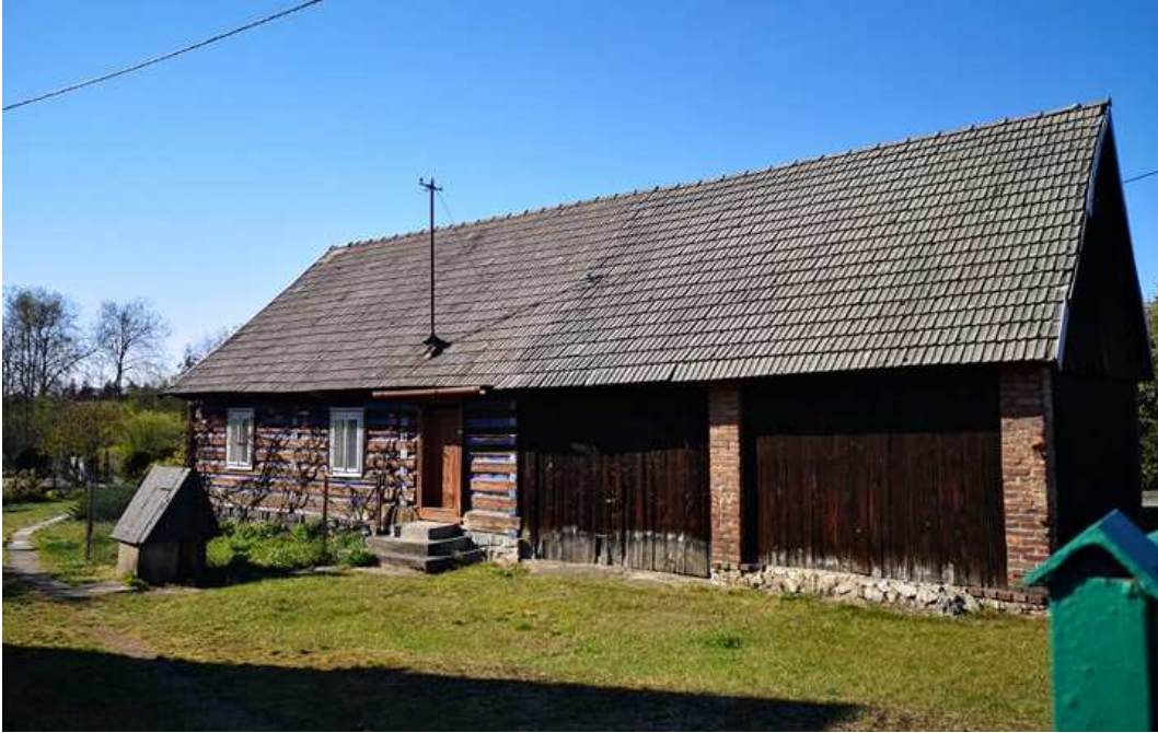
Fot. nr 95 (95-96). Około 100-letni dom, w jednym korpusie ze stodołą, spod nr 116.