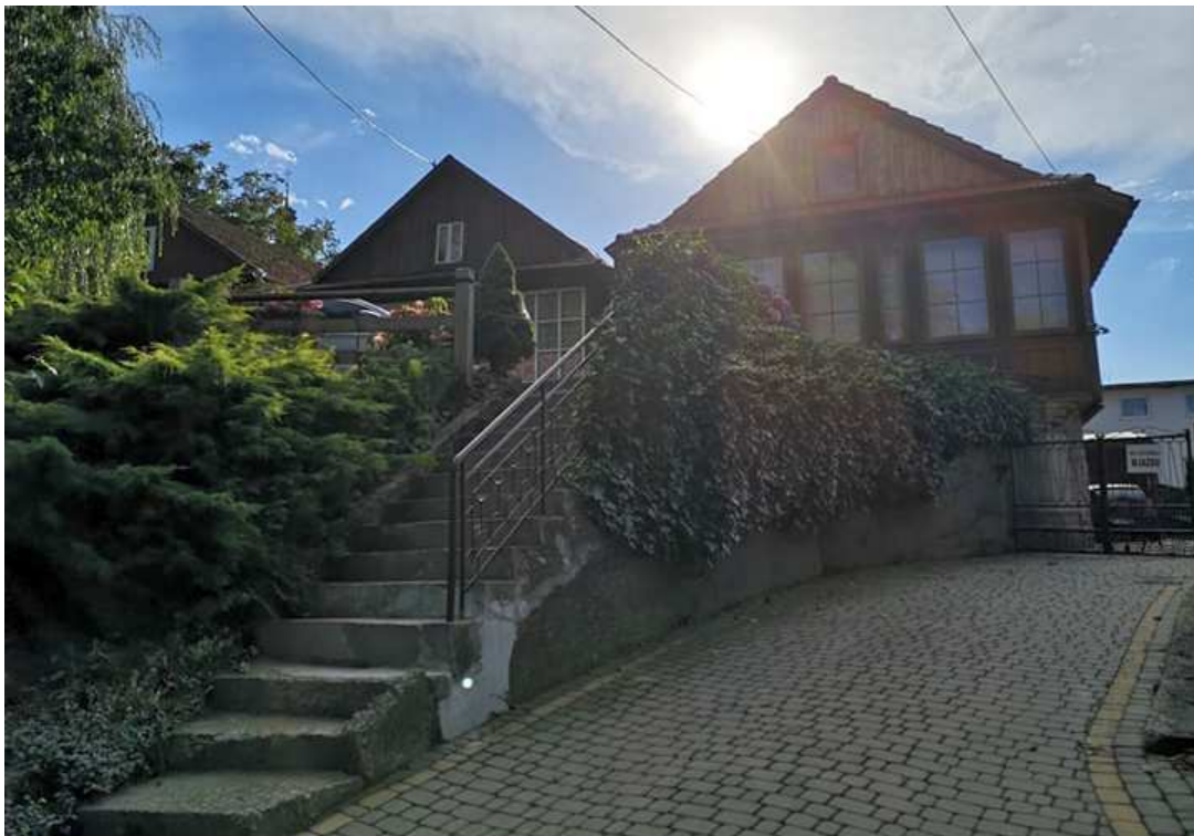
Fot. nr 258 (258-260). Zapewne przedwojenna zabudowa fragmentu ulicy Bernardyńskiej o numerach: 32-36. Tu domy spod nr: 34 (z prawej) i 36.