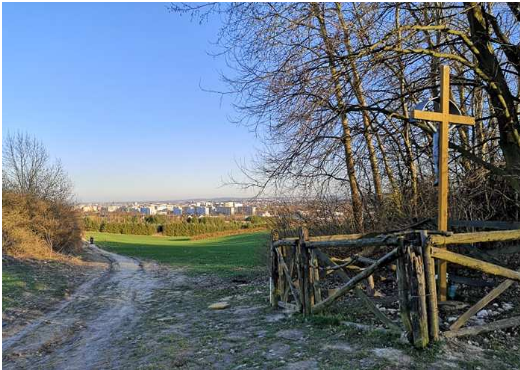
Fot. nr 15 (15-16). Krzyż na wzniesieniu nad ulicą Tetmajera.