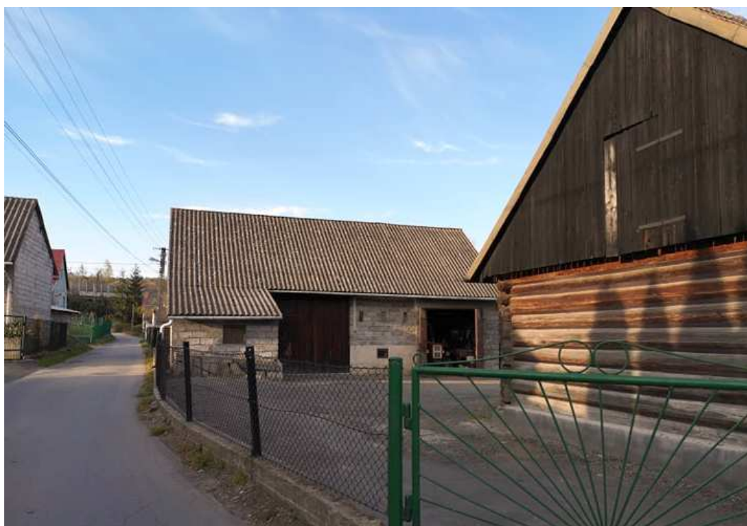
Fot. nr 70. Widok na dziedziniec.