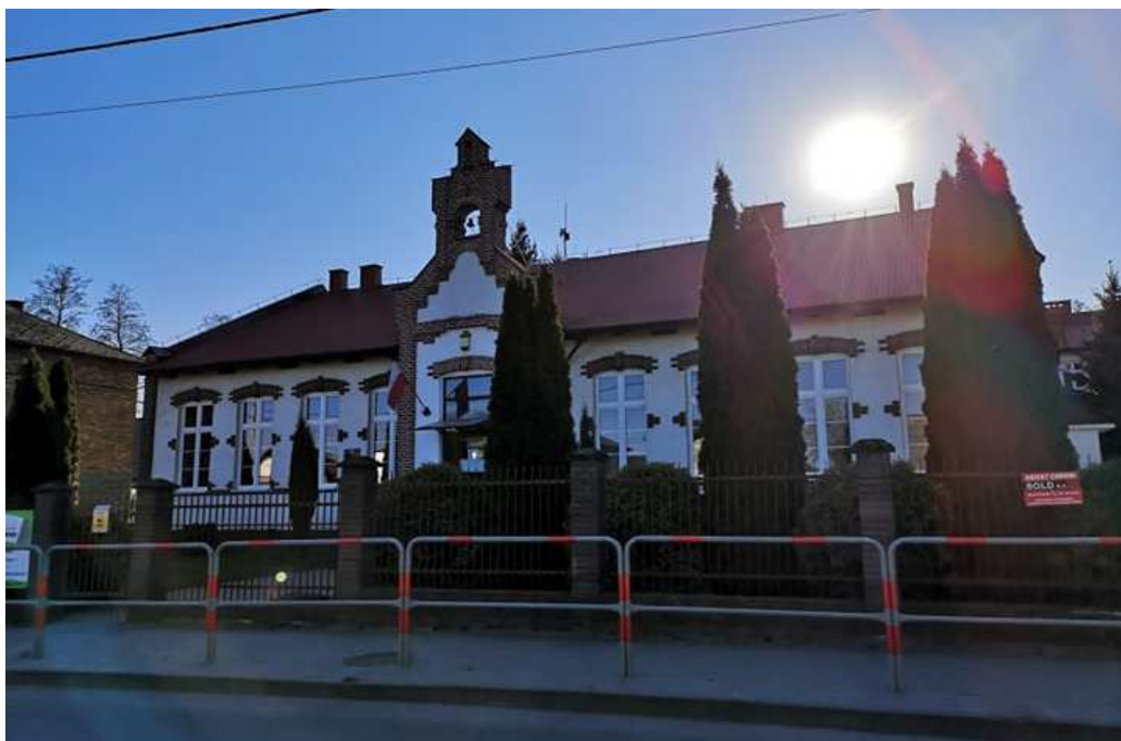
Fot. nr 128. SP im. Księcia Józefa pod nr 13.