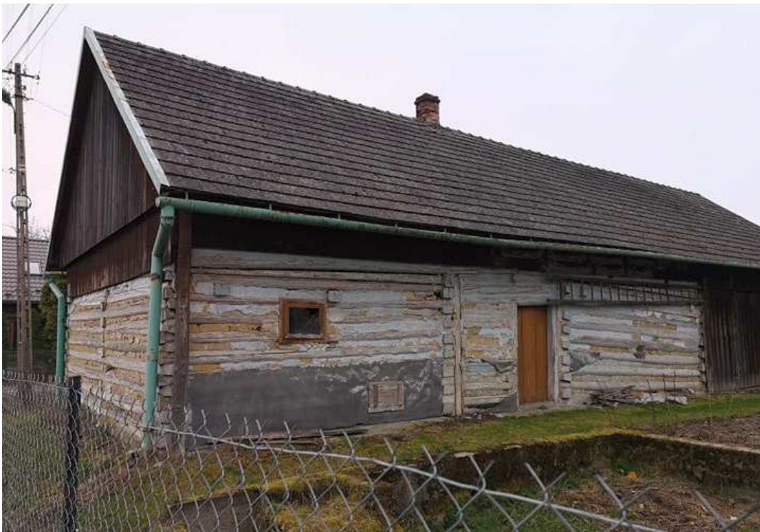
Fot. nr 221. Widok od strony podwórka.