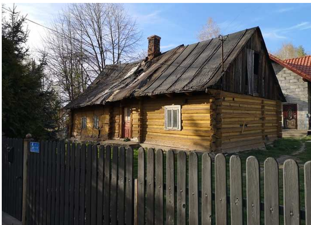
Fot. nr 60. Ponad stuletnia chałupa o nieznaney mi dokładnie lokalizacji.