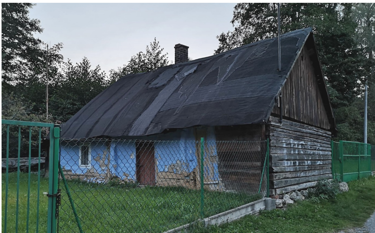
Fot. nr 28 (28-29). Fragment od strony podwórka.