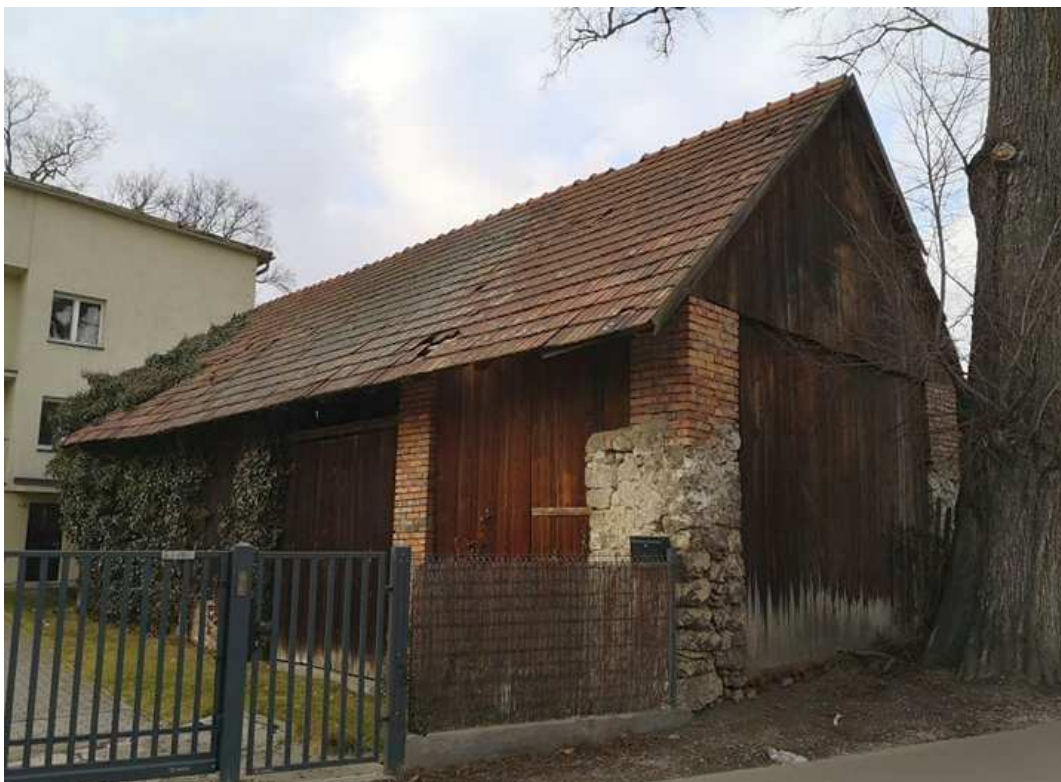
Fot. nr 13.