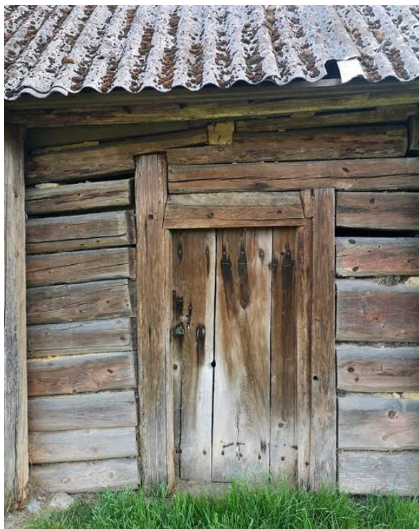
Fot. nr 53. Drzwi przelotowej sieni.