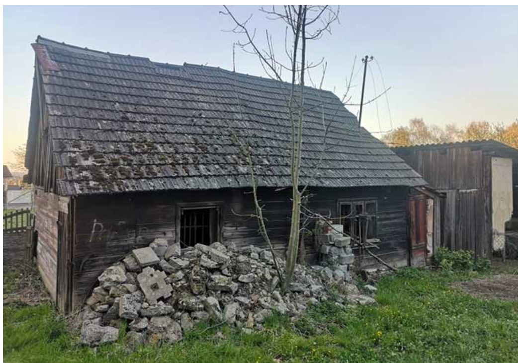
Fot. nr 134. Przedwojenny dom o nieustalonej lokalizacji.