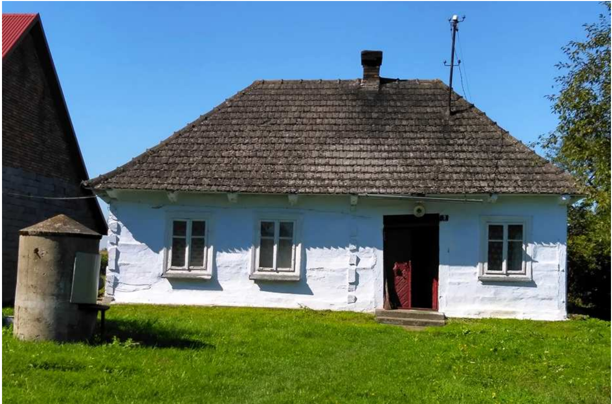
Fot. nr 317. Zapewne półtoratraktowa, bielona chałupa spod nr 3, która mogła powstać na przełomie XIX i XX wieku.