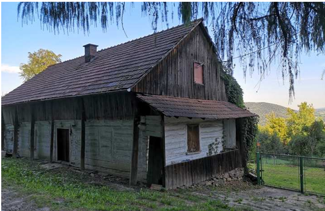
Fot. nr 284. Ściana szczytowa.