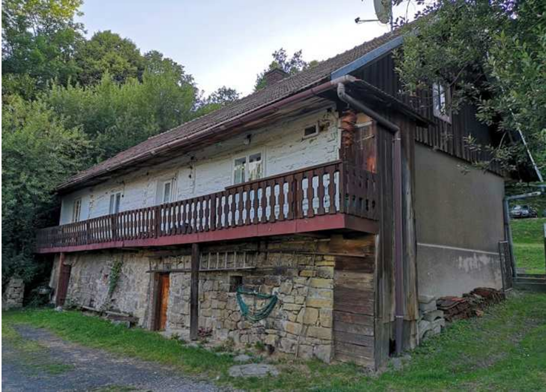
Fot. nr 261 (261-262). Dom z wyżką zapewne w końcowym fragmencie ulicy Bernardyńskiej.