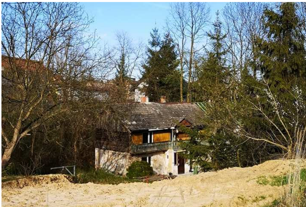
Fot. nr 59. Dom z „wyżką” o nieustalonej lokalizacji.