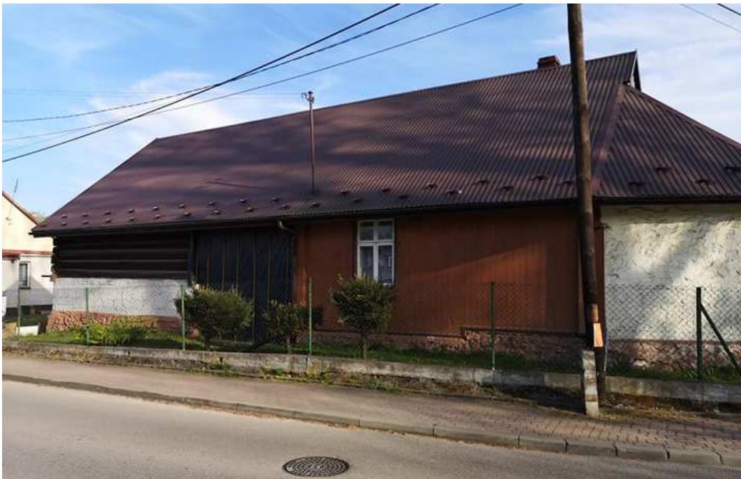
Fot. nr 58.