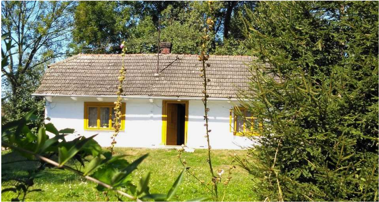
Fot. nr 318. Bliska oryginałowi chałupa, której stan może stanowić dobry przykład dbałości o etnograficzne dziedzictwo.