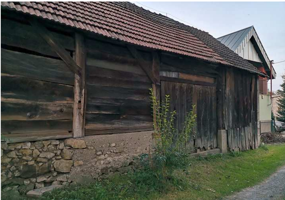
Fot. nr 40. Wrota stodoły.