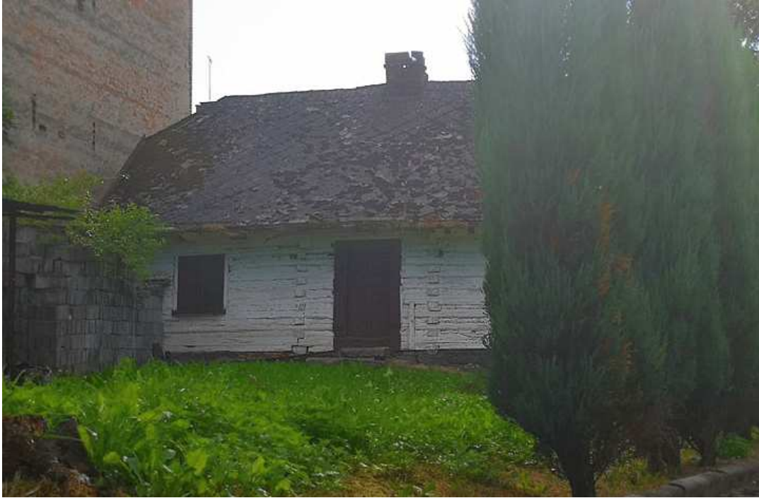
Fot. nr 247. Tylna część białej chałupy.