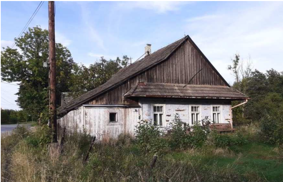
Fot. nr 327. Ściana szczytowa.