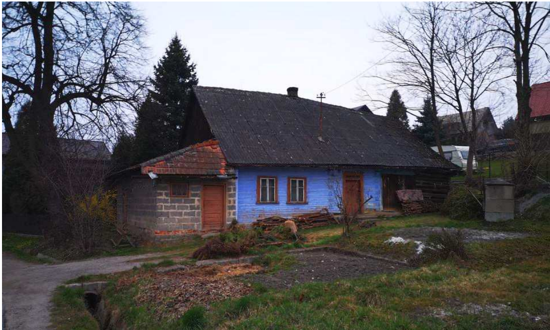
Fot. nr 215 (215-218). Chałupa we wspólnym korpusie ze stodołą spod nr 41. Kompleks mógł powstać na początku XX wieku.