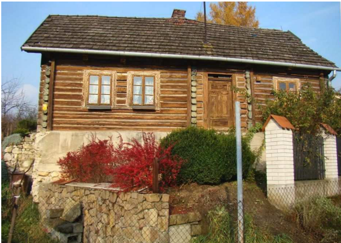
Fot. nr 2a. Chałupa z ulicy Krakowskiej 3.

Wszystkim w/w autorom zdjęć pragnę gorąco podziękować za chęć ukazania szerszej opinii publicznej szybko znikających chałup i domów, co będzie stanowić ich wkład w dzieło dokumentowania dawnej zabudowy obrzeży Krakowa i jego okolic.