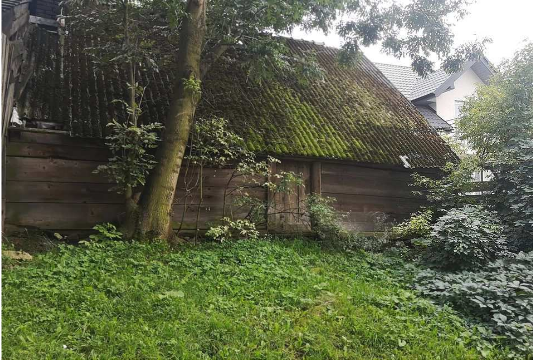
Fot. nr 125.