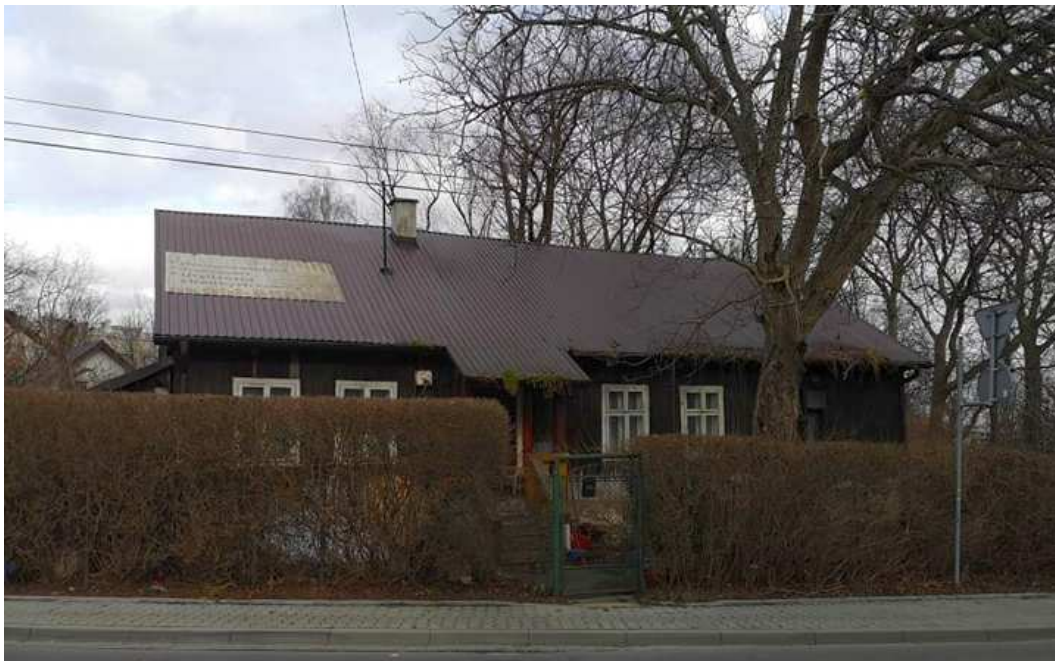
Fot. nr 6. Około 90-letni dom z ulicy Zarzecze 105.