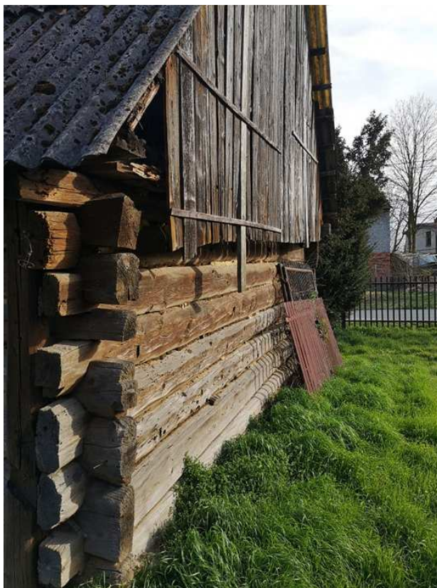
Fot. nr 56. Druga ze ścian szczytowych.