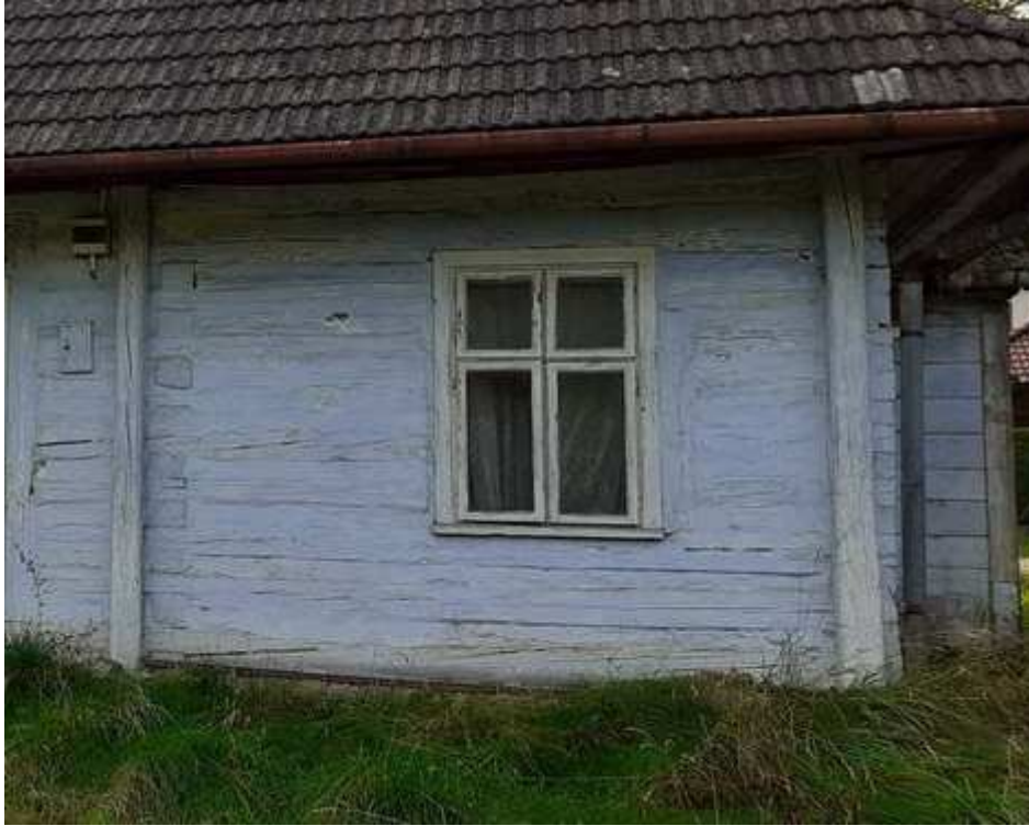
Fot. nr 325. Nieco wcześniejsze okno z prawej części chałupy.