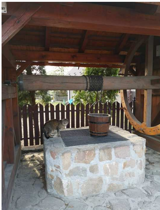
Fot. nr 65.