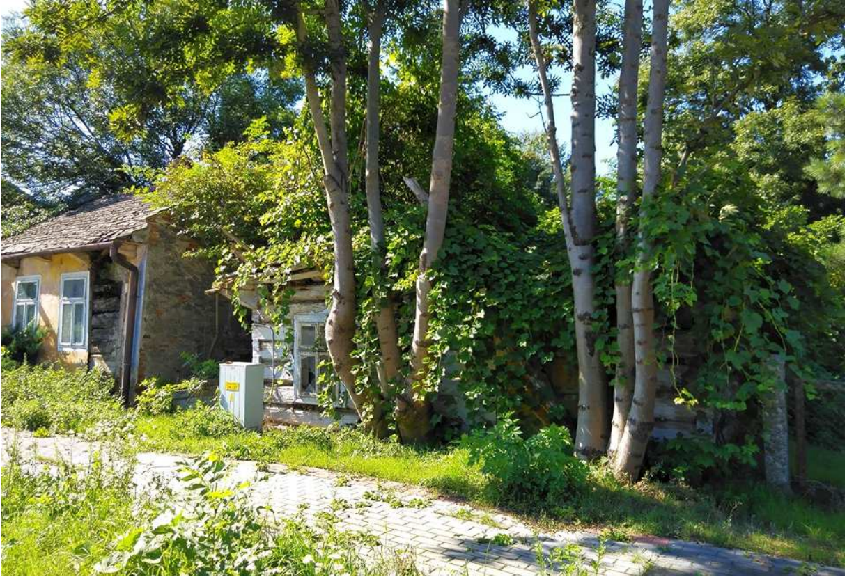
Fot. nr 310. Przebudowana w latach 30. chałupa pod nr 286, a na prawo ponad 100-letnia ruina, która nie posiada numeru.