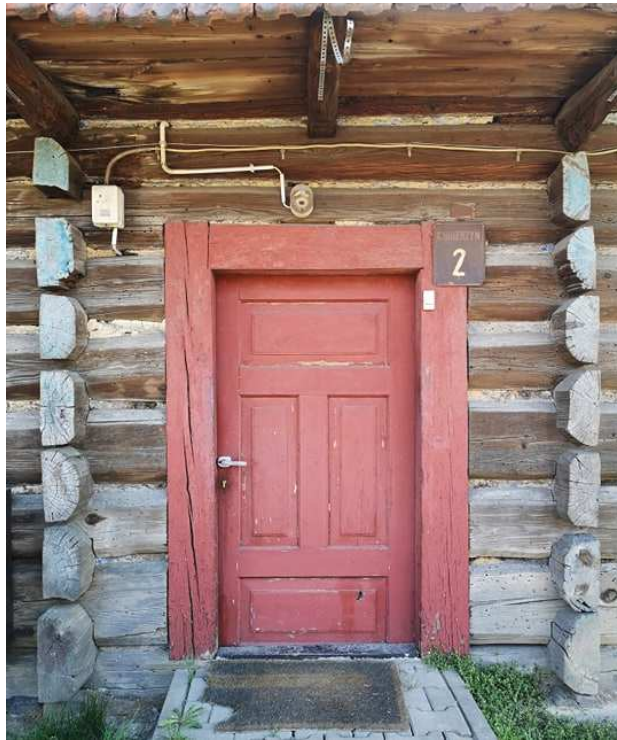
Fot. nr 103.