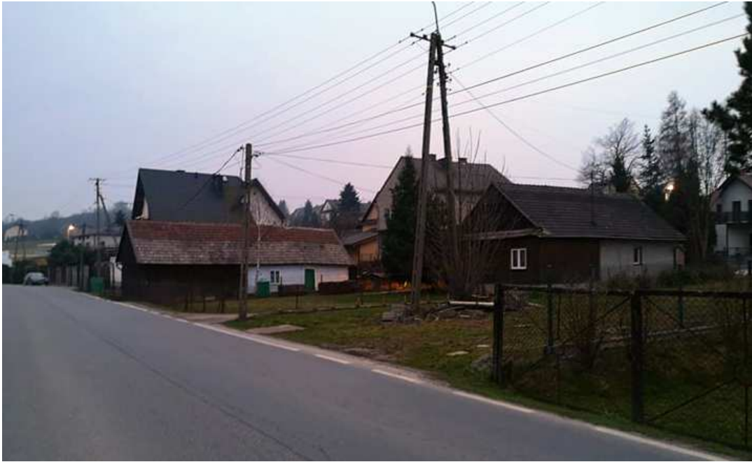
Fot. nr 206 (206-207). Bielona chałupa we wspólnym korpusie ze stodołą z ulicy Brzezi 15.