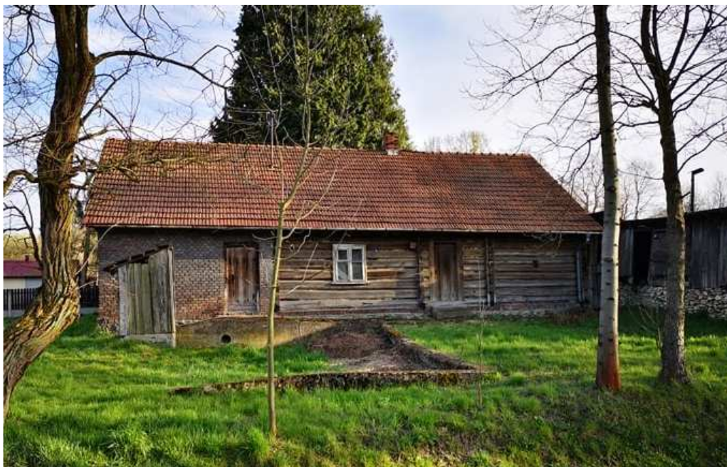
Fot. nr 75 (75-77). Zapewne ponad 100-letnia chałupa pod nr 137.