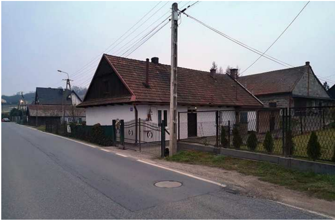
Fot. nr 208 (208-209). Bielona chałupa z ulicy Brzegi 29.