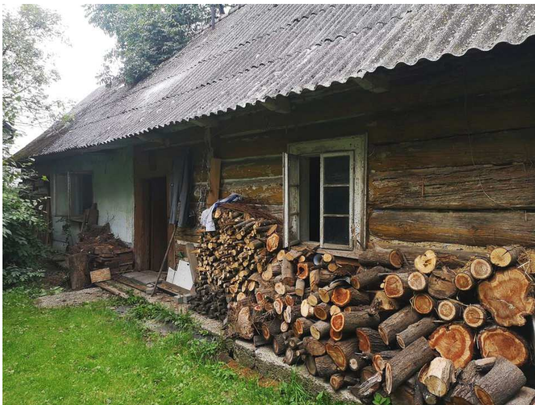
Fot nr 123 (123-126). Zapewne ponad stuletnia chałupa o nieustalonej lokalizacji.