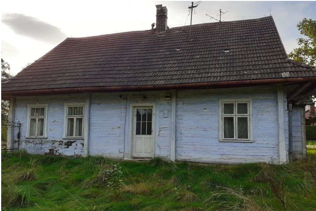
Fot. nr 324 (324-327). Przebudowana w latach 30. dawna chałupa z ulicy Zarzecznej. W lewej części charakterystyczne dla tego okresu trójkwatrowe okna.