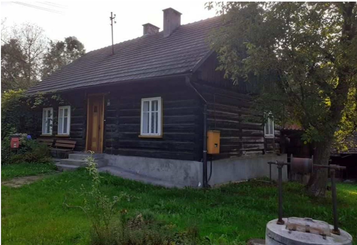
Fot. nr 322 (322-323). Chałupa zapewne z początku XX wieku z ulicy Bukowskiej.