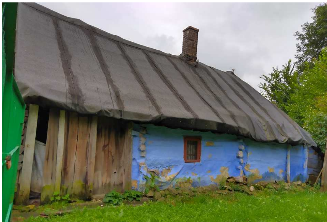
Fot. nr 294 (294-296). Widoki od strony ogrodu.