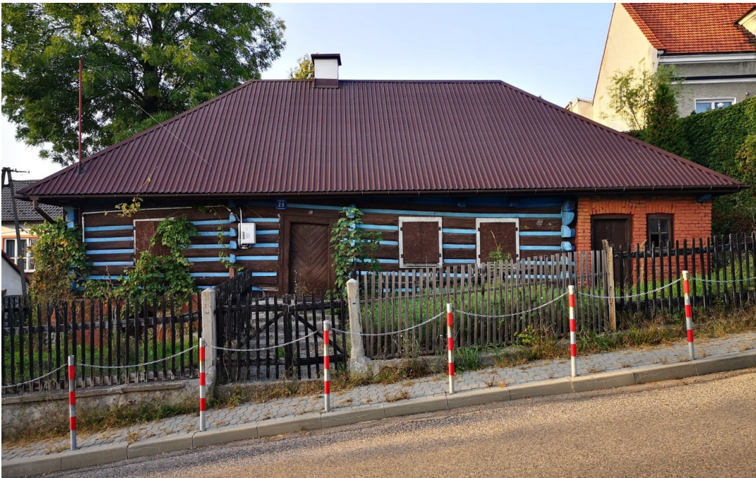
Fot. nr 152 (152-158). Front jednej z najstarszych chałup w okolicach Krakowa.