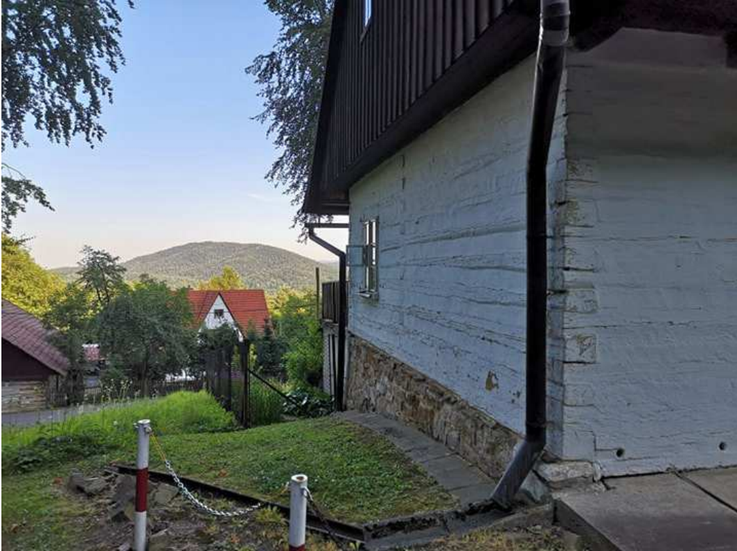
Fot. nr 275. Ściana szczytowa.