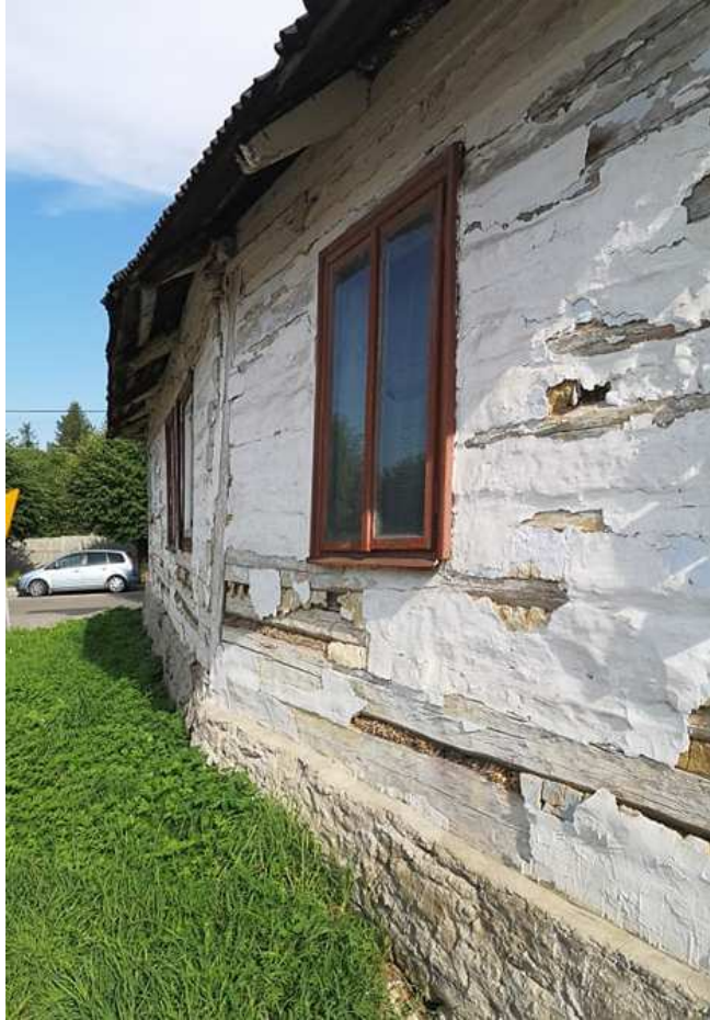
Fot. nr 241.