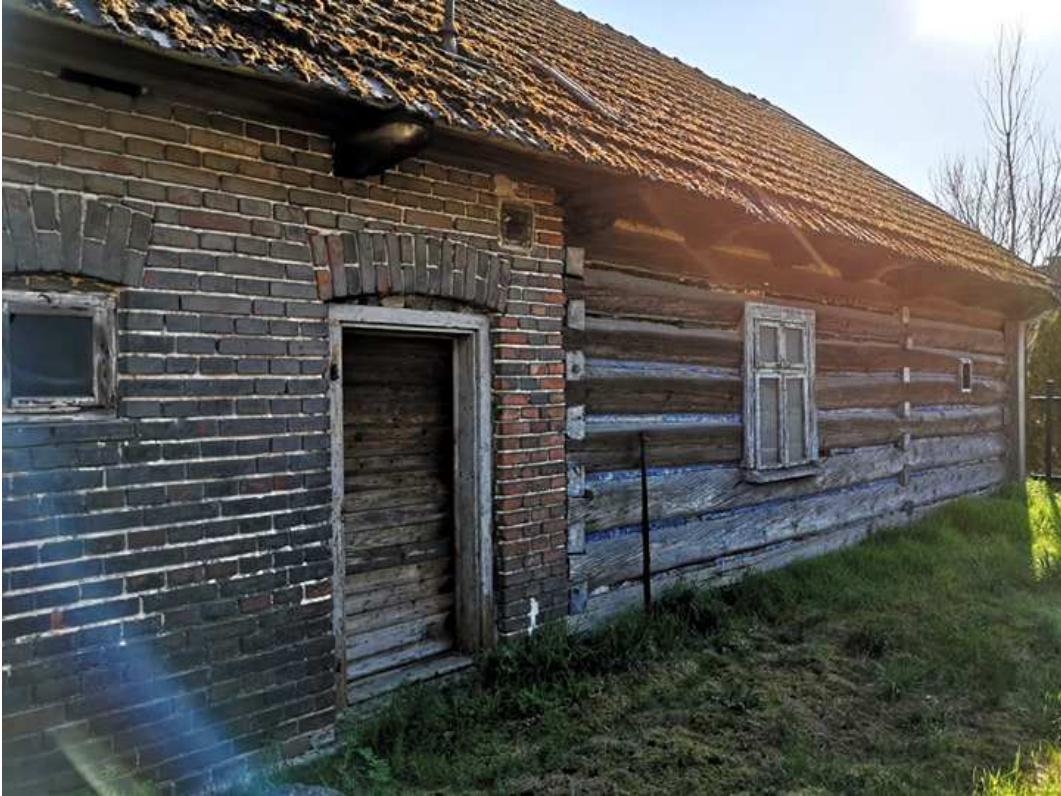
Fot. nr 113.