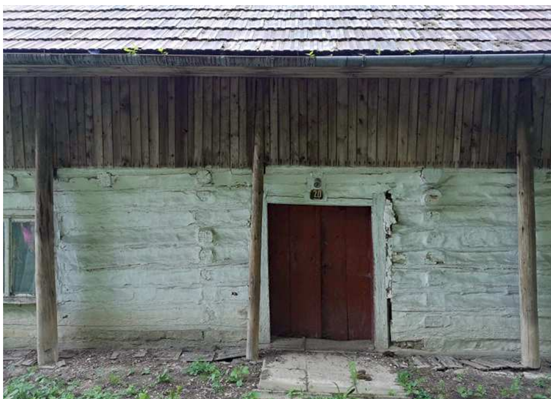
Fot. nr 282.