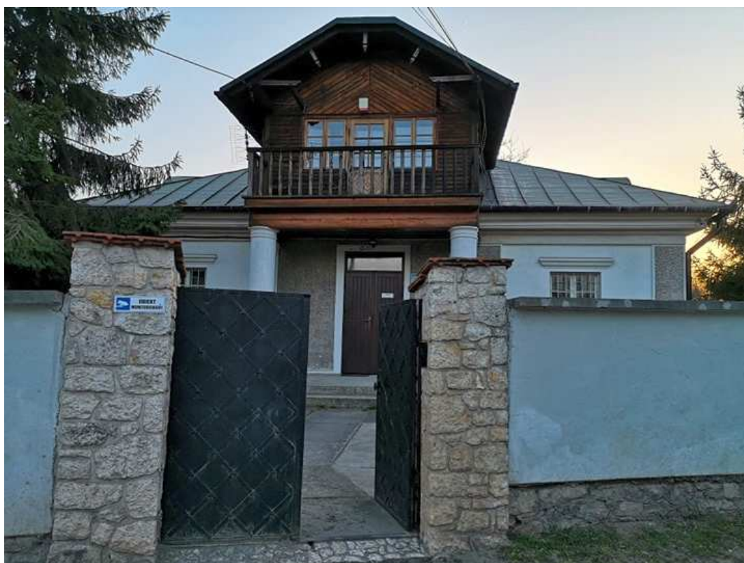
Fot. nr 189.