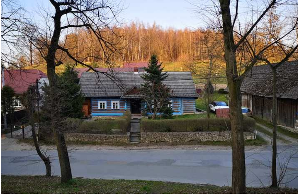
Fot. nr 192 (192-195). Zagroda z ulicy Benedyktyńskiej 42: przykładnie odnowiona chałupa z roku 1876 i kilka lat starsza stodoła.