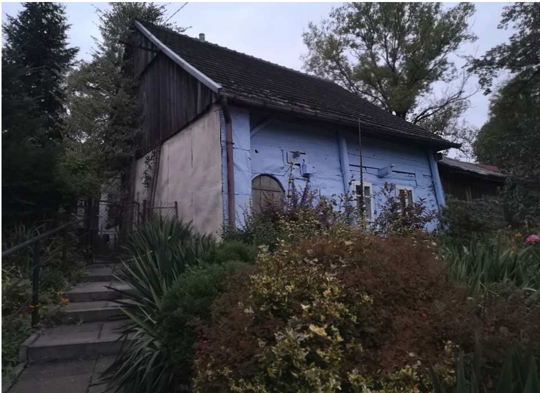
Fot. nr 289 (289-292). Archaiczna chałupa z ulicy Franciszka Bielowicza 21. Obiekt o konstrukcji przysłopowej z półkolistym odrzwiem.