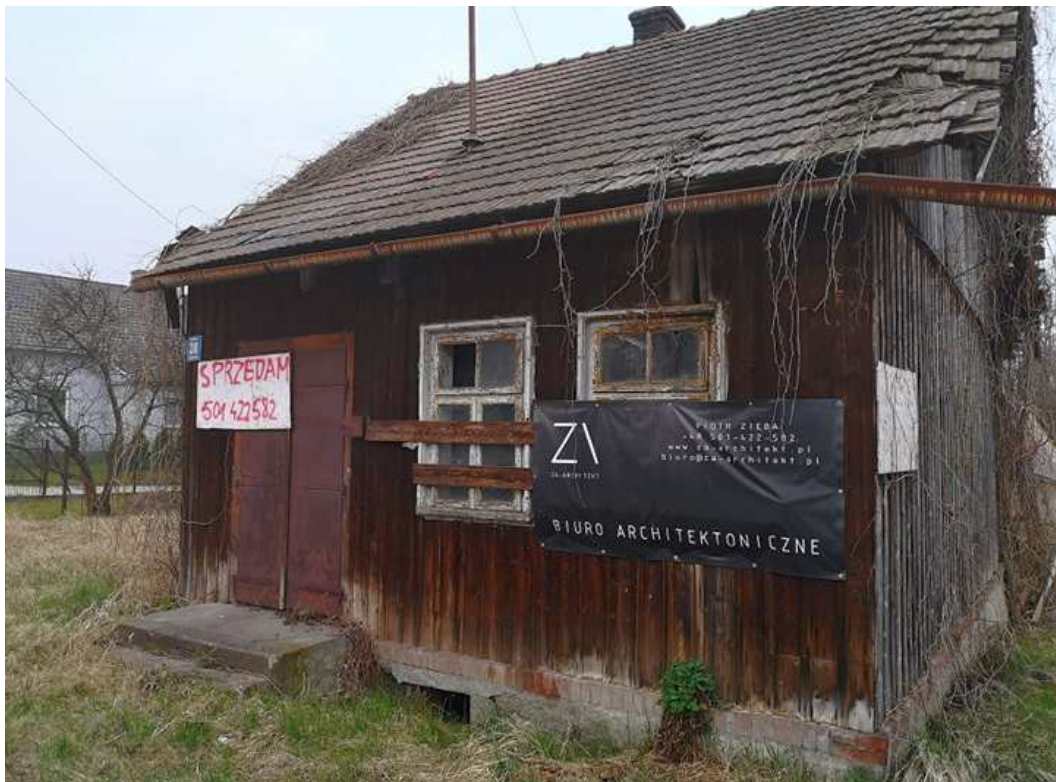
Fot. nr 219. Zapewne przedwojenny domek spod nr 38.