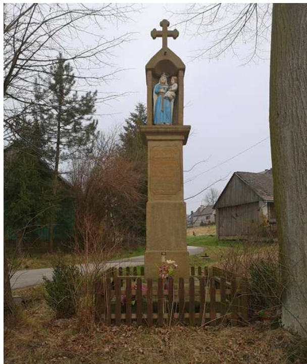
Fot. nr 233.