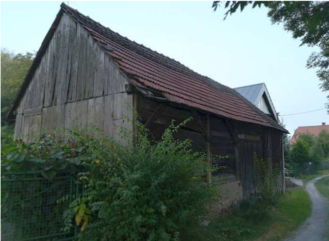
Fot. nr 39 (39-40). Rozległa drewniana stodoła.