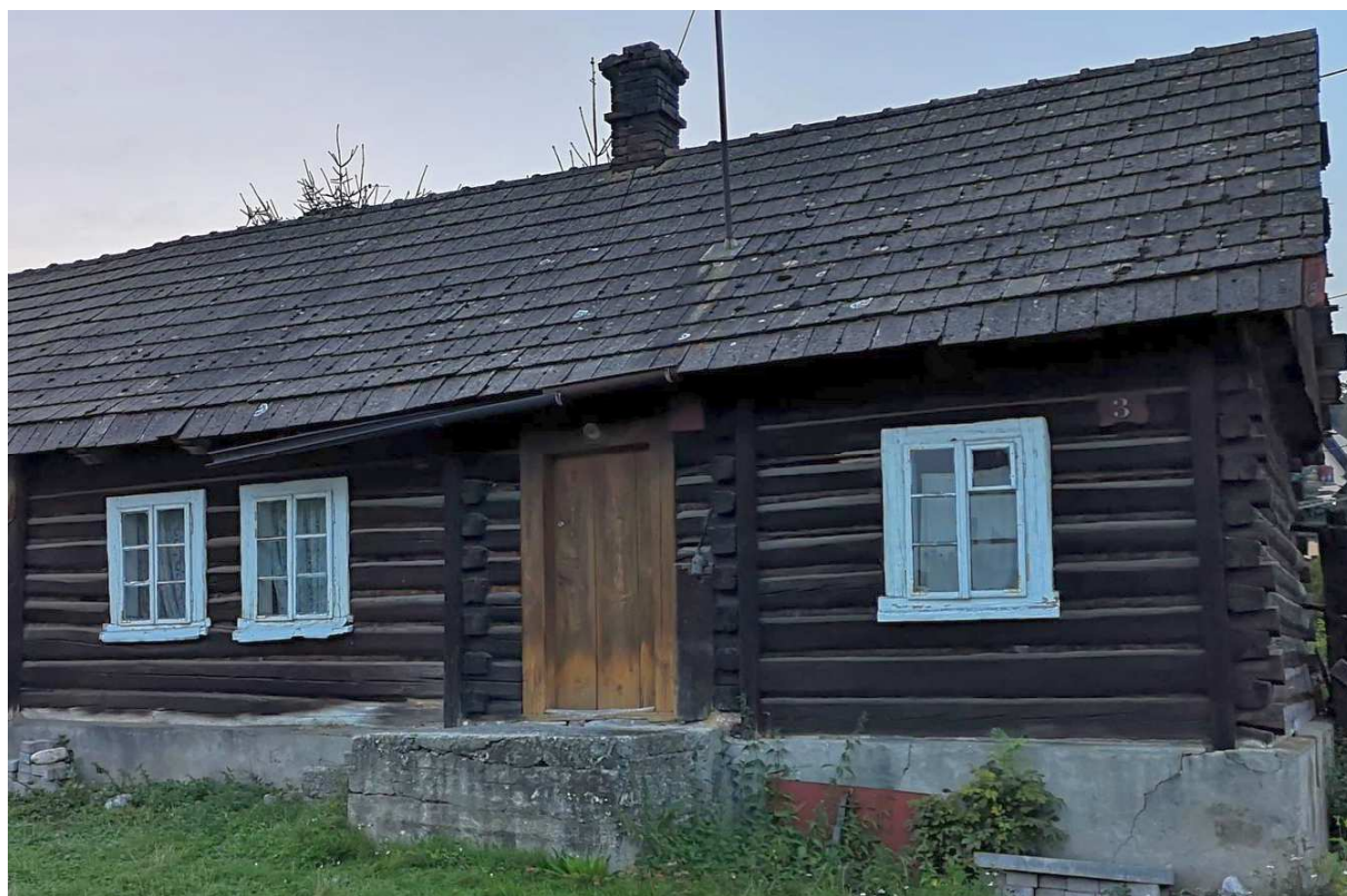
Fot. nr 32.