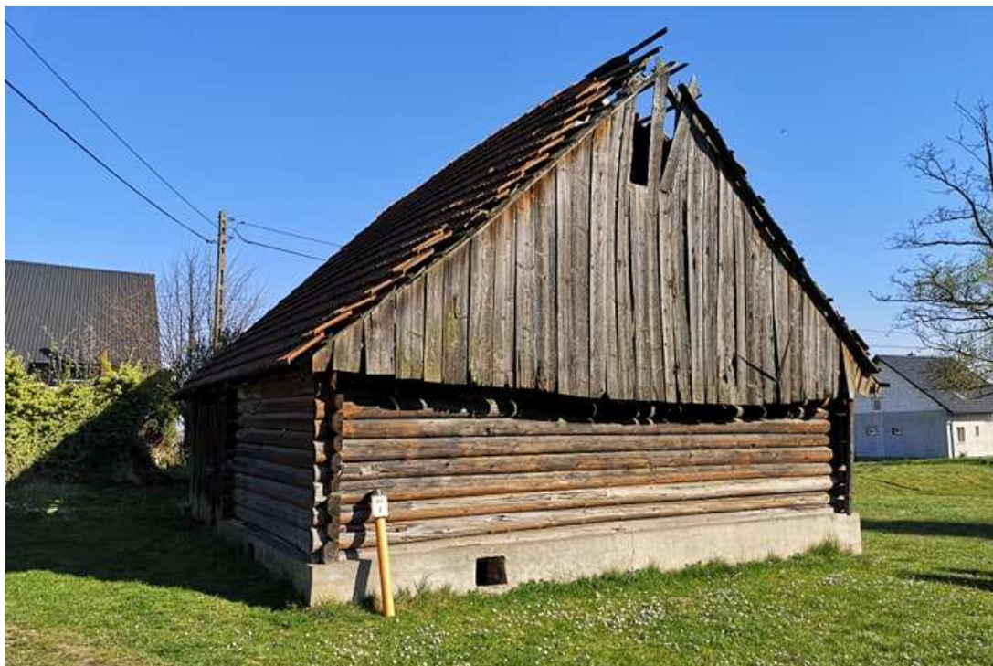
Fot. nr 111.