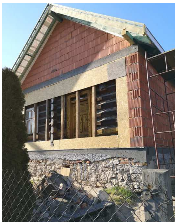
Fot. nr 122.