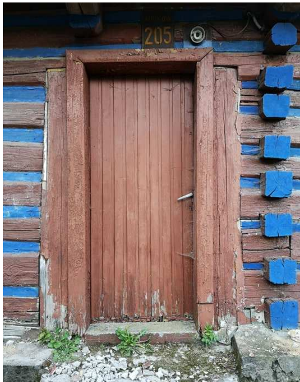
Fot. nr 149.