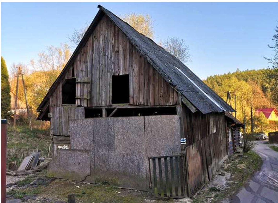
Fot. nr 150. Niewielka stodoła przylegająca do chałupy.