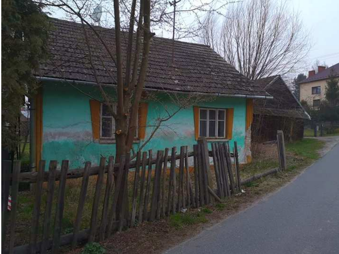
Fot. nr: 214-221. Wzdłuż ulicy Zadworze. Fot. nr 214. Pokryty tynkiem dom w zagrodzie pod nr 3.