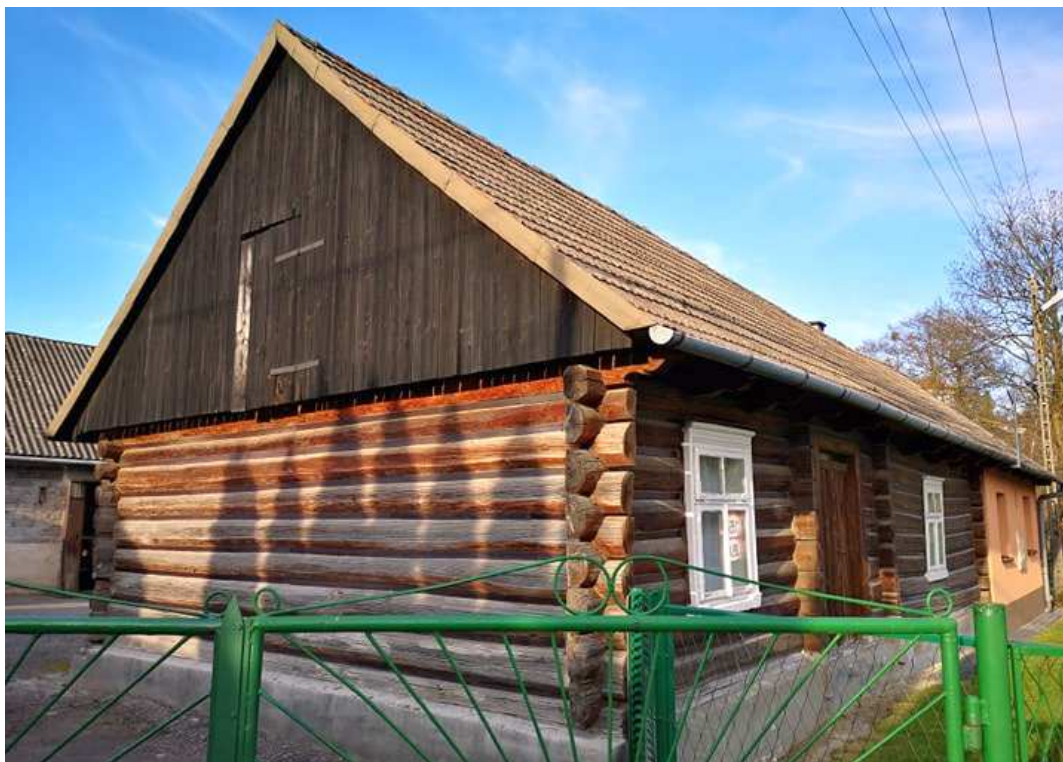
Fot. nr 69.