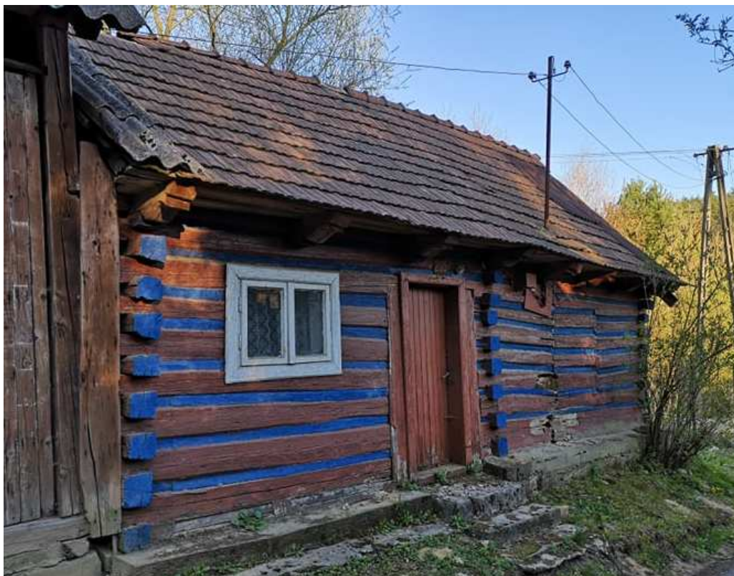
Fot. nr 147.