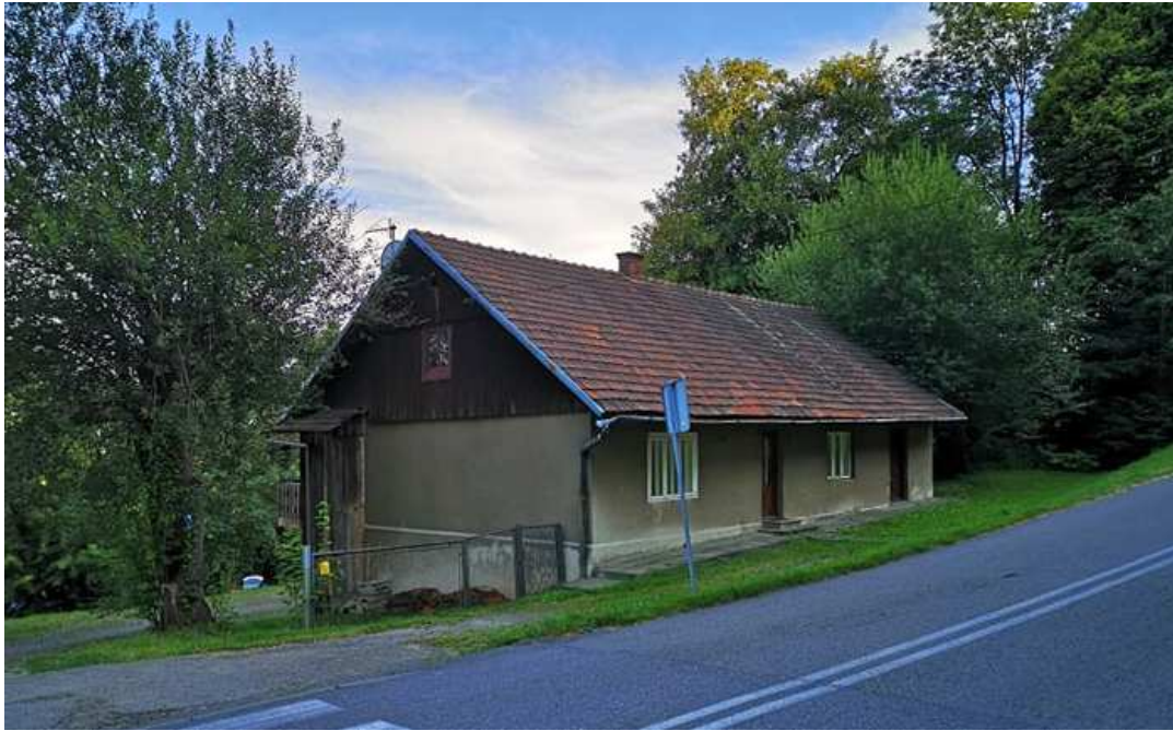
Fot. nr 263 (263-264). Otynkowany, zapewne ok. 100-letni dom spod nr 3.