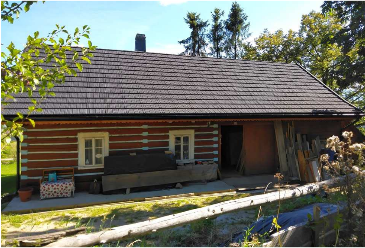
Fot. nr 320 (320-321). Zapewne ponad stuletnia chałupa na etapie odnowy. Tu front obiektu.