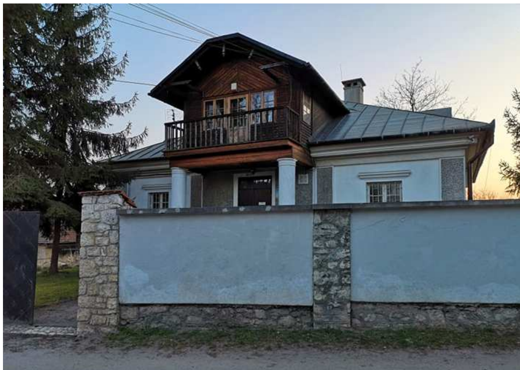
Fot. nr 188 (188-189). Dworek, zapewne dawna Opatówka, spod nr 35.