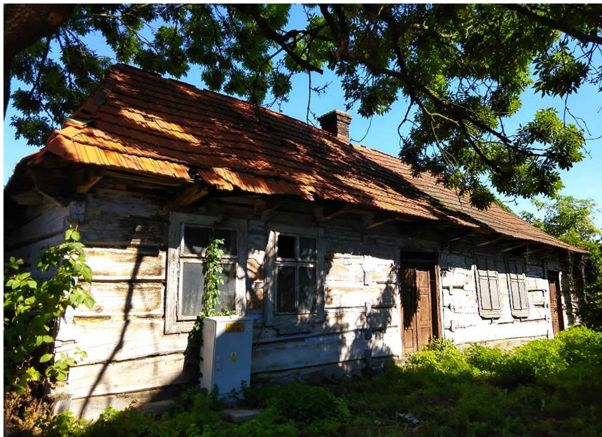
Fot. nr 316. Około 100-letni dom spod nr 54.