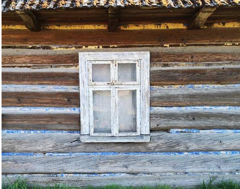
Fot. nr 115. Oryginalne okno, która ułatwia datowanie obiektu.