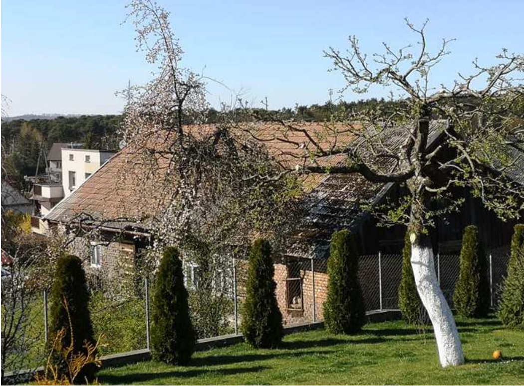
Fot. nr 97. Częściowo drewniany dom o nieustalonej lokalizacji.