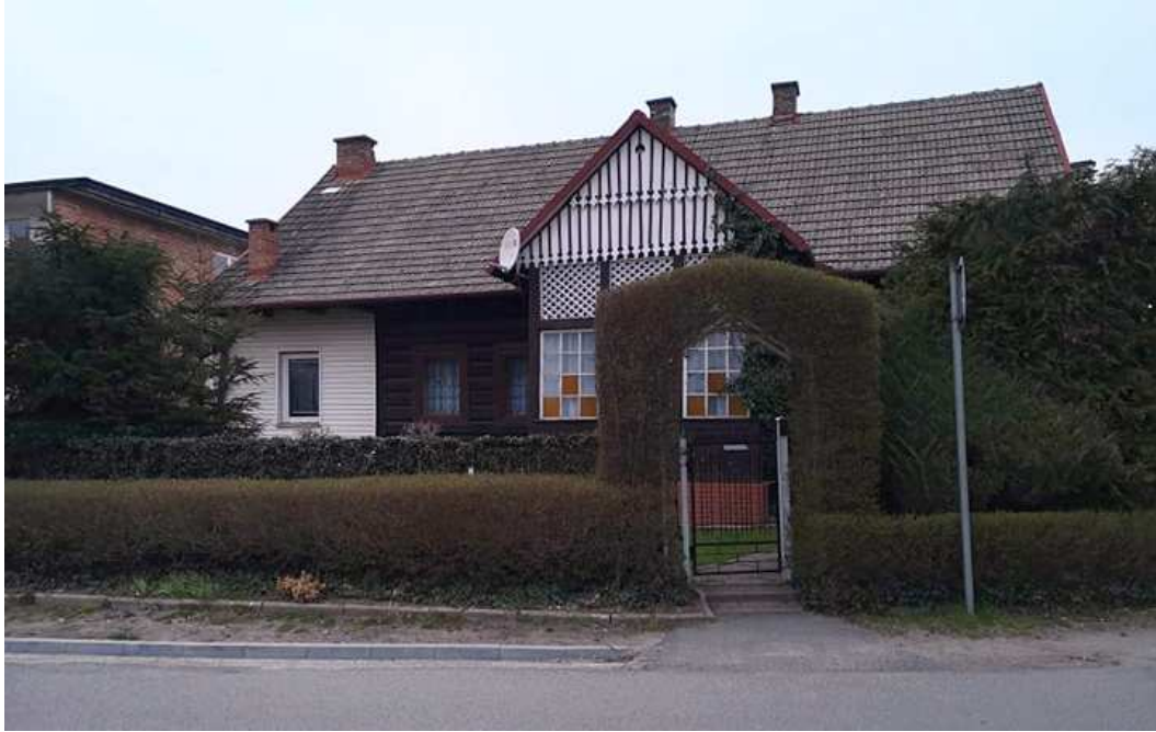
Fot. nr 210 (210-213). Wybudowana zapewne na przełomie lat 20/30 willa z oszklonym gankiem z ulicy Jana Pawła II 14