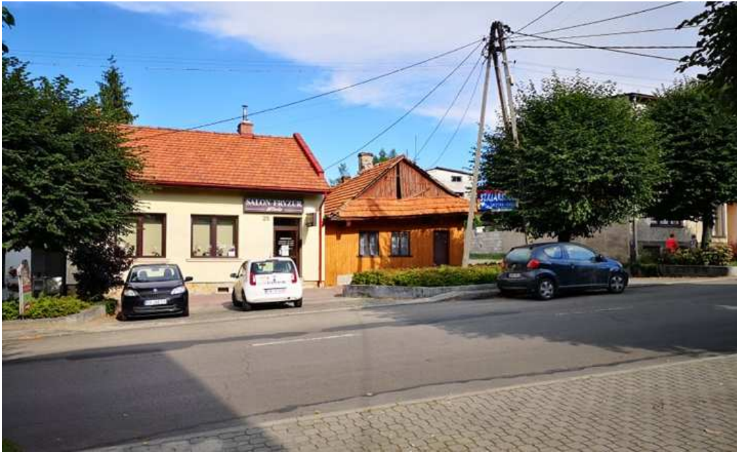
Fot. nr 235. Zabudowa ulicy 3-Maja o numerach: 25-27.