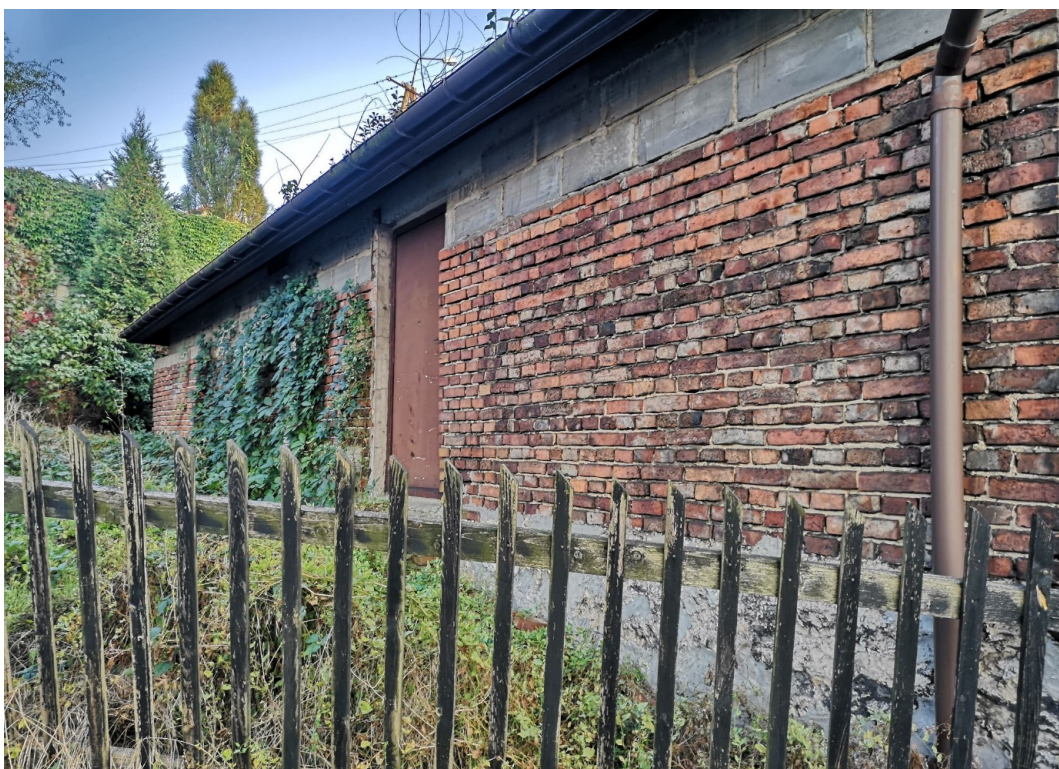
Fot. nr 160. Tylna część już z ceglana ścianą.