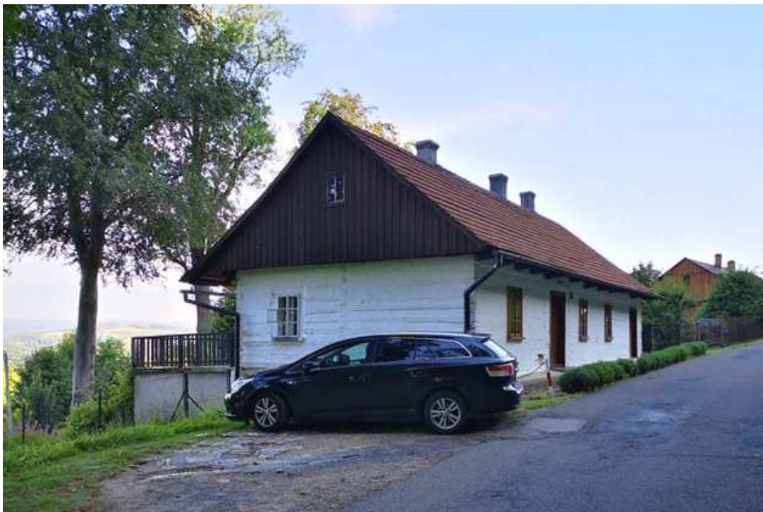
Fot. nr 274 (274-277). Rozległa, nadal przykładowie bielona chałupa spod nr 18.