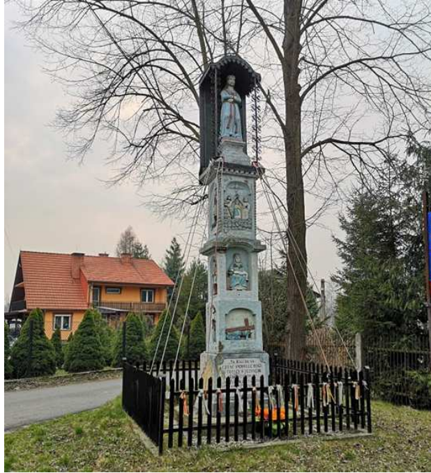
Fot. nr 232 (232-233). Kapliczki z Matką Boską w zwieńczeniu.