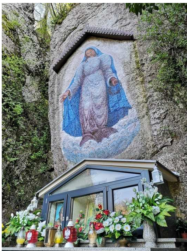
Fot. nr 138.