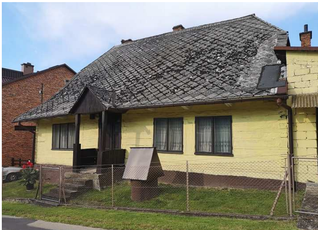
Fot. nr 249.