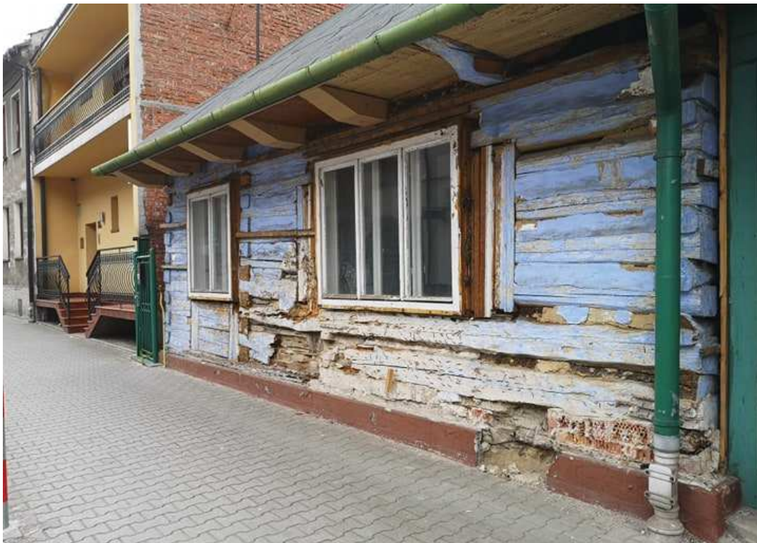
Fot. nr 199.