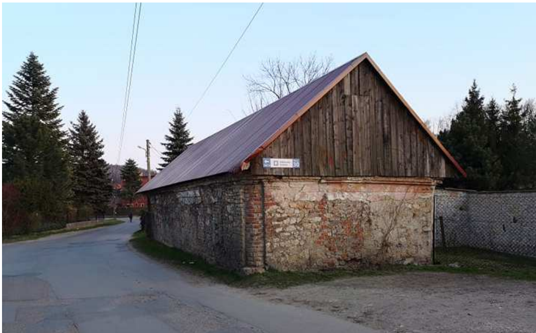
Fot. nr 183.