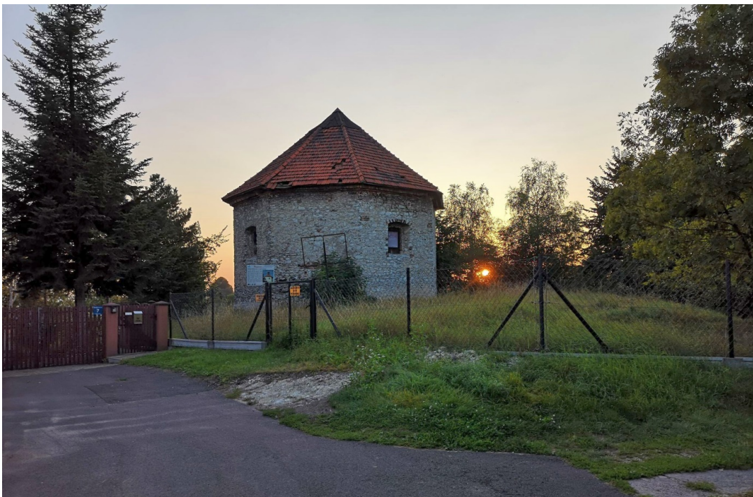
Fot. nr 166 (166-167). Kaplica Różańcowa, wybudowana z roku 1687 na wapiennym wzgórzu, zrekonstruowana z zachowanych dolnych fragmentów.