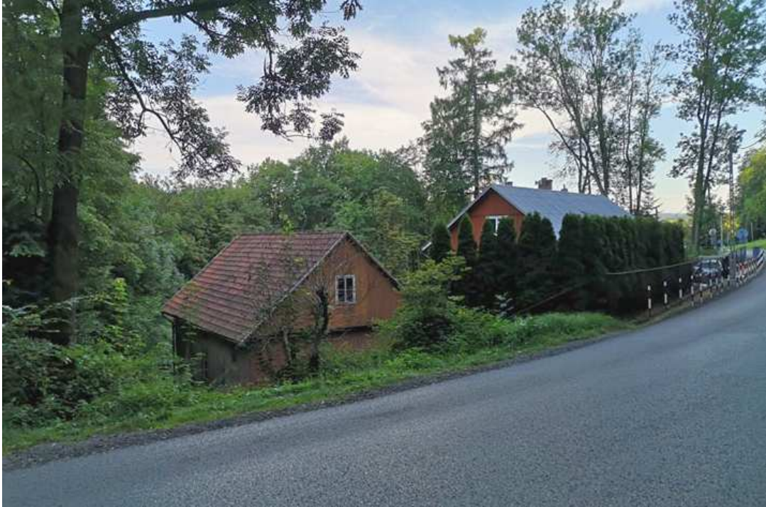
Fot. nr 265. Zagroda pod nr 4.