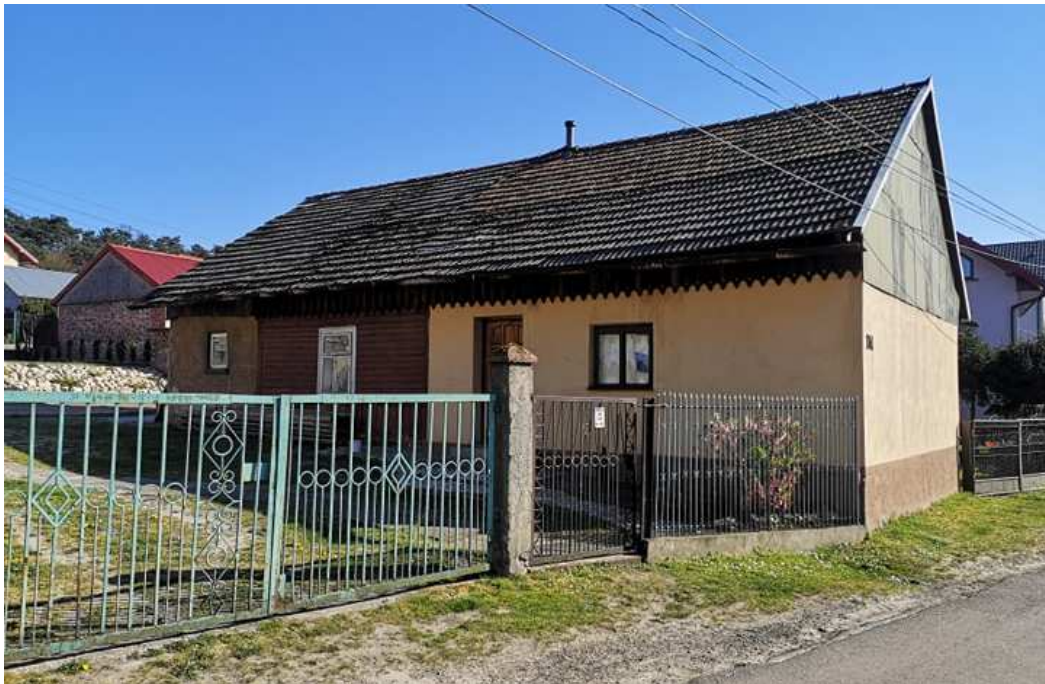
Fot. nr 98. Przebudowany w prawej części, zapewne około 90-letni dom o nieustalonej lokalizacji.