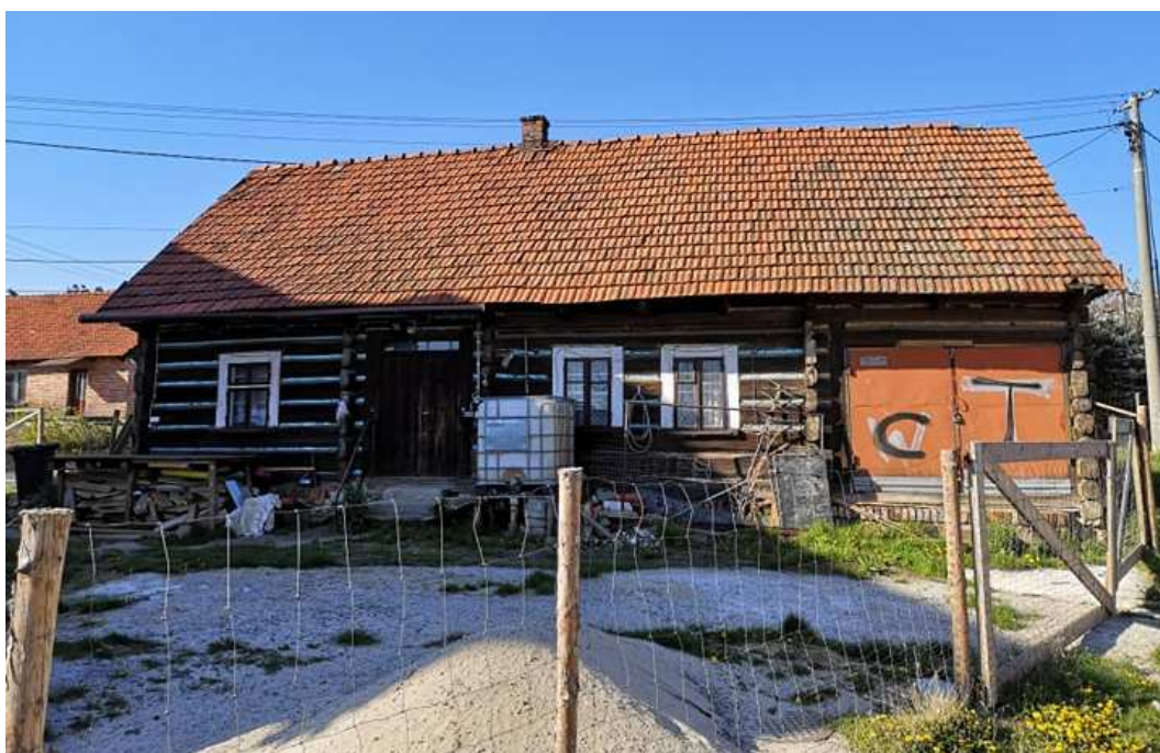
Fot. nr 106 (106-107). Fasada tej zapewne półtoratraktowej chałupy od strony podwórka.