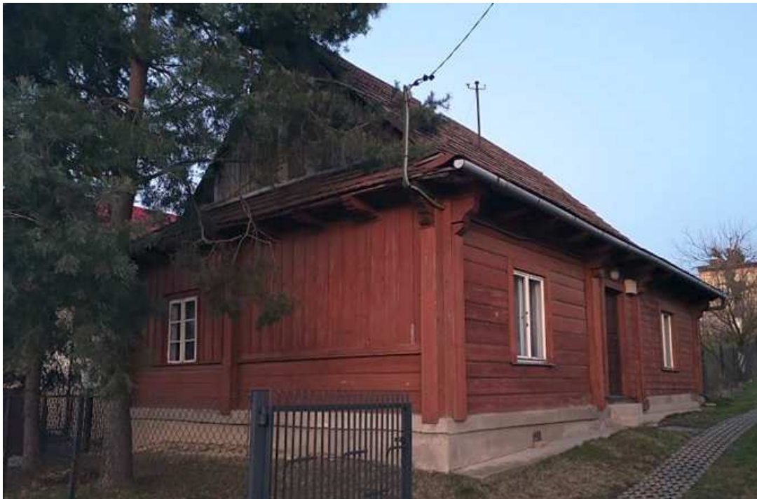
Fot. nr 88.