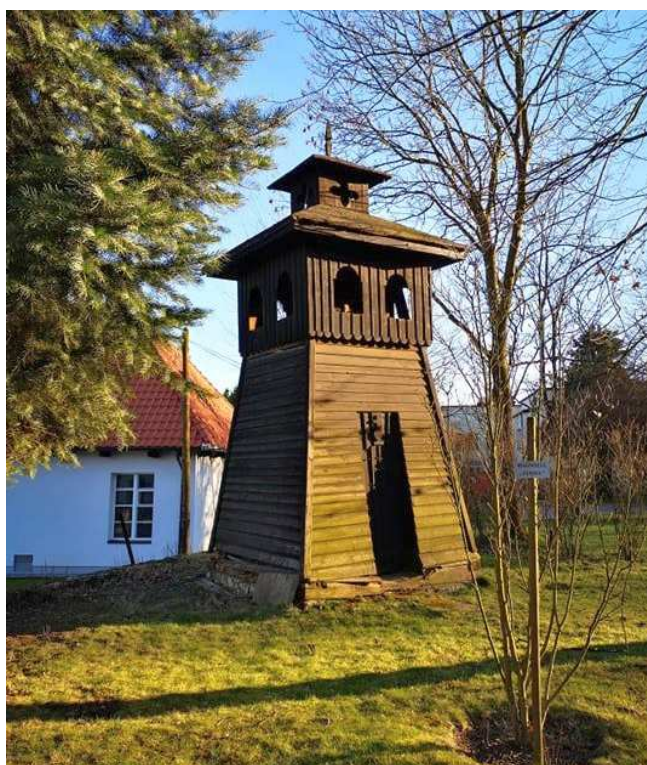
Fot. nr 14. Drewniana dzwonnica z końca XIX wieku przy kościele przy ulicy Pod Strzeżą w Bronowicach Małych.