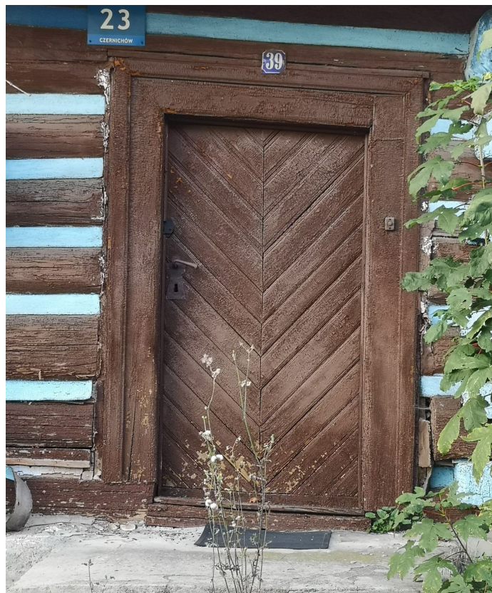
Fot. nr 154.