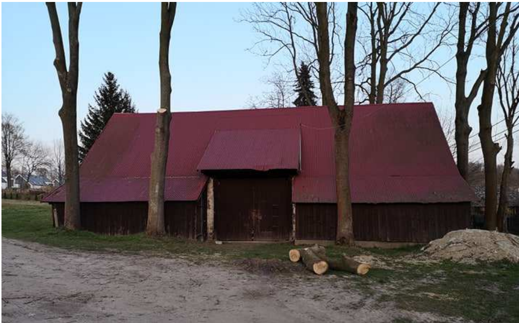
Fot. nr 179. Rozległa stodoła z wysokimi wrotami.