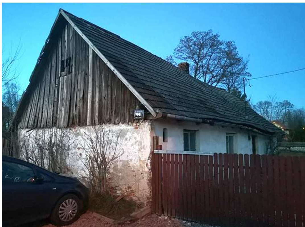
Fot. nr 90.