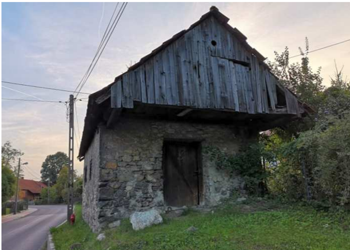
Fot. nr 35 (35-38). Zapewne około 100-letnia, kamienna kuźnia.