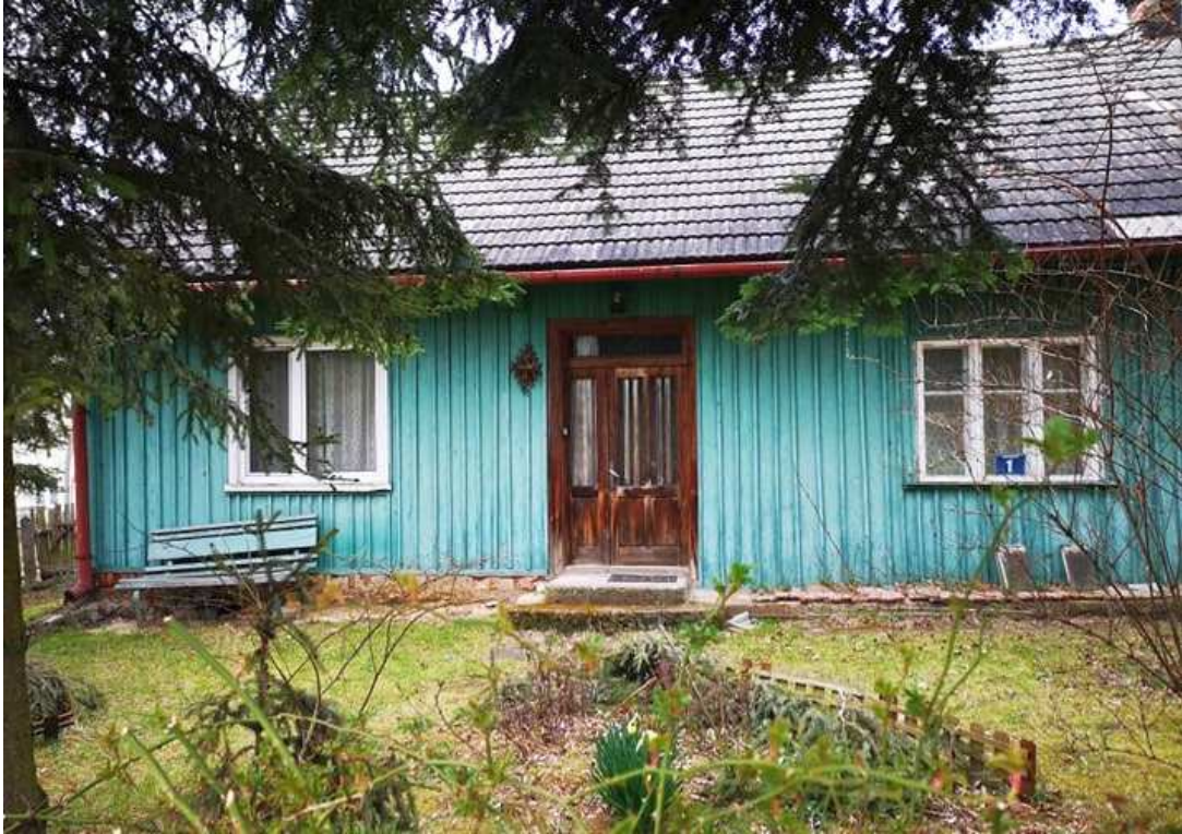
Fot. nr 228 (228-229). Zapewne międzywojenny dom z ulicy Siedliska 1.