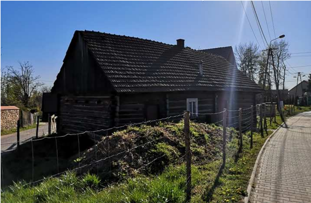
Fot. nr 99 (99-107). Powstała zapewne na początku XX wieku chałupa spod nr 2 i jej detale.