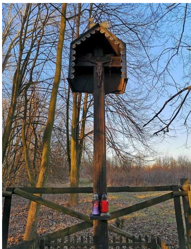
Fot. nr 18.