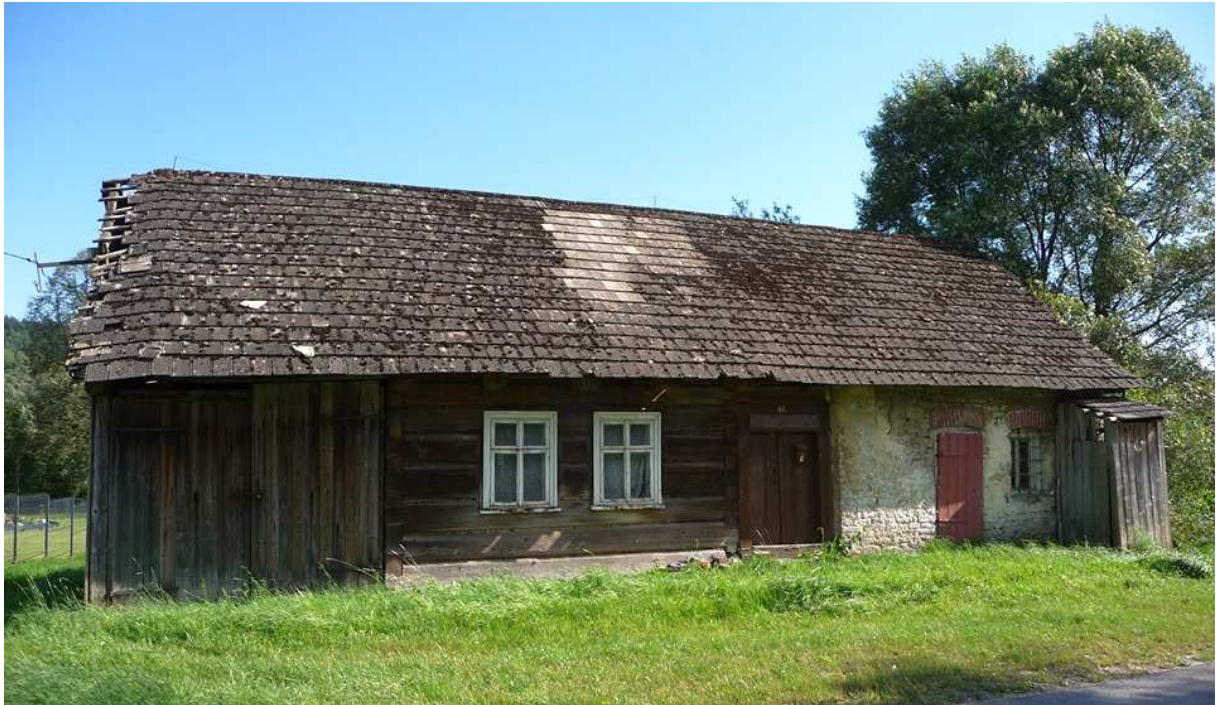
Fot. nr 319. Zapewne około 100-letni dom ze stajnią i niewielką stodołą we wspólnym korpusie. A z prawej wygodlka.