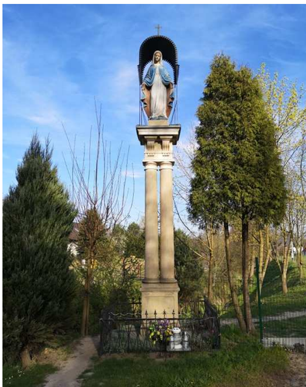
Fot. nr 61. Kapliczka z figurą Matki Boskiej.