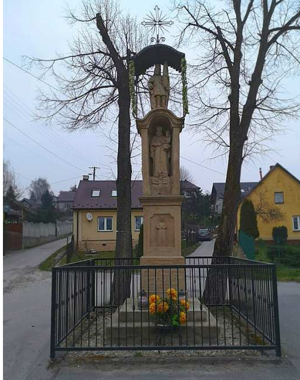
Fot. nr: 230-233. Kapliczki słupowe z terenu Radziszowa. Fot. nr 230 (230-231). Ze św. Florianem w zwieńczeniu.