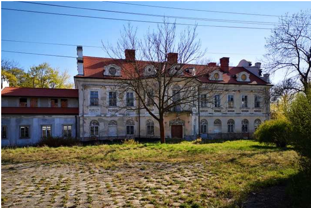
Fot. nr 94.