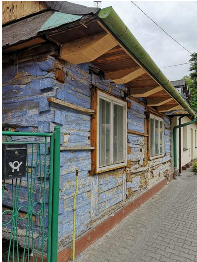
Fot. nr 200.