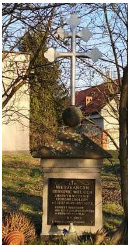
Fot. nr 20.