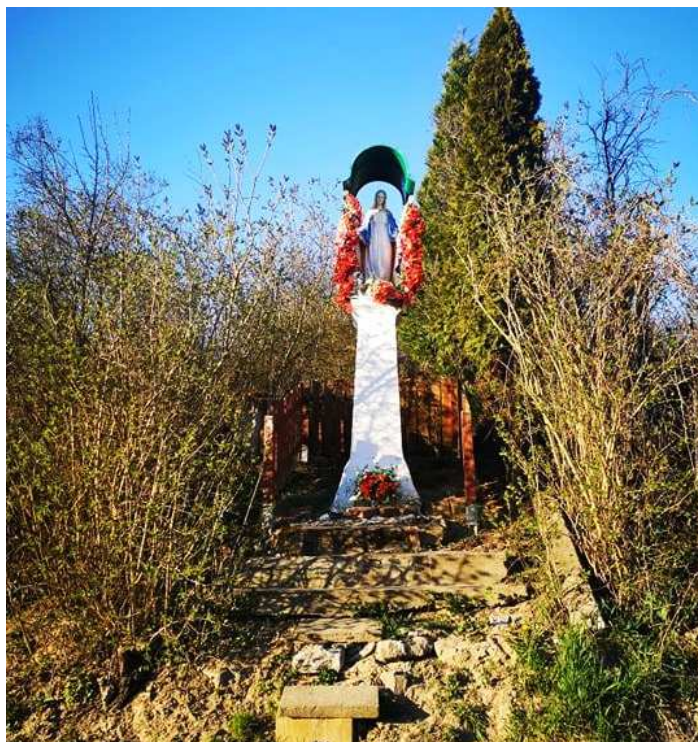
Fot. nr 82. Figura z Matką Boską na cokole.