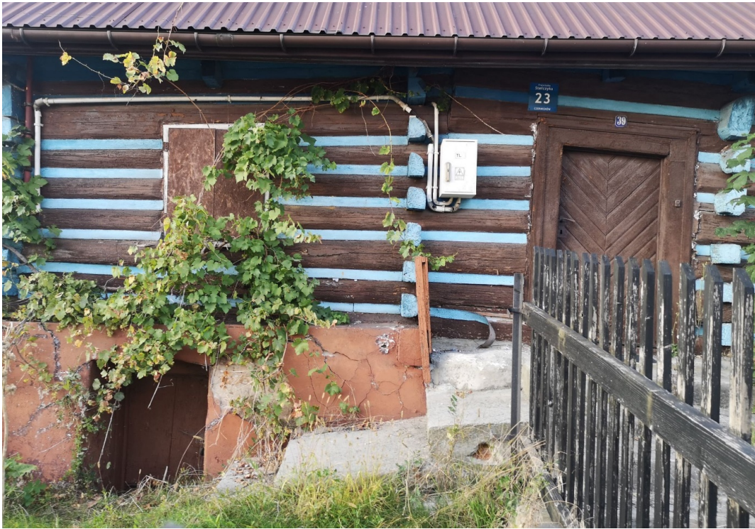
Fot. nr 153.