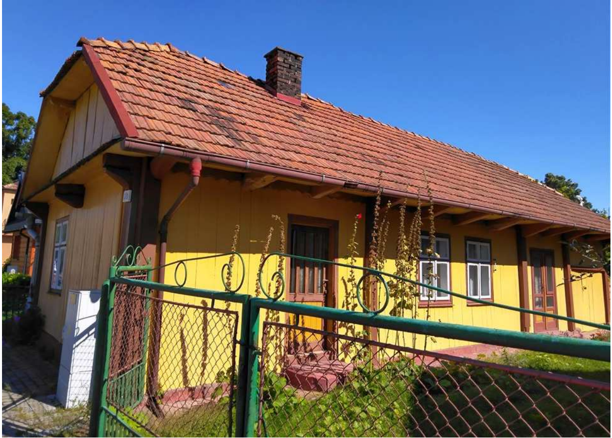
Fot. nr 314. Zapewne około 100-letni dom z dachem okapowym spod nr 59.