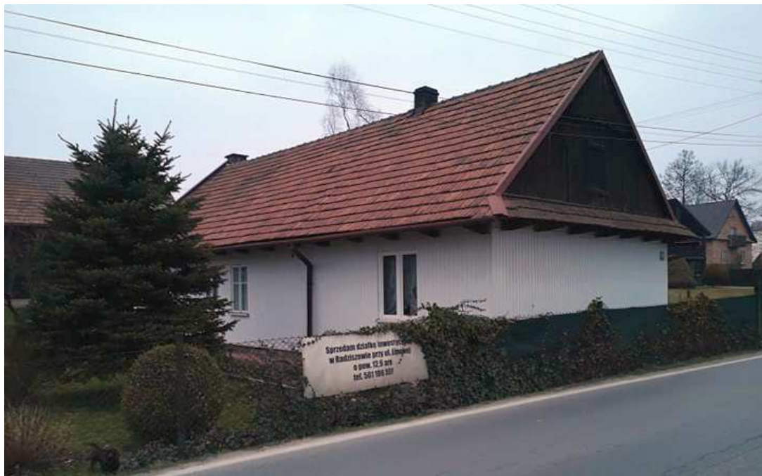
Fot. nr 209.