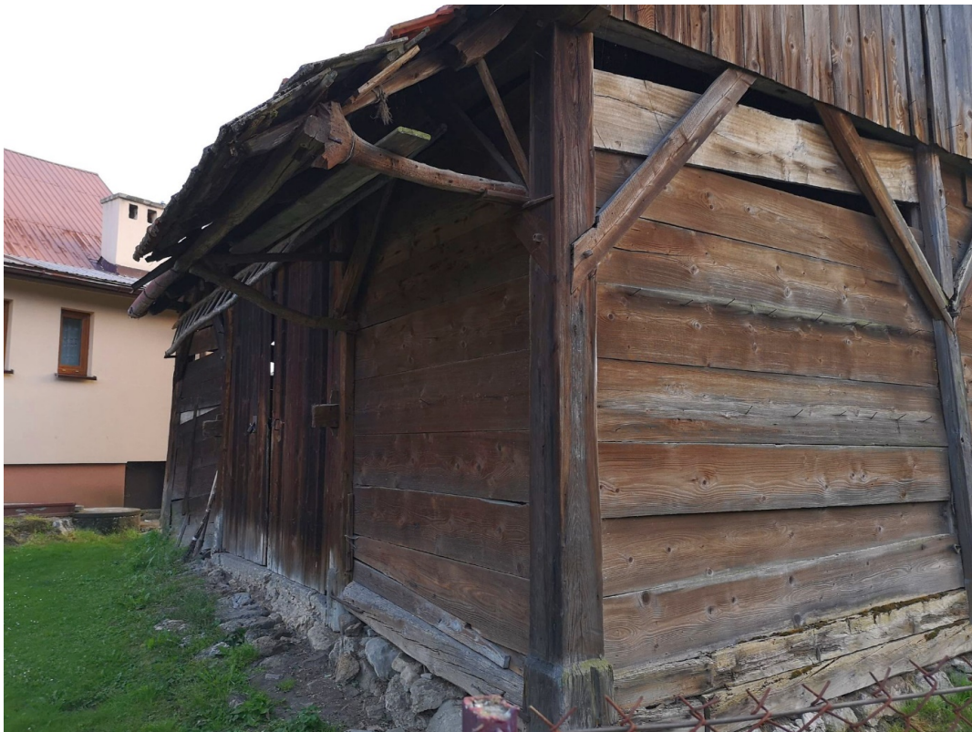
Fot. nr 42.