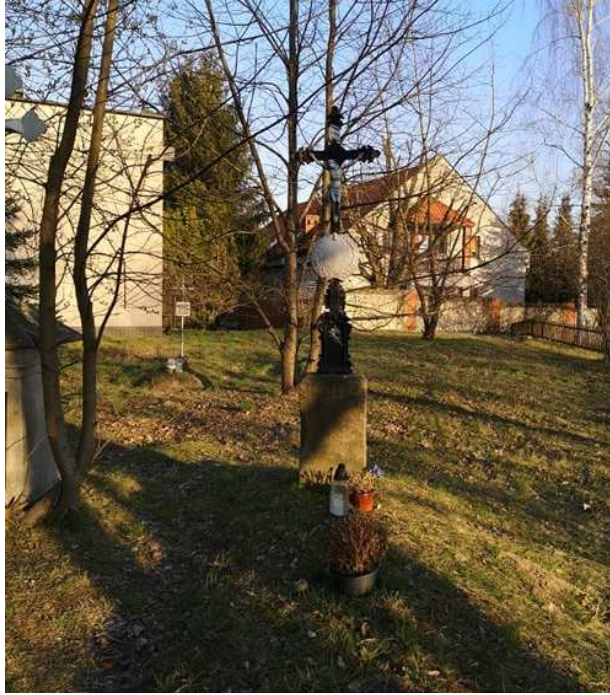
Fot. nr 21.