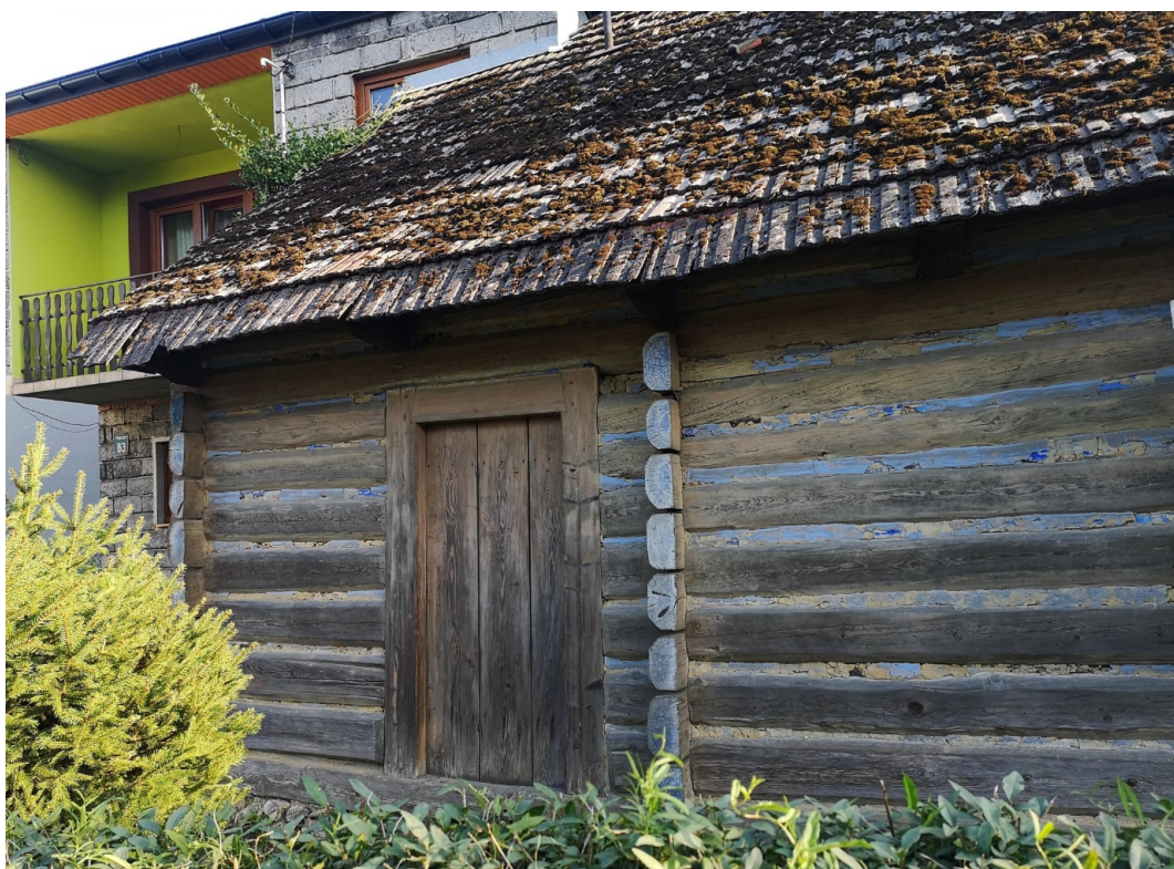
Fot. nr 175.