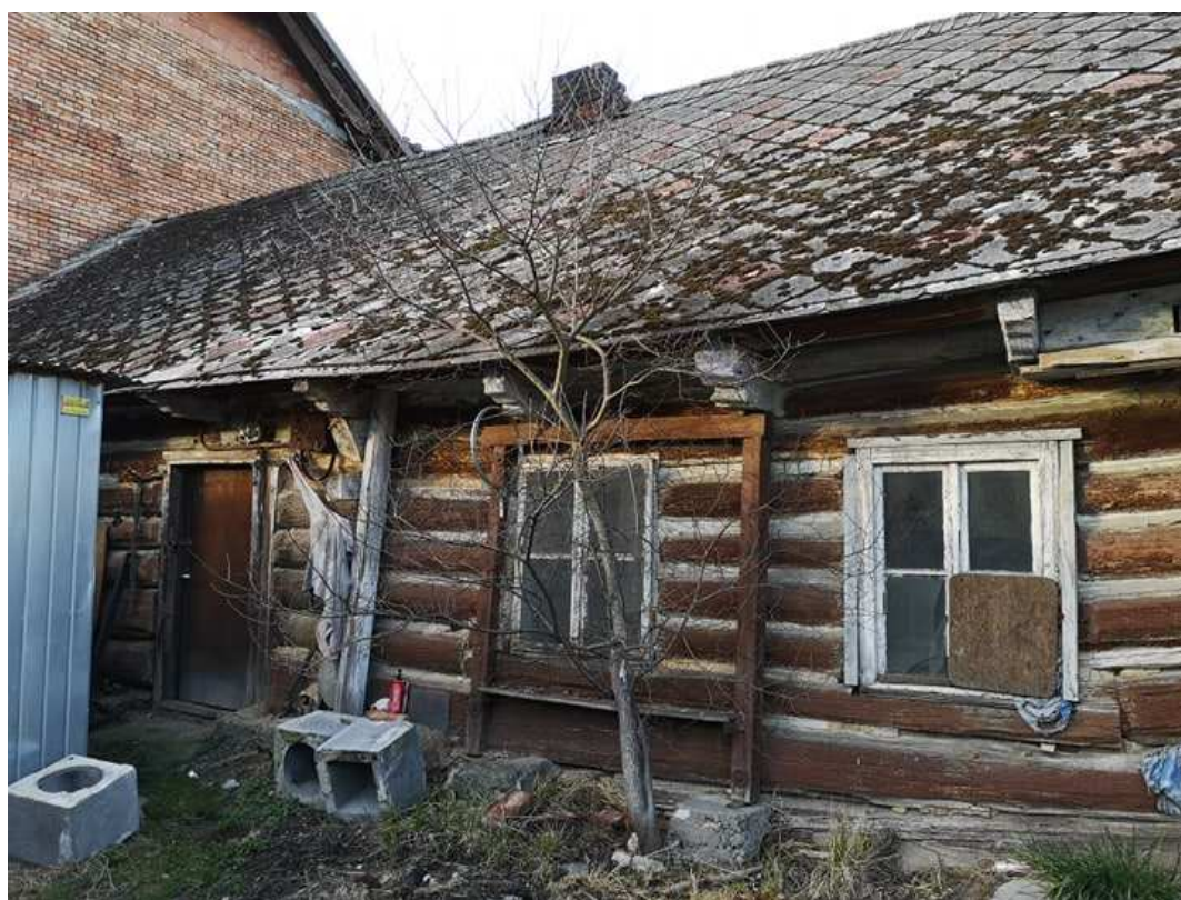
Fot. nr 24 (24-25). Detale fasady.