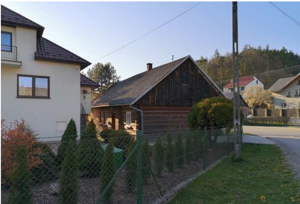
Fot. nr 139 (139-142). Oryginalna w swej lewej części, zapewne ponad 100-letnia chałupa spod nr 219.