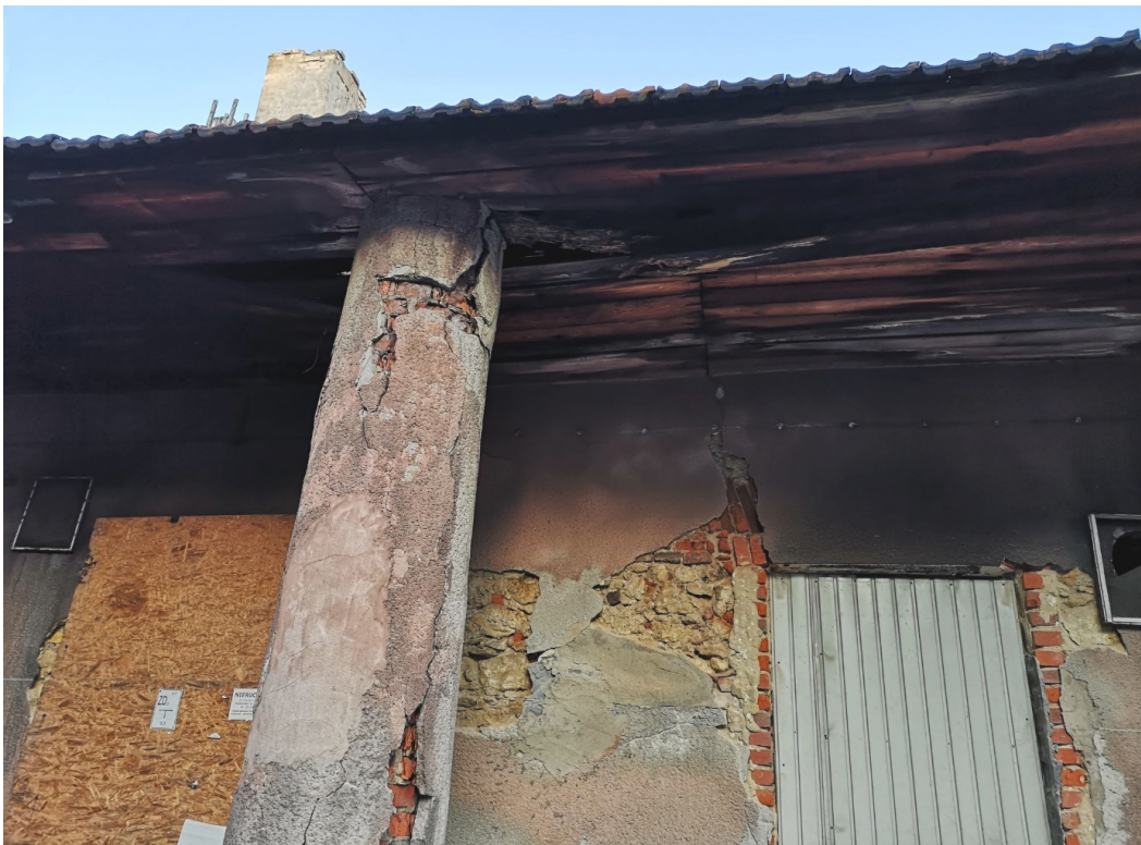
Fot. nr 164.