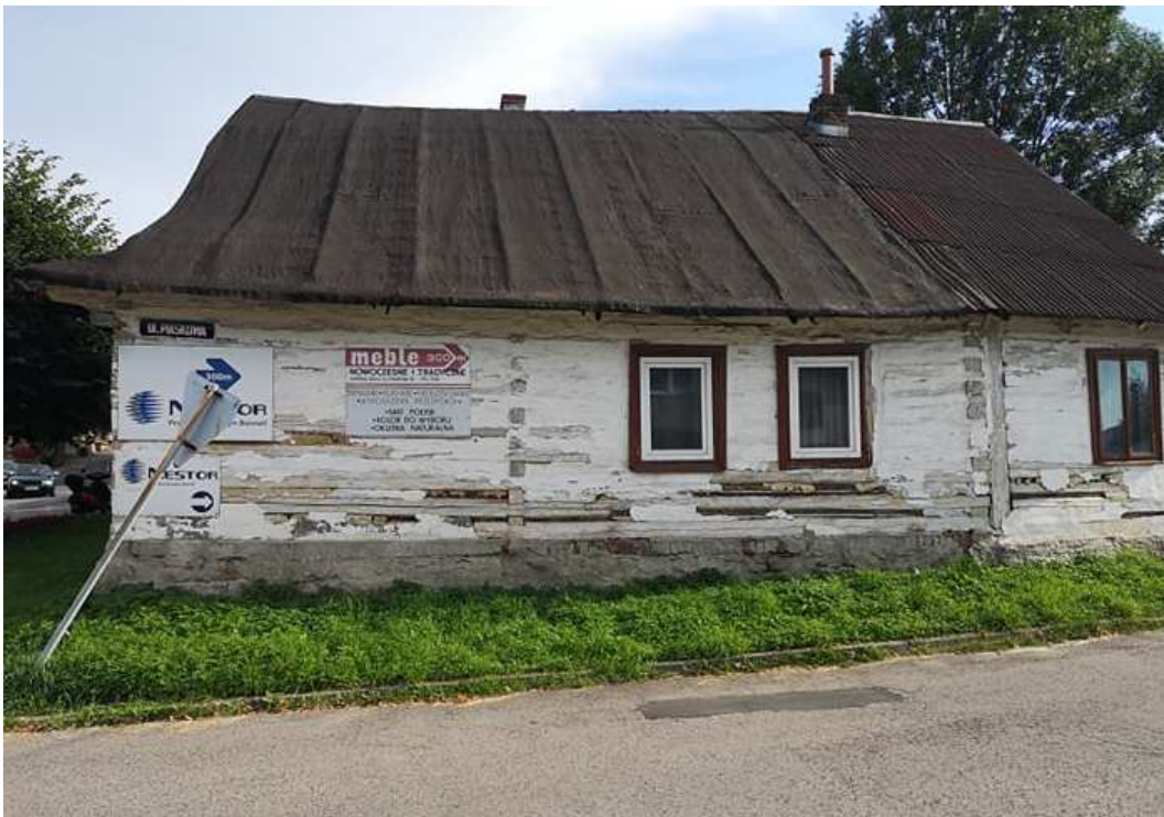
Fot. nr 240 (240-241). Front chałupy z wymienionymi już oknami.