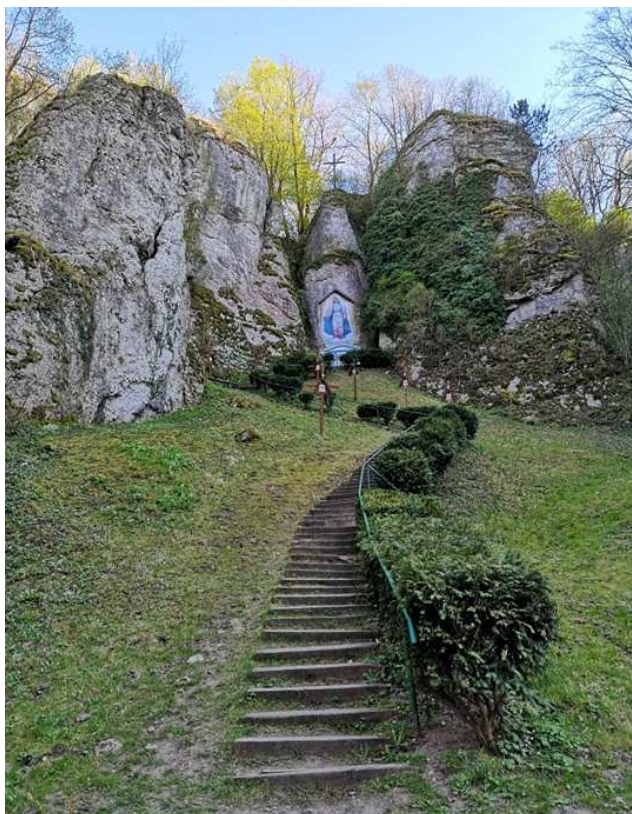
Fot. nr 137 (13-138). Naskalna kapliczka w Dolinie Mnikowskiej.