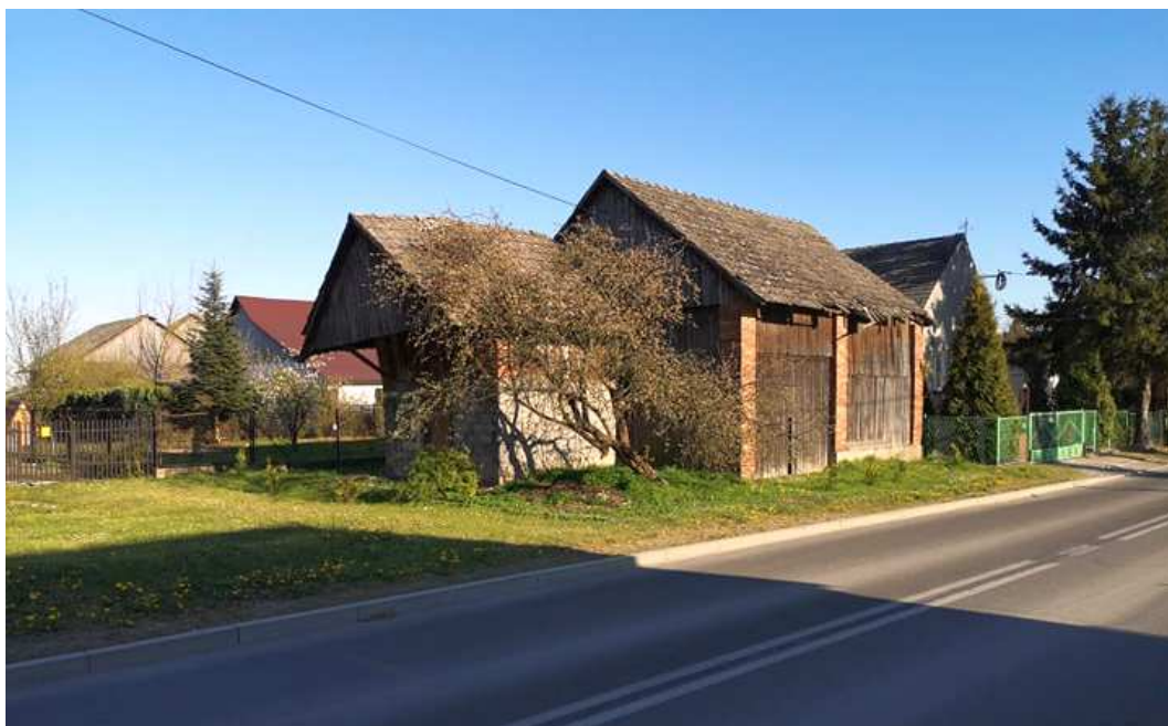
Fot. nr 130. Stodoła i przylegające do niej pomieszczenie gospodarcze spod nr 46.