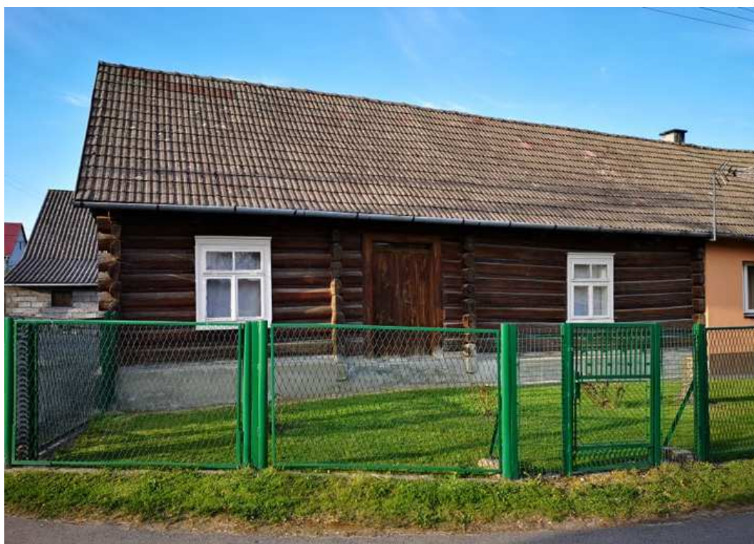
Fot. nr 68.