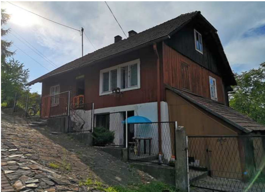
Fot. nr 254 (254-255). Przedwojenny dom o znacznie przekształconej już fasadzie.