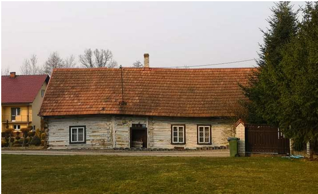
Fot. nr 223 (223-226). Wybudowana w roku 1908 chałupa spod nr 128.