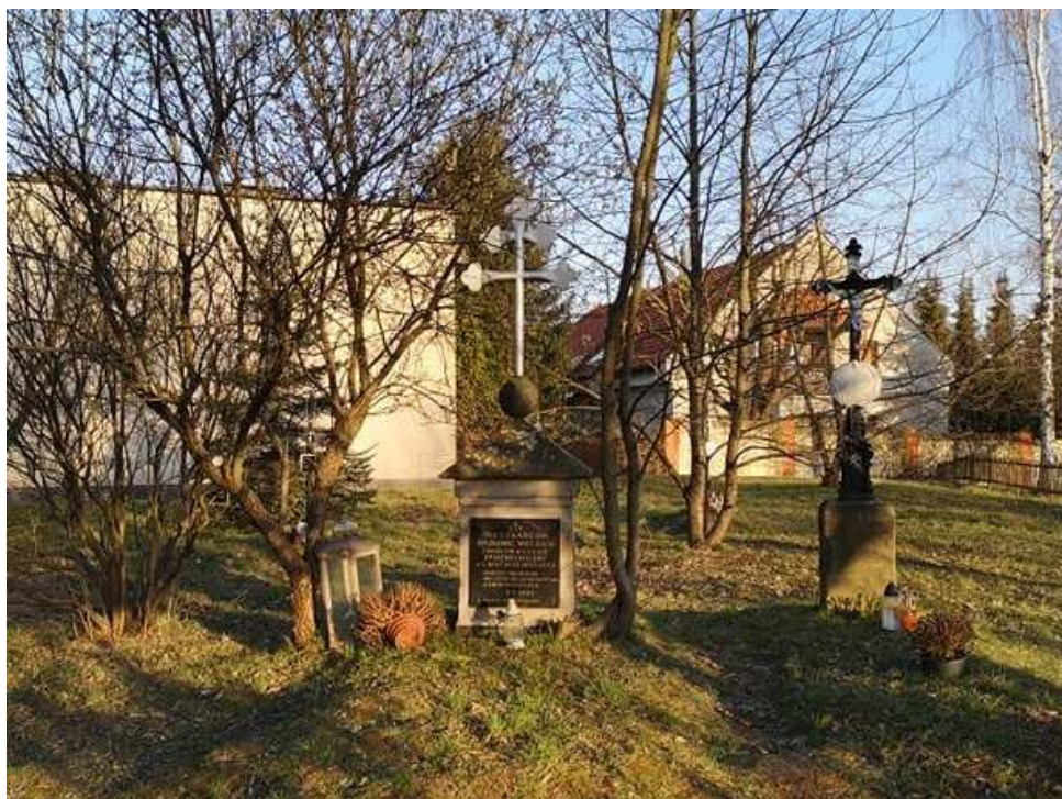
Fot. nr 19 (19-21). Cmentarz choleryczny na zbiegu ulic: Chełmońskiego i Piaskowej.