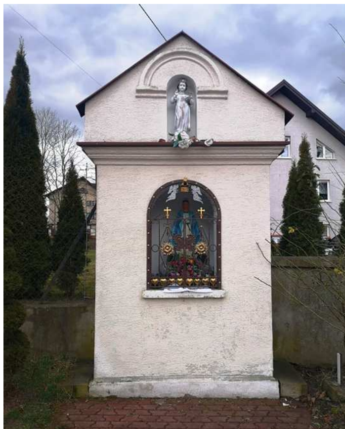
Fot. nr 81. Murowana kapliczka z Matką Boską we wnętrzu.