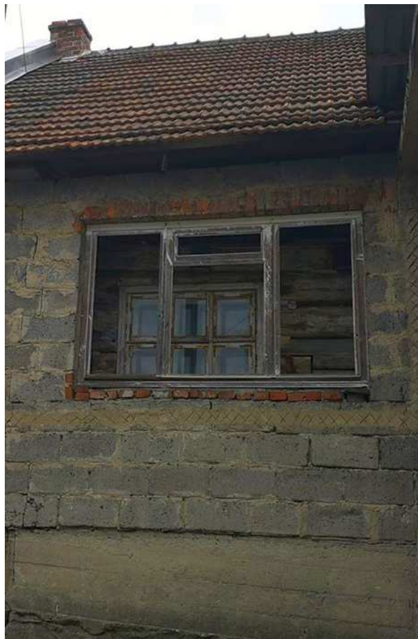
Fot. nr 22. „Symbioza” zabudowy drewnianej i murowanej.