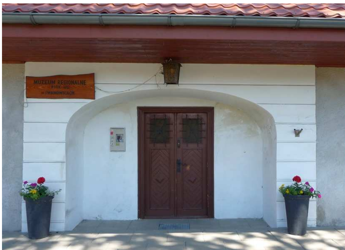
Fot. nr 306.