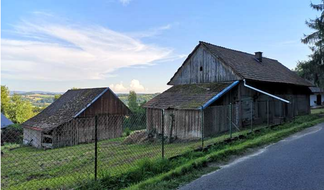
Fot. nr 279 (279-284). Zapewne jeszcze XIX-wieczna zagroda spod nr 20.