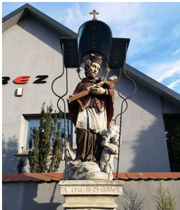
Fot. nr 79.