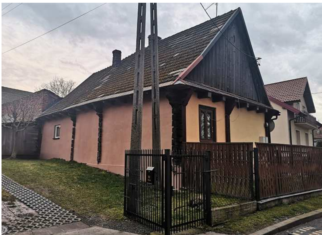
Fot. nr 86.