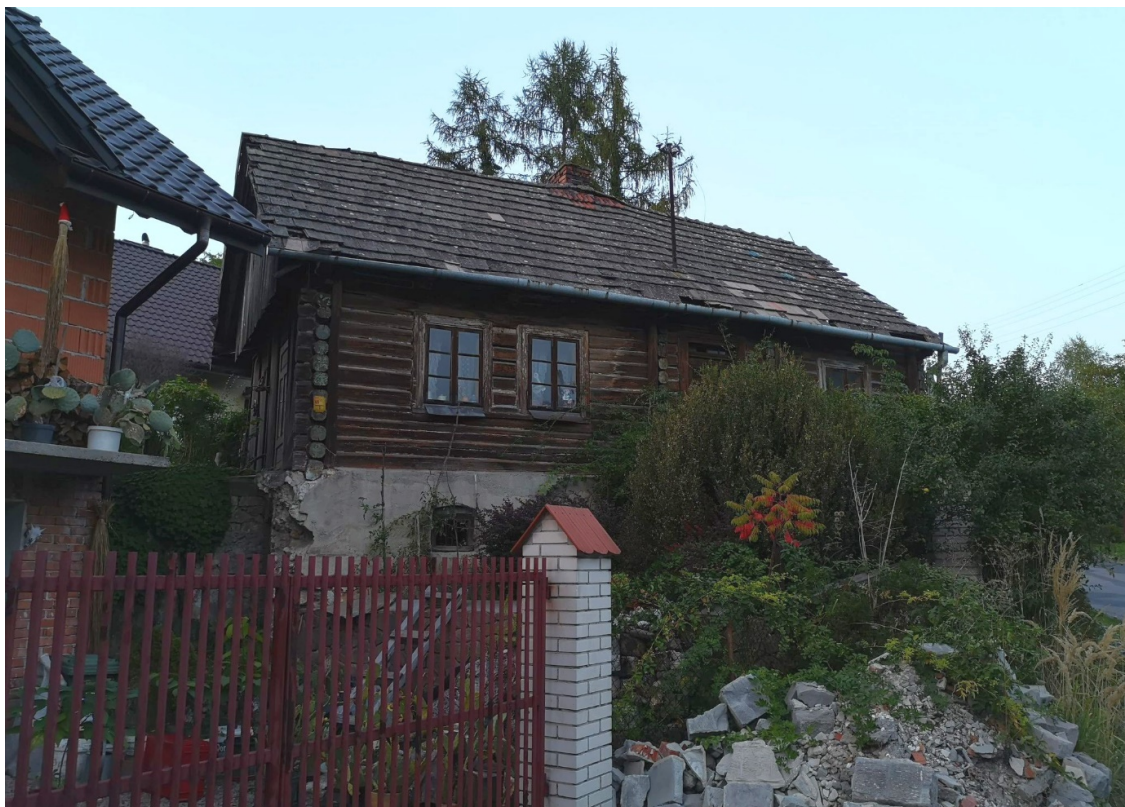
Fot. nr 33 (33-34). Zapewne dwutraktowa chałupa z ulicy Krakowskiej 3, która mogła powstać nawet na przełomie XIX i XX wieku.