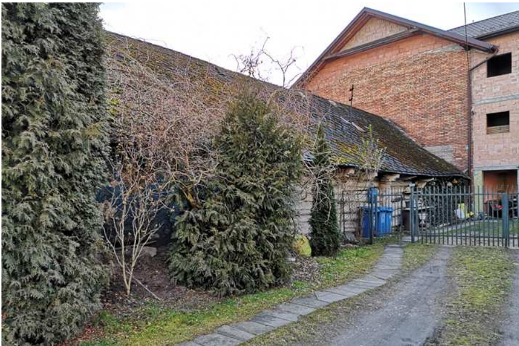
Fot. nr 26. Widok na tylny fragment.