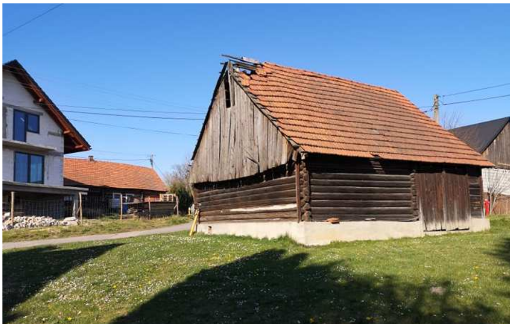
Fot. nr 108 (108-111). Usytuowana na tyłach posesji pod nr 2 stodoła i jej detale.