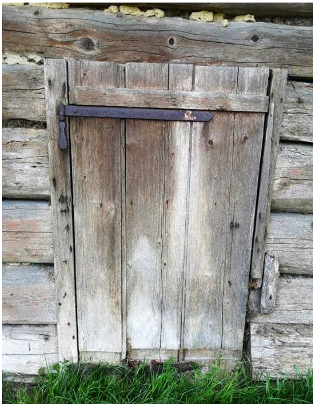
Fot. nr 55.