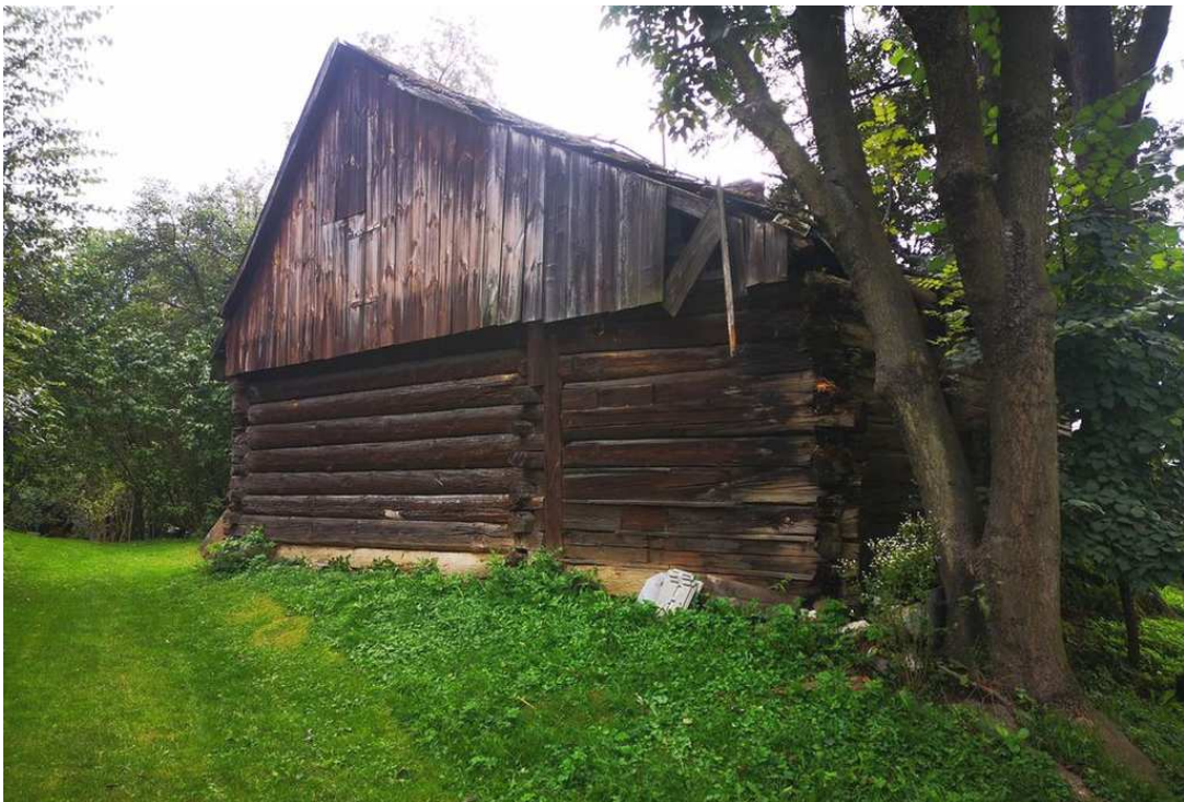
Fot. nr 126.