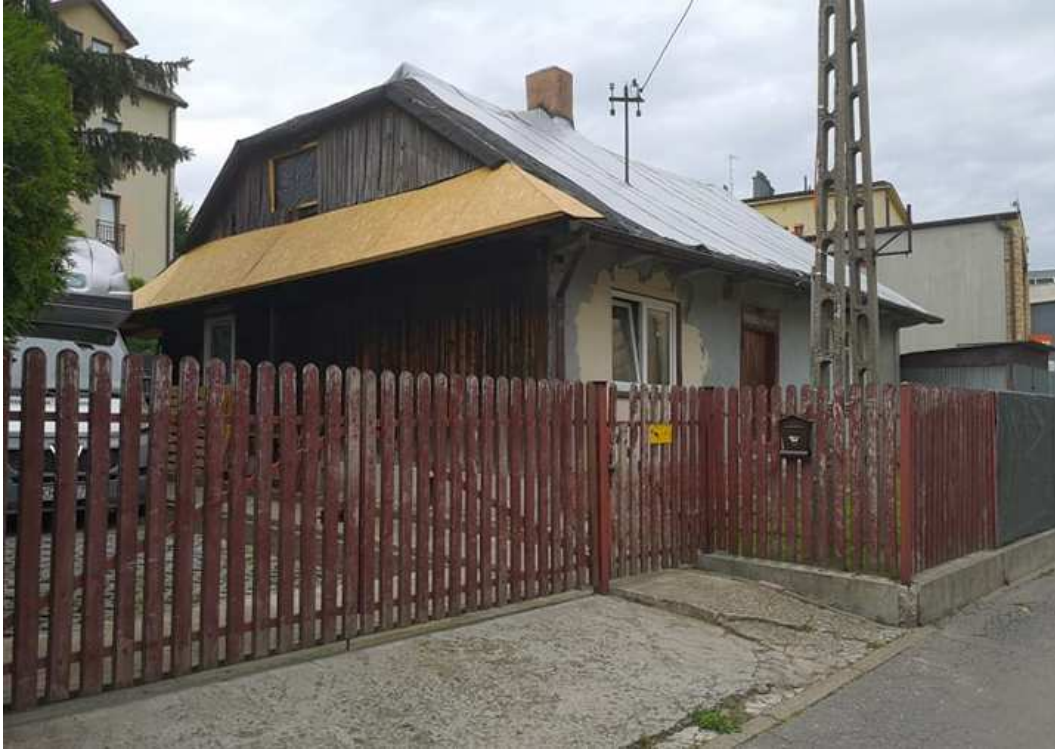
Fot. nr 204. Podobnego typu, co w poprzednim przypadku dom, ale znacznie już przekształcony. Lokalizacji nie udało mi się ustalić.