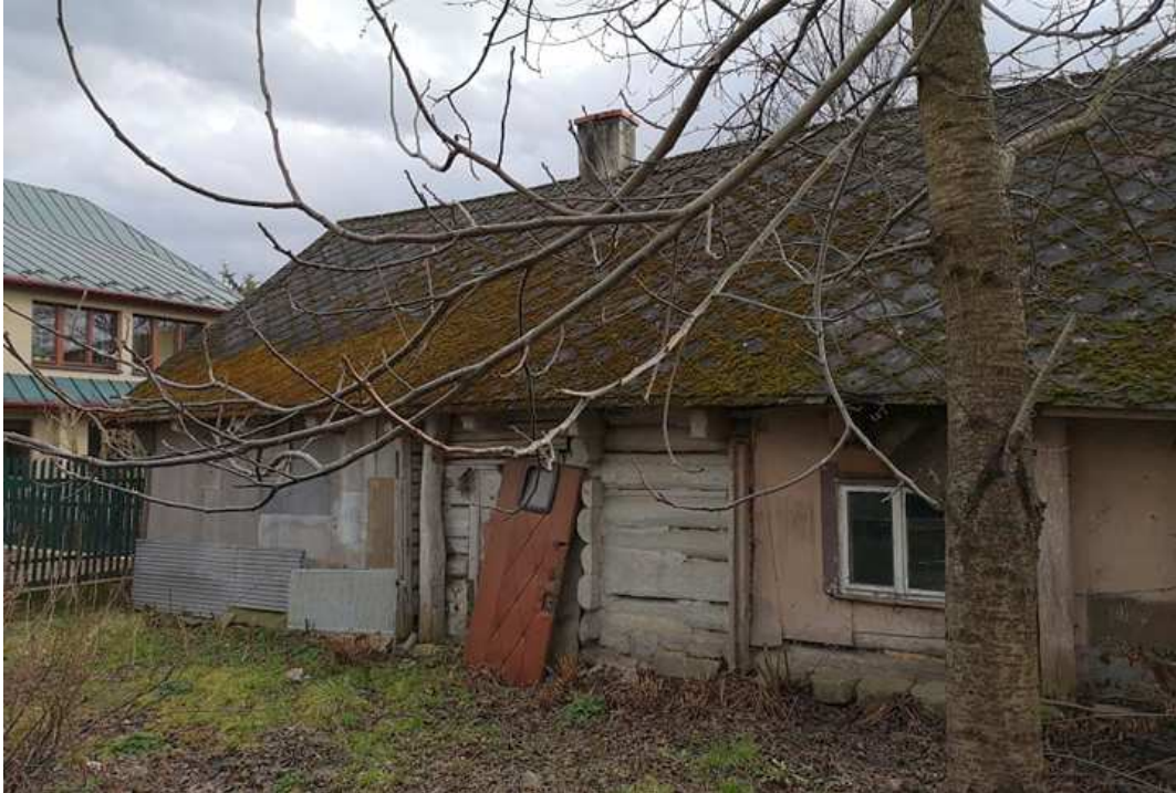
Fot. nr 9.