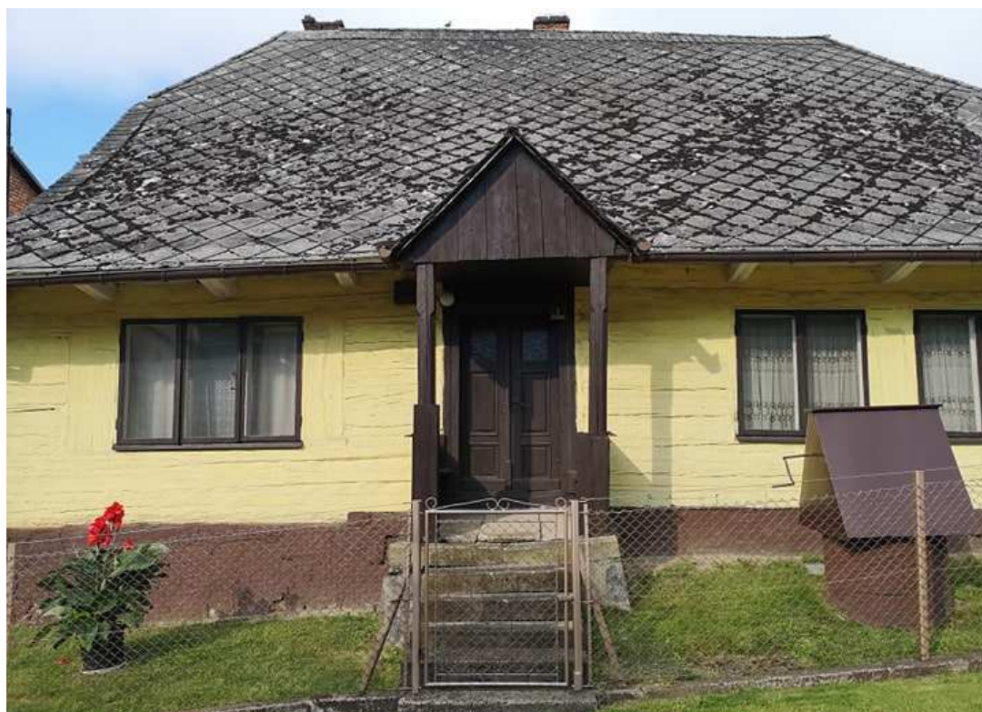
Fot. nr 250.