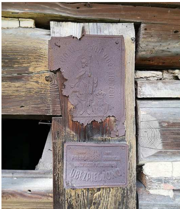
Fot. nr 49.