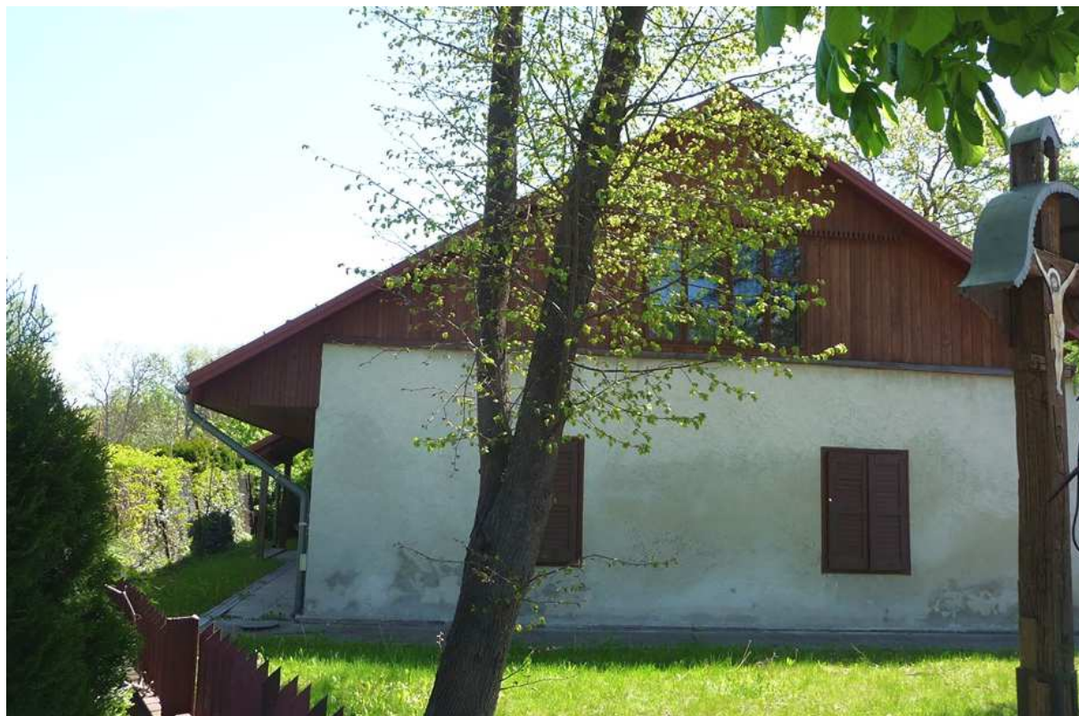
Fot. nr 307.