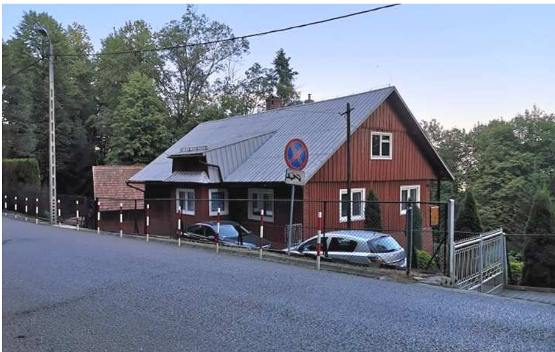
Fot. nr 266. Mocno już przebudowana fasada domu, który mógł powstać w latach 30. XX wieku.