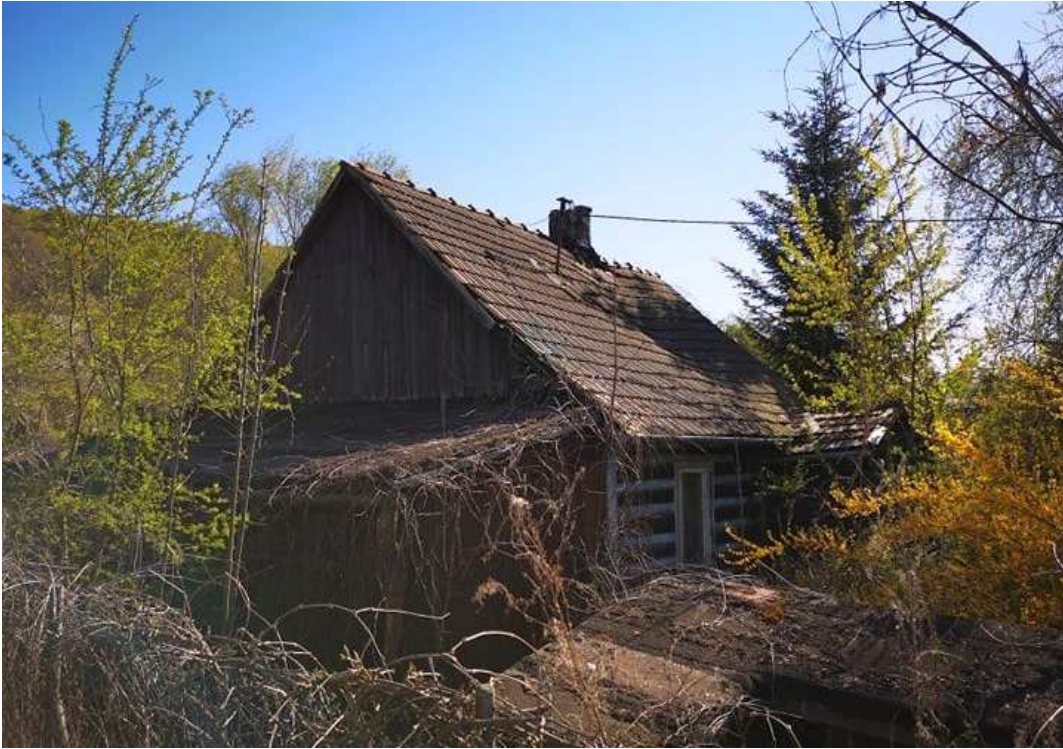
Fot. nr 91 (91-92a). Wybudowana zapewne w okolicy przełomu XIX i XX wieku skromna chatka z ulica Chełmskiej 17, w której na początku roku 2021 zawalił się dach, co najwyraźniej oznacza jej koniec. (30.04.2020)