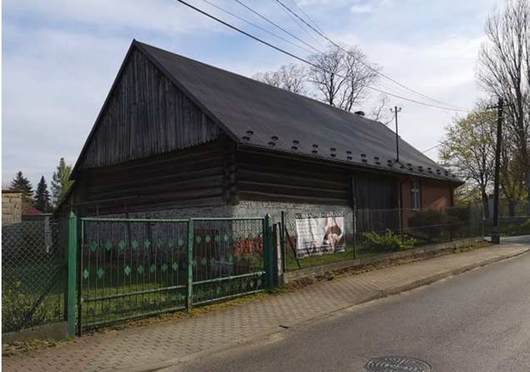
Fot. nr 57 (57-58). Dom mieszkalny o niustalonej lokalizacji, w jednym korpusie ze stodołą.