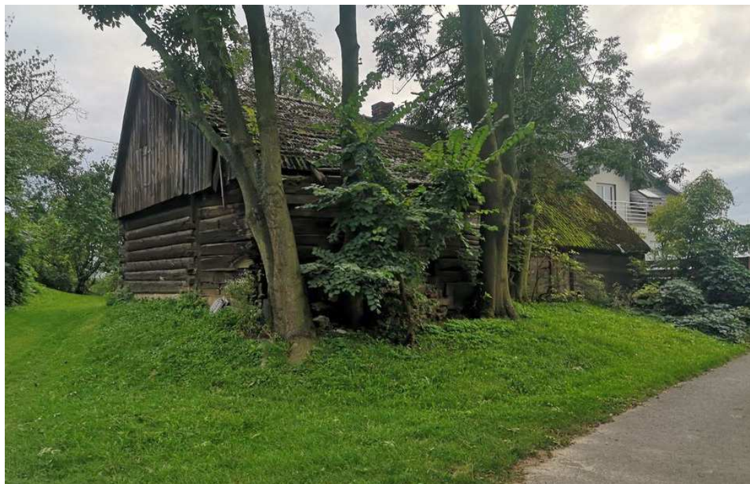
Fot. nr 124 (124-126). Tylny i boczny fragment.