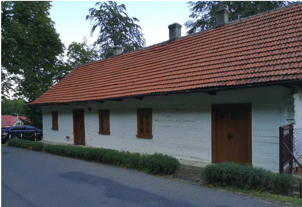
Fot. nr 277.