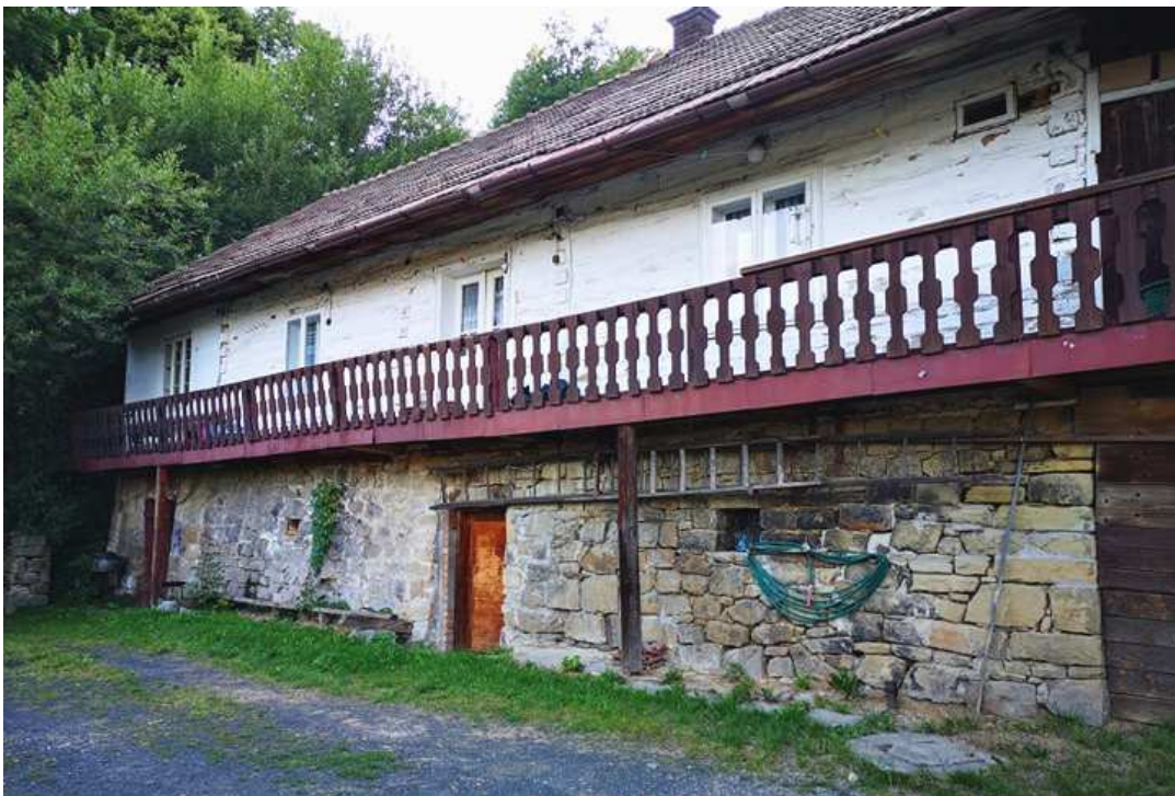
Fot. nr 262.