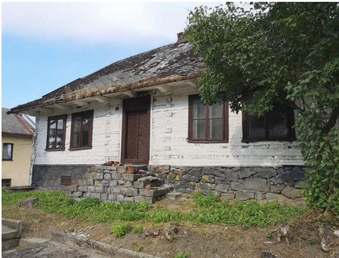
Fot. nr 246.