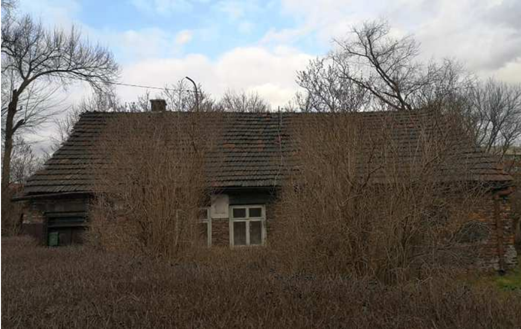
Fot. nr 5.