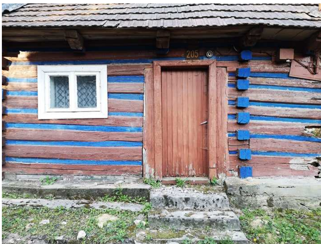
Fot. nr 148.