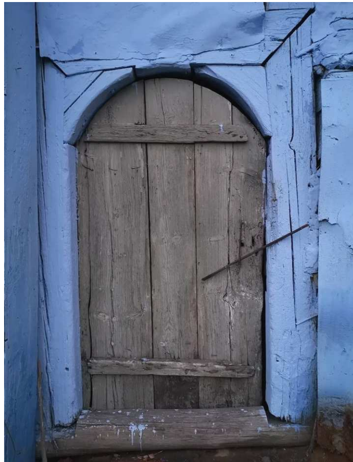
Fot. nr 292. Archaiczne drzwi z półkolistym odrzwiem.