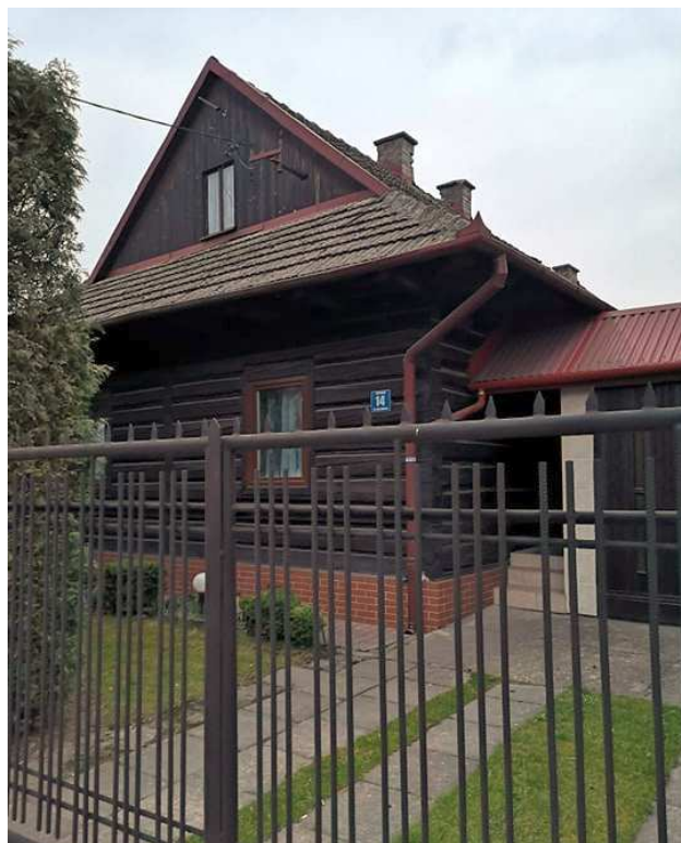
Fot. nr 213. Szczytowa ściana od strony ulicy Jana Pawła II.