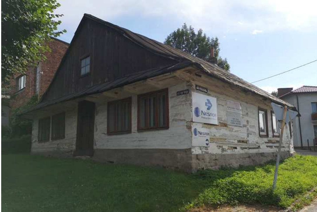
Fot. nr 237 (237-239). Ściana szczytowa.