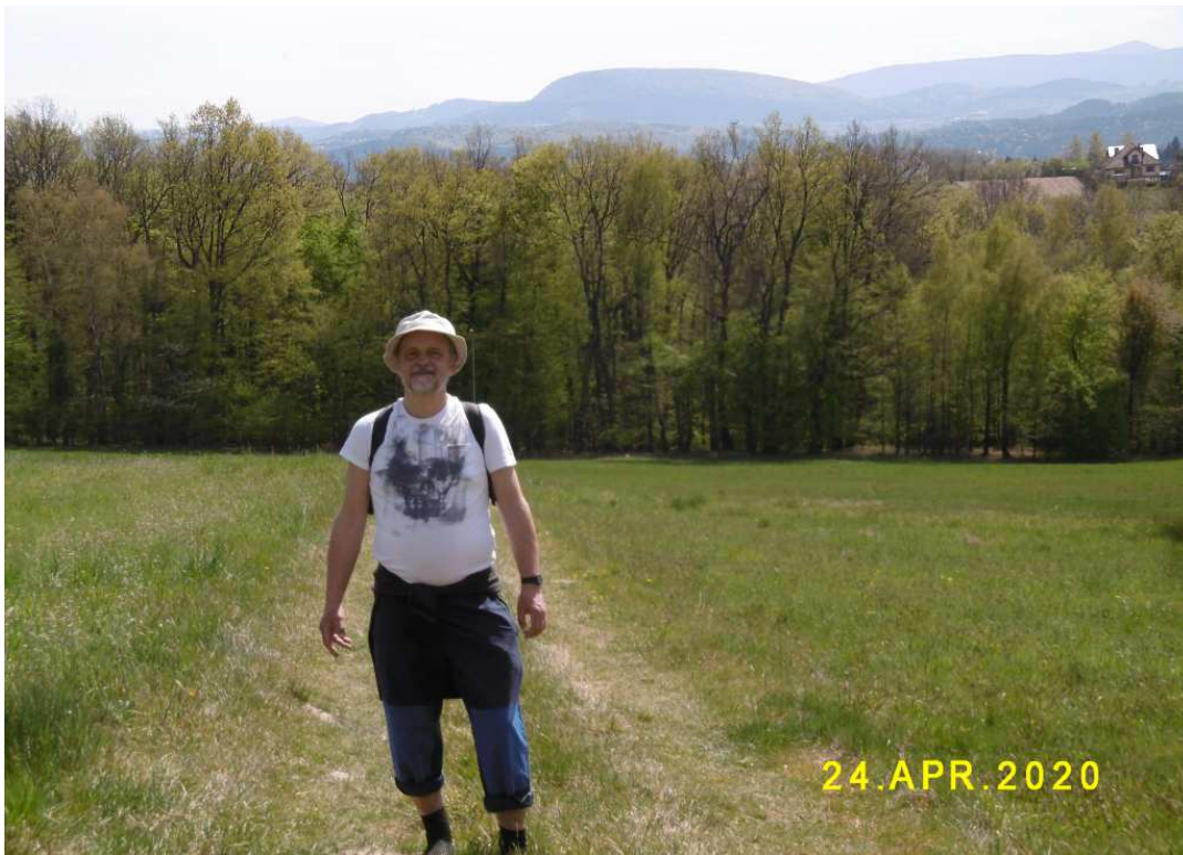
Fot. nr 1. W Zagórzanach koło Gdowa. W tle Beskid Wyspowy.