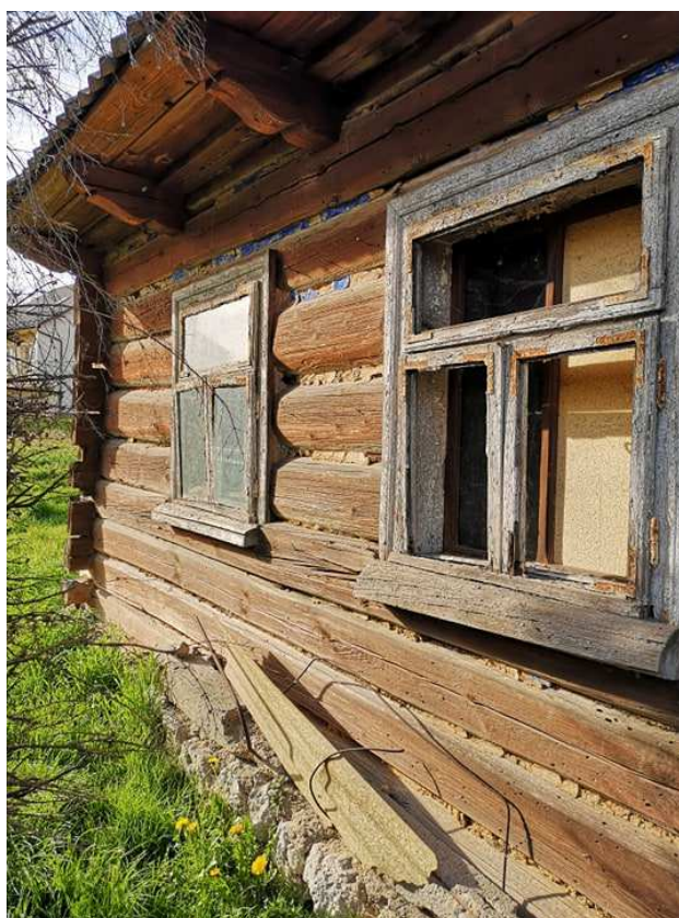
Fot. nr 46.