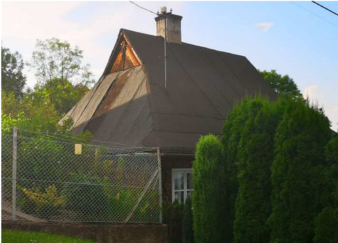
Fot. nr 257.