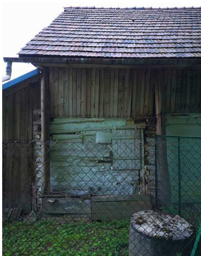
Fot. nr 281.