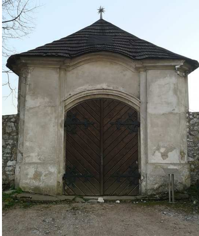
Fot. nr 190. Brama wjazdowa na teren benedyktyńskiego folwarku.