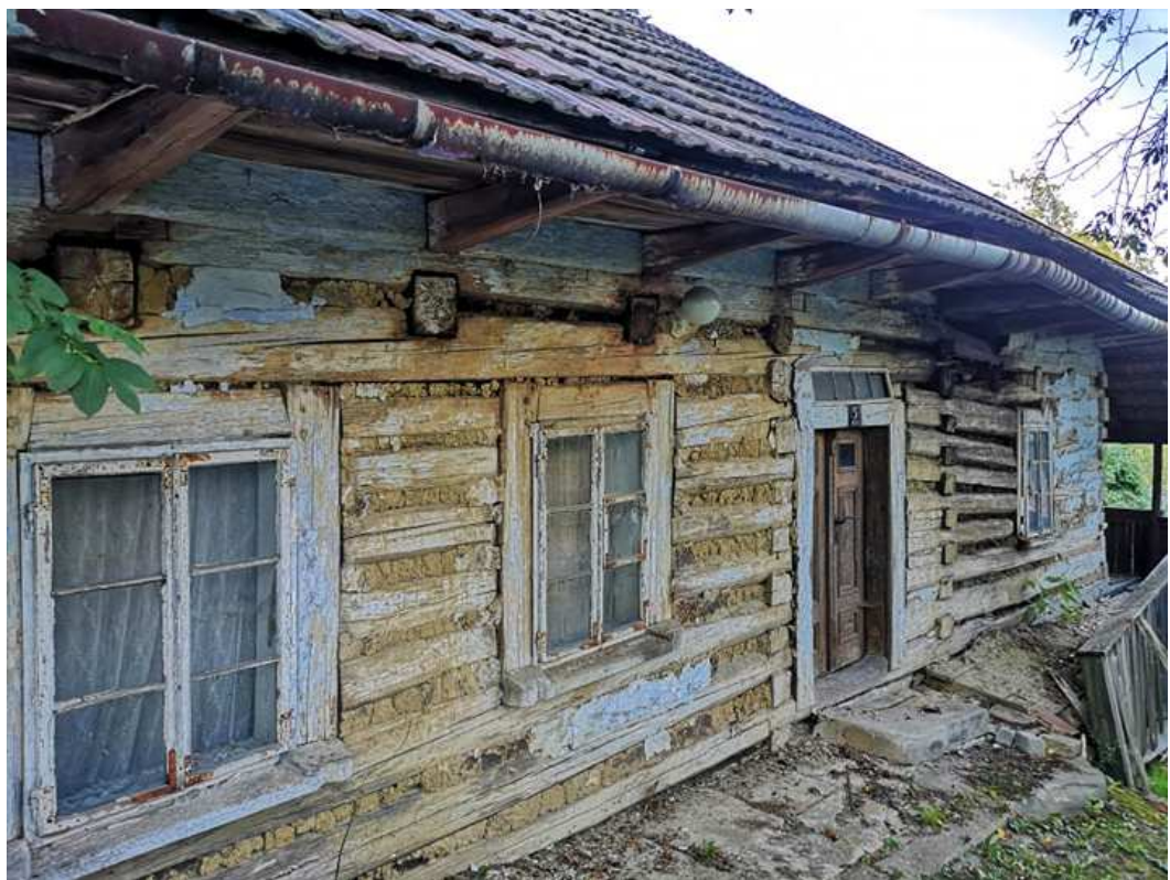
Fot. nr 272.