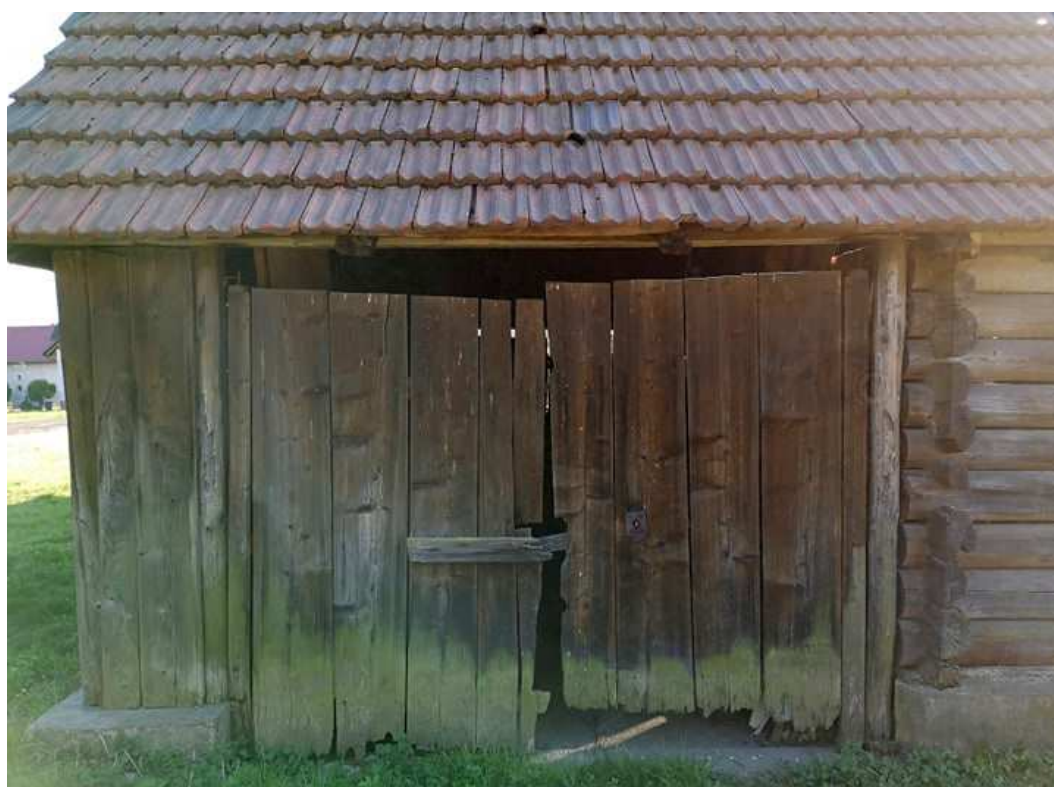
Fot. nr 110. Wrota.