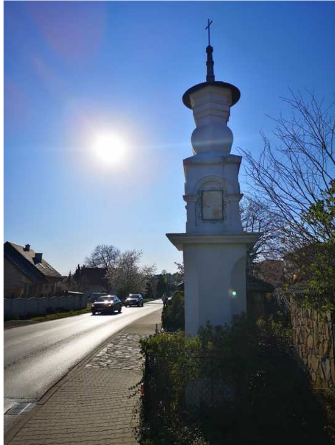
Fot. nr 127. Kapliczka słupowa przy wjeździe od strony Cholerzyna.