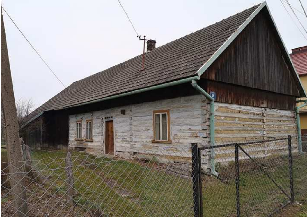
Fot. nr 220 (220-221). Ponad 100-letnia, zapewne półtoratraktowa chałupa spod 48.