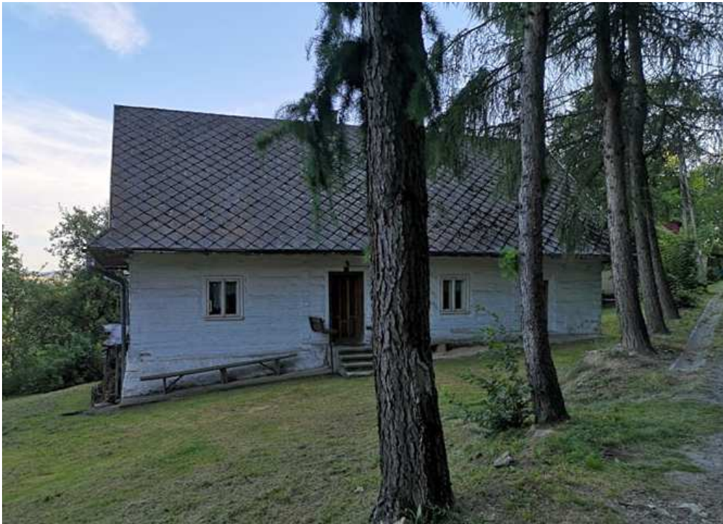
Fot. nr 285 (285-287). Ponad 100-letnia, bielona chałupa spod nr 21.