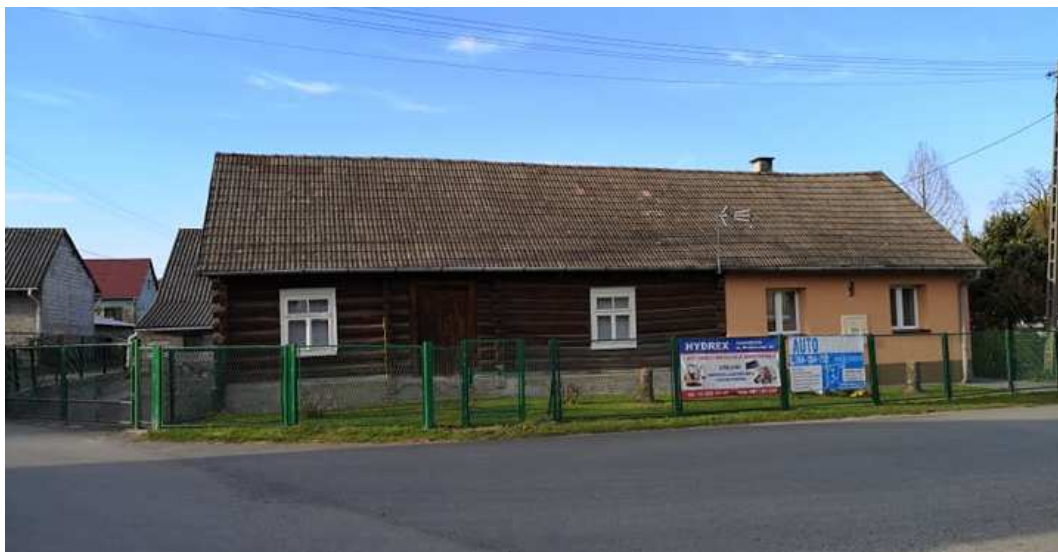
Fot. nr 67 (67-70). Oryginalna w lewym fragmencie około 100-letnia chałupa spod nr 193.