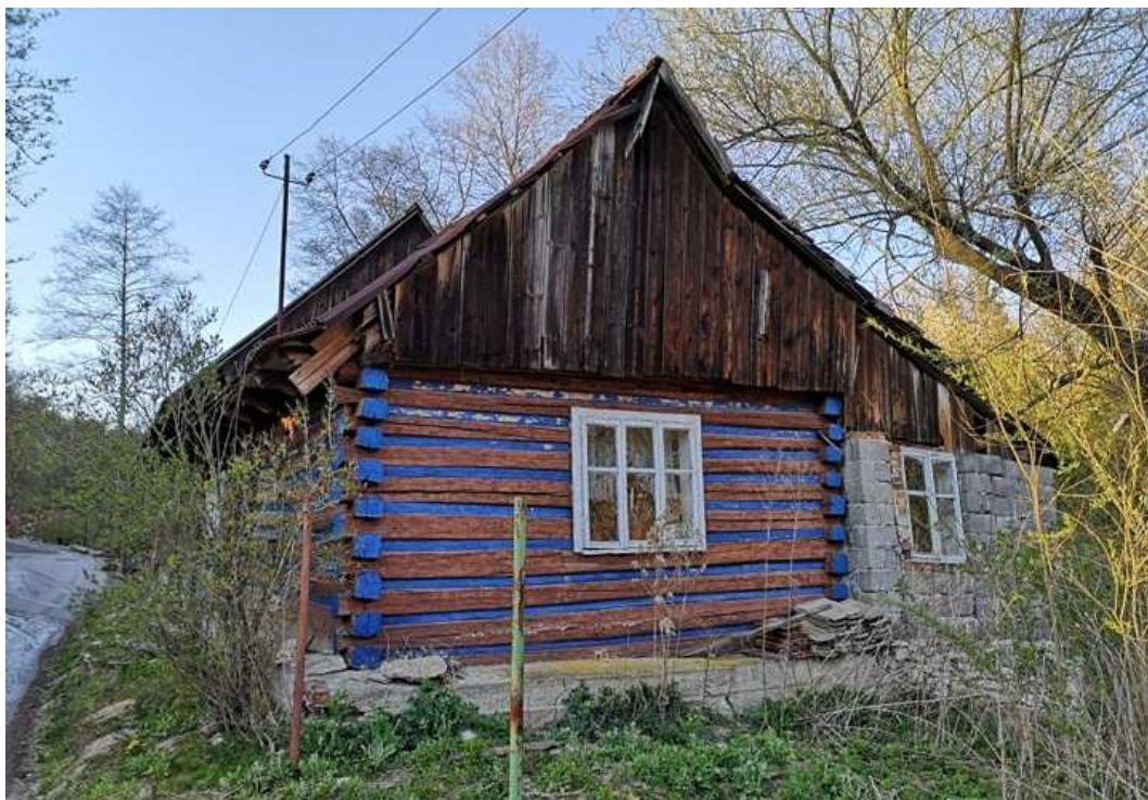
Fot. nr 143 (143-150). Archaiczny kompleks mieszkalno gospodarczy spod nr 205 i jego detale.