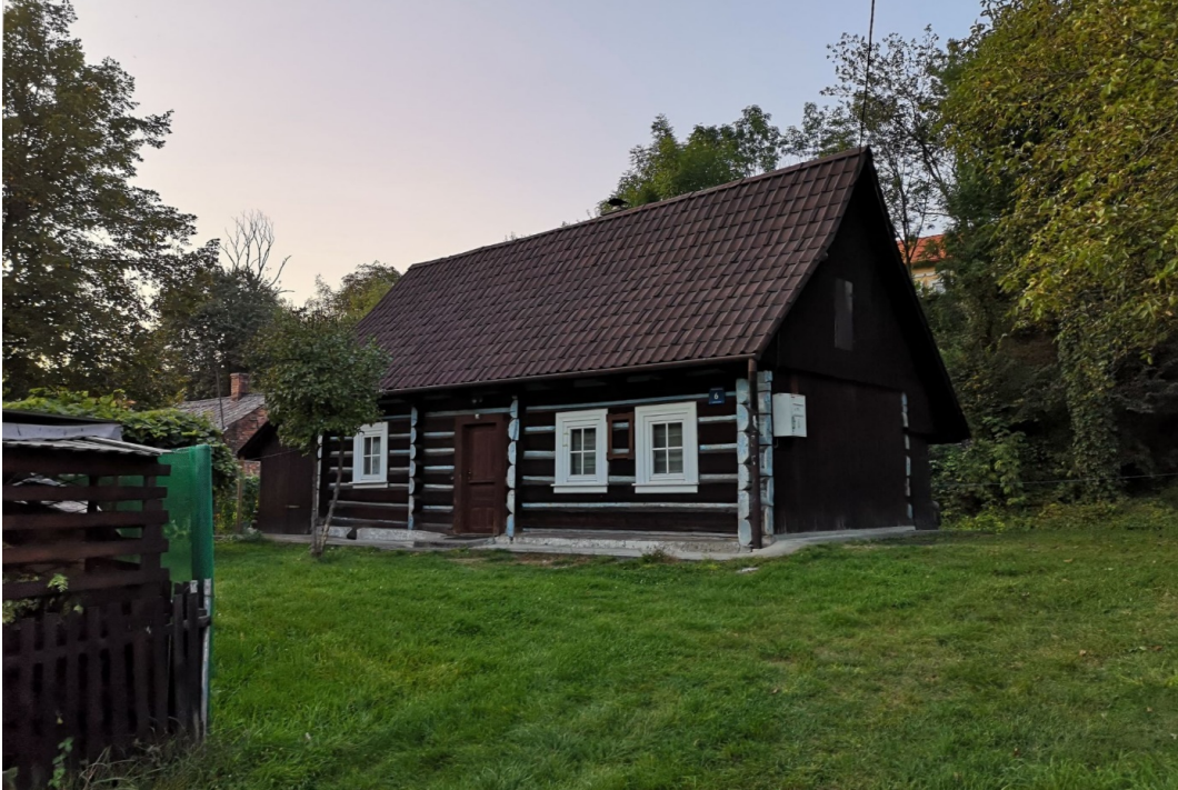
Fot. nr 165. Zapewne ponad 100-letnia chałupa spod nr 6.