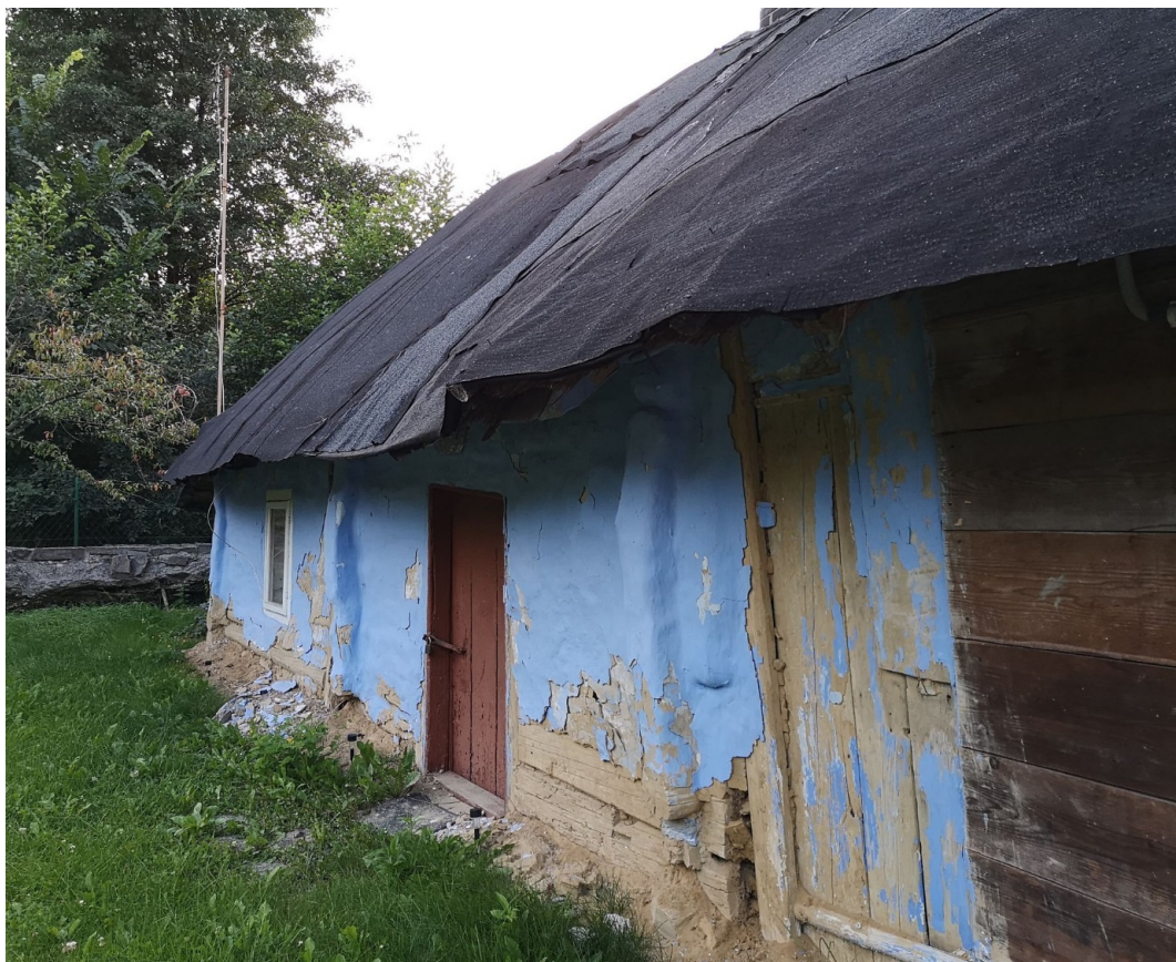
Fot. nr 29.