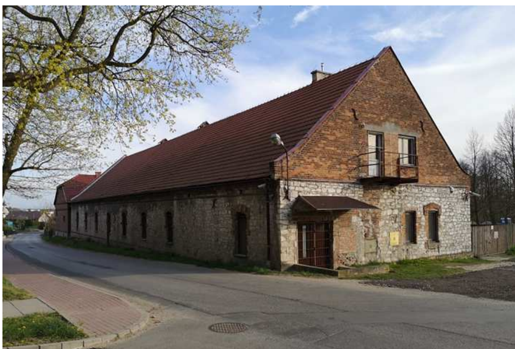
Fot. nr 66. Dworski budynek gospodarczy spod nr 1b.