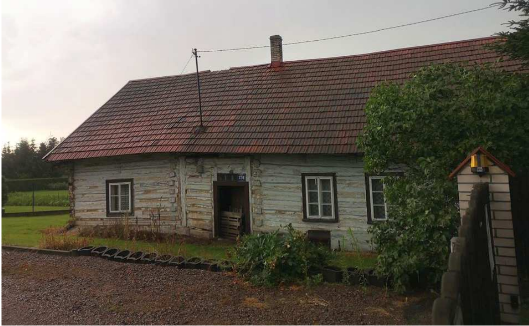
Fot. nr 224.