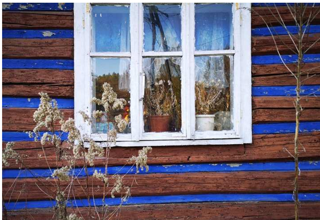
Fot. nr 144. Okno w ścianie szczytowej.