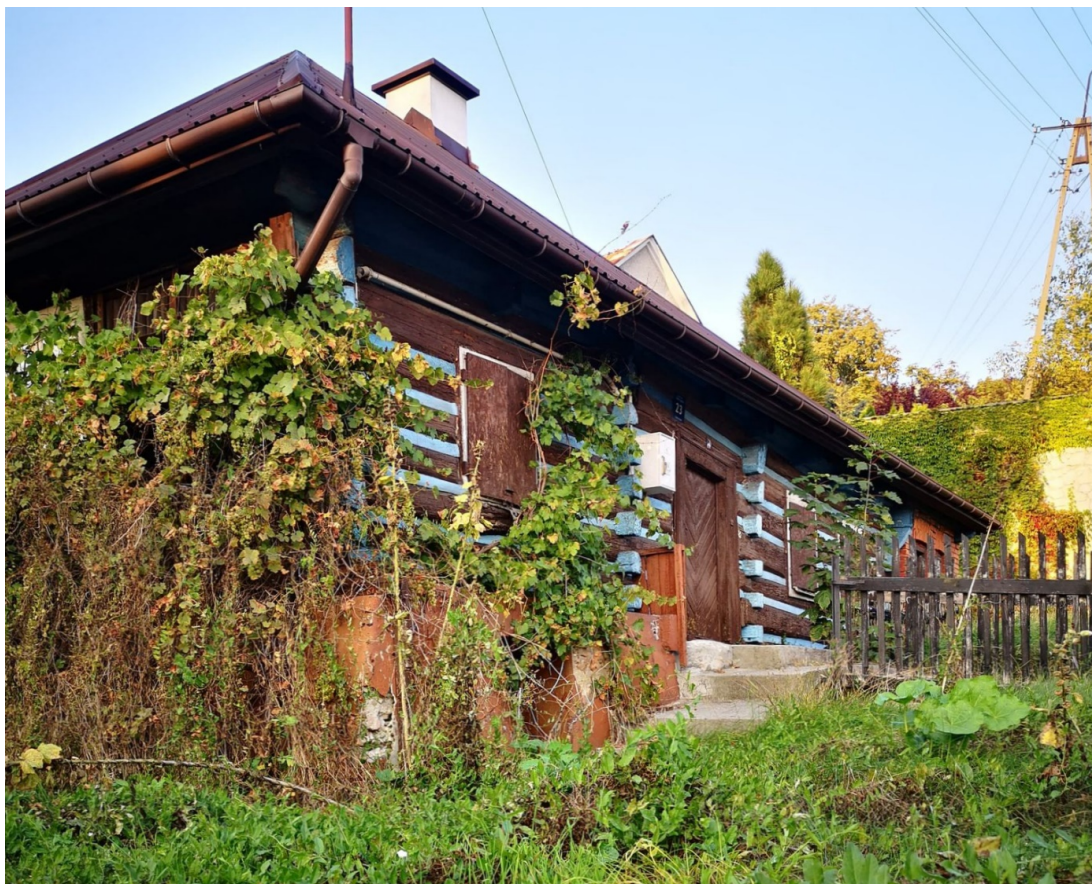
Fot. nr 158.