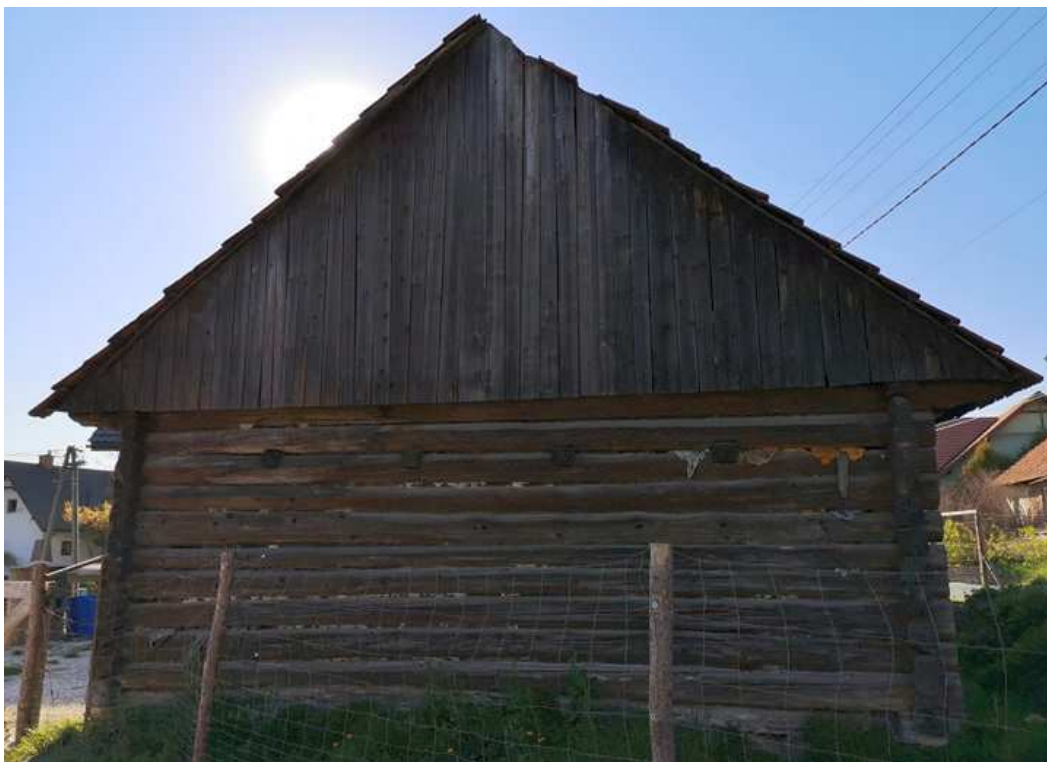
Fot. nr 105. Ściana szczytowa.