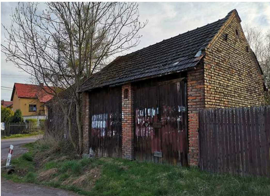
Fot. nr 71. Stodoła na posesji pod nr 90.