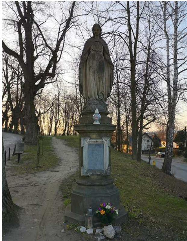
Fot. nr 196. Figura przy drodze do tynieckiego kościoła.