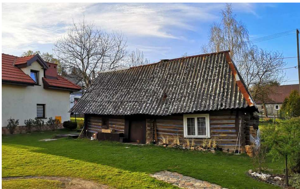
Fot. nr 74. Może nawet XIX-wieczna chatka spod nr 192.