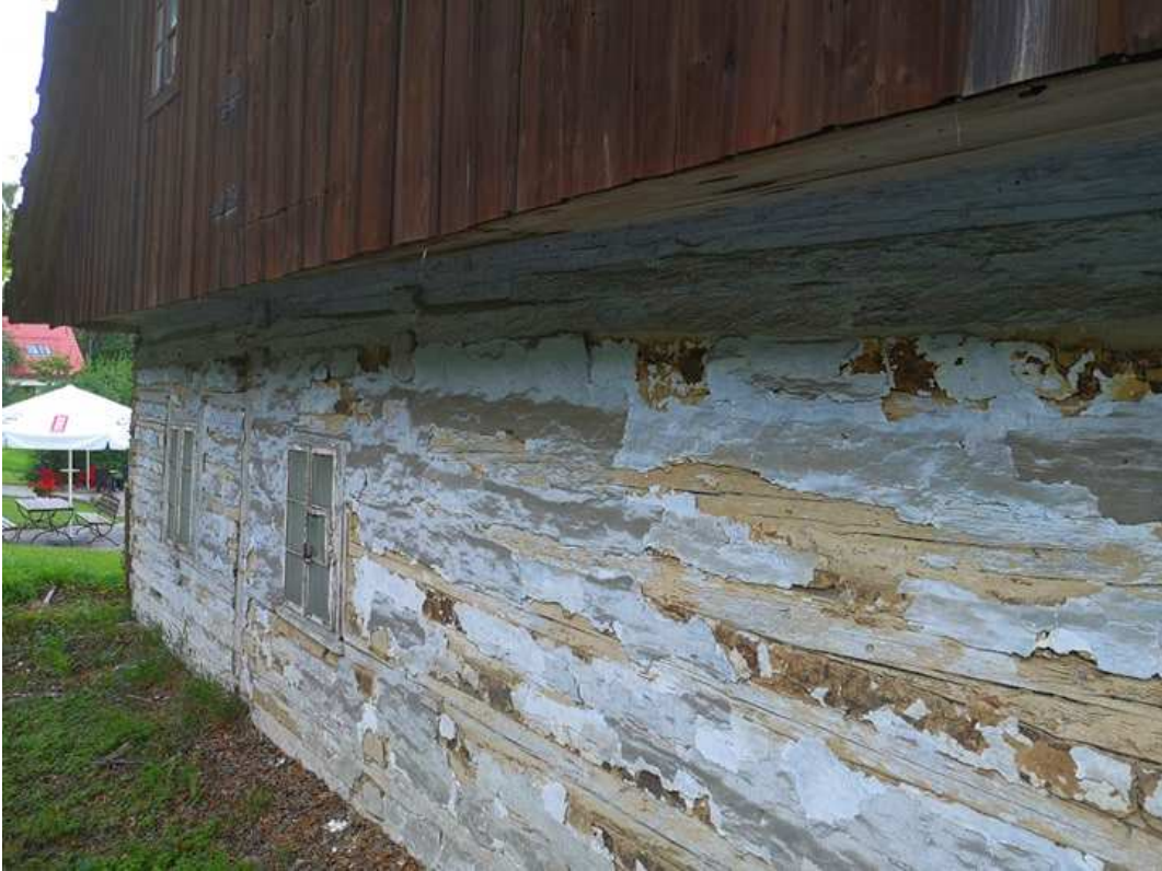
Fot. nr 269.