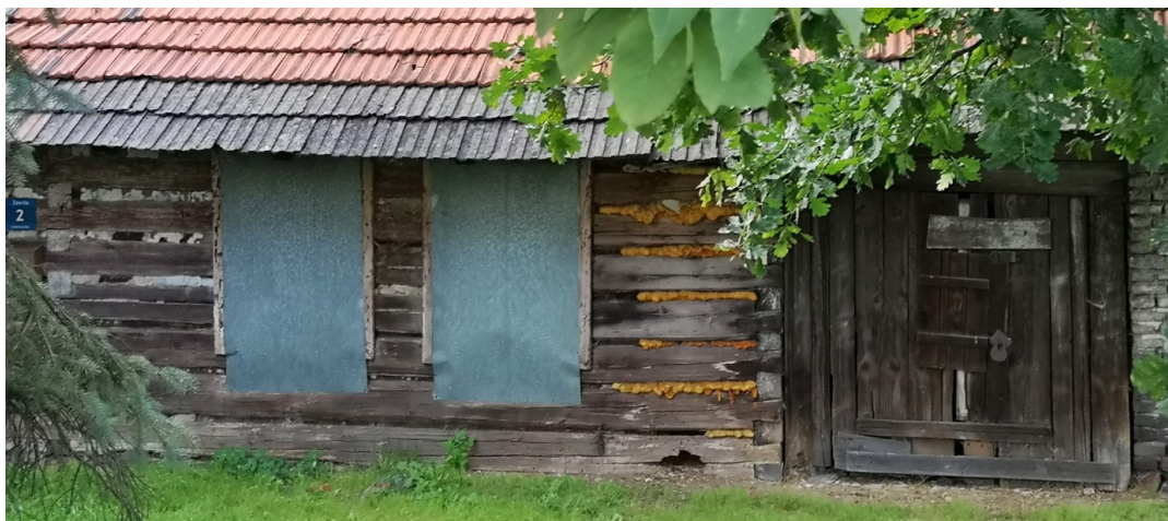
Fot. nr 169.