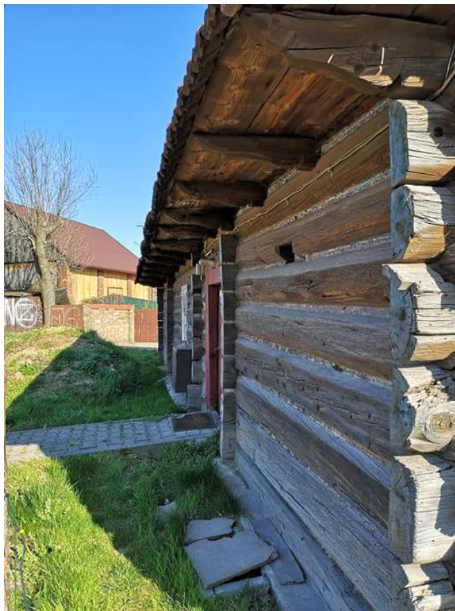
Fot. nr 100 (100-104). Ściana od strony drogi i jej detale.