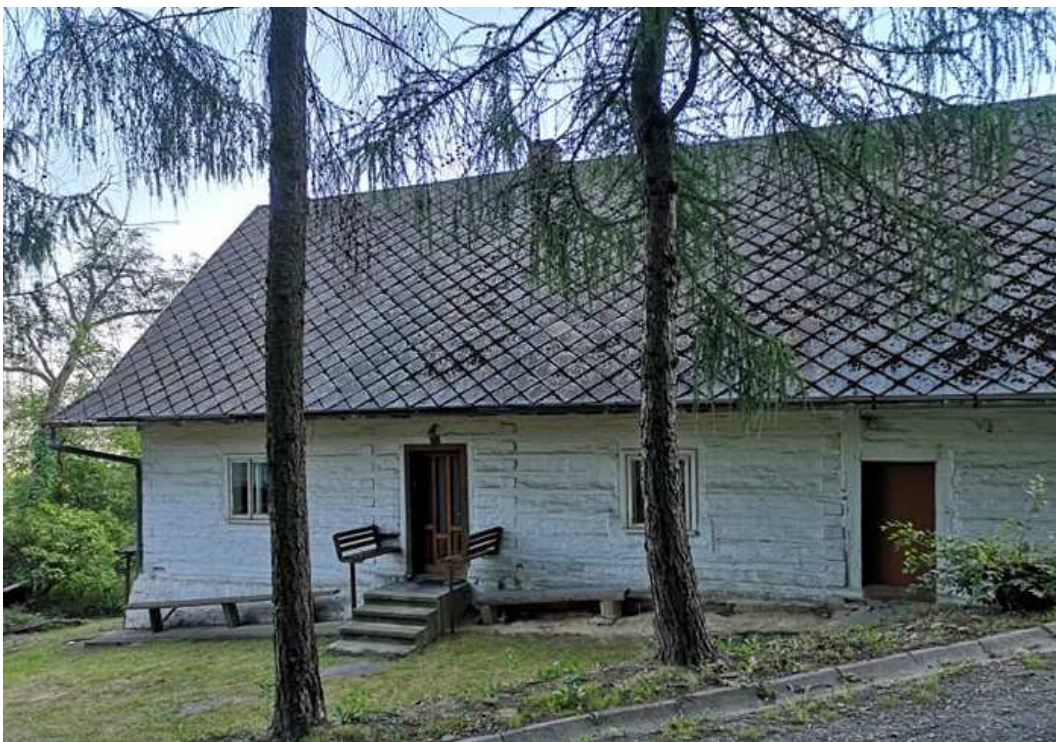
Fot. nr 286. Ściana frontowa.