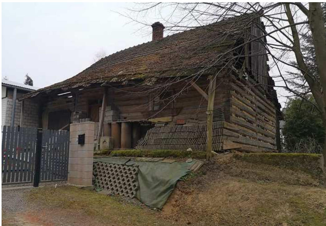
Fot. nr 227. Ruina drewnianej chałupy o nierozpoznanym numerze.