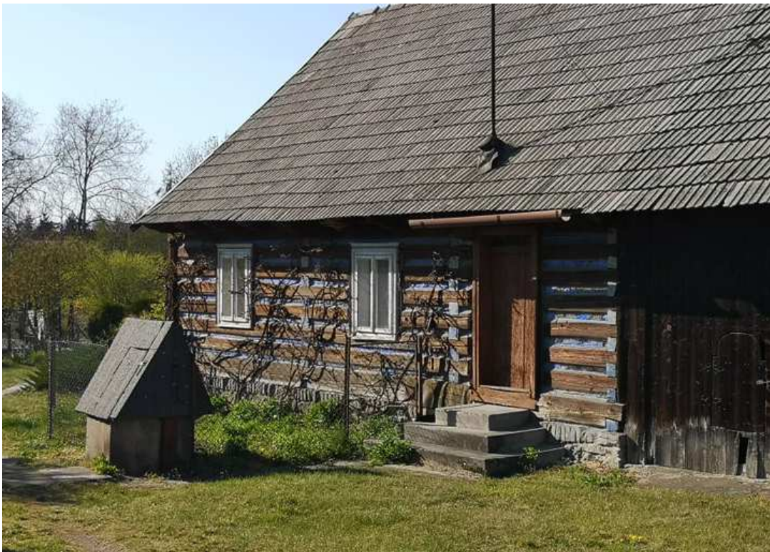
Fot. nr 96. Część mieszkalna.