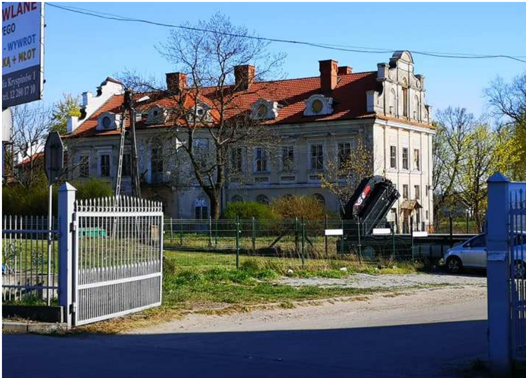
Fot. nr 93 (93-94). Dwór Skirlińskich spod nr 1.