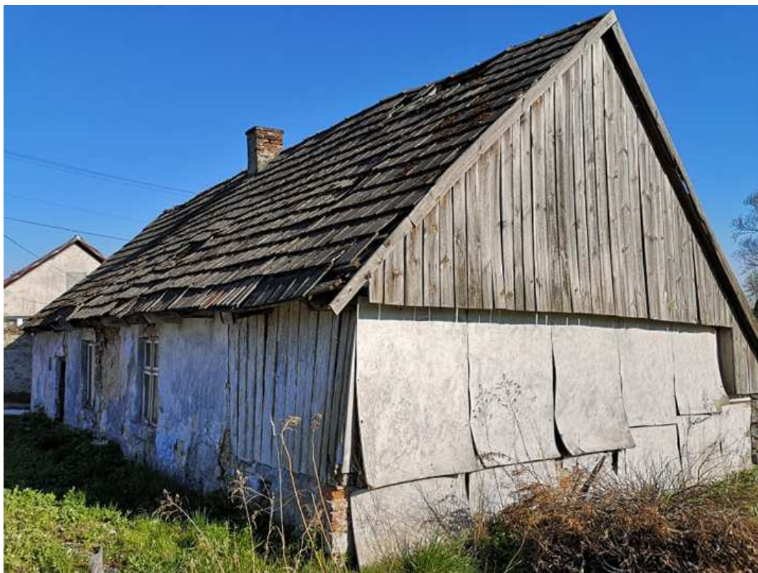
Fot. nr 117 (117-119). Zapewne jeszcze przedwojenny, może już murowany dom pod nr 72.