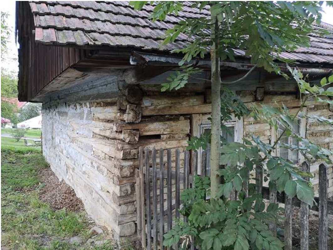
Fot. nr 271.