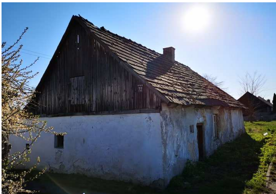
Fot. nr 118.