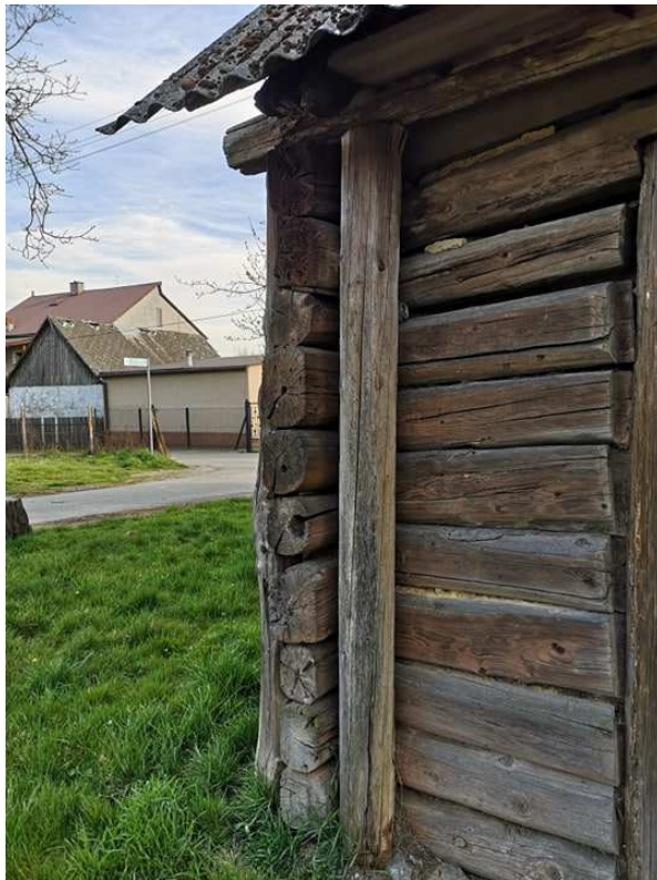
Fot. nr 52.