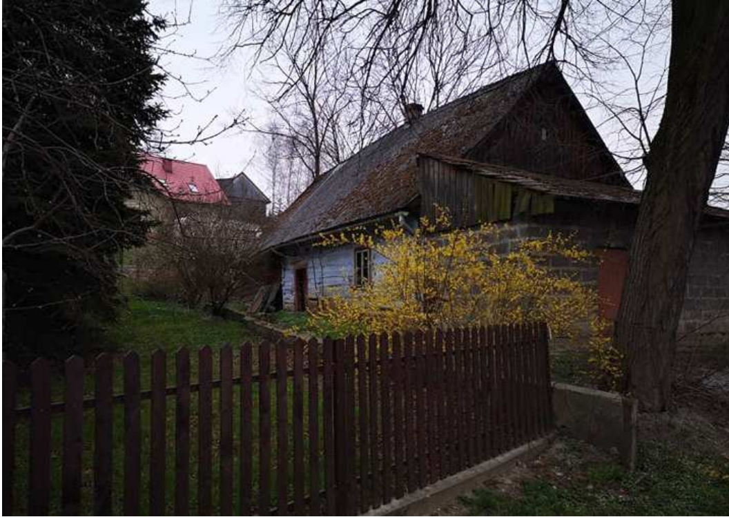
Fot. nr 218.