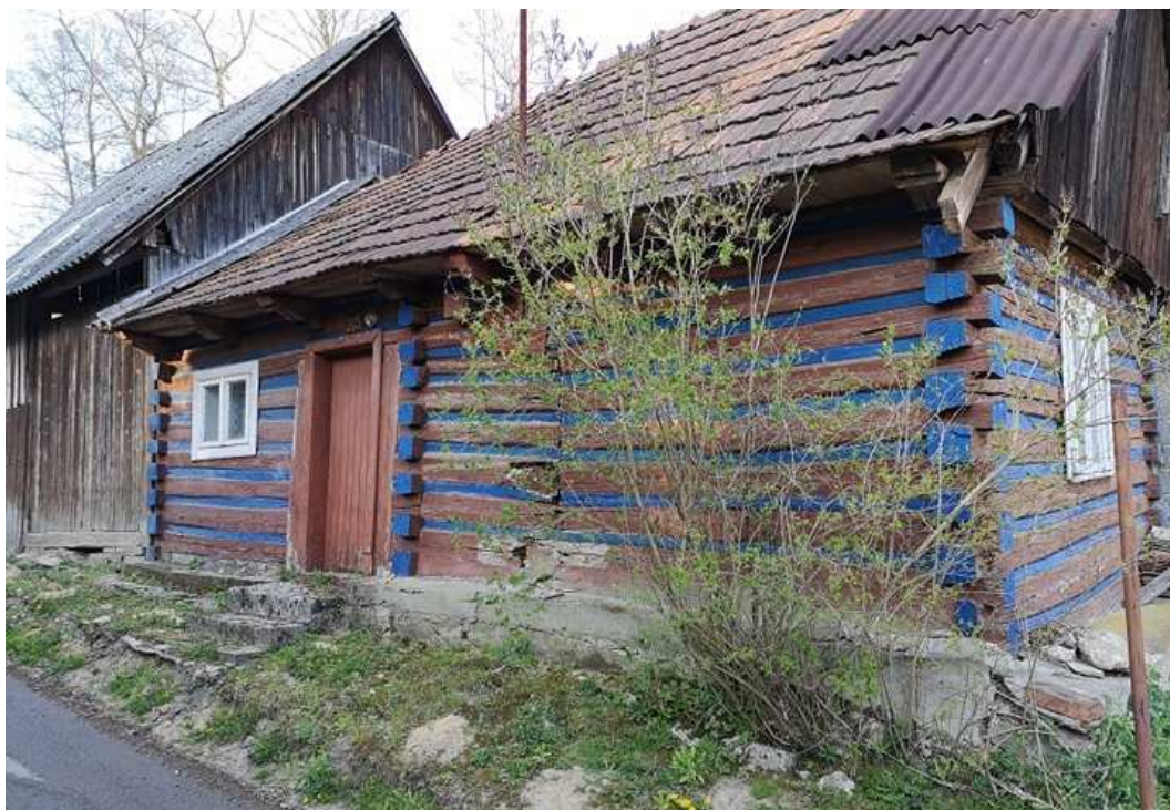
Fot. nr 146.