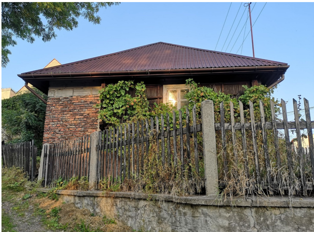
Fot. nr 159. Boczna ściana szczytowa.