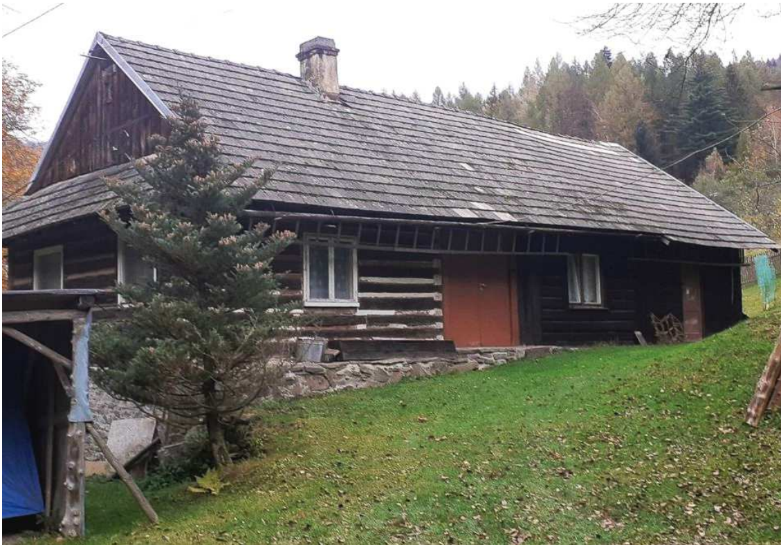
Fot. nr 328 (328-329). Chałupa z dachem okapowym z ulicy Jagódki, która nie ma już oryginalnych okien.