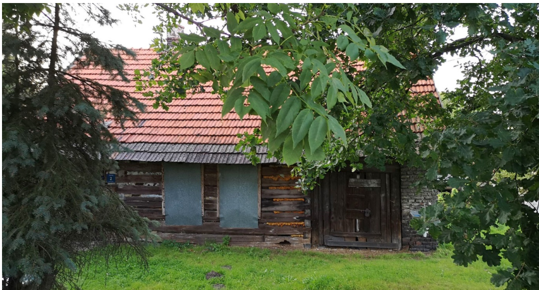
Fot. nr 168 (168-169). Chałupa spod nr 2, usytuowana w sąsiedztwie kaplicy.