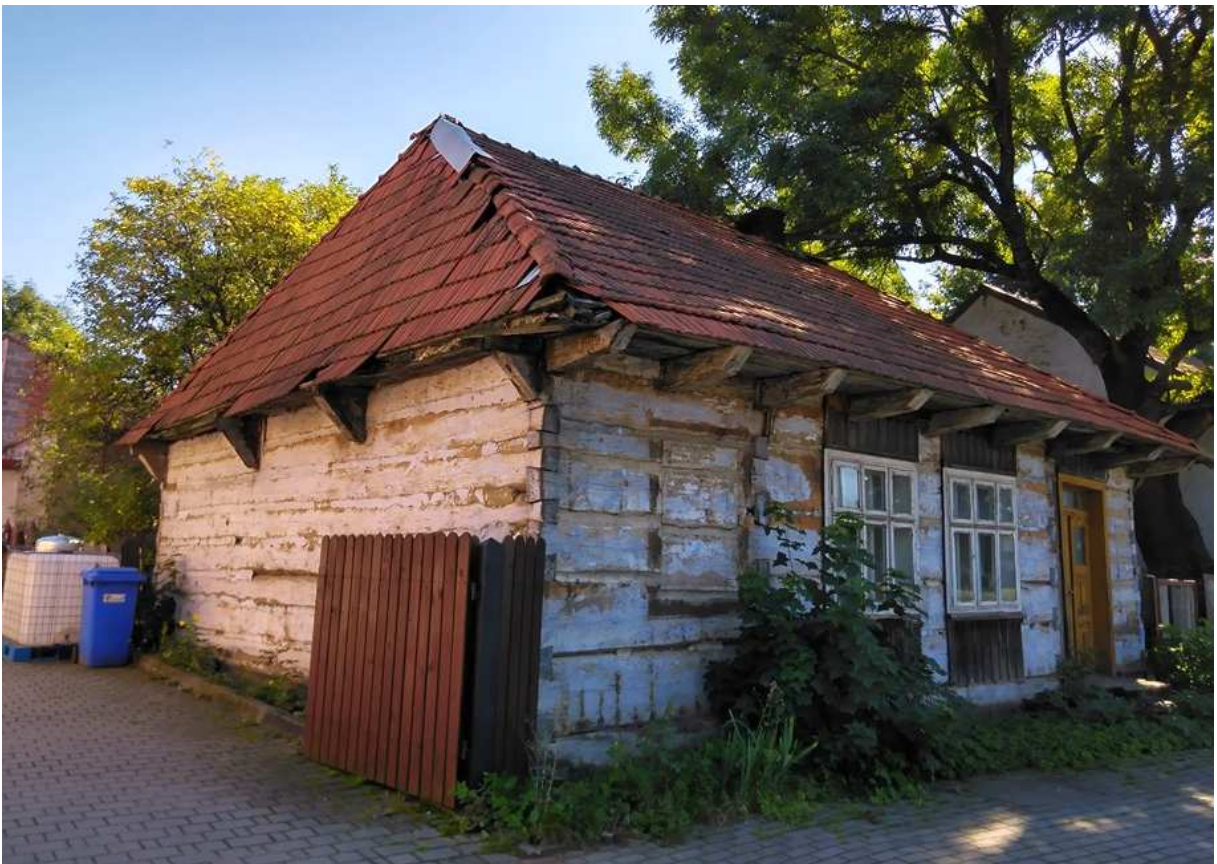
Fot. nr 313. Przebudowany z chałupy dom spod nr 72.