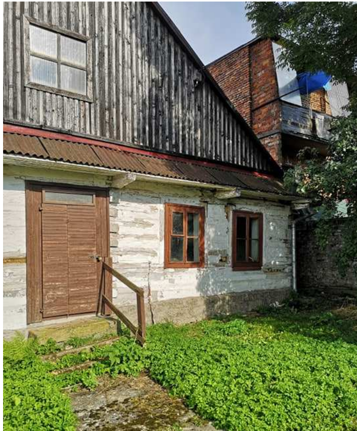
Fot. nr 243.