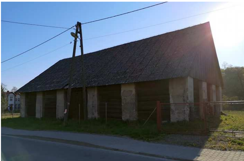
Fot. nr 129. Może już powojenna stodoła naprzeciw posesji pod nr 50.