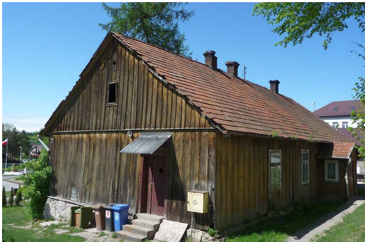
Fot. nr303) .