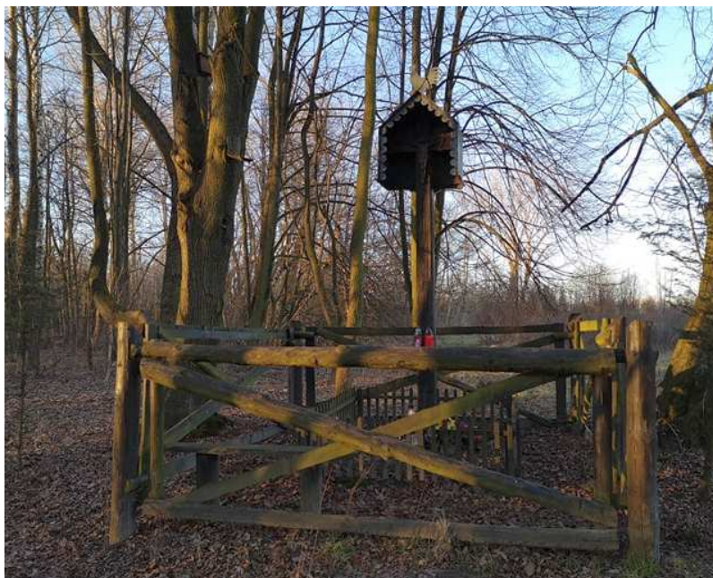
Fot. nr 17 (17-18). Kapliczka typu szafkowego o nieustalonej lokalizacji.