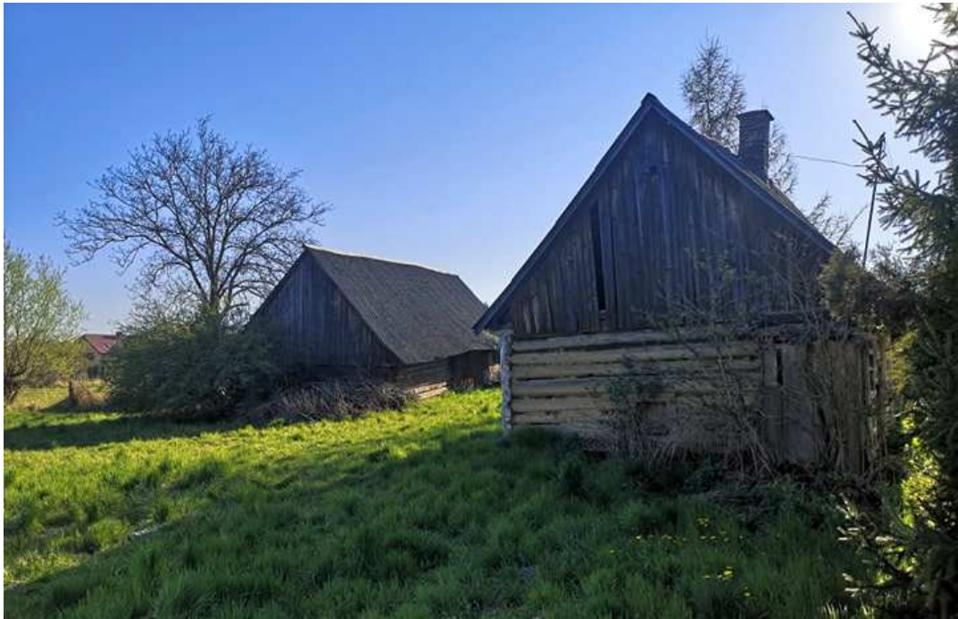
Fot. nr 135 (135-136). Zagroda o nieustalonej lokalizacji.