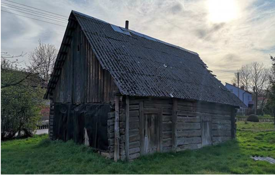
Fot. nr 51 (51-55). Ściana szczytowa i tylna część chałupy.