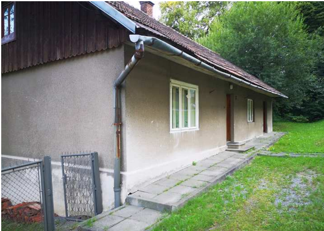
Fot. nr 262.