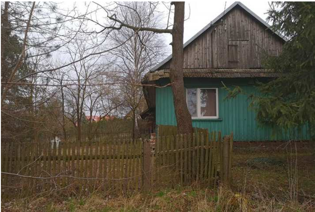
Fot. nr 229.