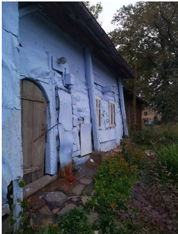
Fot. nr 290. Fasada chałupy.