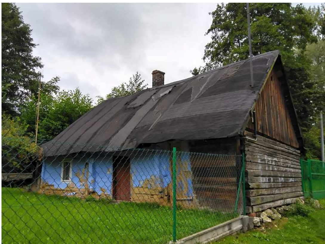
Fot. nr 293 (293-296). Chałupa przy wejściu do Dolinki przy ulicy Turystycznej 10A.