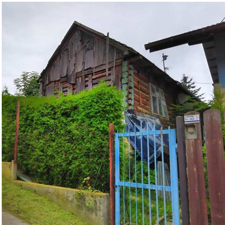
Fot. nr 300. Zapewne niespełna 100-letni dom o nieustalonej lokalizacji.