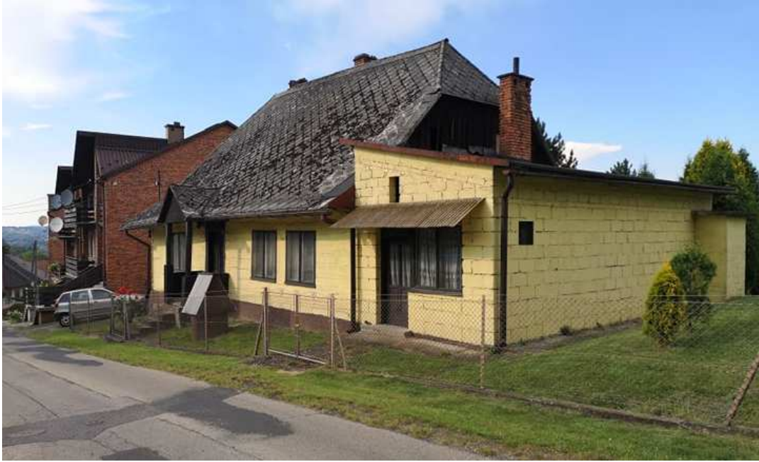
Fot. nr 251.