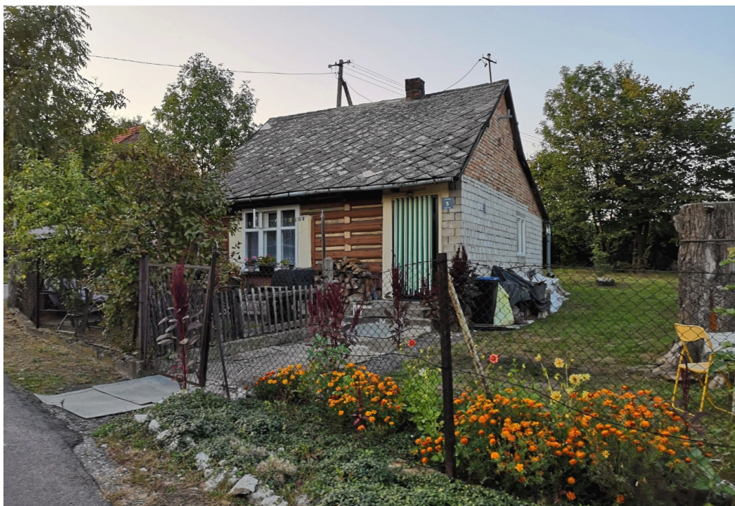
Fot. nr 170. Dom z ulicy Zawilej 5.