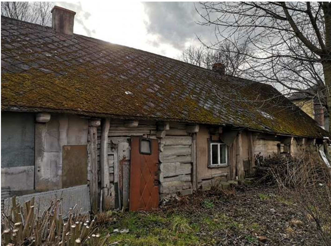
Fot. nr 8 (8-9). Ściana frontowa.