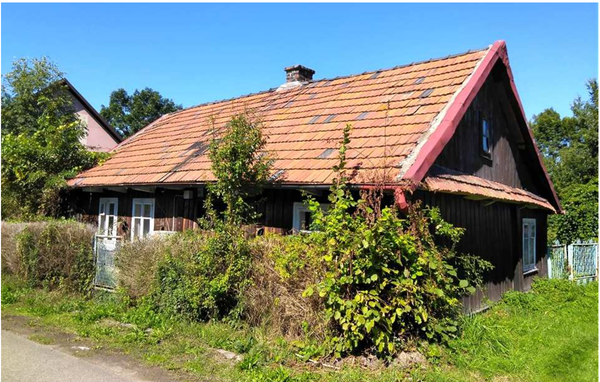
Fot. nr 311. Zapewne ponad 100-letnia chałupa z dachem okapowym spod nr 236.