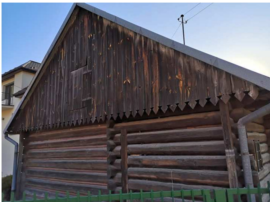
Fot. nr 140. Ściana szczytowa.