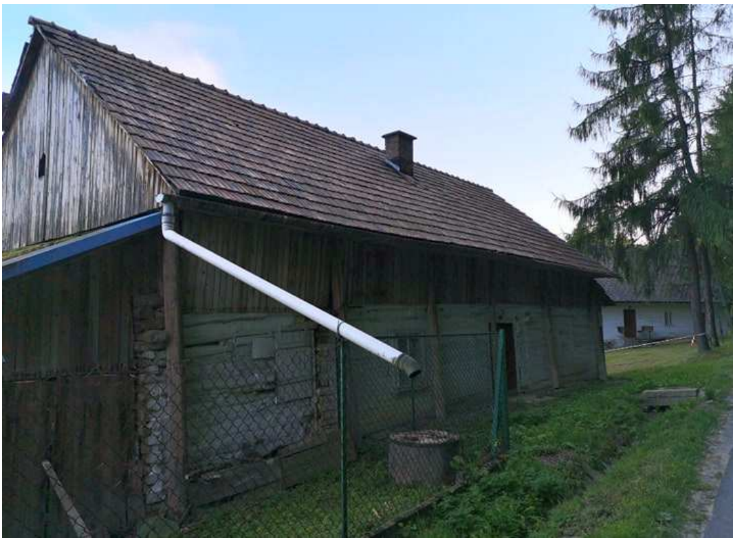
Fot. nr 280 (280-283). Ściana frontowa chałupy i jej detale.