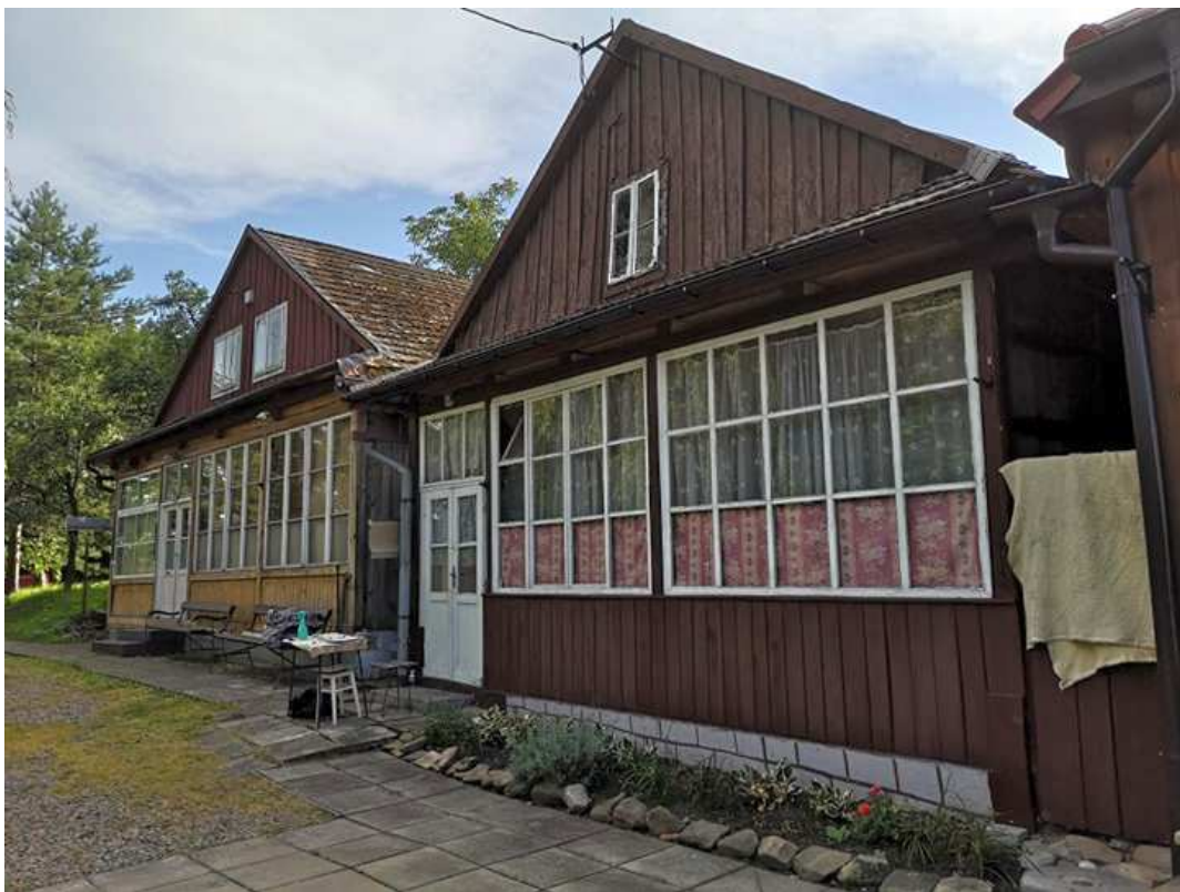
Fot. nr 260. Szczytowe ściany domów pod nr: 32-34.