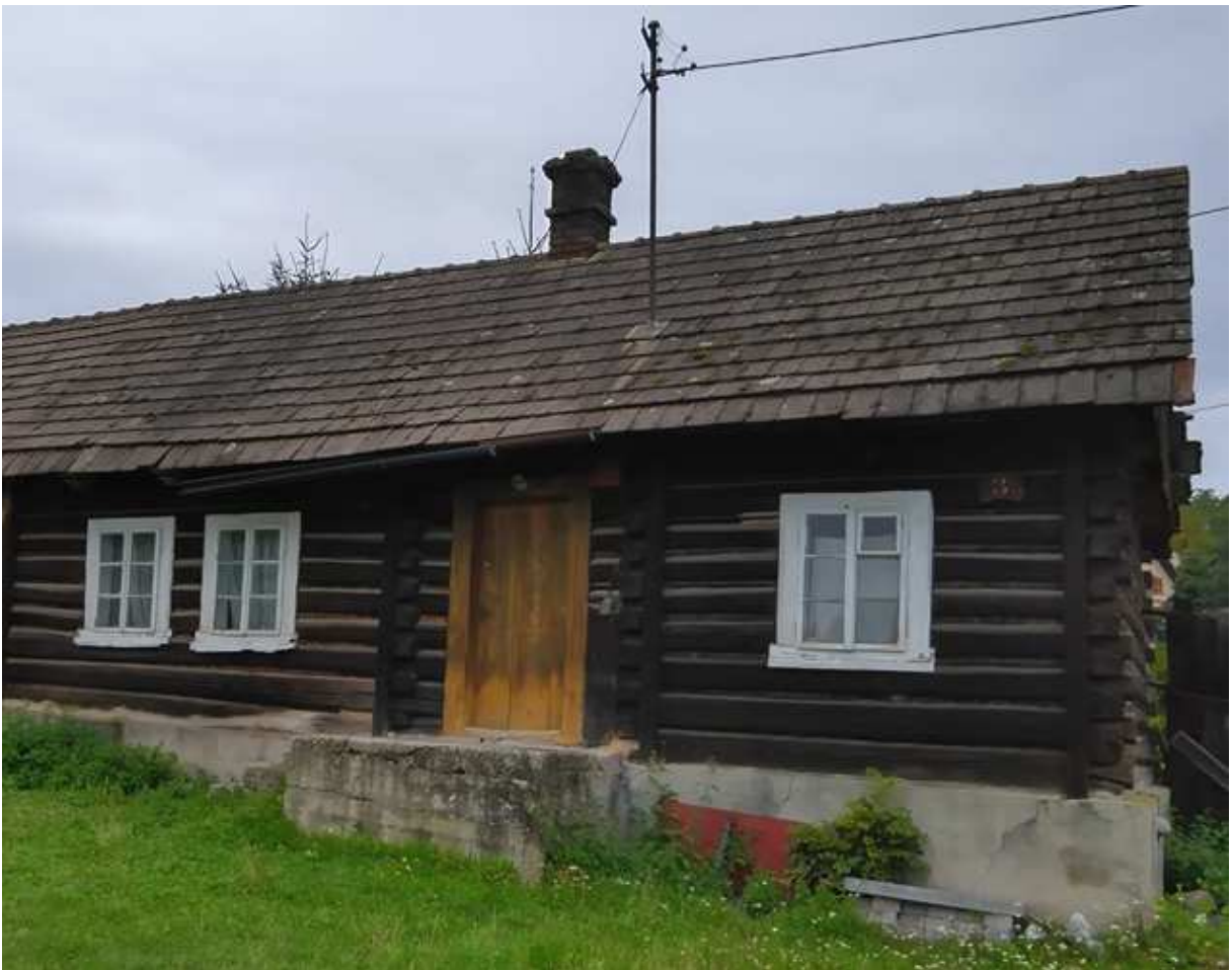
Fot. nr 298. Zapewne półtoratraktowa chałupa.