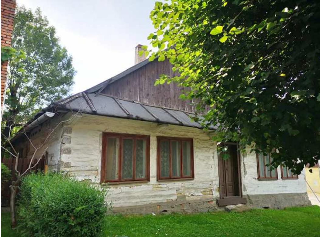
Fot. nr 239.