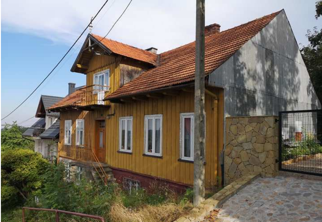
Fot. nr 253.