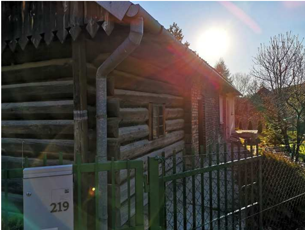
Fot. nr 141 (141-142). Front od strony ulicy.