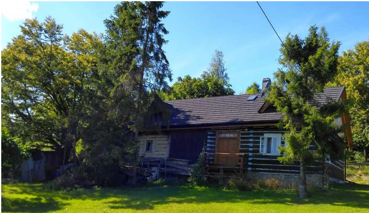
Fot. nr 321. Ujęcie od strony podwórka.