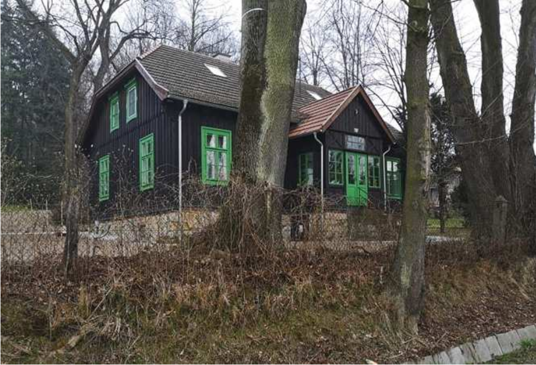
Fot. nr: 222-227. Wzdłuż ulicy Podlesie. Fot. nr 222. Willa z oszklonym gankiem spod nr 123 (na tabliczce 43), która mogła powstać na przełomie lat 20/30 XX wieku.