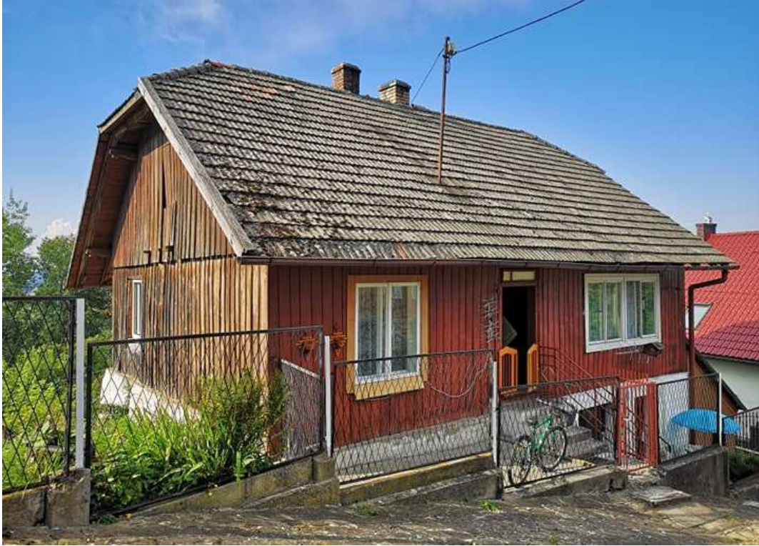
Fot. nr 255.