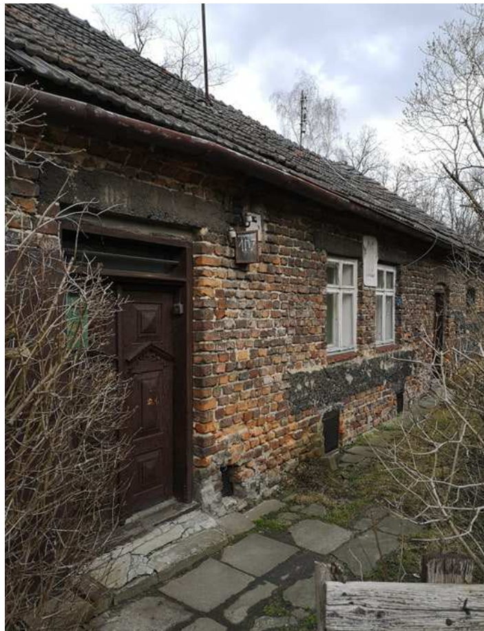
Fot. nr 4 (4-5). Zapewne blisko 100-letni dom murowany z ulicy Zarzecze 107.