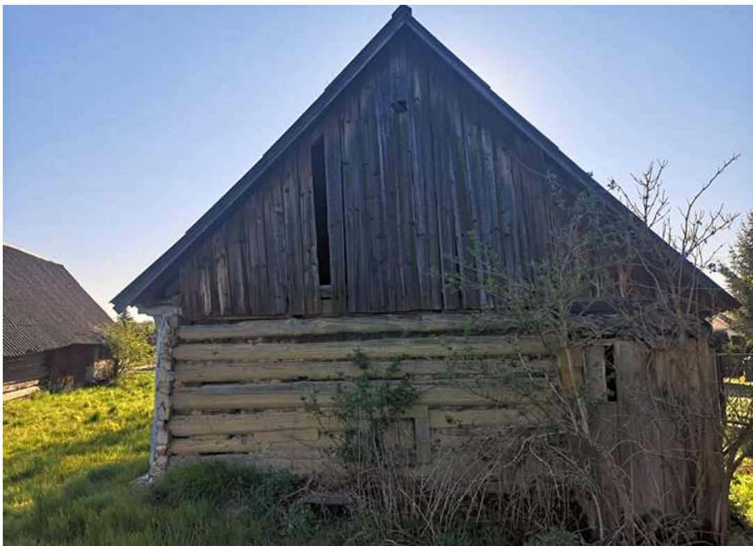
Fot. nr 136. Ściana szczytowa chałupy.