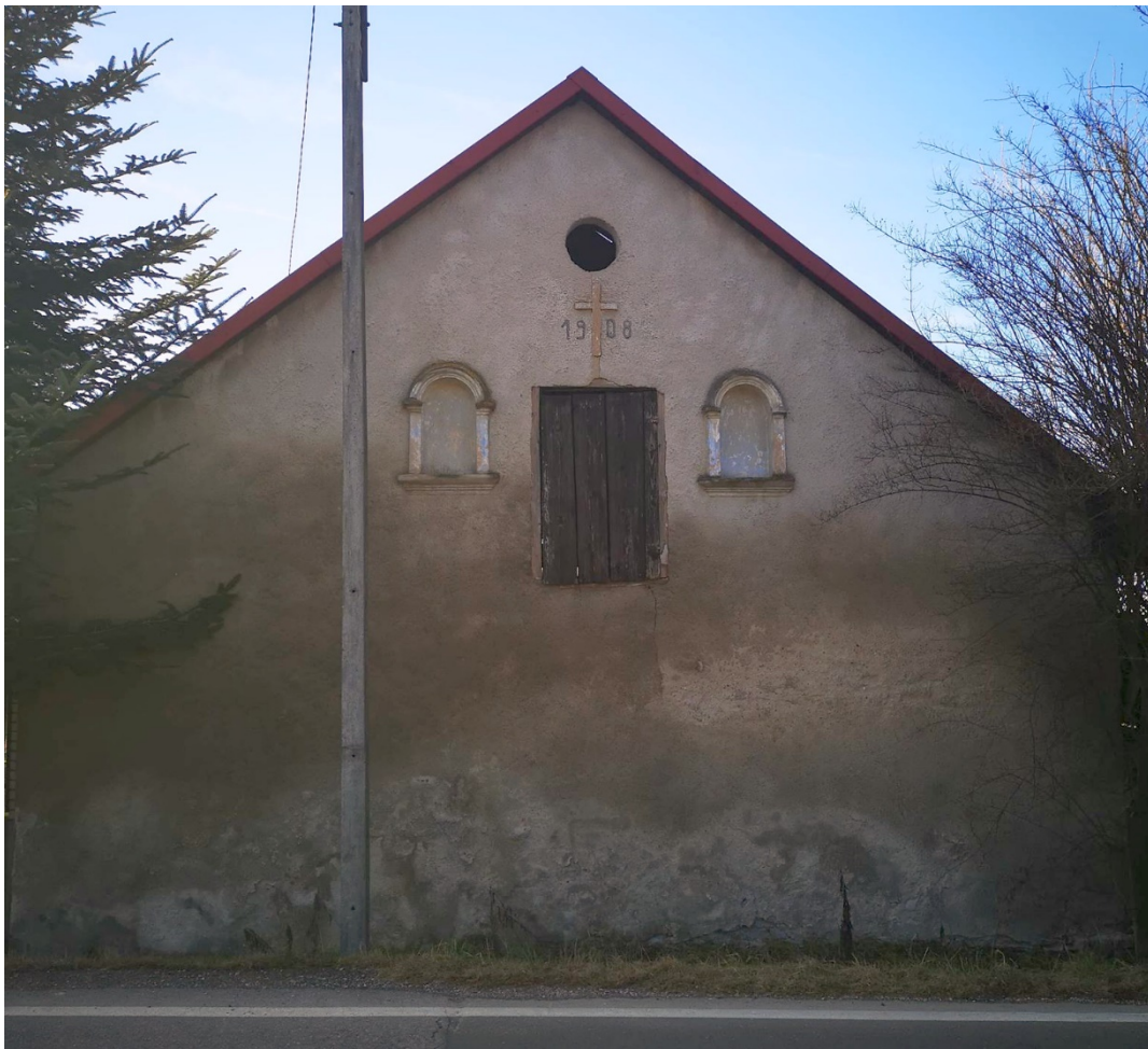
Fot. nr 225. Ściana boczna z datą powstania – 1908.