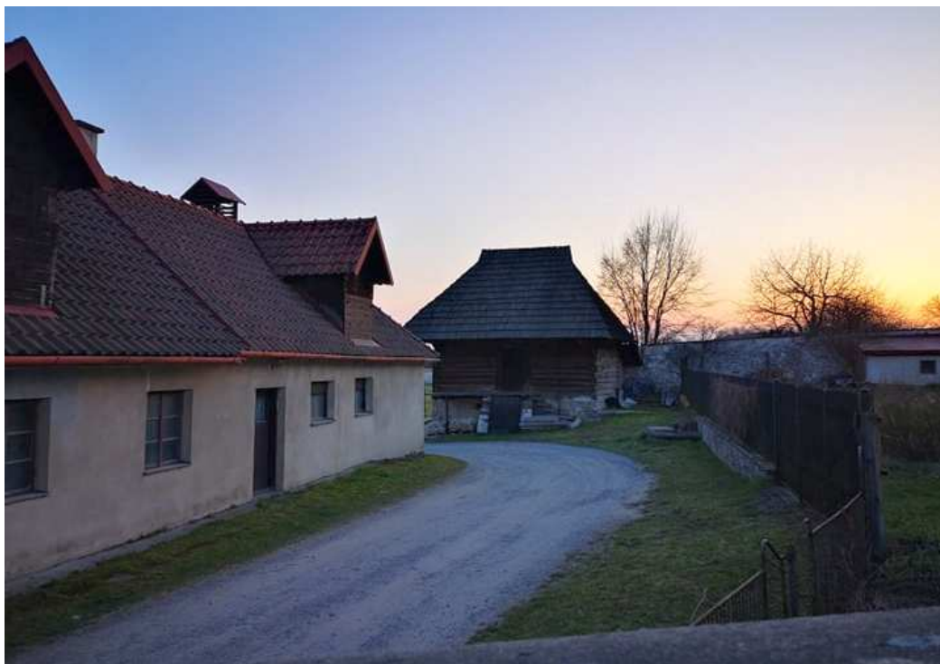
Fot. nr 186 (186-187). Spichlerz z przełomu XVIII i XIX wieku.