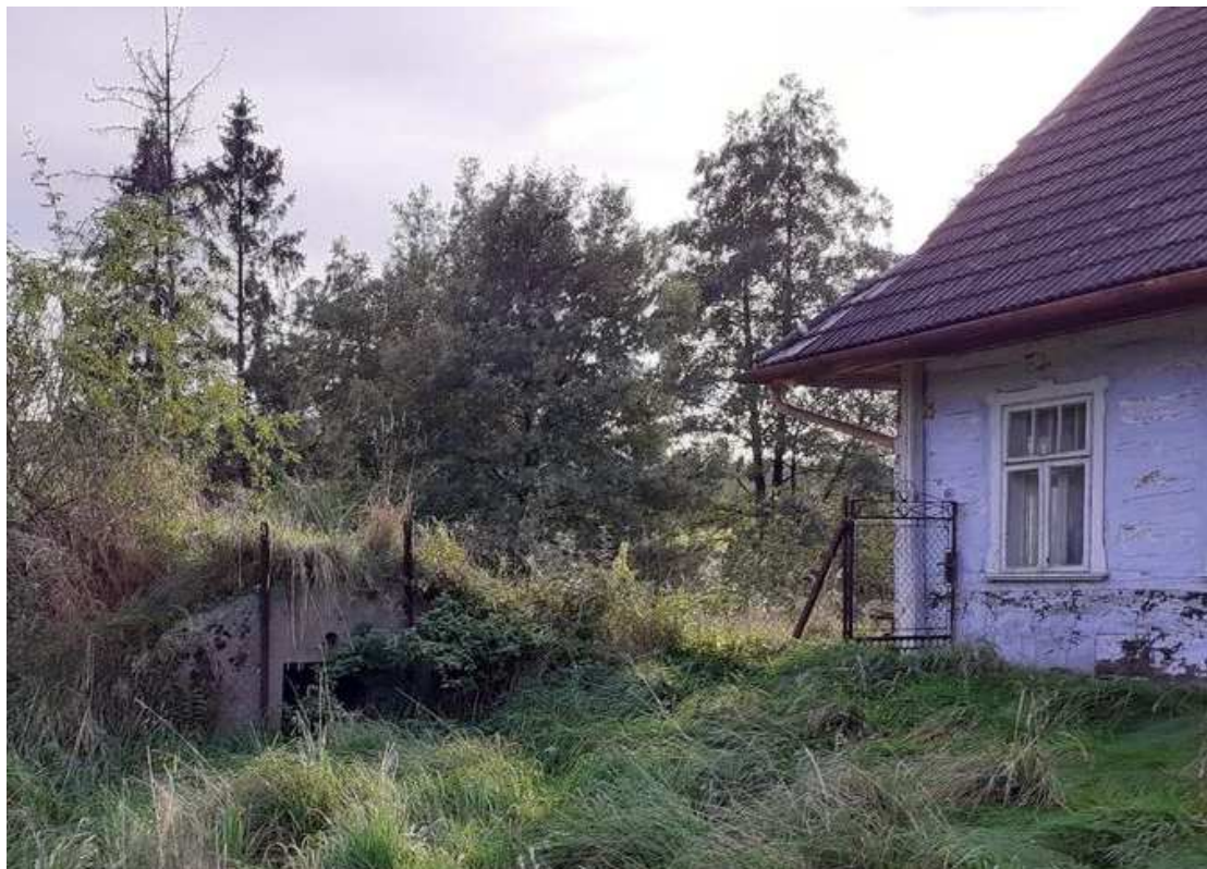
Fot. nr 325.