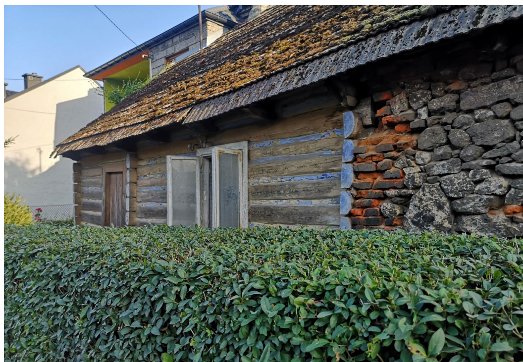
Fot. nr 173 (173-174). Oryginalne drzwi i nieco późniejsze okno.