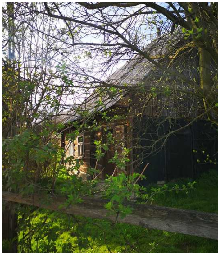
Fot. nr 44.