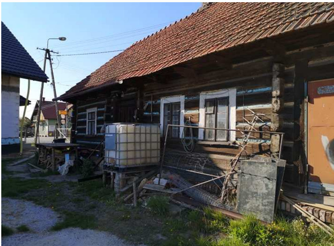
Fot. nr 107.