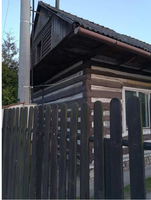
Fot. nr 178.