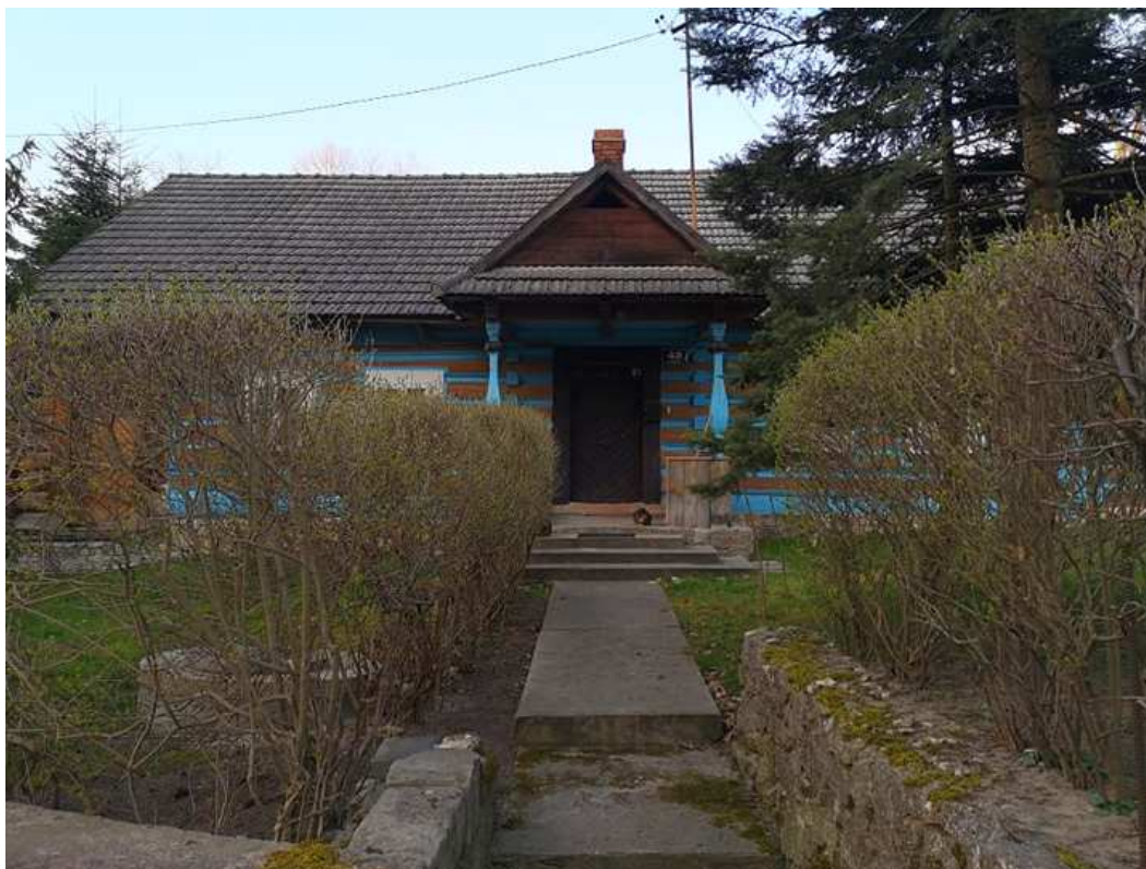
Fot. nr 194.