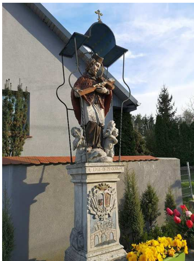
Fot. nr 78 (78-80). Kapliczka słupowa z figurą św. Jana Nepomucena.