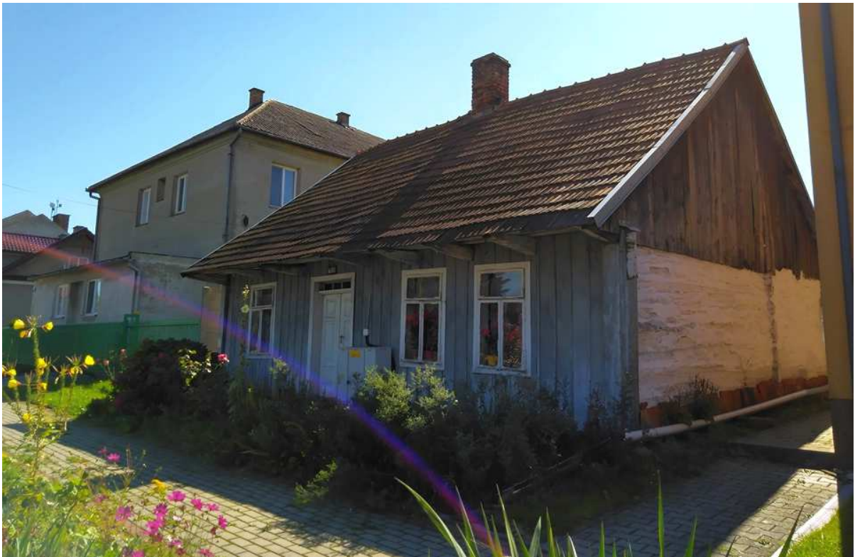
Fot. nr 308. Przebudowana w latach 30. dawna chałupa spod nr 180.