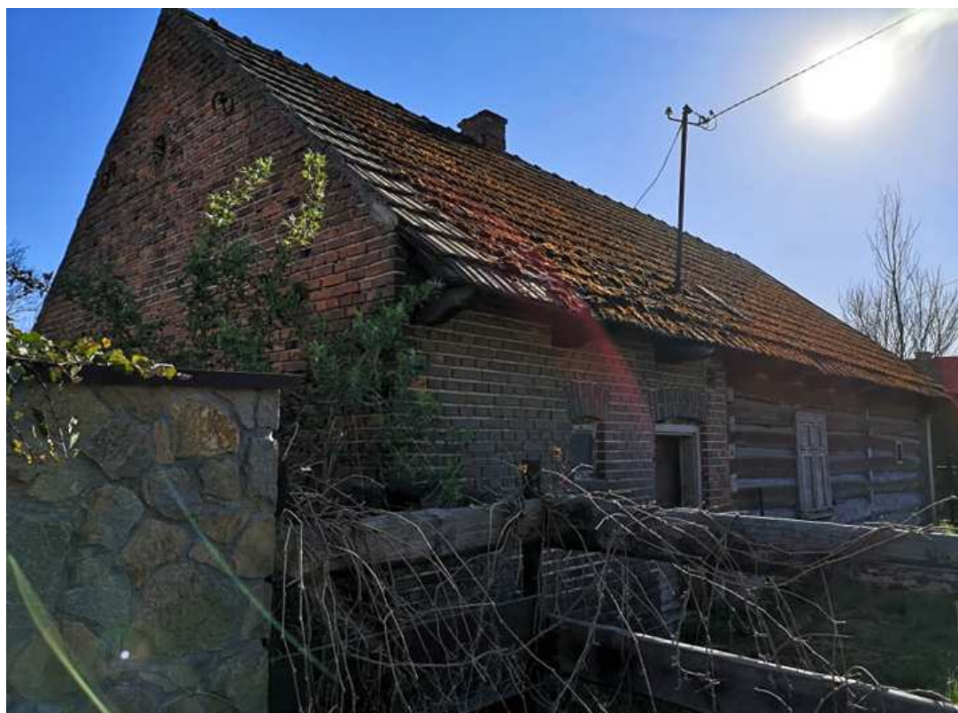
Fot. nr 112 (112-115). Drewniana chałupa z dobudowaną do niej z cegły stajnią o nieustalonej lokalizacji.