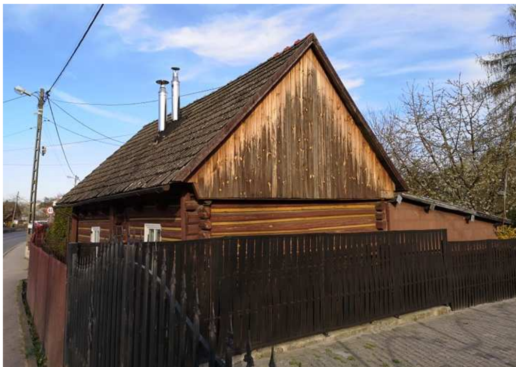
Fot. nr 62 (62-63). Bliska oryginałowi, ponad 100-letnia chałupa pod nr 20.