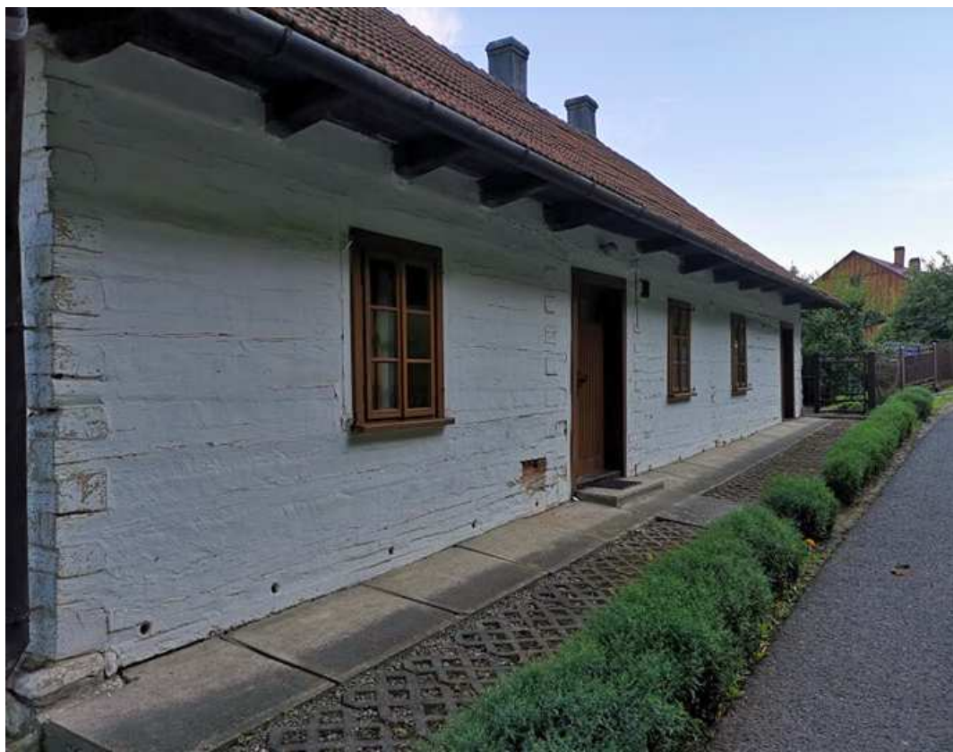
Fot. nr 276 (276-277). Ściana frontowa od strony ulicy.