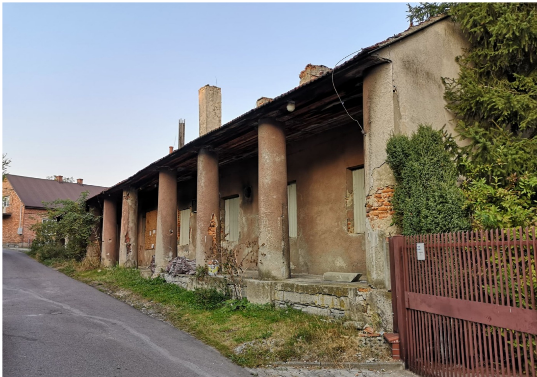
Fot. nr 162.