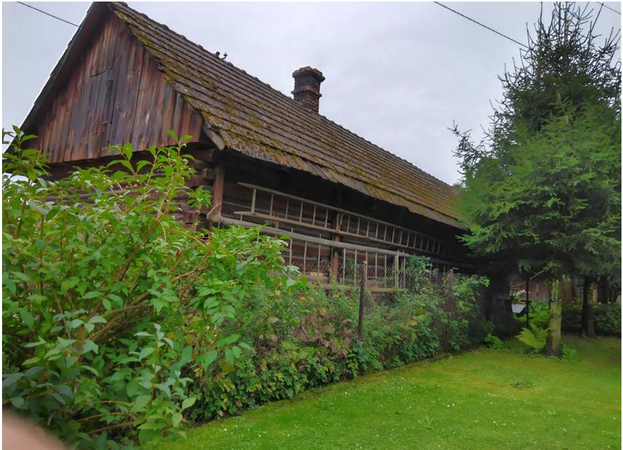
Fot. nr 299.