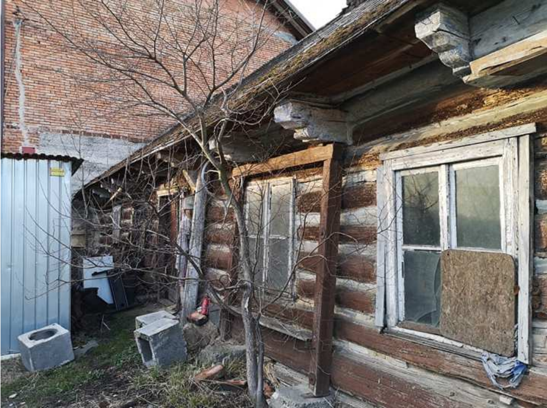
Fot. nr 25.