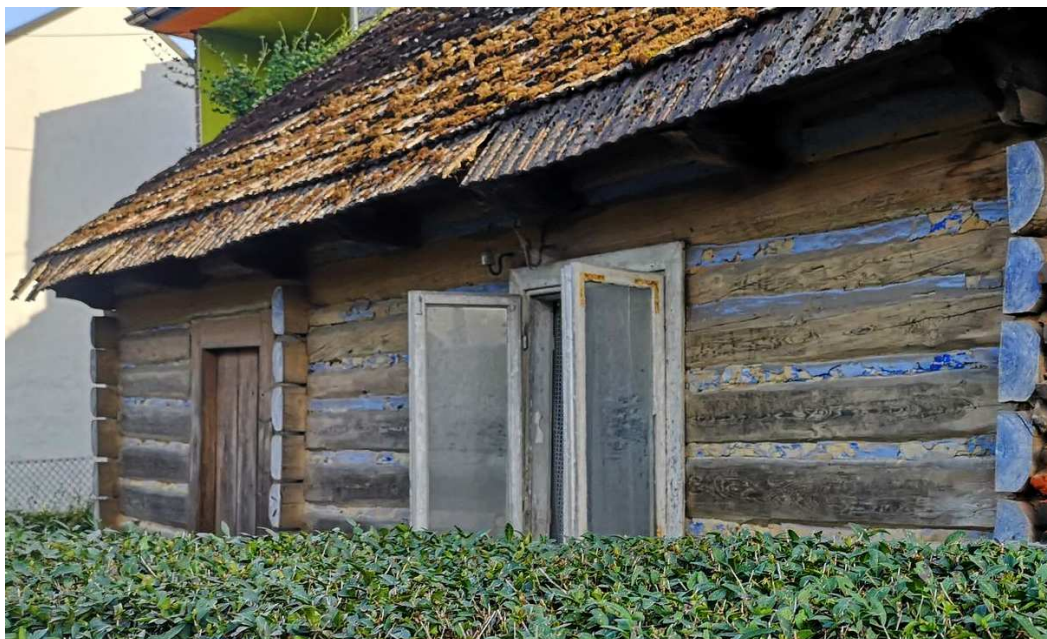
Fot. nr 174.