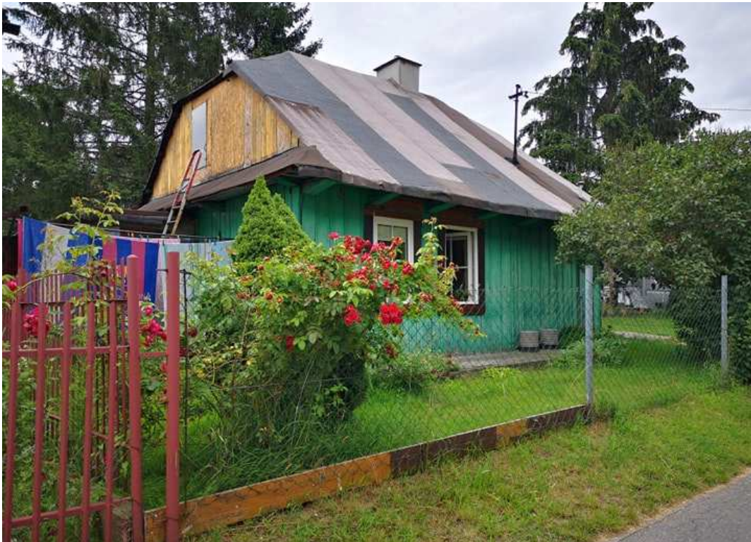
Fot. nr 205. Zapewne około 100-letni dom o podobnych cechach jak dwa poprzednie, którego lokalizacji też nie ustaliłem.