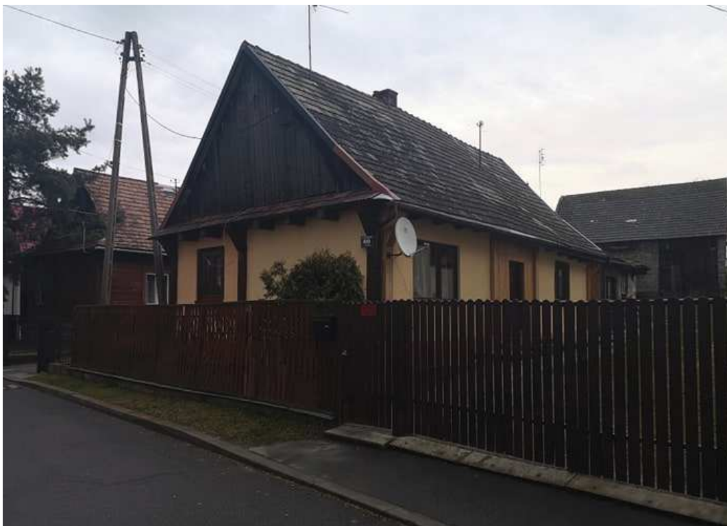
Fot. nr 85 (85-86). Dom przy ulicy Majówny 40, w którym drewniana faktura została ukryta pod tynkiem.