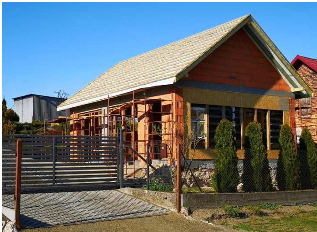
Fot. nr 121 (121-122). Jak współczesny dom wchłania dawny drewniany oryginał.