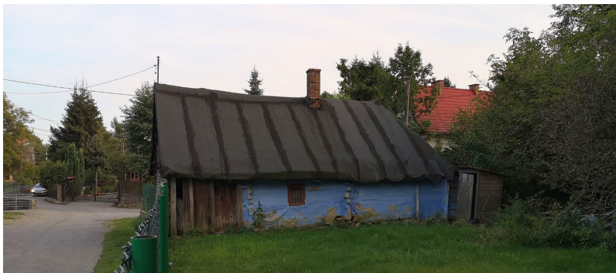
Fot. nr 27 (27-30). Chałupa z ulicy Turystycznej 10A, wybudowana ok. 1885 i jej detale.