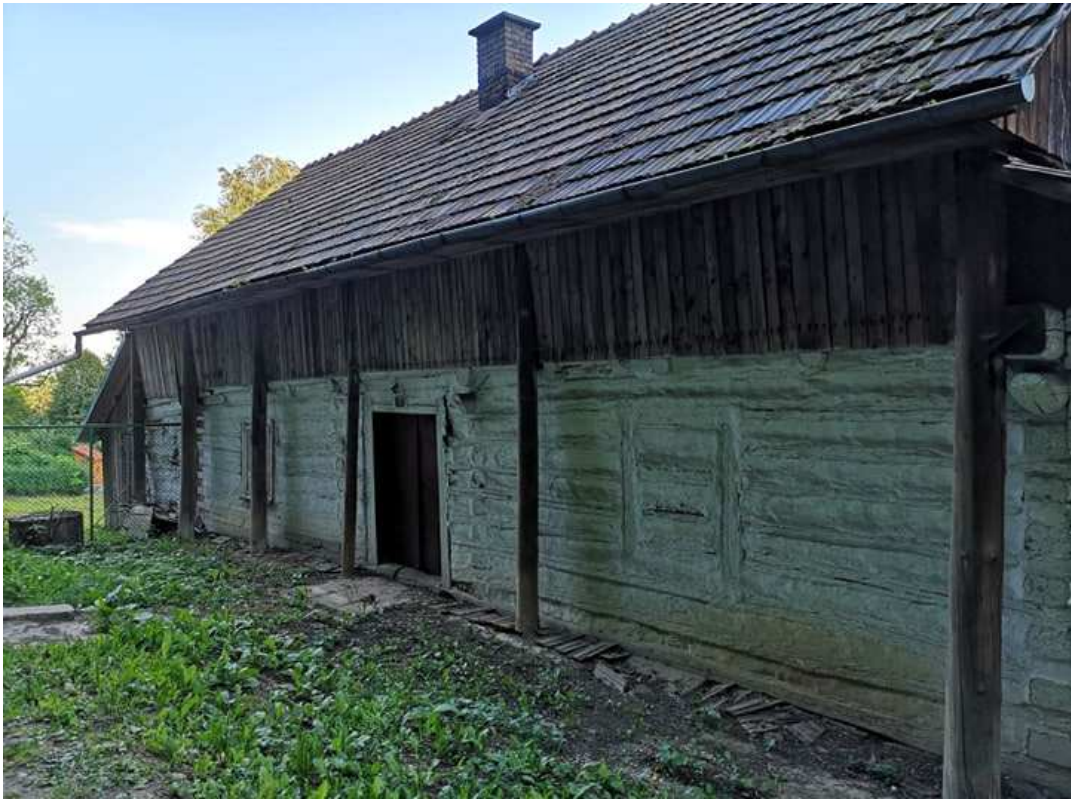
Fot. nr 283.