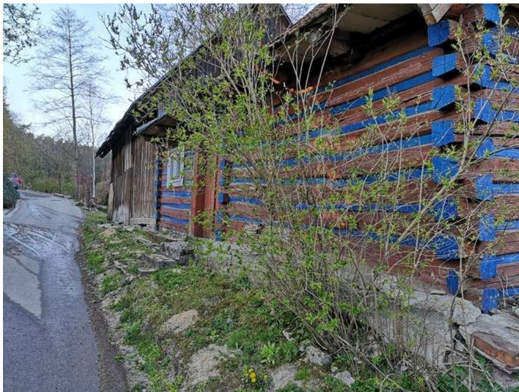
Fot. nr 145 (145-149). Ściana frontowa i jej detale.