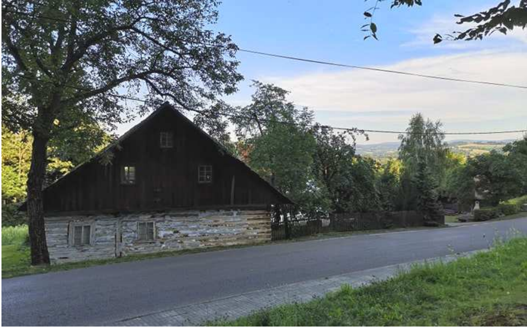
Fot. nr 267 (267-274). Rozległa, zapewne XIX wieczna chałupa pod nr 5.