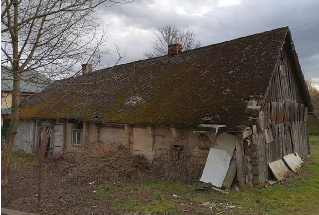
Fot. nr 7 (7-11). Kilka ujęć jednej z najstarszych chałup na terenie Krakowa, z ulicy Na Błonie spod nr 27, wybudowanej w roku 1838.