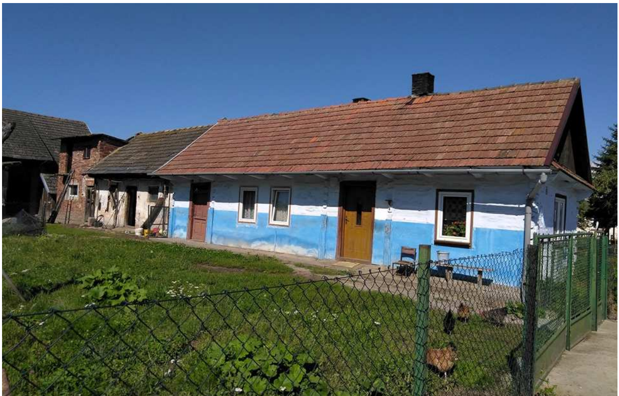
Fot. nr 315. Współcześnie przebudowany dom w zagrodzie pod nr 229.