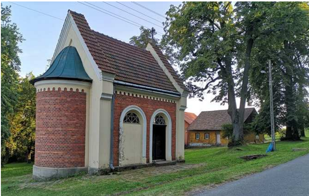
Fot. nr 288. Eklektyczna kapliczka pomiędzy zabudową o numerach: 23 i 27.