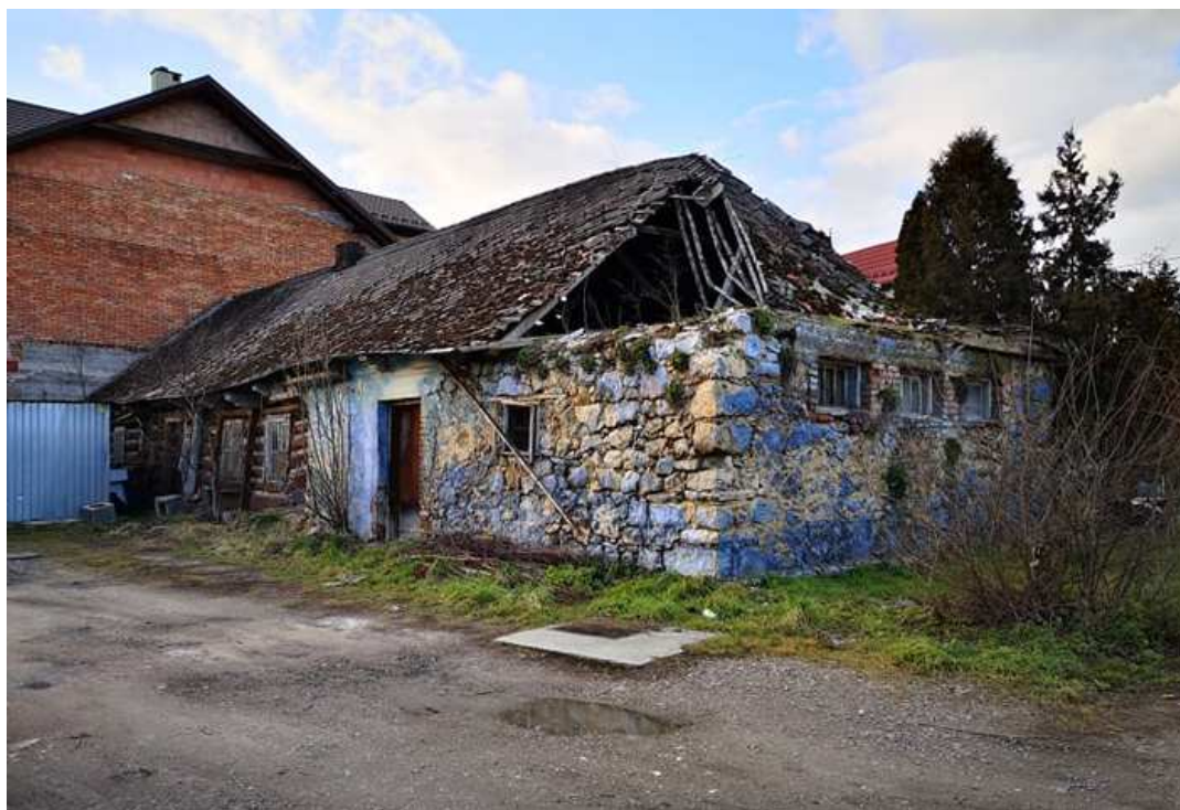
Fot. nr 23 (23-26). Najstarsza chałupa na obrzeżach Krakowa z ulicy Zakliki z Mydlnik 4, która została wybudowana w roku 1821. Przylegająca do niej stajnia powstała w czasie okupacji. Czy po wielu bojach trafi do skansenu bądź zostanie odnowiona „in situ”?