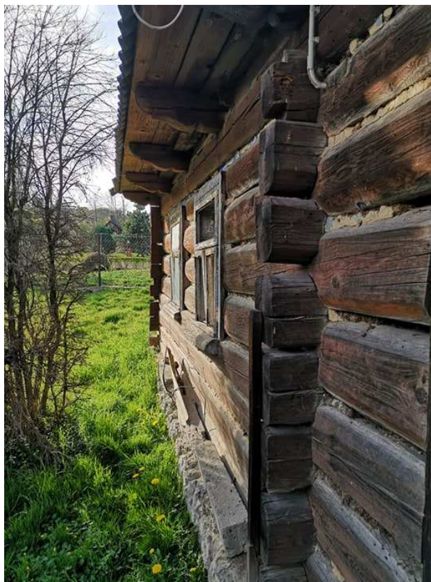
Fot. nr 45 (45-46). Okna w fasadzie.