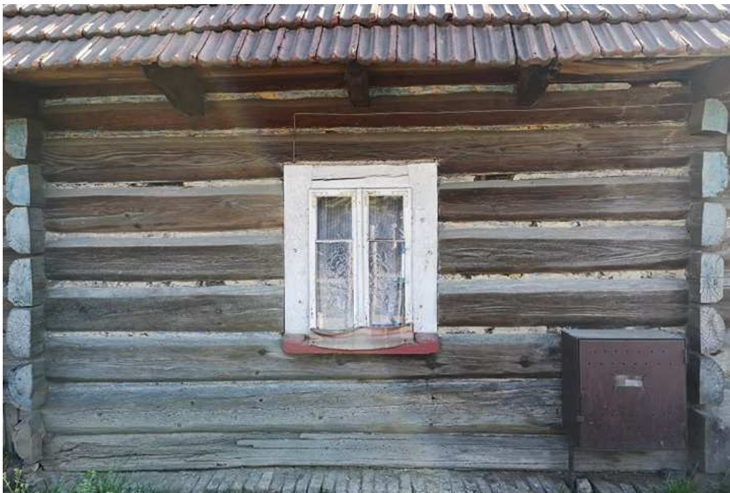
Fot. nr 104.