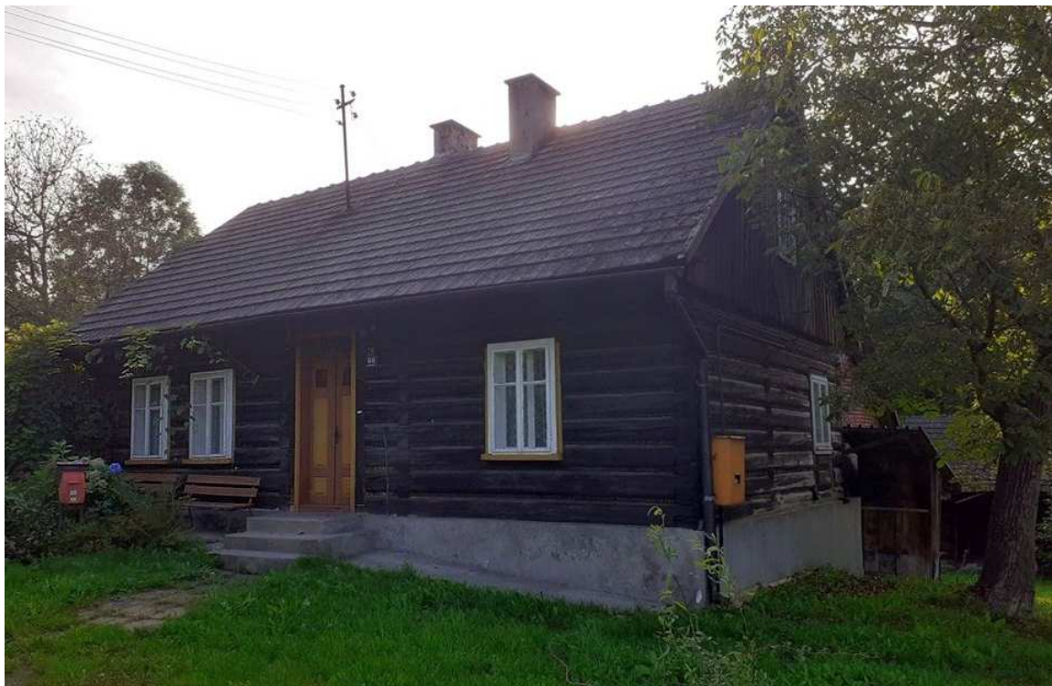
Fot. nr 323.