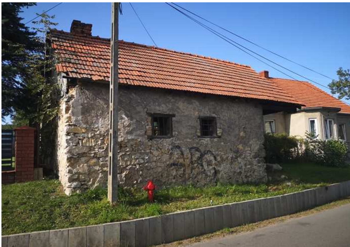
Fot. nr 36.