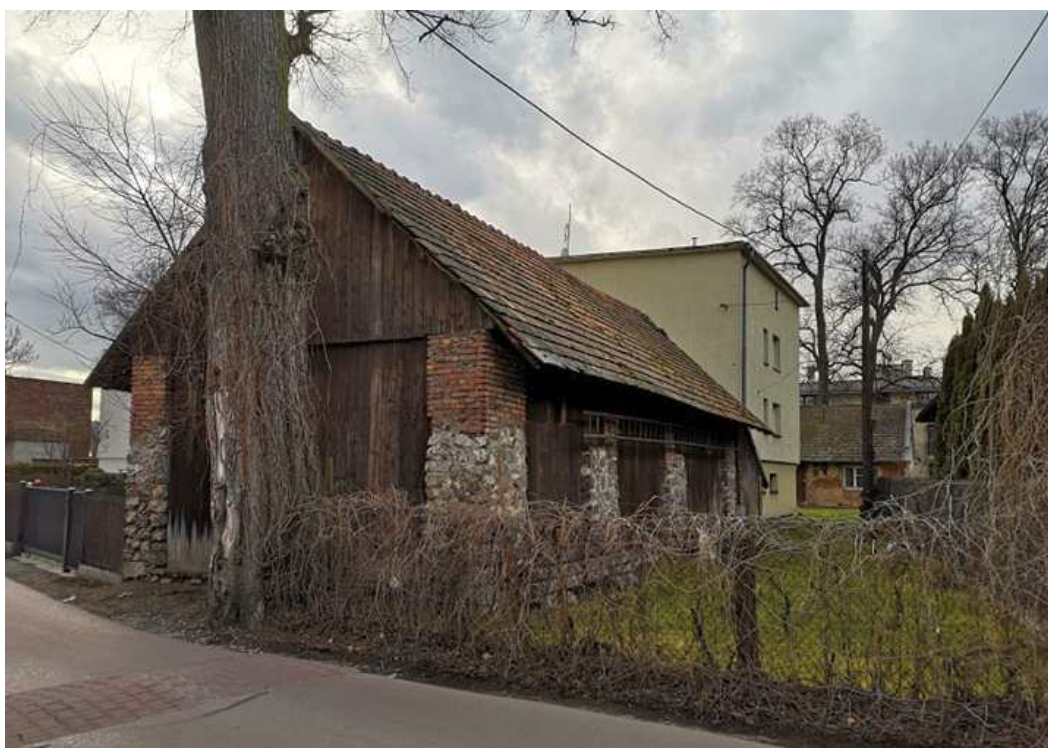
Fot. nr 12 (12-13). Stodoła w sąsiedztwie posesji przy ulicy Na Błonie 46.