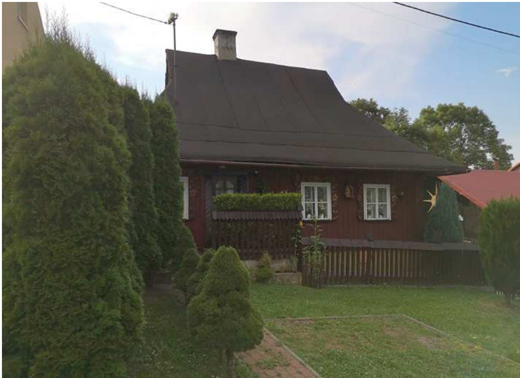
Fot. nr 256 (256-257). Może ponad stuletni dom z okapowym dachem.