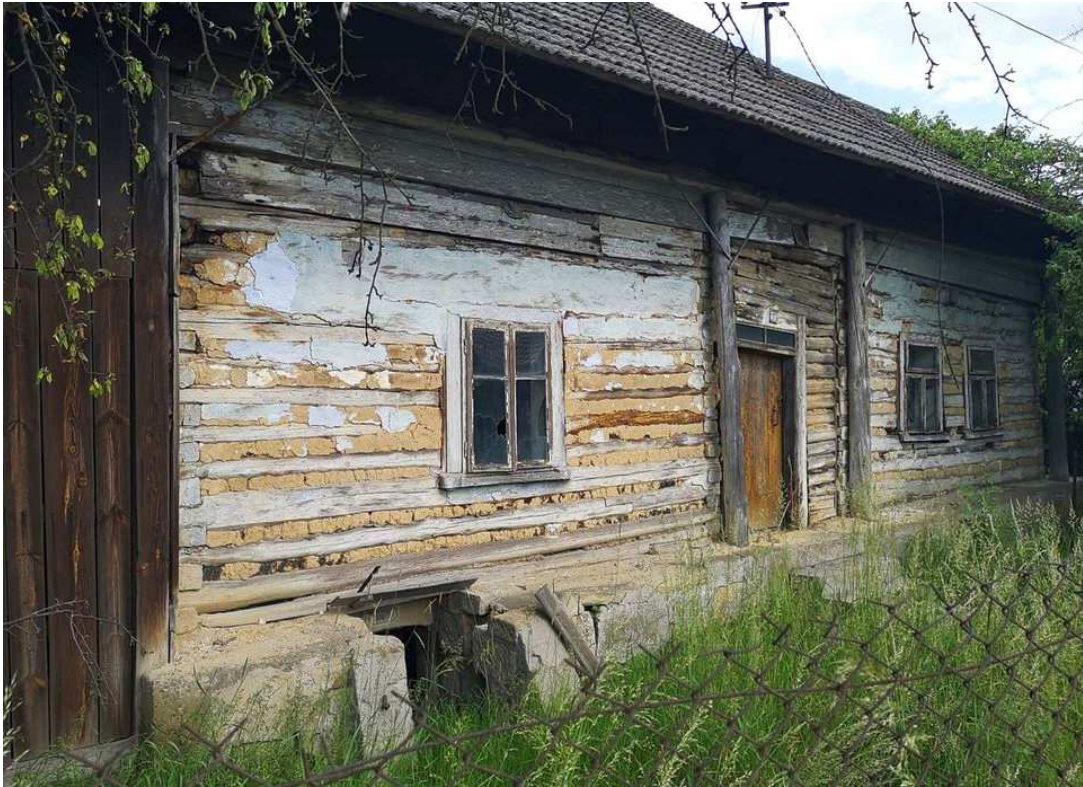
Fot. nr 234. Chałupa o konstrukcji przysłopowej o nieznannej mi dokładnie lokalizacji.