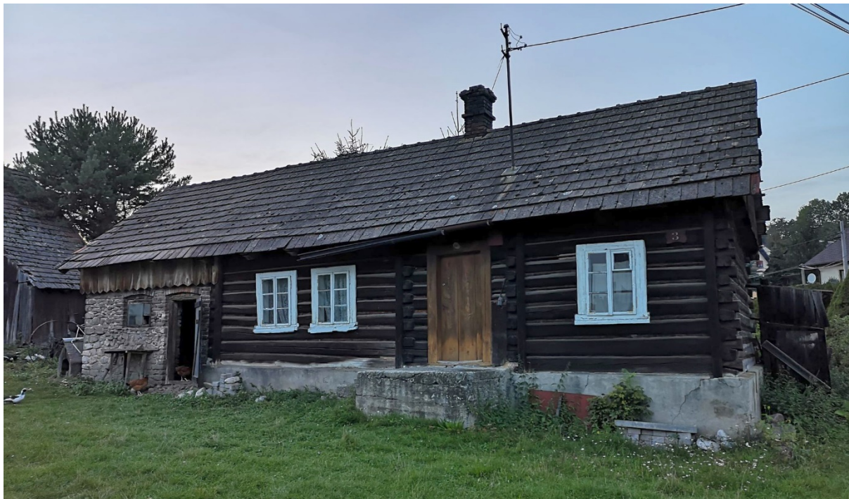
Fot. nr 31 (31-32). Ponad stuletnia chałupa z ulicy Turystycznej 3.