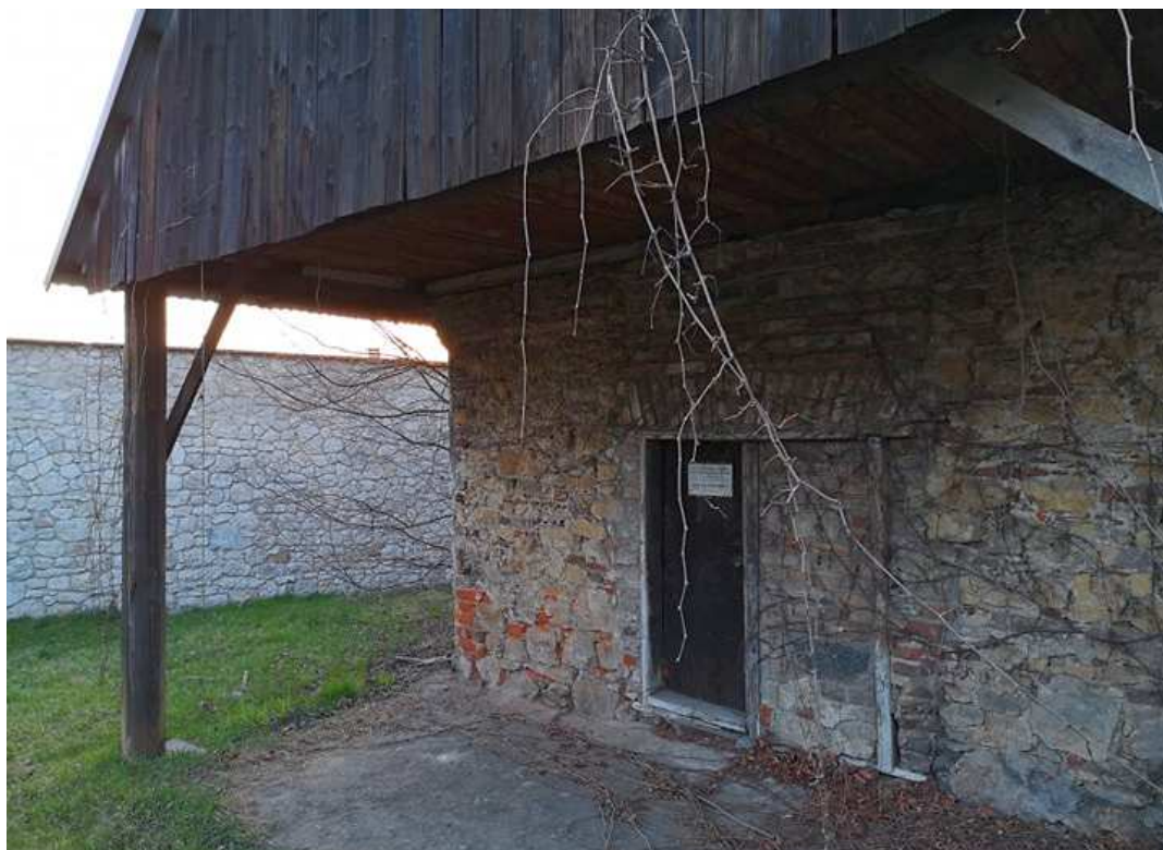
Fot. nr .