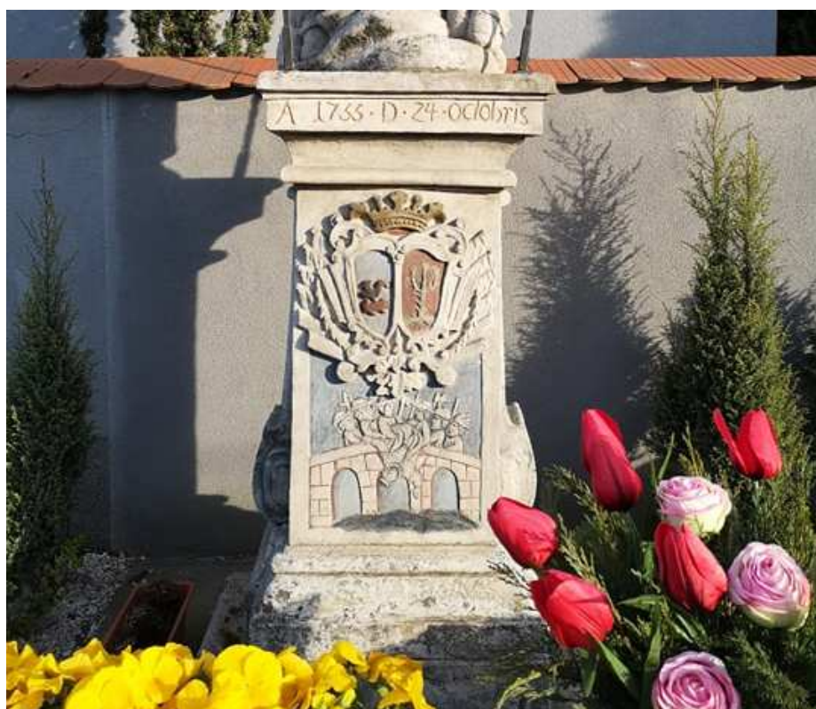
Fot. nr 80.