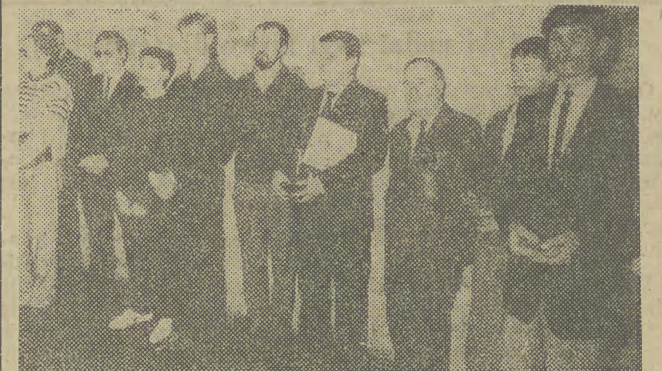
Na zdjęciu prezentujemy niektórych czołowych krakowskich sportowców, mistrzów Polski, którzy spotkali się niedawno w Klubie Olimpijczyka podczas uroczystości wręczenia im pamiątkowych upominków.