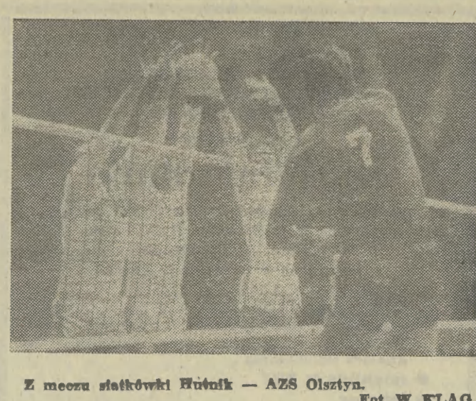
Z meczu siatkówki Hutnik — AZS Olsztyn.

W hali Hutnika rozegrano turniej piłkarski o Puchar Wyższości Krakowa. Brak w nim udziału: I-ligowa Stal Mielec oraz II-ligowcy: Odra Wodzisław, Wisła i Hutnik. Sukces odnieśli hutnicy, którzy w meczu o 1. miejsce remisowali z Odrą 2:2 (2:1), lecz w rzutach karnych byli lepsi 4:1. W pojedynku o 3. miejsce Stal pokonała Wisłę 4:3 (1:2). W meczach półfinałowych Odra wygrała z Wisłą karnymi 4:2 (w regulaminowym czasie padł wynik remisowy 1:1). Hutnik zwyciężył Stal 5:2 (2:1). Najlepszym piłkarzem turnieju uznany został Marek Motyka (Wisła). (K1)