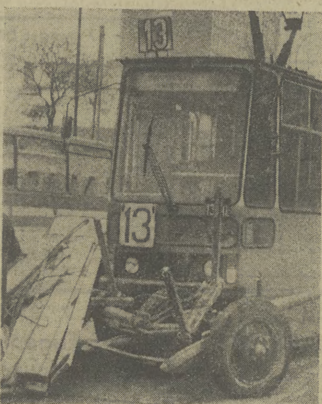
W godzinach południowych na ul. Na Zjeździe na skracająca nieprawidłowo turmankę najedną tramwaj linii 13. Tym razem trzynastka była fatalna dla woznicy który został poturbowany i przewieziony do szpitala w stanie ciężkim, a wóz zniszczony. Koń wyszedł z tego bez szwanku.

Każda kamieniczka Starego Miasta to zagadka, wspaniały labirynt, w którym historycy sztuki napotyka na coraz to nowe tajemnice „korytarze”. Jest to pasjonujące zjawisko dla historyka sztuki, konserwatora, ale niestety komplikuje ono prace renowacyjnym wykonawcom remontów — budowlanym. Stąd też bardzo często, i niejako w ostatniej chwili, zmienia się dokumentacja, a zatem i projekt, a w efekcie i terminy... Odnawa Krakowa to nie są zwykłe remonty, zwykłe prace budowlane. Są to skomplikowane działania twórcze. (gn)