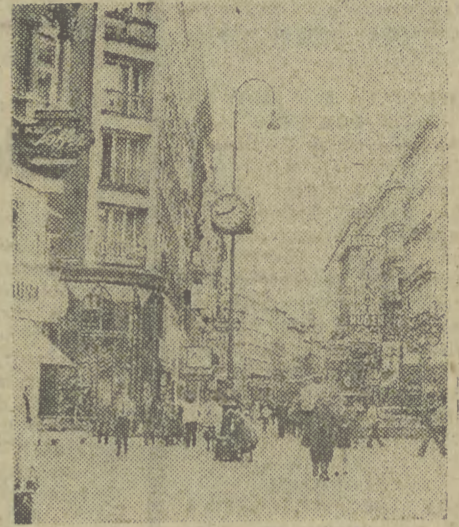
WIEN. Na zdjęciu najruchliwszy deptak stolicy Austrii — Kärntnerstrasse.

WASZYNGTON (PAP). Prezydent Carter polecił przyspieszyć dostawy broni amerykańskiej dla Pakistanu. Według doniesień prasy, administracja postanowiła również podjąć pilnie konsultacje z Kongresem, zmierzając do zniesienia niektórych ograniczeń obowiązujących obecnie w zakresie pomocy wojskowej dla Pakistanu.