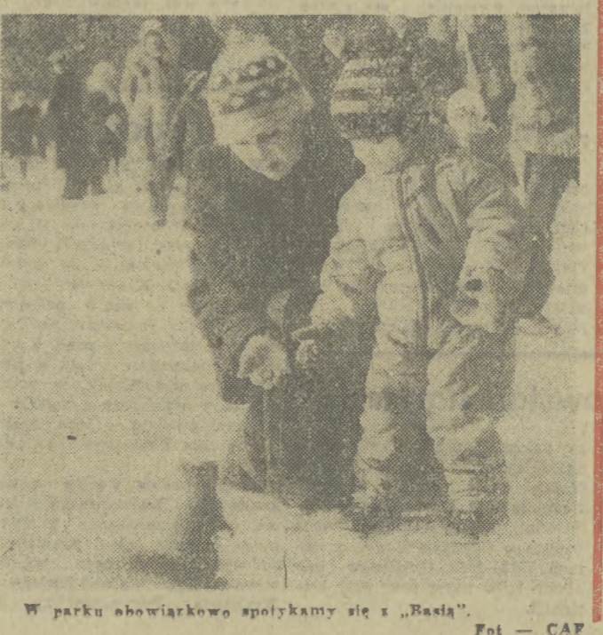
W parku obywatarkowo spotykamy się z „Basia”.

Nierazki to widok: biurka pracowników różnych instytucji i zakładów 50 tys. numerów telefonicznych. Na terenie działania Dyrekcji Okręgu Poczty i Telekomunikacji w Krakowie czyli w 6 południowych województwach kolejne materialne decyzje wyznaczyły limit 4,5 tys. numerów które odebrano instytucjom przekazane zostaną abonentom prywatnym. Wyznaczono limit bowiem przeprowadzony przegląd ujawnił tylko około 800 aparatów które uznać można było za zbędne. 800 na około 48 tys. działających w przedsiębiorstwach tych 4 województw. Zdecydowano się (DOKONCZENIE NA STR. 3)