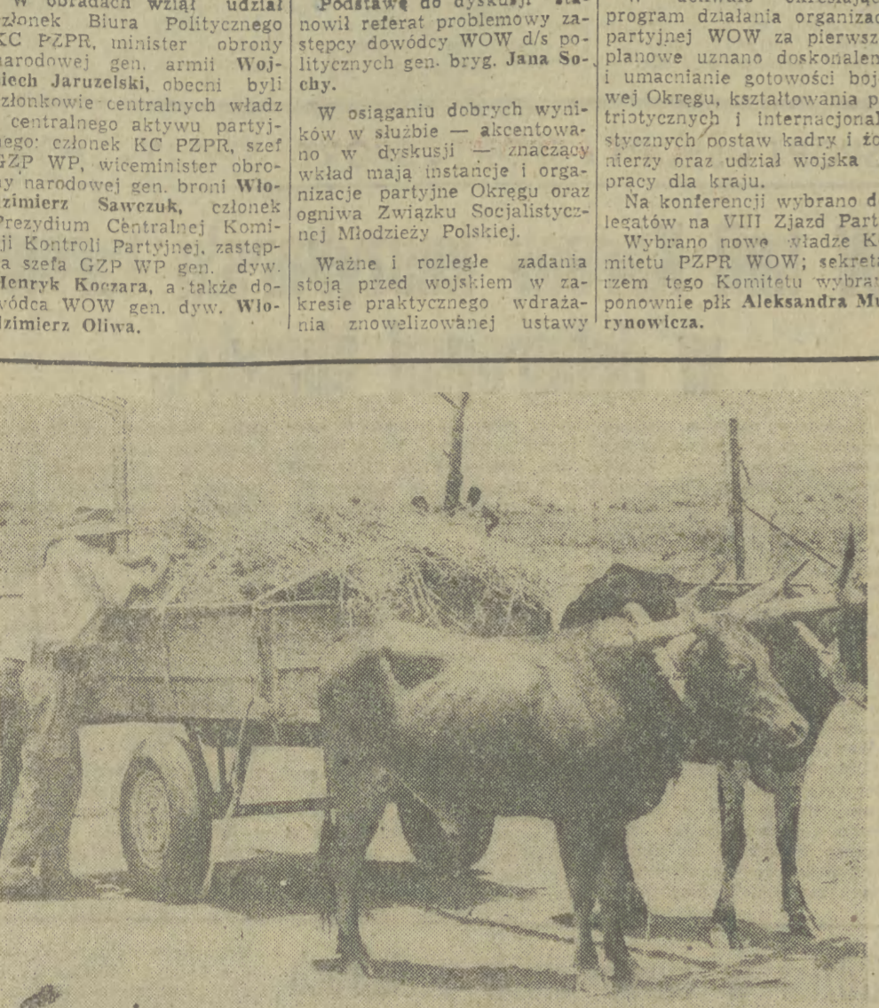
RODEZJA. W takich „wioskach strategicznych” mieszkają na terenie Rodezji tysiące czarnokórnymi mieszkańcy kraju przesiedlonych ze swych rodzinnych stron. Na zdjęciu: poddawani rewizji są wszyscy wchodzący i opuszczający teren obozu. Sprawdzane, w poszukiwaniu broni, są również wozy z płodami rolniczymi.