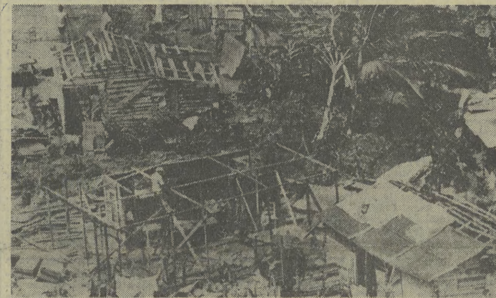
BUENOS AIRES (PAP). Według opublikowanych w Santo Domingo danych, bilans strat poniesionych przez Republikę Dominikańską 31 sierpnia br. w wyniku cyklonu „David”...

Poruszając sprawy dotyczące stosunków Izraela z reżimem Sadata Weizman podkreślił w wywiadzie, że obecnie Egipt jako sojusznik Stanów Zjednoczonych i Izraela występuje w obronie interesów państw zachodnich na Bliskim Wschodzie.