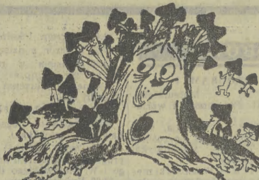
— Przepraszam, ale porwoliłem się zameldować tylko jednemu z was.