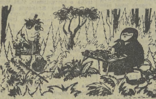
1 kg grzybów — 15 rubli...