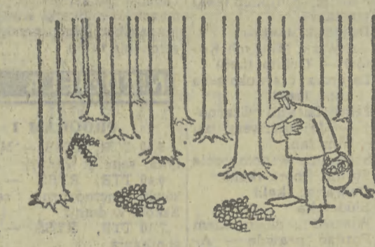
Rysunki: „Krokodyl”, „Dikobraz”, „Eulenspiegel”.