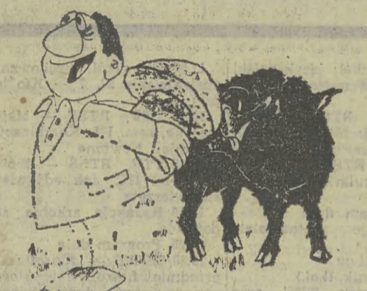
— Żono, zobacz, jaki wspaniały okaz! Uważaj, żeby go nie uszkodzić...