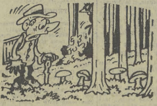
— Same szalany. To nie las, to przedsionek piekła!

Dwudziestu chłopaków, ozdoblonych paulimi płótnami przystąpiło do rozdania zebrany wokół autobusu podróżnym dyplomów honorowych. Miła uroczystość dobiegła końca.