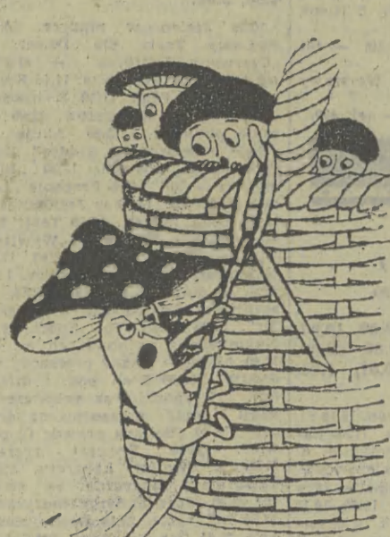
— Ja także chcę iść do miasta!