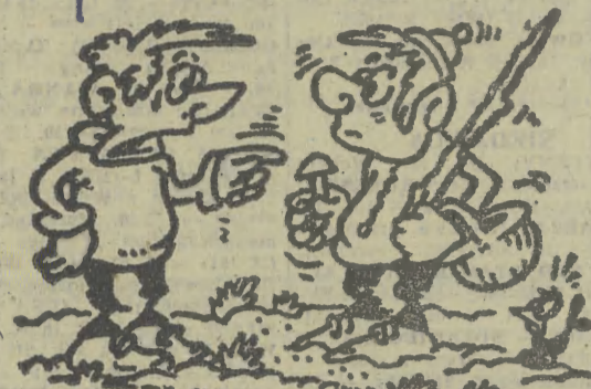
— Ja także zbieram grzyby, ale muszą być tak duże, bym mógł je dojrzeć z samochodem...