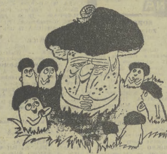
— Dziadku, opowiedz nam jak się dawniej żyło — 20 dni temu.