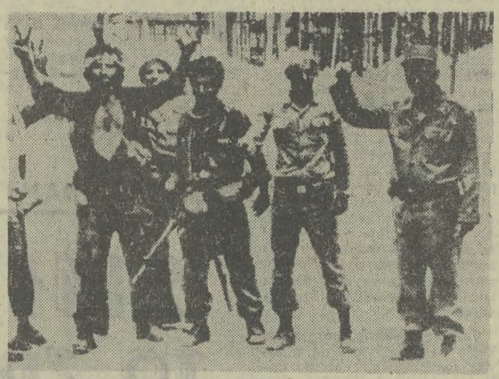
W Iranie wciąż trwają zamieszki i walki uliczne.