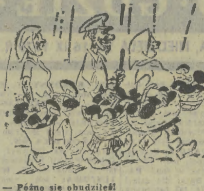
— Póno się obudzili!