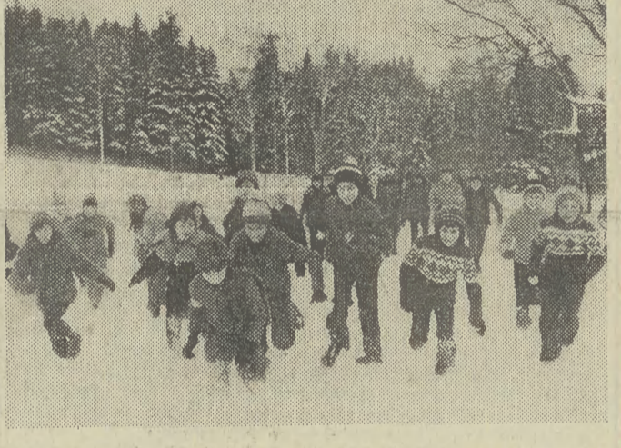
Zimowe ferie w pełni

Główny Urząd Statystyczny ogłosił dane o rozwoju gospodarki narodowej i o wykonaniu narodowego planu społeczno-gospodarczego w 1975 r. W omówieniu komunikatu GUS wszystkie wskaźniki dotyczące ub. roku porównywane są z danymi za 1974 r.