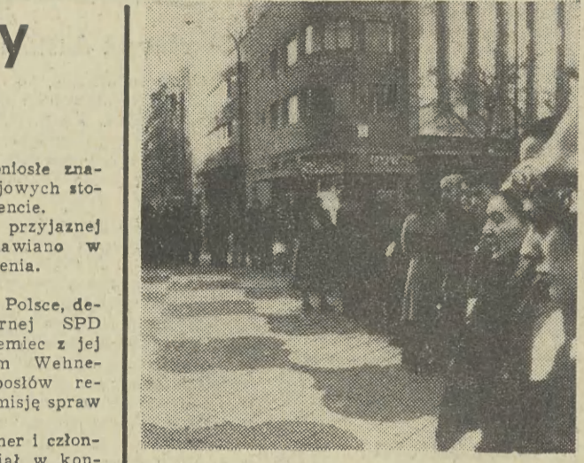
Wczoraj w Madrycie rozpoczął się strajk pracowników kolei podziemnej, którzy domagają się podwyższenia płac i polepszenia warunków pracy. Na zdjęciu: długie kolejki mieszkańców Madrytu oczekujących na autobusy.

„Z 35 wzorów, które obecnie produkujemy, 27 zostało zakupionych przez handel na ostatniej październikowej giełdzie. Na najbliższą giełdę, w marcu przygotowujemy ok. 70 nowych