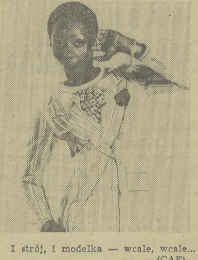
I strój, i modelka — wcale, wcale...

5 stycznia mieszkańcy Republiki Południowej Afryki będą mogli po raz pierwszy obejrzeć program krajowej telewizji. Przez długi czas władze rasistowskie były przeciwe temu, bowiem miała ona „podkopać morale społeczeństwa”. Obawiano się po prostu, że telewizja może