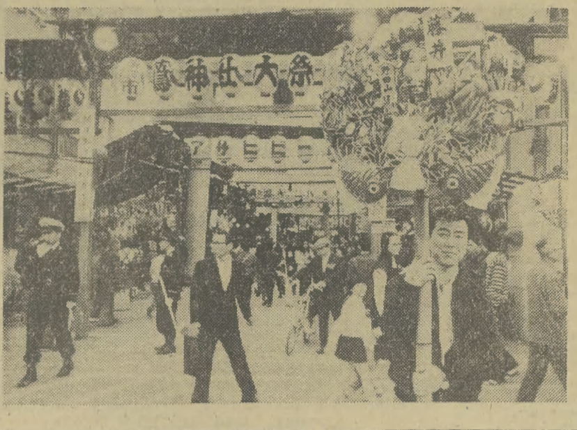
Z okazji niedawno obchodzonego w Japonii Dnia Koguta tysiące tokijczyków nabywało „kumade” — symboliczne grabie mające gromadzić pomysły w następnym roku.