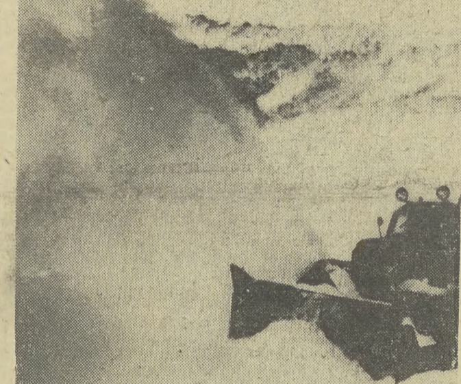
Odśnieżanie dróg w Bieszczadach.

(Inf. wł.) Sytuacja na liniach Południowej Dyrekcji Okręgowej Kolei Państwowych w minioną dobę była dość poważna. Prace przy odśnieżaniu i odmarzaniu zwrotnie utrudniały odśnieżanie, który zasypany wczoraj rozjazd. Ubiegłej niedzieli niezbyt licznie stawili się do pracy