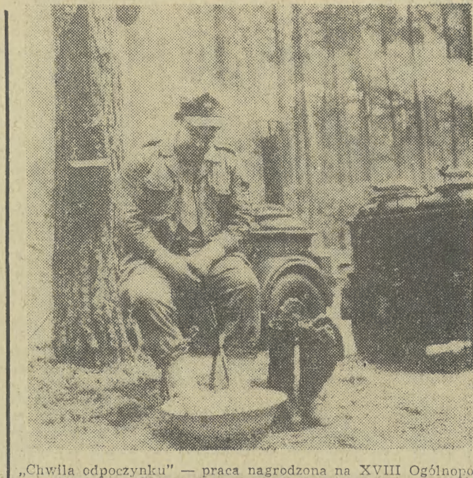
„Chwila odpoczynku” — praca nagrodzona na XVIII Ogólnopolskim Konkursie Fotografii Prasowej.