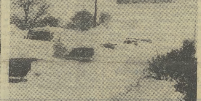
Cieśliki atak zimy w Europie. N/z: zasypane śniegiem samochody na autostradzie w pobliżu Kilonii w RFN. Do odkopywania ich z użyciem czołgów i ciężkiego sprzętu wojskowego ewakuują pasażerów. (Piszemy o tym na str. 3.)

26 pociągów towarowych oczekuje na stacji PKP — Prokocim na odjazd.