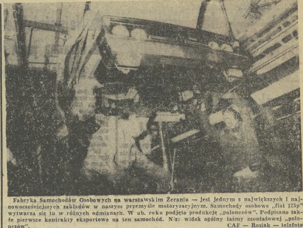
Fabryka Samochodów Osobowych na warszawskim Żeraniu — jest jednym z największych i nowoczesniejszych zakładów w naszym przemyśle motoryzacyjnym. Samochody osobowe „fiat 125p” wytwarza się tu w różnych odmianach. W ub. roku podjęto produkcję „polonezów”. Podpisano także pierwsze kontrakty eksportowe na ten samochód. N/z: widok ogólny taśmy montażowej „polonezów”.

LONDYN (PAP). Chaos na drogach i kolejach, odwołane lub spóźnione o wiele godzin loty oraz liczne przypadki śmierci wskutek niskich temperatur — oto skutki ataku zimy na Wyspy Brytyjskie — najcięższej od 1963 r. Pochłonięta już o 15 istnień ludzkich. Po raz pierwszy od kilkunastu lat doświadczenie całej kraj pokryty jest śniegiem. Chociaż temperatury w Wielkiej Brytanii są znacznie wyższe od polskich — 2 bm. rekord mrozu w W. Brytanii wynosił minus 17 st. C — nieprzygotowany do zimy kraj boleśnie odczuwa jej atak. Najgorzej sytuacja przedstawia się na drogach i kolejach.