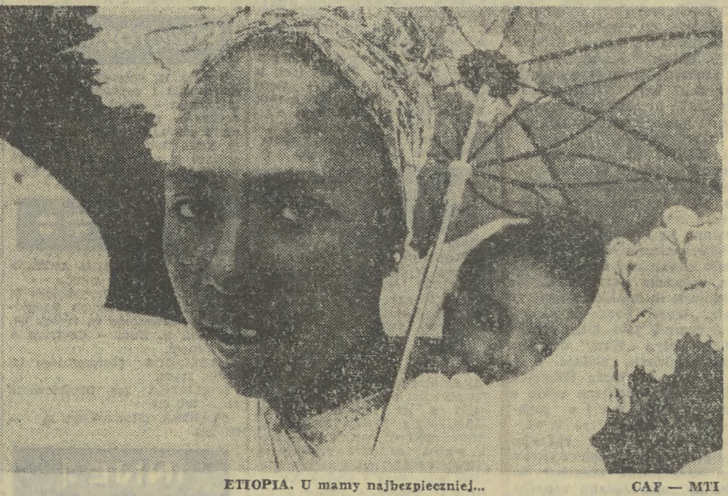
ETIOPIA. U mamy najbezpieczniej... CAP — MII

Trwają także intensywne prace przy realizacji trzeciej inwestycji surowcowej RWPG w ZSRR — kombinatu celulozowego w Ust-Limsku w Obwodzie Irkuckim na Syberii. Zakład wzniesiony wspólnie przez Bułgarię, NRD, Polskę, Rumunię, Węgry i ZSRR po uruchomieniu dać będzie rocznie 500 tys. ton wysokogatunkowej celulozy.