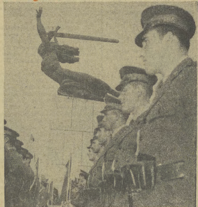
Ładunek wieńców pod warszawską „Nikę”.

(Inf. wł.) Kulminacyjnym punktem obchodów Święta Odrodzenia w Krakowie dnia 19 lipca 1975 roku było uroczyste spotkanie władz politycznych i państwowych Krakowa z przodującymi ludźmi miasta i wpisaniem ich nazwisk do KSIĘGI HONOROWEJ LUDZI ZASŁUGOWYCH . Rozpoczęło się ono o godzinie 12.00 w Sali Senatorskiej na Zamku Wawelskim. Orkiestra spadochroniarzy odegrała hymn narodowy — ludzie powstali i miejsc, łącząc się myślą i dniami chwały oręża polskiego pod Grunwaldem — a także, na Wale Pomorskim i w Berlinie. Polska Ludowa rozdziła się w boju ze śmiertelnym wrogiem ludzkości, zaś zbrojne ramię narodu — Wojsko Polskie powstało (CIĄG DALSZY NA STR. 2)