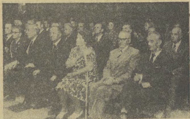
Grupa odznaczonych w Sali Senatorskiej na Wawelu.

Nie rozwiązuje to jednak całkowicie problemu ruchu drogowego na trasie do Zakopanego, Mszany, Limanowej itp. Konieczne jest jak najszybsze kontynuowanie inwestycji i wybudowanie czteropasmowej jezdni do Lubnia. (eba)