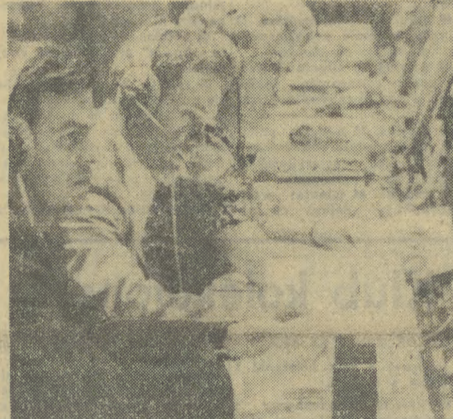
1 bm. w radzieckim ośrodku kierowania lotem statków SOJUZ-APOLLO odbył się ostatni trening kosmonautów radzieckich i amerykańskich przed wspólnym lotem. Niz: operatorzy w ośrodku kontroli lotów w ZSRR w czasie ostatniego treningu.