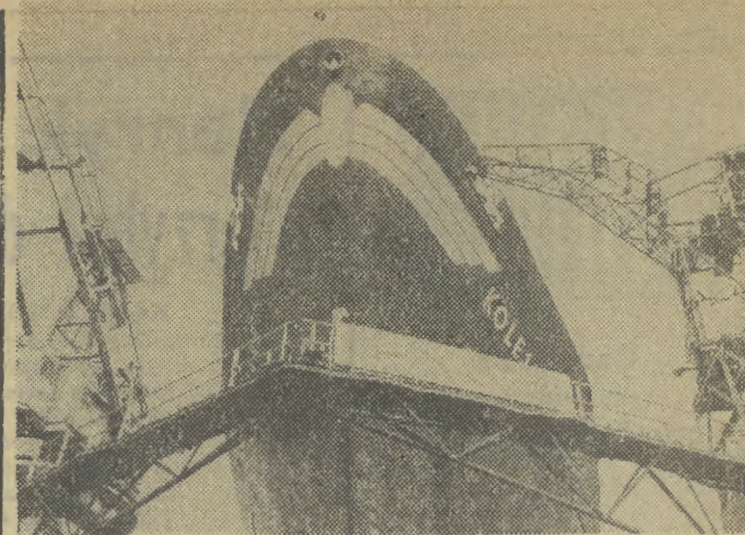
Szczecińska Stocznia Remontowa „Gryfia” — to jeden z czołowych zakładów remontujących statki wielu bander. Na zdjęciu: Przy nabrzączach szczecińskiej „Gryfii”.

DZIENNIK POLSKIEJ ZJEDNOCZONEJ PARTII ROBOTNICZEJ