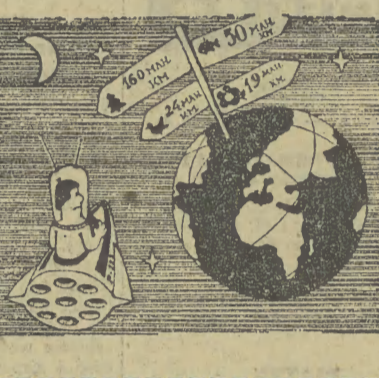
Rysunki: „Krokodyl”, „Dikobraz”, „Salzburger Nachrichten” (Austria).