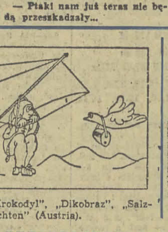
— Ptaki nam już teraz nie będą przeskazywały...