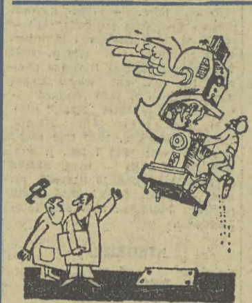
— Zdaje się, że z tą przewiewną konstrukcją trochę przesadziliśmy...