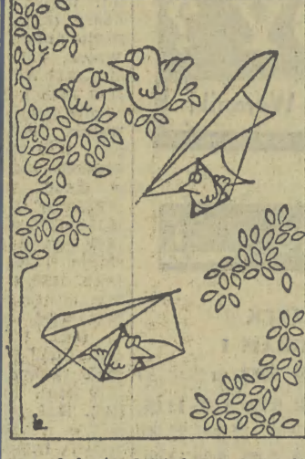
— Ach, ta dzisiaj młodzież!