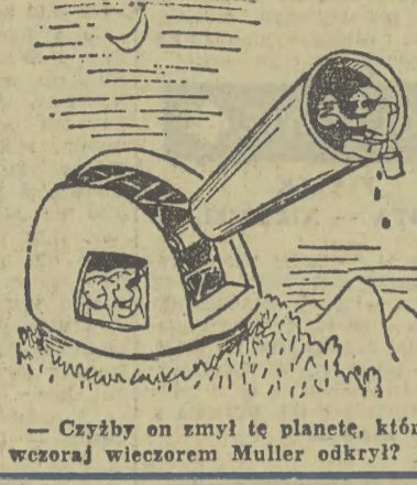
— Czyżby on zmył tę planetę, którą wczoraj wieczorem Muller odkrył?