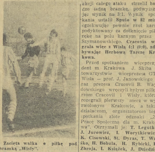
Zacięta walka o piłkę pod bramką „Wisły”.