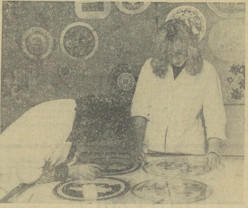
W pracowni plastików Zakładów Opakowań Blaszanych w Brzesku powstają nowe wzory.

... będą się znacznie różniły od dotychczasowych. Przede wszystkim