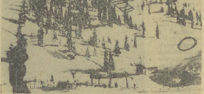
31. XII. ub. r. w dolinie Montafan w Alpach austriackich zeszła lawina, zabijając 12 osób. N/z: zbocze, po którym zeszła lawina (zakreślane, w środku w górę). Kółkiem zaznaczono miejsce, gdzie znaleziono ciała kilku ofiar.

Tak więc nie ma skutecznej recepty na uratowanie się z katastrofy lawinowej. Oczywiście dobre znalezienie i tablice ostrzegawcze spełniają tu istotną rolę. Najwięcej zależy jednak od uwagi i ostrożności narciarzy. Oblężono, że udało się uniknąć 90 proc. katastrof spowodowanych zejściami lawiny, gdyby narciarz sam miał się na baczności.