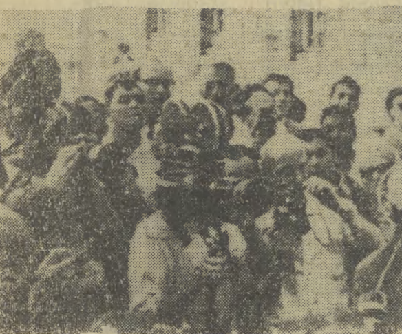
2 bm. dr Christian Barnard, który dokonał drugiej udanej transplantacji serca, wziął udział w konferencji prasowej.

LONDYN (PAP) Według informacji radia południowoafrykańskiego — dr P. Blaiberg, któremu w teorek przeszczepiono serce, spędził spokojną noc i stan jego jest — zdaniem lekarzy — bardzo dobry. Po przebudzeniu, Blaiberg pierwszy raz przemó-