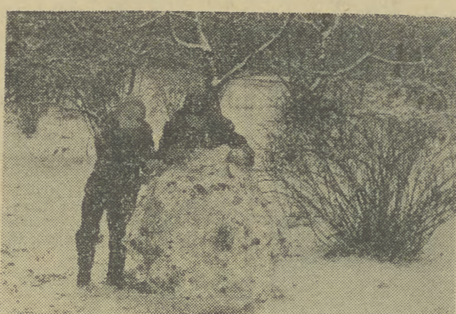
Śniegu pod dostatkiem, więc dzieciaki lepią bałwanów...

Już 15 lat działa w Krakowie — Koło Przewodników Tatrzańskich i Podhalańskich niosące imię legendarnego już dziś przewodnika Macieja Sieckiego. Krakowscy przewodnicy mają uświadomienie do prowadzenia wycieczek tak zbiorowych jak i indywidualnych — w Tatry