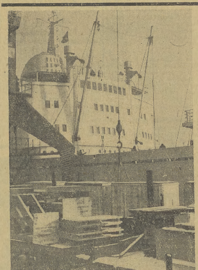
KRAKÓW. Równocześnie z Fabryki Maszyn Odlewniczych w Krakowie skierowano do Czechosłowacji transport maszyn i urządzeń. Wykorzystane zostaną one w procesie mechanizacji budowlanych w tym kraju odlewni w Tyniście i Libercu. Załoga Zakładów Budowy Maszyn i Aparatury im. Szczęśliwego w Krakowie przekazała stocznicom sprężarki amoniakalne, która zamontowana zostanie na statku-bazie rybackiej, przeznaczonej dla Związku Radzieckiego. Dwie inne sprężarki wysłano do Rybnika, gdzie miejscowa załoga Fabryki Maszyn wykorzysta je do budowy urządzeń przeznaczonych dla wznoszonej w Indiach kopalni.

ANDRZYCHÓW. W ostatnią fazę rozruchową weszły z nowym rokiem prace przy uruchomieniu nowej, wielkiej wykańczalni w Andrychow-