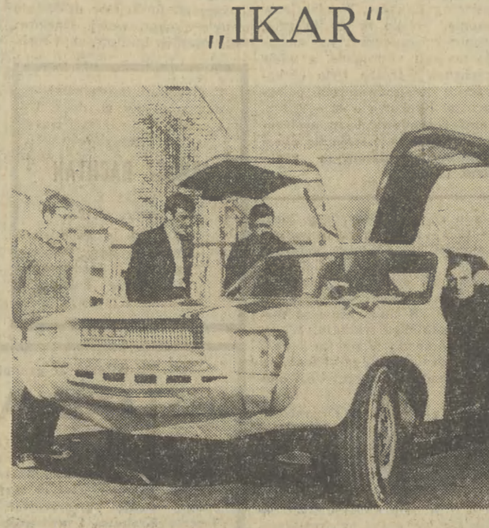
W Płowdii (środek, Bułgaria) otwarta została wystawa młodych techników- amatorów.

Rabusie wtargnęli do magazynu po jego zamknięciu, pobili właściciela i zwiążali go.