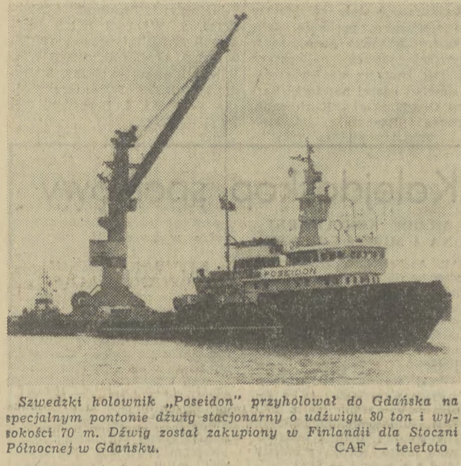
Szwedzki holownik „Poseidon” przyholował do Gdańska na specjalnym pontonie dźwigt stacjonarny o udźwigu 80 ton i wydajności 70 m. Dźwigt został zakupiony w Finlandii dla Stoczni Północnej w Gdańsku.

Zakłady „Stroemens Vaerksted” w Oslo zaprezentowały prasie i miejskim instytucjom użyteczności publicznej prototyp samochodu-furgonki o napędzie elektrycznym.