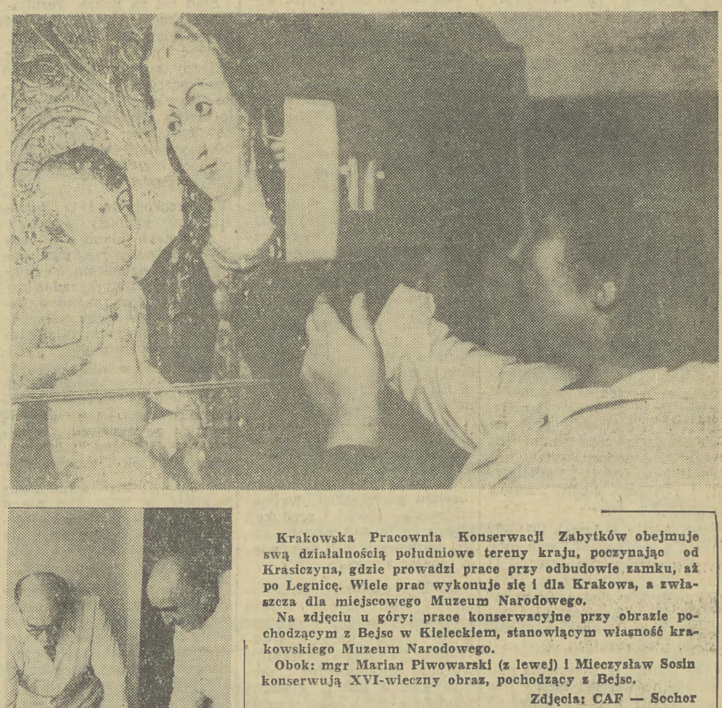
Krakowska Pracownia Konserwacji Zabytków obejmuje swą działalność południowe tereny kraju, poczynając od Krasicyna, gdzie prowadzi prace przy odbudowie zamku, aż po Legnicę. Wiele prac wykonuje się i dla Krakowa, a zwłaszcza dla miejscowego Muzeum Narodowego.