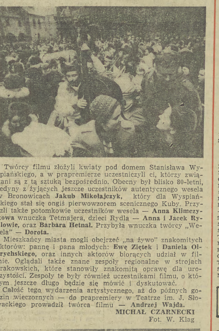
Twórcy filmowej wersji „Wesela”, A. Wajda w nie mniej pracowitej roli - roznawcy fotografów.