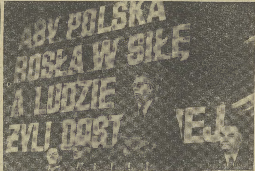
Edward Gierka otwiera obrady.

Pragniemy, aby zadania planowe zostały nie tylko wykonane, ale znacznie przekroczone, aby mogła nastąpić większa niż założyliśmy w planie poprawa stopu życiowej ludzi pracy. Na półmetku re-