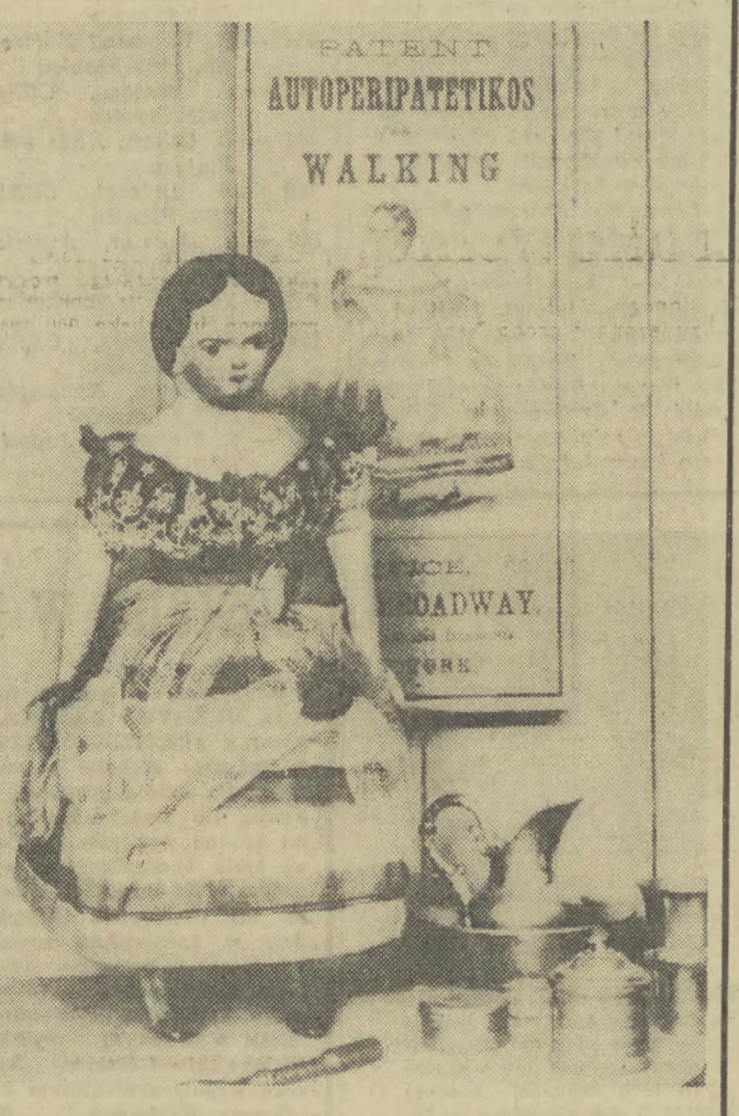
Pierwsza amerykańska chodząca lalka. Nakręcana kluczykiem, metalowa. Nie służyła do zabawy, tylko do oglądania. Ubrana w strojn sukienki, najchętniej kupowana była przez dorosłych, których zachwycała jako cud techniki. Dzieci nie lubiły się nią bawić, bo była zbyt wielką damą.