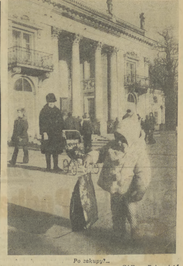
Po zakupie?...

Dyskusja trwa nadal. Czasu pozostaje coraz mniej. A do nowej organizacji trzeba przecieć wnieść to wszystko, co wartościowe i ważne dla całego środowiska studenckiego. Ba, program trzeba poszerzyć o wartościowe, których wymaga zmieniająca się z dnia na dzień rzeczywistość. A studentów podkreślają: „TRZEBA MIEĆ ŚWIADOMOŚĆ FAKTU, ŻE NIKT ZA NAS NIE PODEJMIE DECYZJI, ŻE PROGRAM NASZEGO DZIAŁANIA BĘDZIE TAKI, JAKI W CHWILI OBECNEJ WYDYSKUTUJEMY, A NA FORUM NOWEJ ORGANIZACJI PRZYJMIEMY DO REALIZOWANIA”.