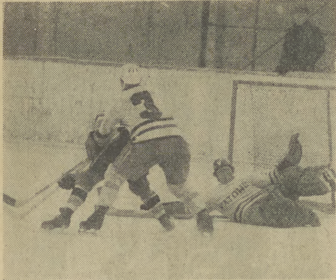
Fragmety meczu Podhale — GKS.