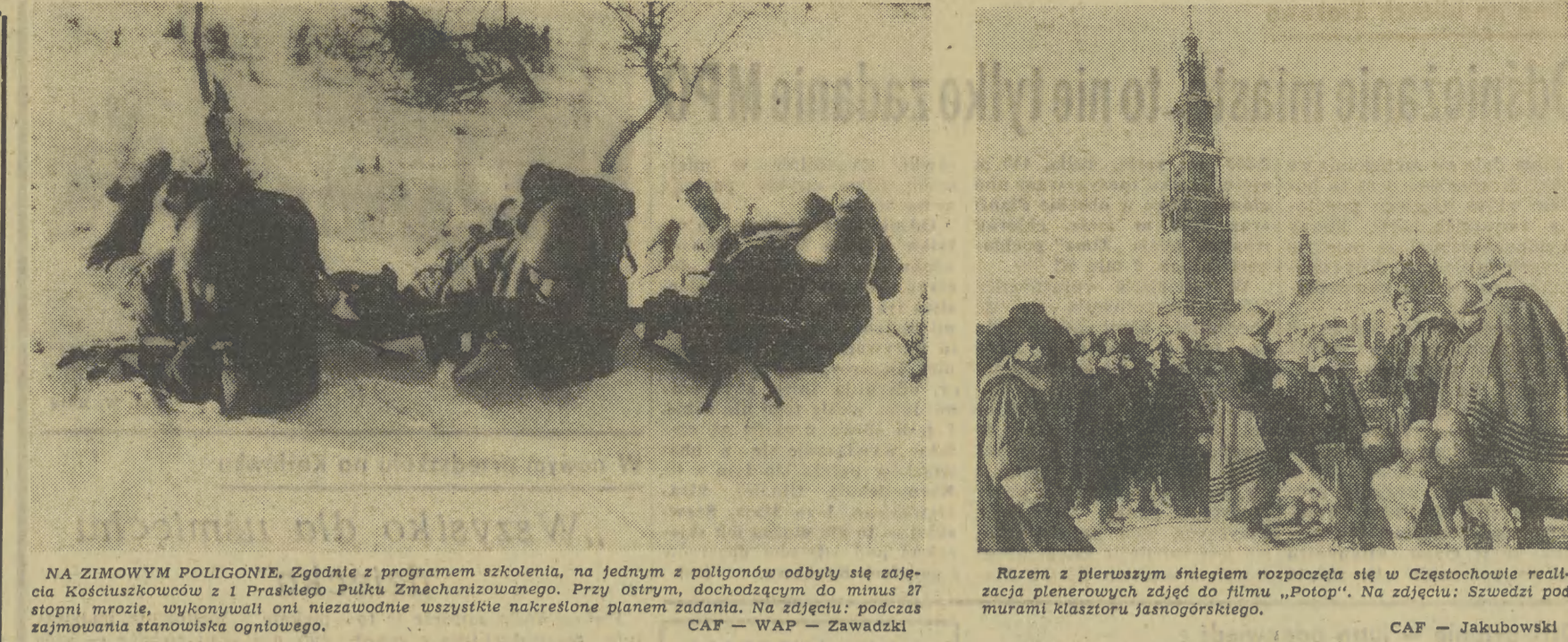
NA ZIMOWYM POLIGONIE. Zgodnie z programem szkolenia, na jednym z poligonów odbyły się zajęcia Kołuszkiwoców z 1 Praskiego Pułku Zmechanizowanego. Przy ostrym, dochodzącym do minus 27 stopni mrozie, wykonywali oni niezatwardnie wszystkie nakreślone planem zadania. Na zdjęciu: podczas zajmowania stanowiska ogniowego.

W dniach styczniowej rocznicy, kiedy piszemy i mówimy o drodze życiowej wodza międzynarodowego proletariatu, warto sięgnąć również — dla przypomnienia — po pozostałe karty starych roczników gazet i dokumenty związane z latami jego pobytu na polskiej ziemi.