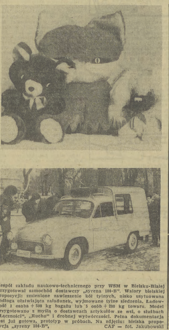
Zespół zakładu naukowo-technicznego przy WSM w Bielsku-Białej przygotował samochód dostawczy „syrena 104-B”. Watory bielskiej propozycji: zmienione zawieszenie kół tylnych, nisko usytuowana podłoga ułatwiająca załadunek, wymiowane tyne siedzenia. Ładowność 1 osoba + 500 kg bagażu lub 5 osób + 200 kg towaru. Model przygotowany z myślą o dostawcach artykułów ze wsi, o słubkach „Łączności”, „Ruchem” i drobnej wytwórczości. Pełna dokumentacja jest już gotowa, prototyp w próbach. Na zdjęciu: bielska propozycja „syrena 104-B”.