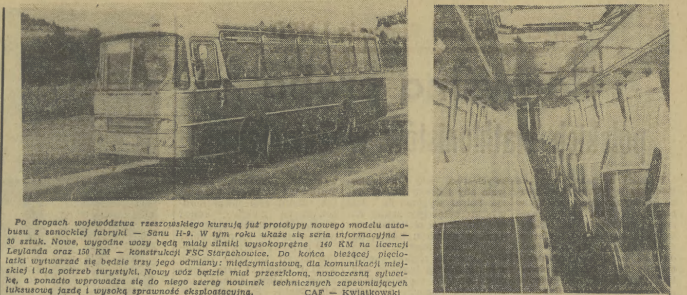
po drogach województwa rzeszowskiego kursują już prototypy nowego modelu autobusu z sanockiej fabryki — Sanu H-9. W tym roku ukazuje się seria informacyjna — 30 sztuk. Nowe, wygodne wozy będą miały silniki wysokoprężne 140 KM na licencji Leylanda oraz 150 KM — konstrukcji FSC Starachowice. Do końca bieżącej pięcioletniej wytworzą się będzie trzy jego odmiany: międzymiastowa, dla komunikacji miejskiej i dla potrzeb turystyki. Nowy wóz będzie miał przesuwną, nowoczesną sylwetkę, a ponadto wprowadza się do niego szereg nowinek technicznych zapewniających luksusową jazdę i wysoką sprawność eksploatacyjną.