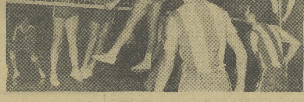
Punkty cieszą gra nie