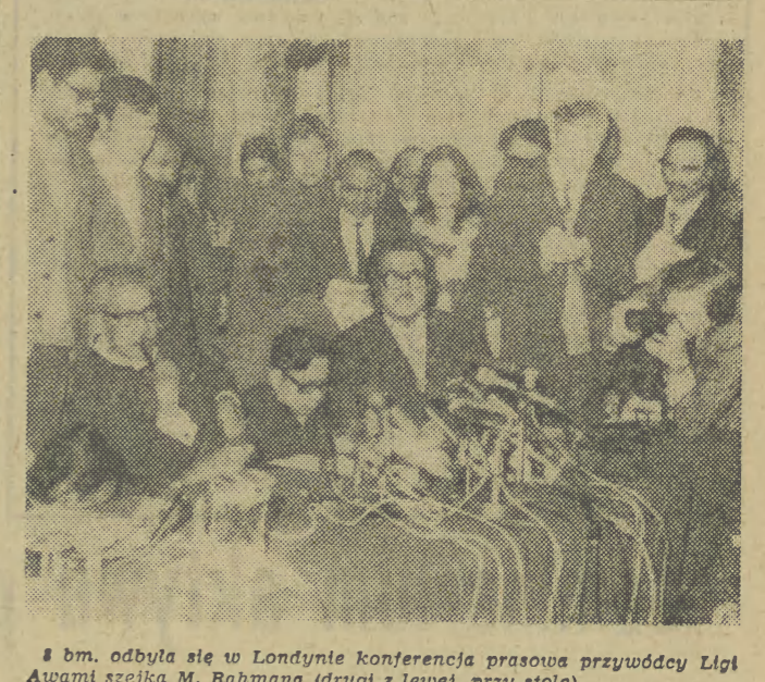
8 bm. odbyła się w Londynie konferencja prasowa przywódcy Ligi Awami szelki M. Rahmana (drugi z lewej, przy stole).

ZAKŁADY AZOTOWE W TARNOWIE — wykonanie czynu produkcyjnego przyniosło dodatkowo 6,2 mln zł. Załoga dostarczyła m. in. 6 tys. ton saletrzaku na eksport. Równocześnie w rekordowo krótkim terminie zmontowano szwajcarskie urządzenie firmy „Luwa” do końcowego procesu produkcji kaprolaktamu — podstawowego surowca dla przemysłu chemicznego; przyspieszono w ten sposób rozwój technologiczny o blisko 6 miesięcy.