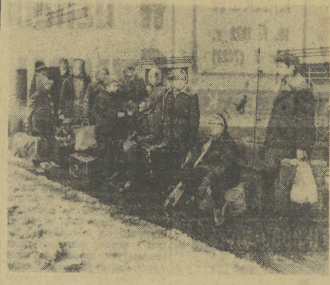
Wszystkie dzieci powróciły z zimowych wakacji, czekają teraz na przybycie rodziców. Z rozradowanych min widać, że wycieczka był wymiennie.

XIV-WIECZNY pałac w Padwie w którym mieszkał niedługo Galileusz został prawie zupełnie zniszczony przez pożar — donosi z Rzymu Agencja Reutera. Nienaruszona została jedynie fasada pałacu. Szkody ocenia się na ok. pół miliarda lirów.