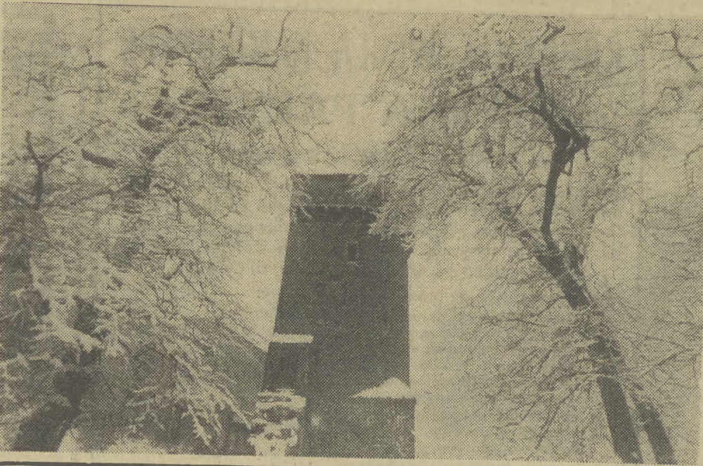
W zasypianiu Krakowie