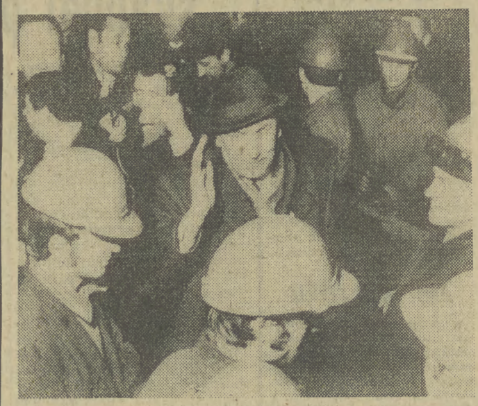
Przebywając na ziemi opolskiej E. Gierek spotkał się z załogą Zakładów Chemicznych w Białych Wodach. Na zdjęciu: I sekretarz KC wśród robotników warsztatów remontowych.

WARSZAWA (PAP) — 6 bm. odbyły się w kilku kolejnych województwach dalsze uroczystości związane z 30 rocznicą powstania Polskiej Partii Robotniczej. Zasługi PPR w dziele odbudowy i społeczno-politycznej przebudowy Śląska Opolskiego przypominano na spotkaniu Egzekutywy KW PZPR w Opolu z weteranami ruchu robotniczego. Uczestniczył w nim I sekretarz KC PZPR — Edward Gierek.