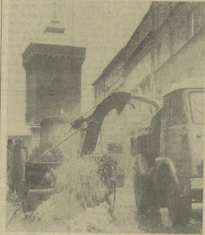
Pierwszy atak zimy odparło. Co będzie dalej...

W pierwszej kolejności odśnieżano i posypano piaskiem trasy przelotowe pierwszej strefy i trasy autobusowe. Główne arterie polewano chlorkiem, a śnieg wywożono do kanałów zsypanych przy ul. Zwierzynieckiej i Retoryka. Poza rogatkami Krakowa zimą walczyły PZDL i WZDP. Zadanie było trudne, a rezultaty mimo starań mało widoczne. Do akcji na szosach województwa przystąpiło 41 plugów, 82 piaskarki, 186 robotników. Mowa o dniu 5 stycznia. Wcześniej pracowało 45 samochodów odśnieżających, 85 piaskarek i 269 robotników. Żadnych kolizji w ruchu drogowym nie zanotowano.