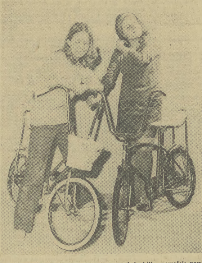
W planach br. bydgoski „Romek” zapowada kilka nowości: nowe typy rowerów dziecięcych, w tym dla trzy- i czterolatków. Także młodzież w wieku 11-12 lat otrzyma wreszcie dla siebie pojazd. Do roli będą mogli się cieszyć rowerem typu „Polo” oraz dwoma turystycznymi, w tym także składanym. Na zdjęciu: dwa nowe typy rowerów.

Przy coraz szerszym wykorzystaniu zasobach ziemi, jakie przypadają na statystycznego obywatela naszego kraju, zaspokojenie potrzeb wymaga coraz intensywniejszego wykorzystania ziemi. Dotyczy to nie tylko pól, łąk, pastwisk, ale i terenów leśnych. W tym celu należy przede wszystkim zwiększyć powierzchnię lasów. W tym celu należy przede wszystkim zwiększyć powierzchnię lasów. W tym celu należy przede wszystkim zwiększyć powierzchnię lasów.