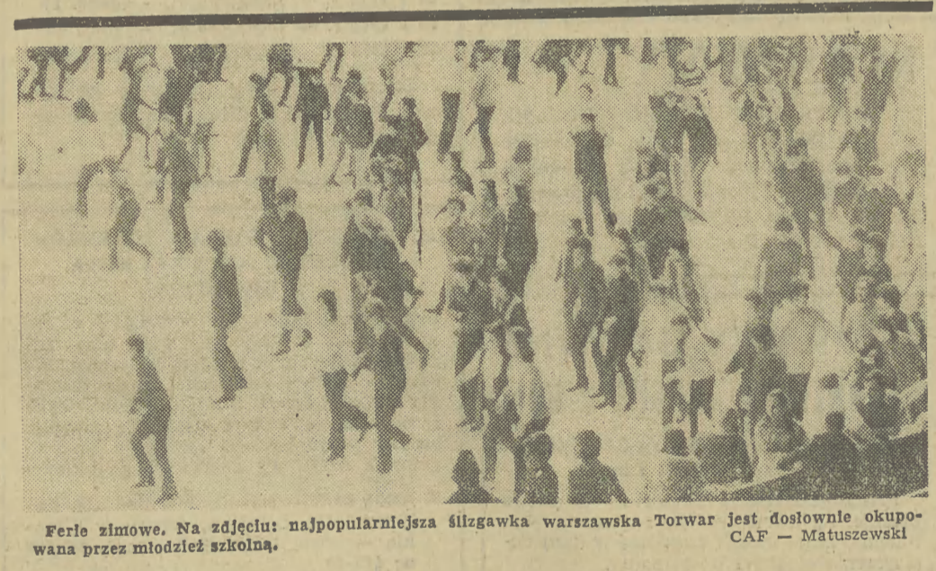
Ferie zimowe. Na zdjęciu: najpopularniejsza śluzgawka warszawska Torwar jest dostawnie okupowana przez młodzież szkolną.

Aby spenetrować teren, wykonano u „Szadkowskiego” prototyp sprężarki freonowej, który następnie zbadali fachowcy z Centralnego Ośrodka Chłodnictwa i zakwalifikowali go do produkcji. Dwie sprężarki freonowe dla baz rybactkich już obecnie wykonują się w zakładzie, lecz produkcja z prawdziwego zdarzenia, na podstawie dokumentacji opracowanej przez COCh, ma ruszyć w roku 1973, początkowo skromnie, trzema sztukami serii informacyjnej, w następnym roku pełną parą, na skalę przemysłową. Równolegle trwają w zakładzie prace zmierzające do uruchomienia produkcji sprężarek śrubowych, które mają tę dodatkową zaletę, że równocześnie mogą pełnić rolę pomp. Jest to artykuł wysoko ceniony w świecie, nowoczesny i poszukiwany, o bardzo dobrych prognozach rozwojowych. Wadą tego typu sprężarek jest hałas wytwarzany przez pracę dwu śrub tłoczących płyn, niemniej wysoka wydajność i niezawodność tego urządzenia powodują, że jest on stosowany w światowym chłodnictwie. Możliwość podjęcia przez „Szadkowskiego” produkcji sprężarek śrubowych aktualnie rozpatruje Zjednoczenie Przemysłu Budowy Urządzeń Chłodniczych i Centralny Ośrodek Chłodnictwa.