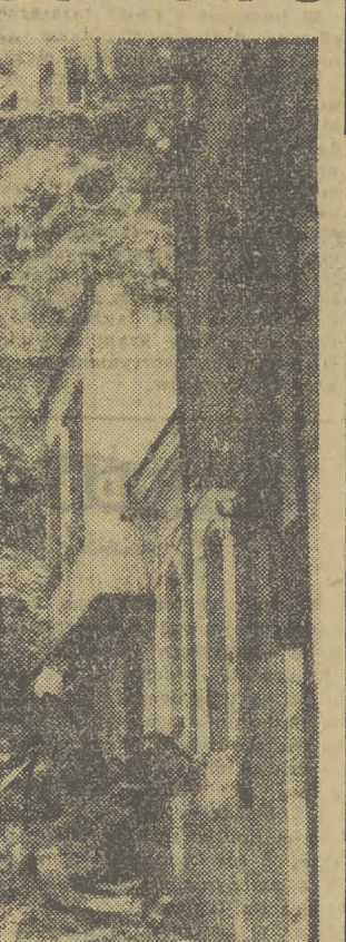
Na zdjęciu: rumowisko pozostałe po domu zwanym obsuwającym się zmięciem.