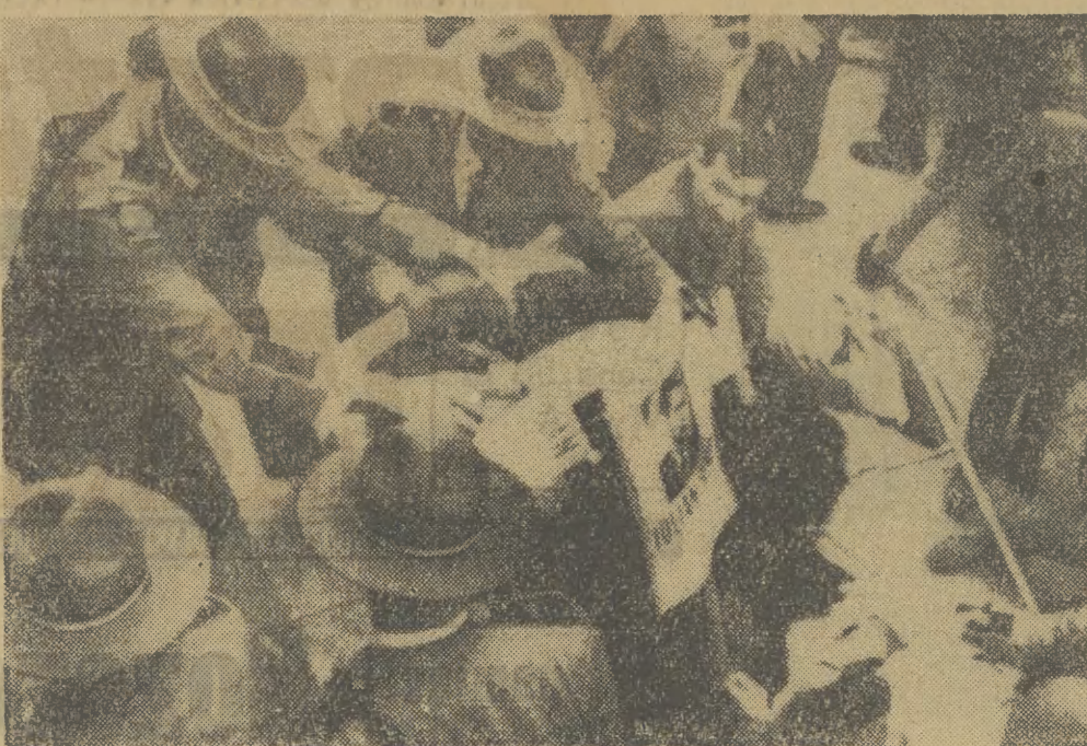
W stolicy stanu amerykańskiego Georgia-Atlantida odbyła się demonstracja przeciwko nieopuszczeniu na posiedzenie Izby Reprezentantów tego stanu, jedynego przedstawiciela ludności murzyńskiej Juliana Bonda. Bond protestował przeciwko wojnie w Wietnamie.

Na zdjęciu: brutalna interwencja policji podczas demonstracji w Atlancie.