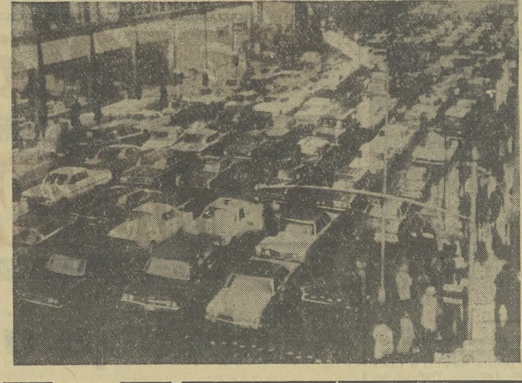
Strajk pracowników komunikacji, trwający od blisko dwóch tygodni w Nowym Jorku...