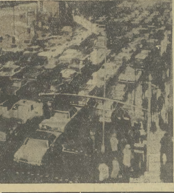
Strajk pracowników komunikacji, trwający od blisko dwóch tygodni w Nowym Jorku...