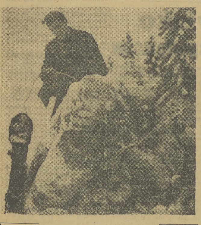
W południowej części naszego województwa rozpoczęły się już lesne żniwa.

„Biedroneczki są w kropczki”, ale też należą do wielkich... drapieżników. Biedronka zjada w ciągu dnia do dwustu mszyc, a jej larwa — do 80. Wcale więc nie takie pocziwinki, rzecz jednak w tym — że bardzo pożyteczne.