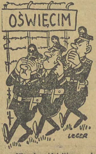
— Nie nie widzieliśmy, nie nie słyszeliśmy, nie nie mówiliśmy... Rysunek LEGERA z zachodniopomorskiej gazety „Metal”.