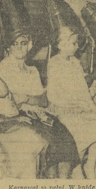
Karnawał w pełni. W każde sobotnie popołudnie panie przygotowują nowe kreacje fryzjursowe.