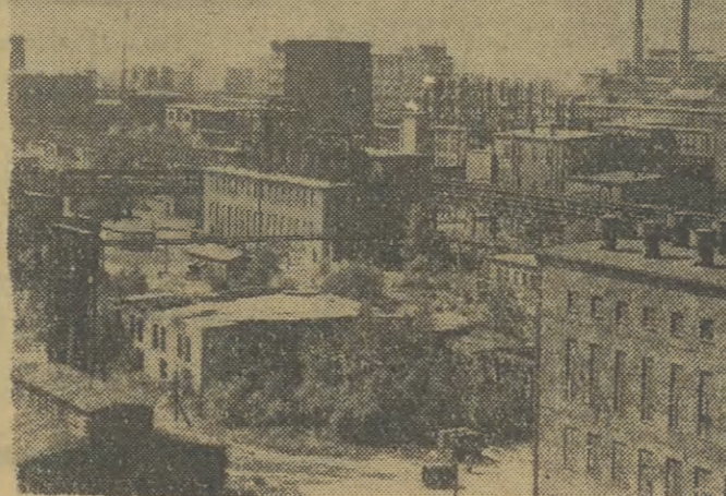
Zakłady w Oświęcimiu — czolowy zakład polskiej chemii.

W czwartek 12 bm. korzystając ze świeżych opadów śniegu, przystąpiono do przygotowywania dużej skoczni do jej wielkiego święta.