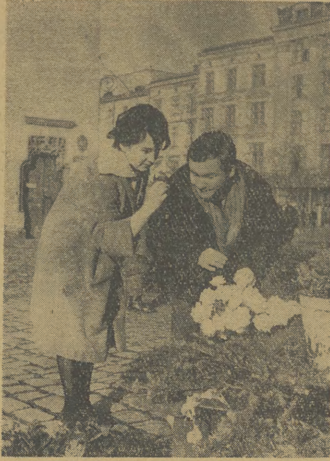
Ta scena uchwyciona została przez obiektyw fotoreportera na Ryнку Głównym...