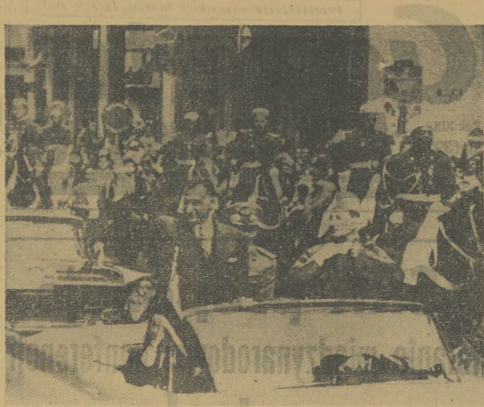
Wczoraj rozpoczęła obrady Rada Bezpieczeństwa...

Jak wiadomo, prezydent de Gaulle wypowiedział się w despeszy przesłanej pod adresem księcia Sihanouka, za podjęciem działalności Międzynarodowej Komisji Nadzoru i Kontroli w Laosie.