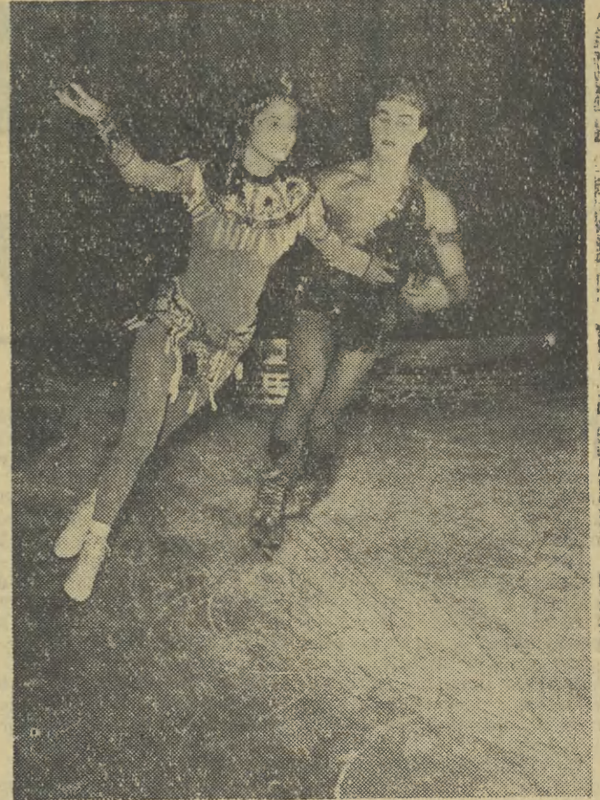
Do Krakowa przyjeżdża zespół budapeszteński rewiu na lodzie, który wystąpi dnia 11, 12 i 13 bm. w hali Wisły (godz. 19.30).

Koszeniem blisko 100 tys. zł w Czarnocochowicach wykonnano szereg prac związanych z otwarciem boiska sportowego dla tamtejszego LZS.