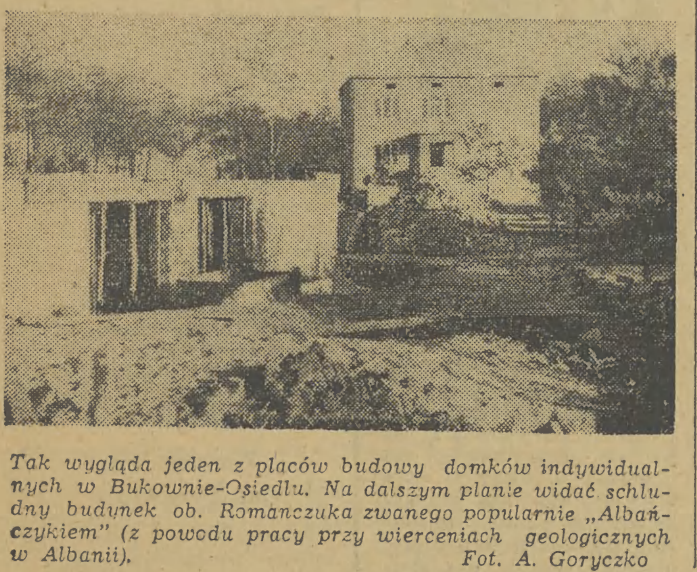
Tak wygląda jeden z placów budowy domków indywidualnych w Bukownie-Osiedlu. Na dalszym planie widać schudniętego budynku ob. Romanczuka zwanego popularnie „Albą” (z powodu pracy przy wierceniach geologicznych w Albanii).

— Wydatki te są niemałe. Sięgają bowiem 13 mln zł.