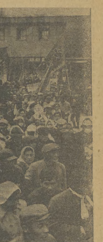
By rozwiązać chęć częściejowa poważy problem bezrobocia w Japonii, bezrobotnych zatrudnia się jako pracowników sezonowych w ramach ustawy o pomocy dla bezrobotnych.

(AR) W związku z 80-leciem wyzwolenia Bułgarii spod jarzma tureckiego, czolowy bułgarski Teatr Narodowy im. Sarafowa wystawi nową dramatyzację powieści największego bułgarskiego pisarza, Iwana Wazowa pt. „Pod jarzmem”.