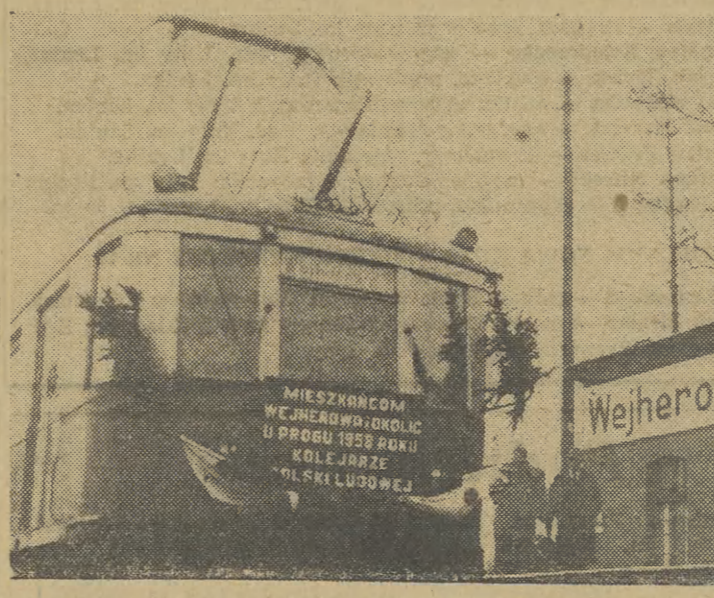
30 grudnia otwarta została nowa linia kolei elektrycznej Gdynia—Chylonia—Wejherowo. Tym samym zakończony został ostatni etap elektryfikacji Trójmiasta.

Na zdjęciu: Pierwszy pociąg elektryczny na stacji Wejherowo.