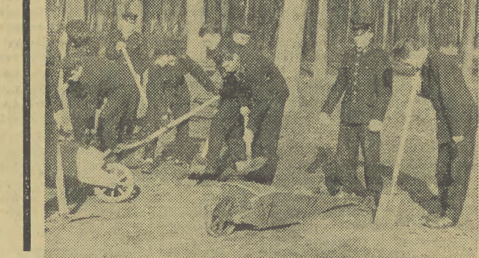
Text i fot. zap