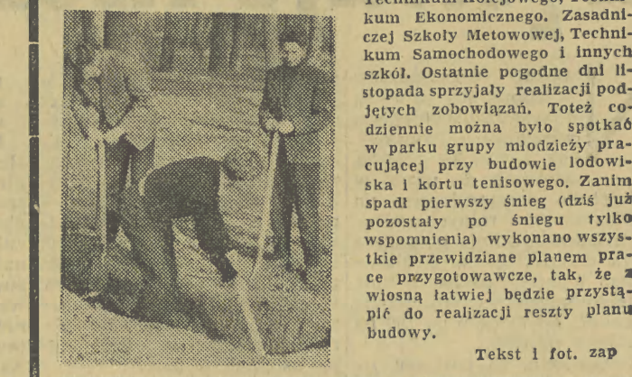
Text i fot. zap

Niedawno informowaliśmy, że organizacja ZMS-owska w Nowym Sączu zobowiązała się doprowadzić do porządku tzw. Park Strzelecki nad Dunajcem i przekształcić go w młodzieżowy park kultury. W ślad za zobowiązaniem poszły czyny. Na apel Komitetu Powiatowego skierowany w tej sprawie do młodzieży szkół nowosądeckich, pierwsze odpowiedzialne szkolne grupy działania ZMS. Przepię wszystkim powołaną pomoc zadeklarowała młodzież sądeckich szkół zawodowych: Technikum Łączności, Technikum Kolejowego, Technikum Ekonomicznego. Zasadniczej Szkoły Metalowej, Technikum Samochodowego i innych szkół. Ostatnie pogodnie dni listopada sprzyjały realizacji podjętych zobowiązań. Toteż codziennie można było spotkać w parku grupy młodzieży pracującej przy budowie lodowiska i kortu tenisowego. Zanim spadł pierwszy śnieg (długo już pozostały po śniegu tylko wspomnienia) wykonano wszystkie przewidziane planem prace przygotowawcze, tak, że wiosną latwiej będzie przystąpić do realizacji reszty planu budowy.